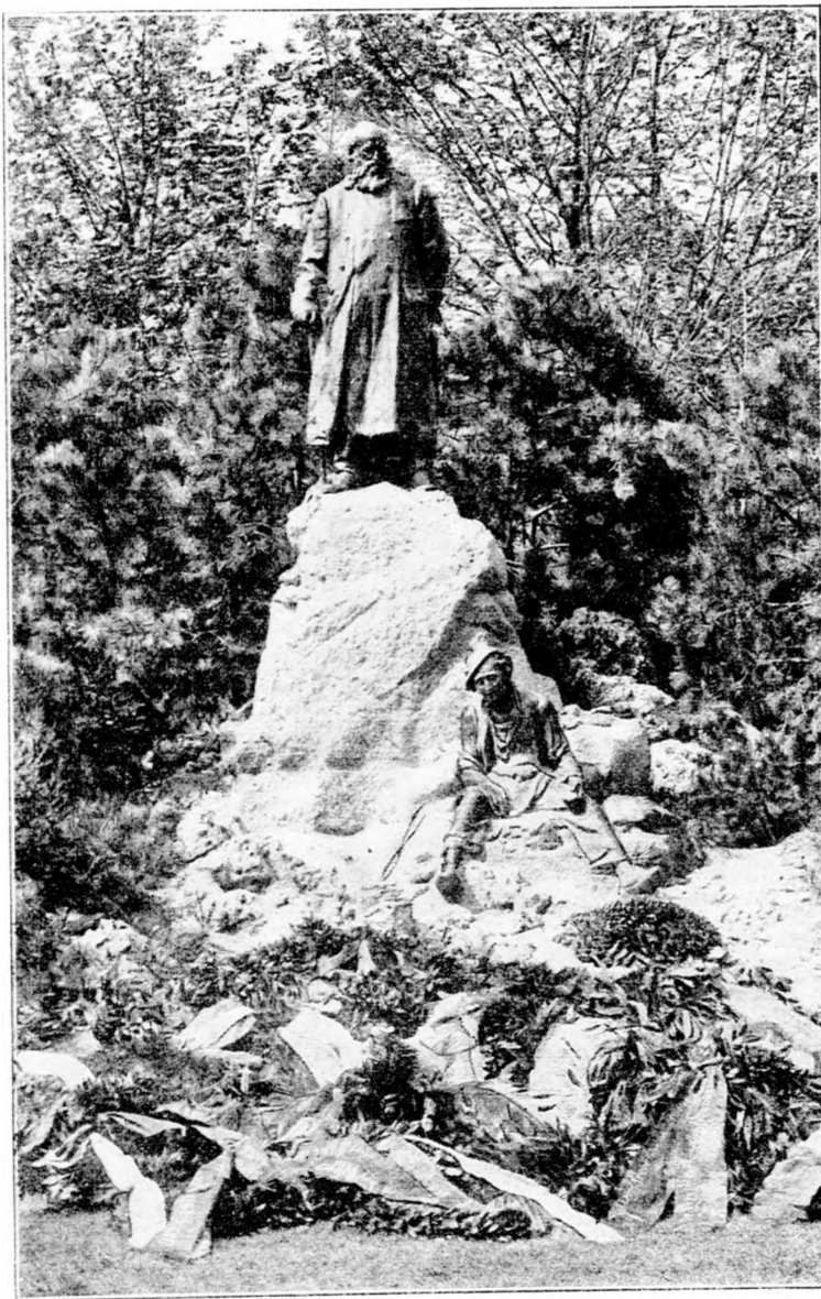
Das Anzengruber-Denkmal in Wien. (Mit Text.) Entworfen von Hans Scherpe.

„D, dann ist das große Gebäude dort wohl das alte, historische Schloss?“ ruft der junge Mann lebhaft; dann, ohne eine Antwort abzuwarten, wendet er sich voll Interesse dem altertümlichen