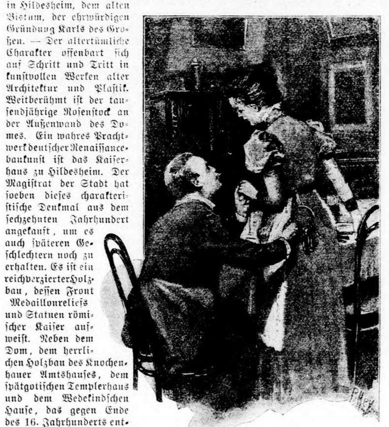
Entgegenkommend. „Weißt du, Schöndchen, das Schlüsselbund wird für dich eine Last — gib mir den schweren davon zu tragen!“

Sammlung, die den meisten Eisenmeteoriten eigen ist. Der Mod ist 11 1/2 Fuß lang, 7 Fuß breit und 6 Fuß hoch; sein Gewicht beträgt 750 Zentner. Das Kaiserhaus in Hildesheim. Romanische Kunst und der deutsche Fachwerkbau der Spätgotik und der Renaissance haben eine ihrer Hauptstätten in Hildesheim, dem alten Bietum, der ehrwürdigen Gründung Karls des Großen. — Der altromanische Charakter offenbart sich auf Schritt und Tritt in kunstvollen Werken alter Architektur und Plastik. Weitberühmt ist der tausendjährige Holentrost an der Außenwand des Domes. Ein wahres Prachtwerk deutscher Renaissancebaukunst ist das Kaiserhaus zu Hildesheim. Der Magistrat der Stadt hat soeben dieses charakteristische Denkmal aus dem sechzehnten Jahrhundert angekauft, um es auch späteren Geschlechtern noch zu erhalten. Es ist ein reichverzierter Holzbau, dessen Front Medaillonreliefs und Statuen römischer Kaiser aufweist. Neben dem Dom, dem herrlichen Holzbau des Knochenhauer Amtshauses, dem spätgotischen Tempelhaus und dem Weckendischen Hause, das gegen Ende des 16. Jahrhunderts entstanden ist, bildet das Kaiserhaus, dessen Bild wir vorstehend bringen, den Stolz Hildesheims.