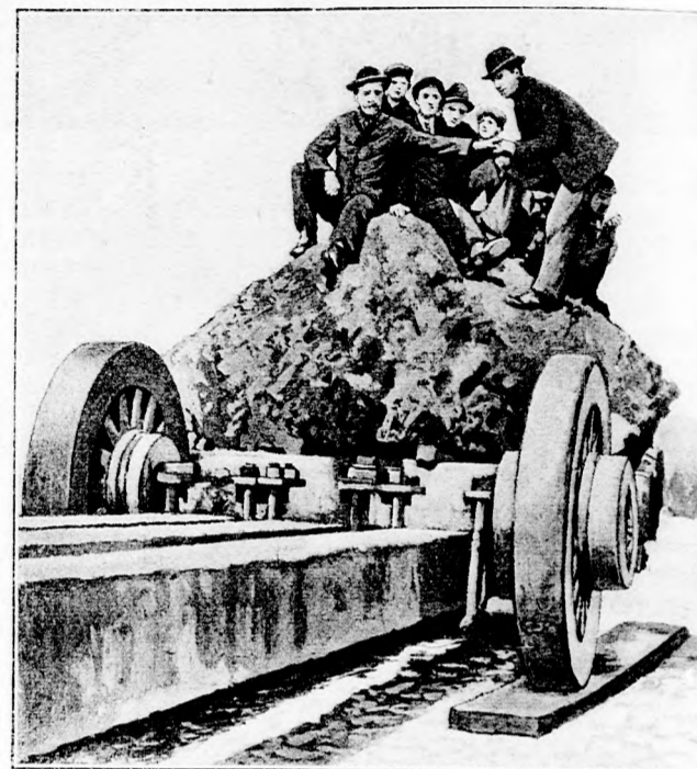
Niesenmeteorstein, gefunden von Leutnant Peary in Grönland. (Mit Text.)

Er lacht übermütig. „O, ein lustiges Abenteuer, von dem ich