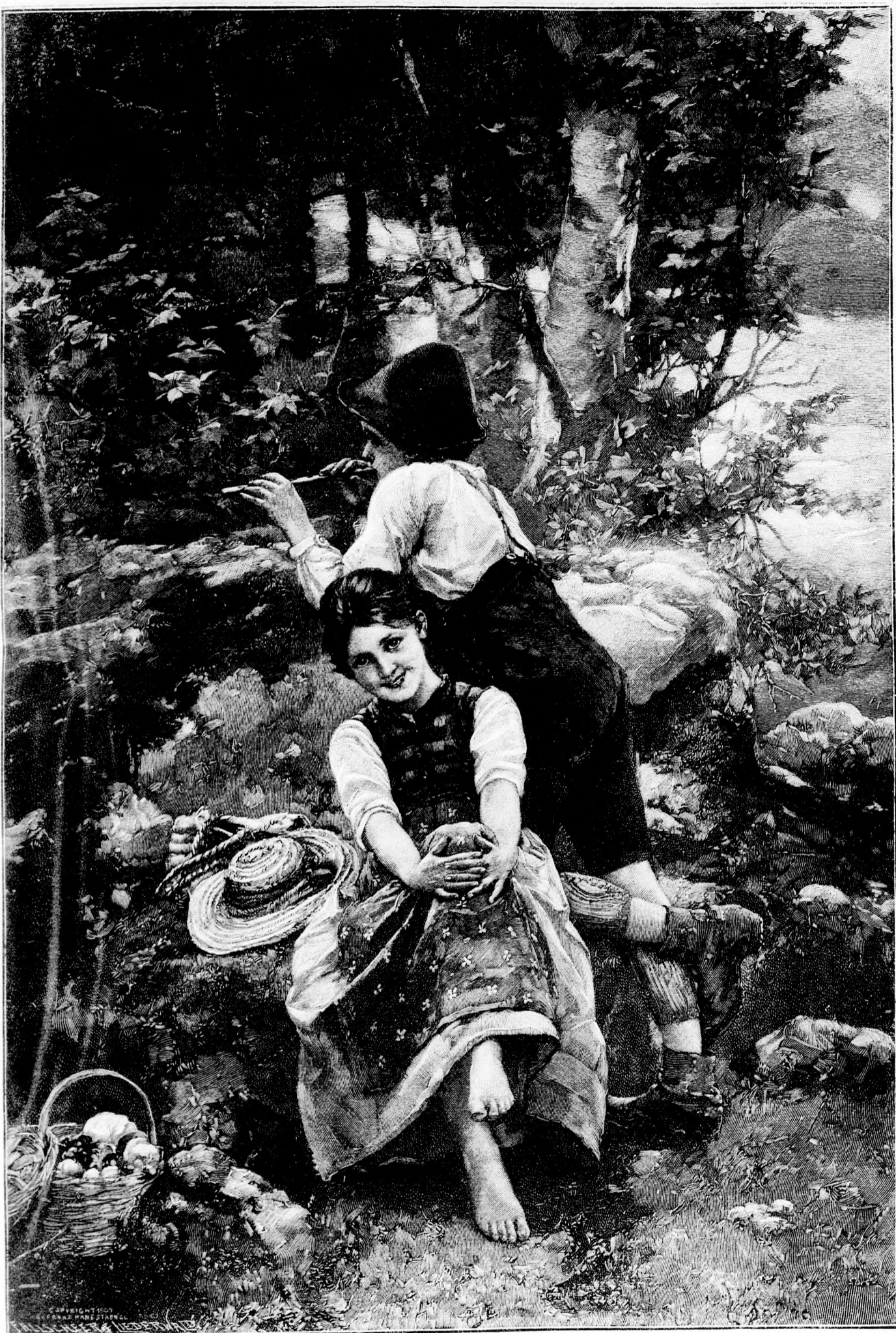
Das Lieblingslied. Nach dem Gemälde von P. Wagner. (Mit Text.)