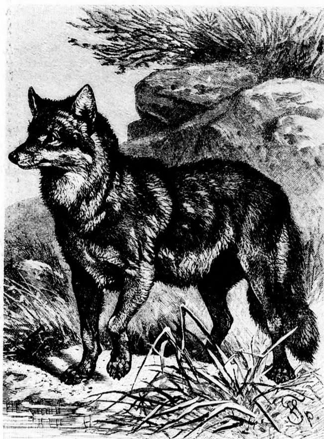
Der Heutwolf (Canis latrans). (Mit Text.)

„Theo!“ wiederholt der Onkel langsam. „Steht es so?“ Und auf einmal weich werdend, haucht er nach der Hand des jungen Mädchens. „Armes Kind! Ein Wunder ist es nicht, wenn du dich umgarnen ließeßt, seine einschmeichelnden Manieren — und den Eindruck eines feinen Mannes machte er auch —“