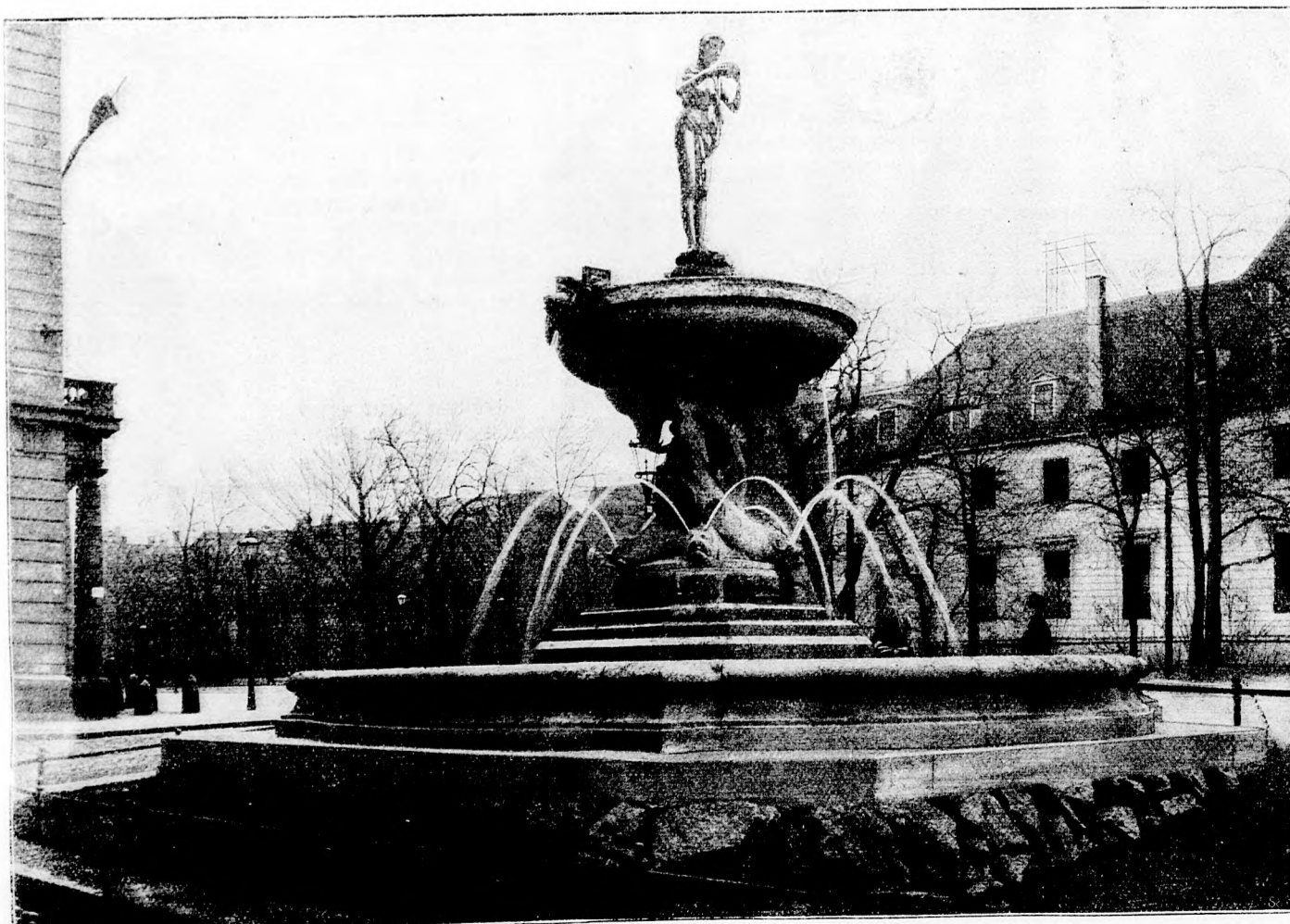
Der neue Brunnen in Leipzig, gegenüber dem alten Theater. Von Max Unger, Berlin. (Mit Text.)

lichen Beruf hatte mein Freund nicht, mehr zu seinem Vergnügen hatte er Jura studiert und sein Referendar- und Doktorexamen gemacht, sich aber dann nur noch der Verwaltung seiner ererbten Güter und Fabriken gewidmet, doch nur so lange, bis er geeignete