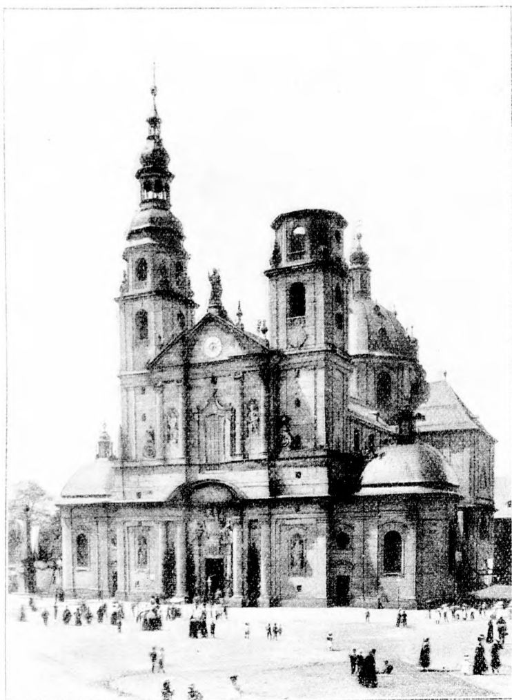
Der Dom in Jula nach dem Darmbrand. (Mit Text.)

„Beate — ich,“ ächzte er. „Was hast du, Hans?“ fragte sie liebevoll. „Nichts — nichts — Beate...“ „Aber du bist so eigentümlich!“ sagte sie besorgt. „Mir ist nichts, Beate! Aber sage mir,“ und er zog sie leidenschaftlich an sich und sah ihr tief in die Augen, „sage mir, glaubst du wirklich, daß ich nicht schlecht bin?“ „Glaubte ich etwas anderes, Hans, so würde ich nicht mit dir hier.“ Da wurde seine Stimme weich; bittend wie ein Kind sah er sie an und flüsterte: „Glaube an mich, Beate!“ „Ich glaube an dich, Hans!“ Und still ward's, und ein Kuß besiegelte das Gelöbniß. Wählich hörte man eine Glocke in einiger Entfernung. Beate wagte sich los. „Es ist die Tischglocke aus Kloster Heidhaus!“ sagte sie. „Ich muß zu Tisch!“ „Ich komme am Nachmittag zu euch,“ entgegnete Hans Joachim. „Bis dahin lebe wohl, du einzige Geliebte!“