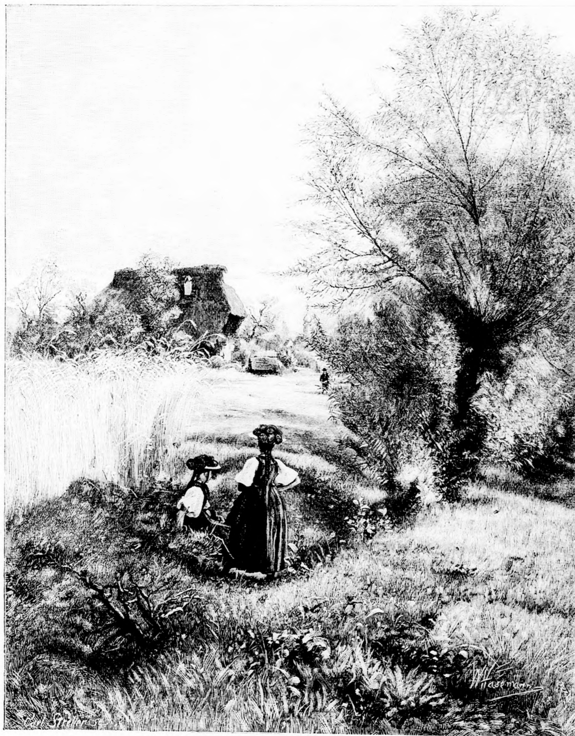
Idyll. Nach dem Gemälde von W. Hasemann. (Mit Text.)

den scheinbaren Beruhigungen, welche das Wiesbadener Bad bot, als an den langweiligen und zeitraubenden Kurvorschriften fand. — Auf höheren Wunsch wurde ihm deshalb eines Tages vom Leibärzte sehr dringend geraten, die Thermen eines alpinen Wildbades zu gebrauchen, dessen weitabgechiedene Lage meinen Prinzen mit Grausen erfüllte und zu lebhaftem Protest veranlaßte. — Eine lange Epistel seines Vaters, in welcher der alte, spanische Herr seinem leichtfertigen Sprößling sehr energisch erklärte, daß er nicht geheimer sei, noch länger derartig hohe Kurkosten zu zahlen, machte ihn gefügig, und, da zufällig ein Jugendfreund von mir sich in dem „üden Foch M.“ angelassen hatte, wurde ich beauftragt, mit dessen Hilfe eine standesgemäße Wohnung ausfindig zu machen. Auf meine briefliche Anfrage erhielt ich den umgebenden Bescheid, daß eine kleine Villa in unmittelbarer