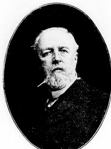
König Oscar von Schweden. (Mit Text.)

Ich, für meine Person, hatte noch am wenigsten unter der Langlei zu leiden, weil ich während der Zeit, wo mein Gebieter badete