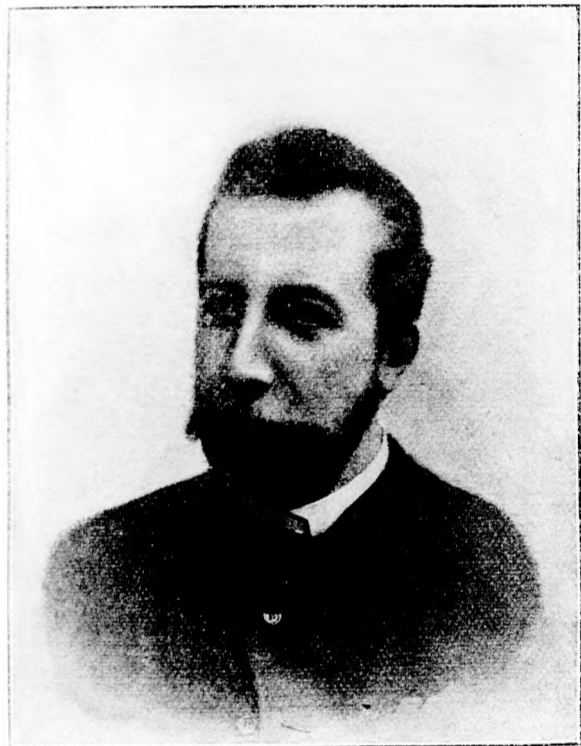
Christian Michelsen, der provisorische Leiter der norwegischen Regierung. (Mit Text.)

unbeschreiblichen Verfassung, die Beleuchtung derselben derartig, daß, wollte man abends ausgehen und nicht seine gesunden Glieder riskieren, die Mitnahme einer Handlaterne zur unabweisbaren Pflicht wurde.