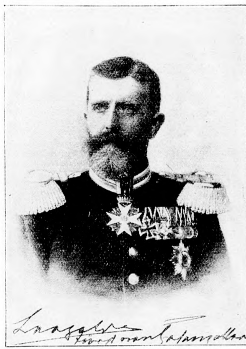
Leopold, Fürst von Hohenzollern. (Mit Text.)

Fürst Leopold von Hohenzollern ist am 8. Juni in Berlin, wo er den Hochzeitsfeierlichkeiten beige- wohnt hatte, unerwartet rasch gestorben. Mit ihm ist ein Mann dahingegangen, dessen Name einst in der ganzen Welt genannt wurde, als ihm im Jahre 1870 die Spanier ihren verwaisten Königsthron an- geboten hatten und Frankreich gegen seine Kandida- tur Einspruch erhob, um einen Vorwand zum Kriege mit Preußen zu finden, der dann trotz der Verzicht- leistung des Fürsten auch zum Ausbruche kam. Fürst Leopold war als Sohn des Fürsten Karl Anton zu Krauchenwies am 22. September 1835 geboren, hat somit ein Alter von fast Neunzig Jahren erreicht. Er war vierzehn Jahre alt, als das Fürstentum Hohen- zollern an die Krone Preußen überging. Mit sechs- zehn Jahren trat der junge Erbprinz in die preussische Armee ein, der er mehr als dreißig Jahre angehört hat. Den Krieg von 1866 machte er als Oberleutnant, den von 1870/71 als Oberst im Stab des Oberkommandos der von Kronprinz Friedrich Wilhelm befehligten Armee mit, 1885 folgte er seinem Vater als Chef des fürstlichen Regiments Hohenzollern, als der er in Sigmaringen residierte. Zu seinem fünfzigjährigen Militär- jubiläum wurde er von Kaiser Wilhelm zum Generaloberst ernannt. Seit 1861 war der Fürst mit der Infantin Antonia von Portugal vermählt.