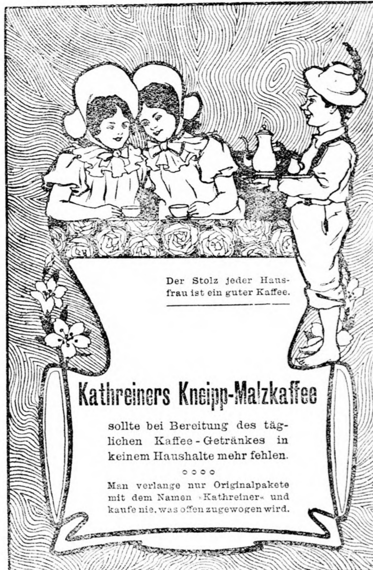
Der Stolz jeder Hausfrau ist ein guter Kaffee.

Behörden für alle Zweige der Tonkunst, incl. Oper und Operette. Jährlich 350 Frequentanten aus dem In- und Auslande. — Staatsprüfungscurs (October—April), Ferial-Curse (Juli—September) — 126 Candidaten der Anstalt haben die k. k. Staatsprüfung abgelegt, zum Theil „mit Auszeichnung“. — Künstler-Curse. — Specialcurse für Clavierlehrer. — Kapellmeistercurse (den Candidaten ist Gelegenheit zur Uebung im Dirigiren geboten). — Arbeitscurse für brüch. theoretischen Unterricht. — Gemischter Chor, Orchester, Concerte, Opern- und Operetten-Aufführungen, Zeugnisse. — Saubere Lehrkräfte: — Gemischter Chor, Director Friedrich Materna, Hofa Streitmann, f. und k. Kammerdirigenten Franz Ondricek, Dr. M. Dietz, Univ.-Docent und Mitglied der k. k. Musikprüfungs-Commission, Max Jentsch, Ludw. Kaiser, Wilh. Prauner, Director K. Kaiser u. — Prospecte, sowie jede Auskunft durch die Kanzlei: Wien, VII, Zieglergasse 29. — Auswärtigen Nachweis ihrer Pension in vertrauenswürdigsten Familien. (873) 3-3