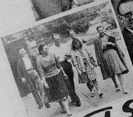
Cserépy és a szereplők indulnak a felvételhez