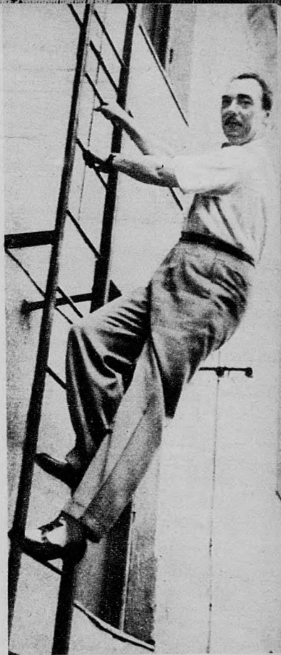
Testedzés két felvonás között a tűzoltólétrán

— Így nem is nagyon pihenhet — sajnálkozunk őszintén.