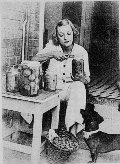
Egy kis betőzés

— Véletlenül. Kis esatást akartam elkövetni. Szerettem volna, ha úgy fest a hajam, mintha a nap kicsit kiszívalta volna. Egyik