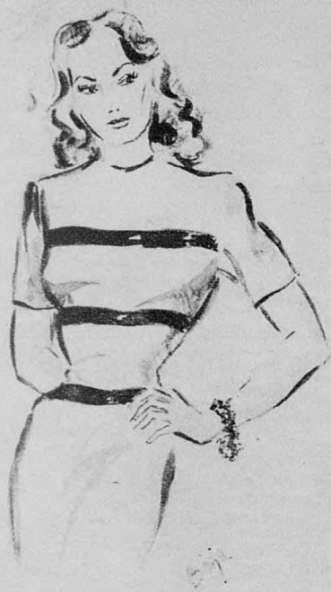
Egészen sima, könnyű szövetruha elütő színű esikozással