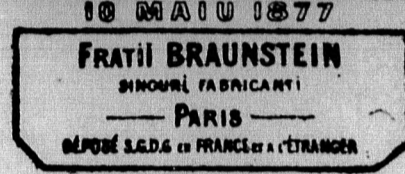
Papier Hygienique extra fin C. Braunstein

Guter Rat ist Goldes wert! Die Wahrheit dieser Worte lernt man besonders in Krankheitsfällen kennen und darum erhielt Richters Verlags-Anstalt die herzlichsten Dankschreiben für Zusendung des kleinen illustrierten Buches „Der Krankenfreund“. In demselben wird eine Anzahl der besten und bewährtesten Hausmittel ausführlich beschrieben und gleichzeitig durch beigedruckte Berichte glücklich Geheilte bewiesen, daß sehr oft einfache Hausmittel genügen, um selbst eine scheinbar unheilbare Krankheit in kurzer Zeit geheilt zu sehen. Wenn dem Kranken nur das richtige Mittel zu Gebote steht, dann ist sogar bei schwerem Leid noch Heilung zu erwarten, weshalb kein Kranker veräunnen sollte, mit Correspondenzkarte von Richters Verlags-Anstalt in Leipzig einen „Krankenfreund“ zu verlangen. In Hand dieses lehrreichen Buches wird er viel leichter eine richtige Wahl treffen können. Durch die Anwendung erwachsen dem Besteller keinerlei Kosten.