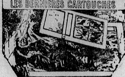
BRAUNSTEIN FRÈRES, PARIS Marque Déposée. S. G. D. G.

Ezen, minden cigarettázóra nézve nagyon fontos kérdés már a legkétségtelenebb módon bebizonyult. Nem üres reklám , hanem elsőrendű tudományos személyiségek által összehasonlított vegyelemzések alapján a forgalomban előforduló jobb minőségű cigarettapapirok között a