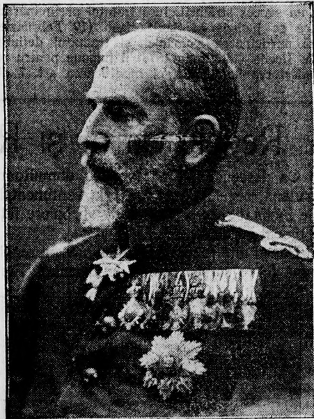
MAJ, SA REGELE CAROL I.

Acum regele Carol e mort. Noi îl deplângem cu sinceră durere și amarul nostru se potențiază prin simțul nesiguranței ce ne încearcă știindu-l mort pe El, întruparea înțelepciunii.