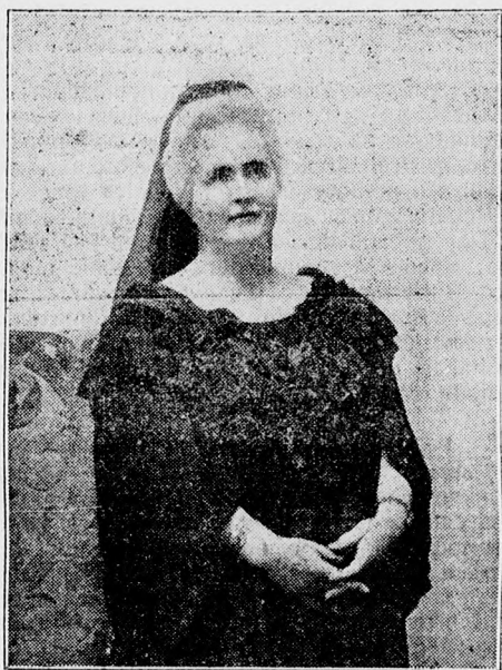
MAJ. SA REGINA ELISABETA.

A regulat politica externă a României, aproape este numai creația sa și a fost cel mai constant și mai neobosit îndrumător al ei. Cu