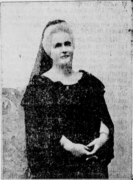
MAJ. SA REGINA ELISABETA A ROMÂNIEI.

Fără a face un joc de cuvinte Ea a fost nu numai, mama lor, ci și mana lor cerească!