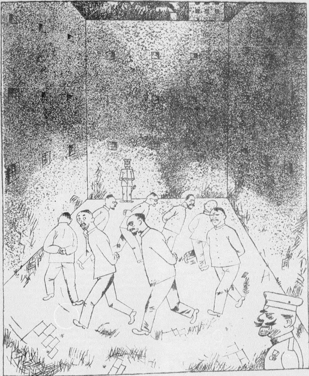
Georg Grosz: Rajz