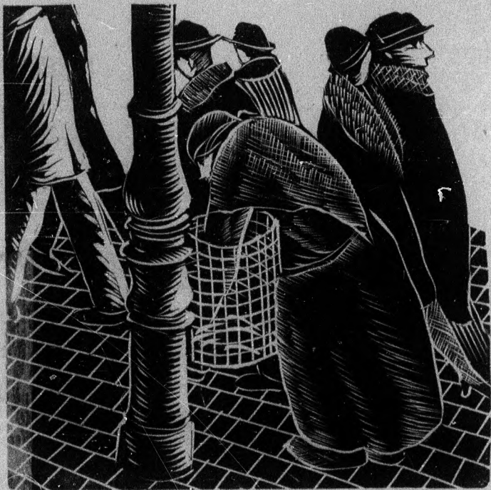
Otto Rudolf Schatz fametszete

szocialista társadalmi és művészeti beszámoló szerkeszti: kassák lajos budapest lehel-utca 6