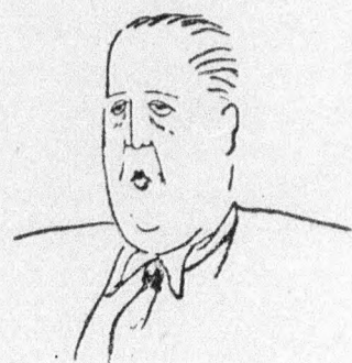
MÁRAI SÁNDOR PORTRÉJA

Márai legújabb könyve a Napnyugati örjárat , az én-regény (majdnem riportázs) újjáalakításának szép példája, magában foglalja a műfaj minden erényét és hibáját. Kissé furcsa hogy a forradalmi időket követő letisztulási folyamatban Márai megint riportot írt, helyesebben egy újabb önvallomással lepte meg olvasóit. Kétségtelen, hogy ez a műfaj korunk leghálásabb irodalmi formája de nem hiszem, hogy Márai a divatnak hódolva, a könnyebbség kedvéért választaná e formát s a vele ellentétes, részletekig cizellált stílust. Inkább vélem, valami mély pszichológiai ellentmondás osztja így ketté irodalmi munkásságát. Meg kellene közelebbről vizsgálnunk, hogy milyen is Márai viszonya az emberekhez? Ezt a viszonyt kellene tisztán meghatároznunk — az író úgy érzi: ő inkább a társadalom felett áll, sem mint a közösséghez tartozna. Ám ez a beállítottság állandó belső nyugtalanságot eredményez és kiegyensúlyozatlanná teszi Márai művészetét. Aki embernek született az nem vonhatja ki magát az emberi közösségből és aki ezt megteszi, annak a számára lehetetlenné válik az élet. Askenasi Viktor Henriknek ugyanúgy el kell buknia a Sziget című regényben, mint Greiner Imrének, a másik regényhősnek. De a bukásuk nem sors-