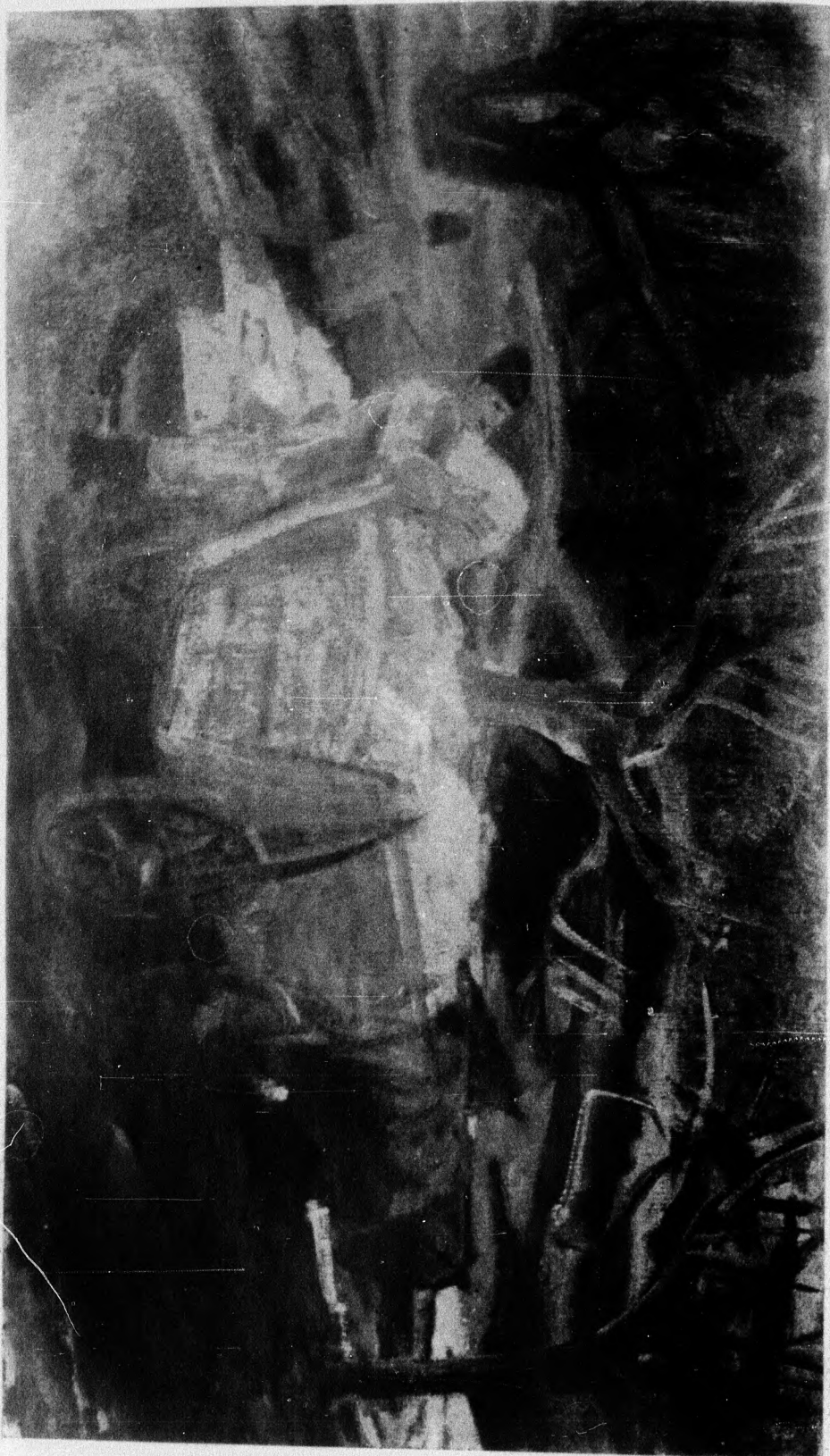
Berény Róbert : Jégrakodók