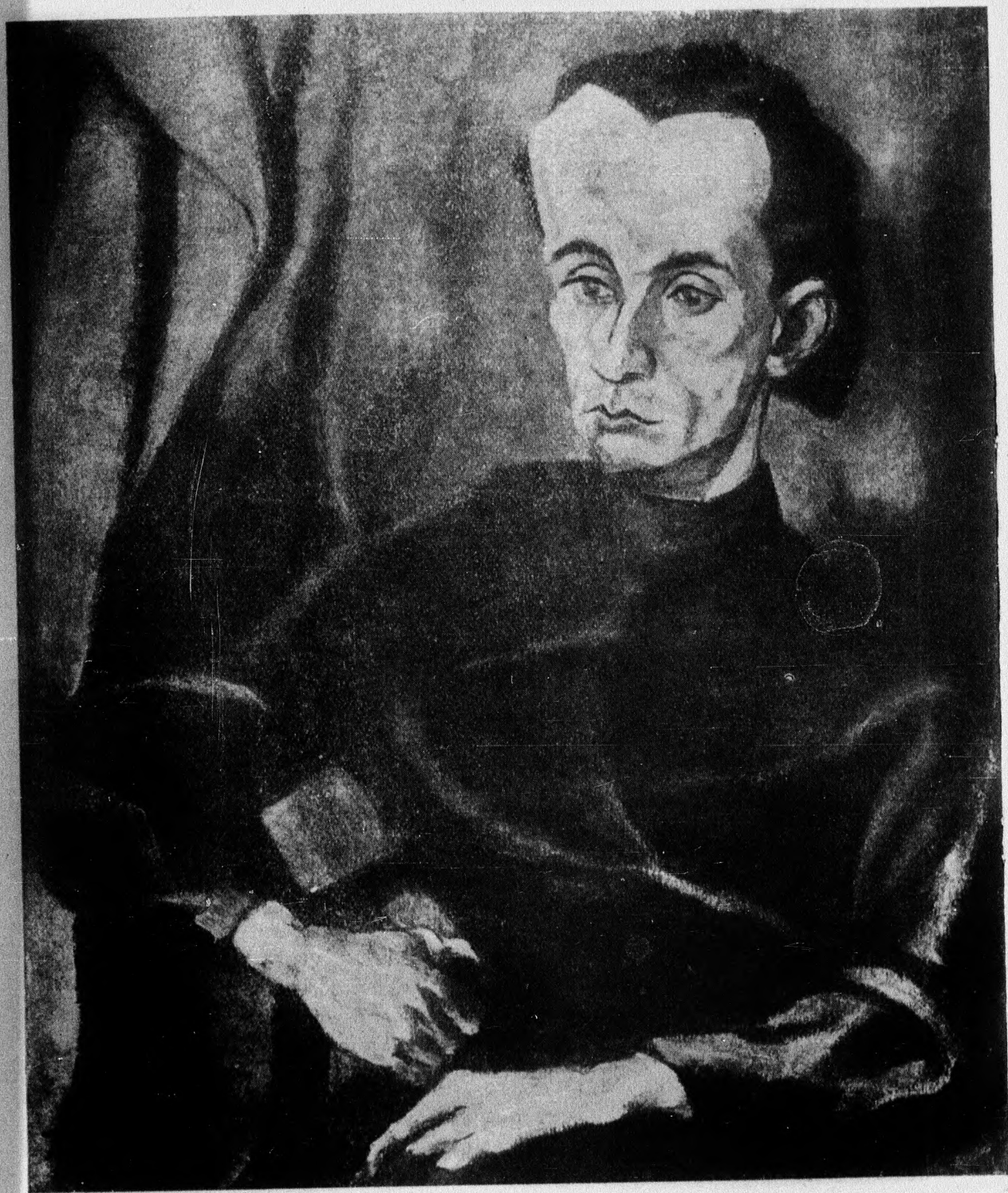
Tihanyi Lajos : Kassák Lajos portr