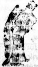
Az emulsió vásárlásánál a SCOTT-féle módszer védjegyét — a halászt — kérjük figyelmebe venni.

Egy eredeti üveg ára 2 K. 50 fillér. Kapható minden gyógytárban.