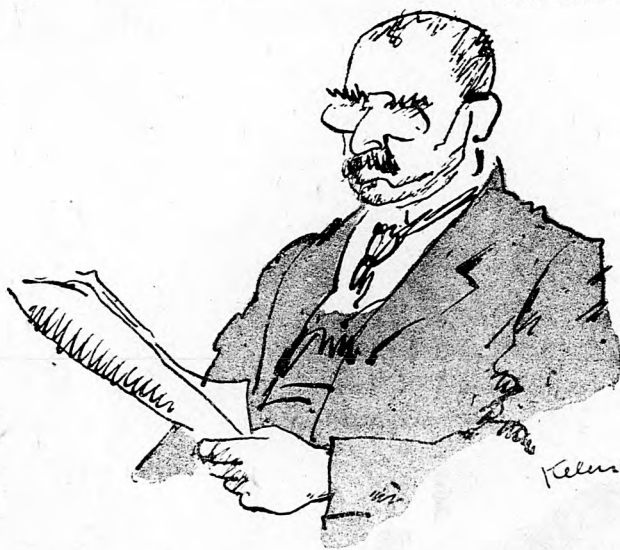
Kelen Imre rajza

— Az Isten már a papokra is haragszik. Azoknak is megengedi, hogy nősüljenek.