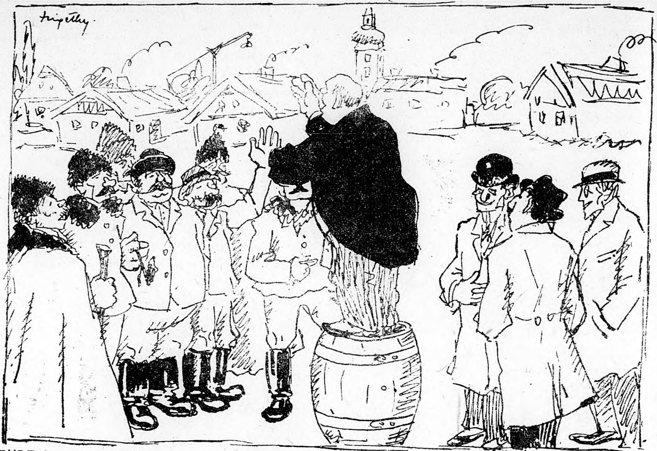
FÖLDOSZTÁS. (Egy rosszmájú megjegyzés).