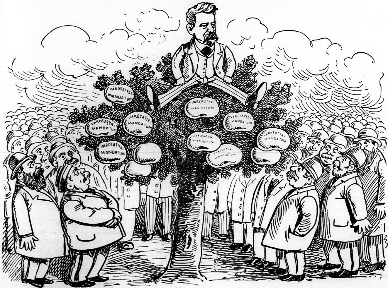
Városatyajelöltek chorusa : Piezi piros alma, jaj be nagyon gyönyörű. . . .