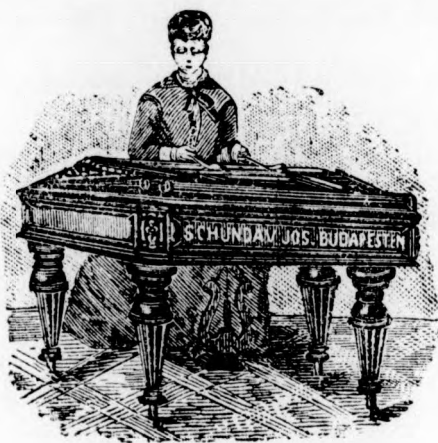
Cs. és kir. szab. udvari hangszer-gyár

Páholy: Földszinti vagy I. emeleti 10 frt — Másodemeleti 7 frt — Erkélyszék 1 frt 50 kr. — Támlásszék földszint: Az I.—V. sorban 2 frt 50 A VI—XII sorban 2 frt. — A XIII—XX. sorban 1 frt 50. — Zártszék a II. emeleten: Az I. sorban 1 frt 20. — A II. sorban 1 frt — A III. sorban 1 frt. — Zártszék a III. emeleten: Az I. sorban 80 kr — A II. sorban 60 kr. — A III. sorban 40 kr.