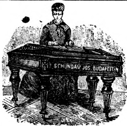
Cs. és kir. szab. udvari hangszer-gyár

tóber 2-án Triesztbe utazik. — Alb- recht főherceg a németországi had- gyakorlatokról ma érkezett meg Ba- denba. — II. Vilmos császár szeptember 27-én érkezik Stuttgartba, honnan 30-án indul Münchenbe és október 2-án kel bécsi útjára. — A walesi herceg ma reggel érkezett meg Bécsbe. Miskolczra október 1-én déli 12 óra 12 perczkor érkezik meg s éjjel 1 óra 9 perczkor tovább uta- zik. — Coburg Klementina hercegnő Bécsből ma Bulgáriába utazott, hol huzamos ideig lesz fia, a fejedelem vendége.