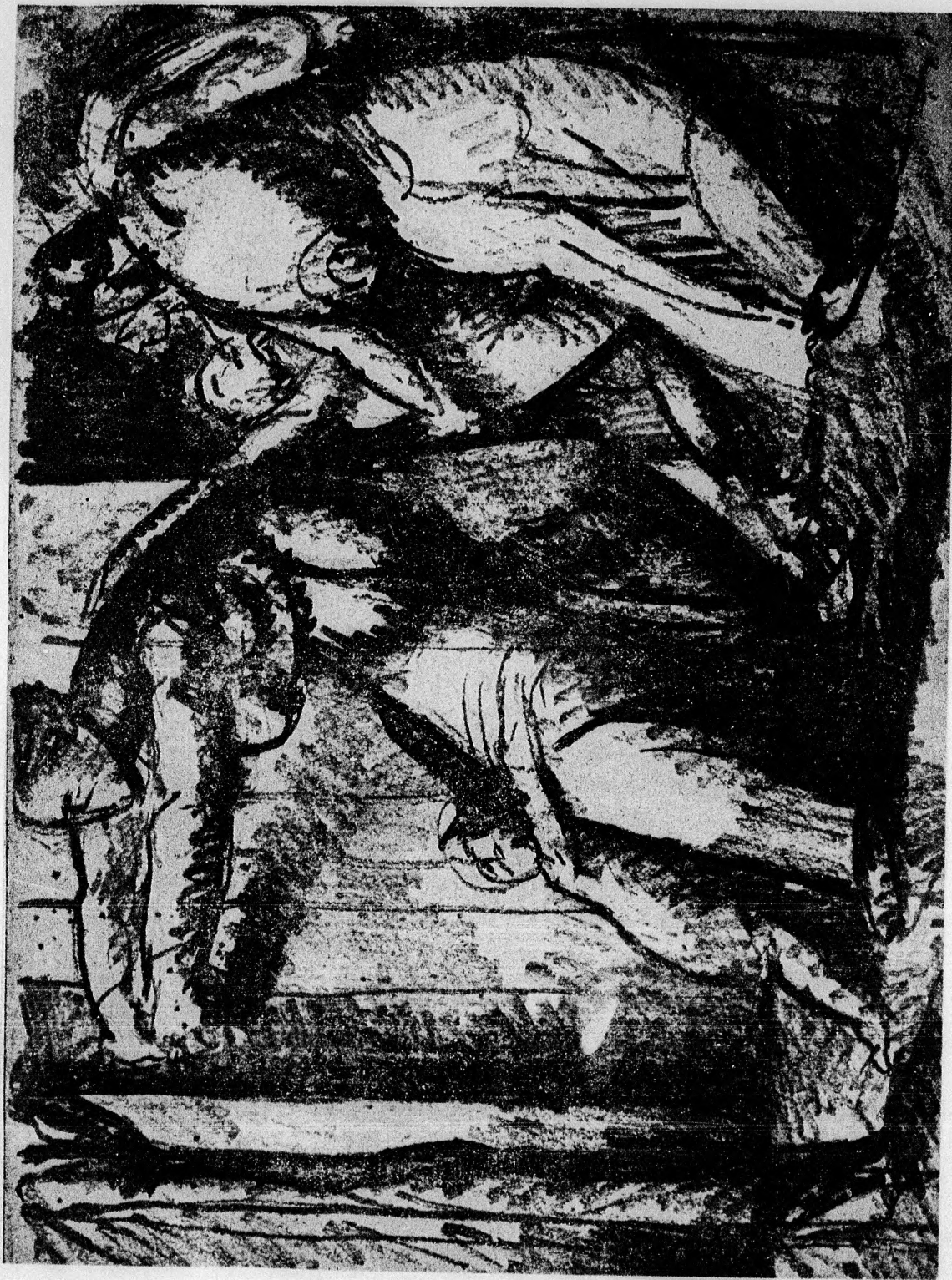
Uitz Béla: Tusrajz (Főváros tulajdona).