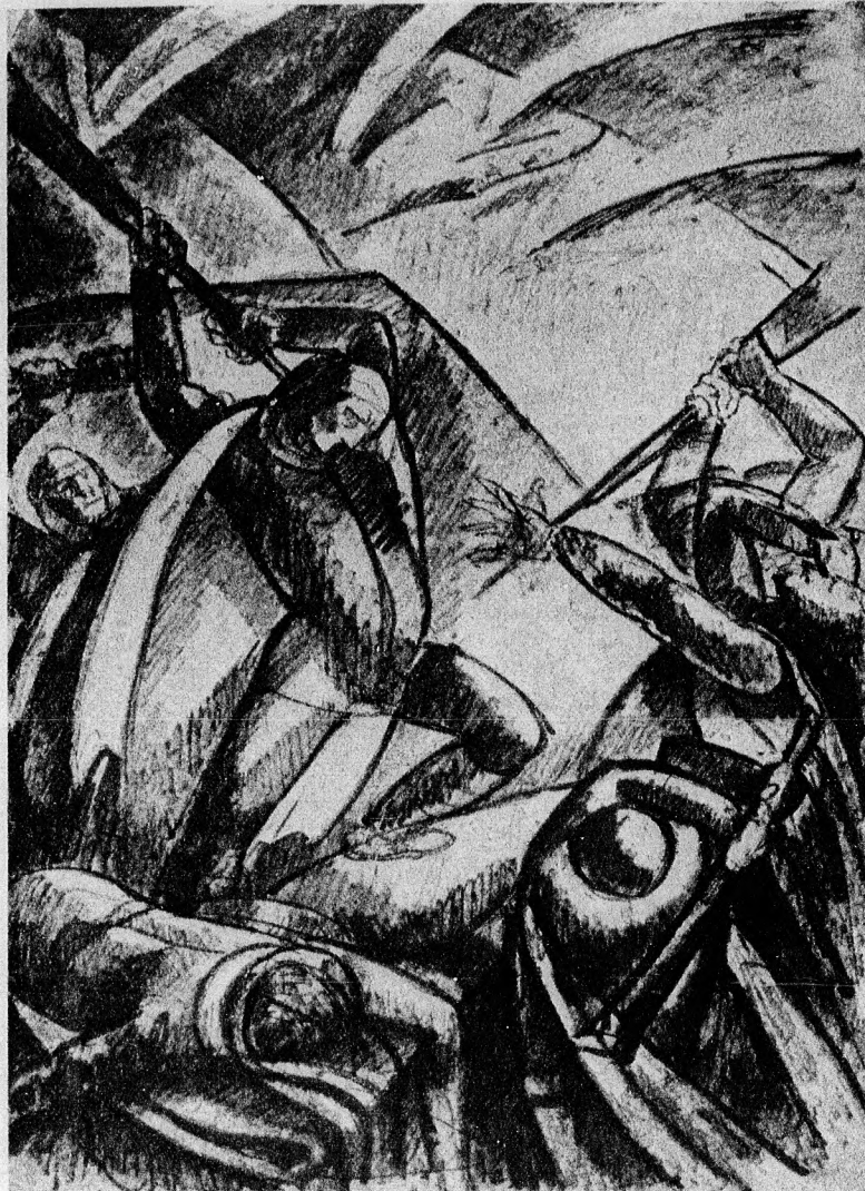
Uitz Béla: Tusraiz