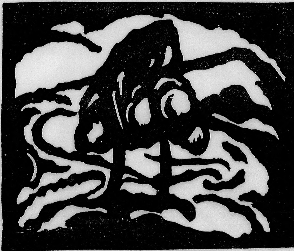
Mátis Teutsch János: Eredeti linoleummetszet