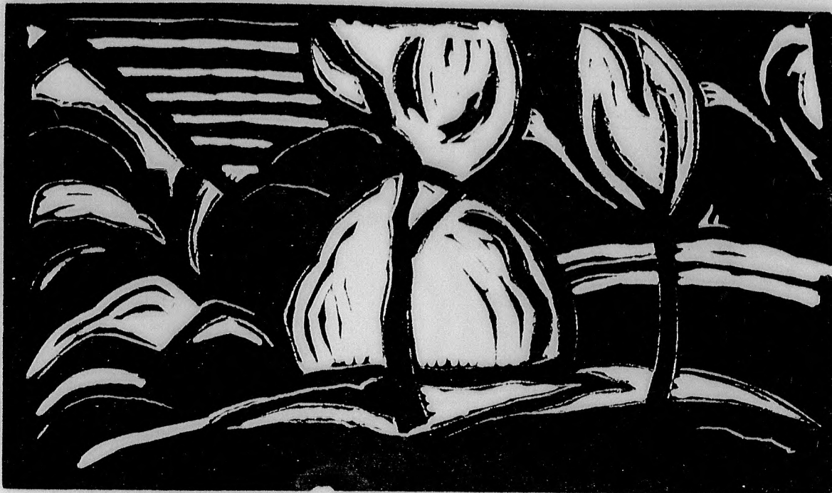
Mátis Teutsch János: Eredeti linoleummetszet