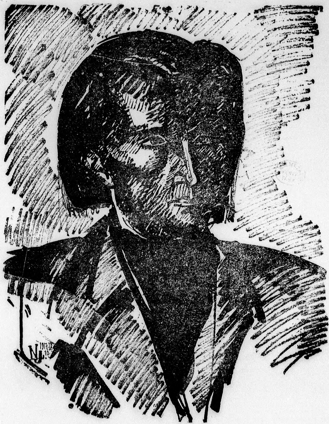
Nemes Lampérth József: Kassák Lajos portréja (Tussrajz)