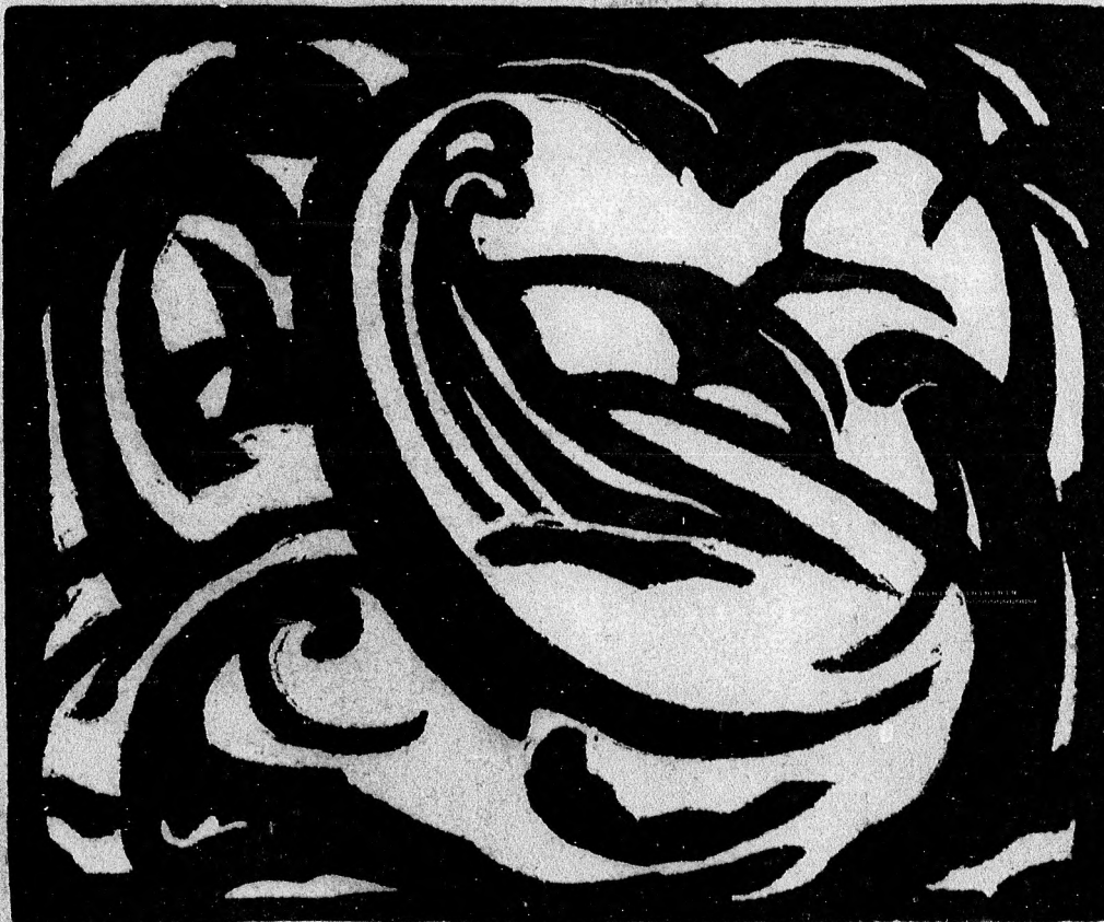
MATTIS TEUTSCH JÁNOS: LINOLEUM-METSZET