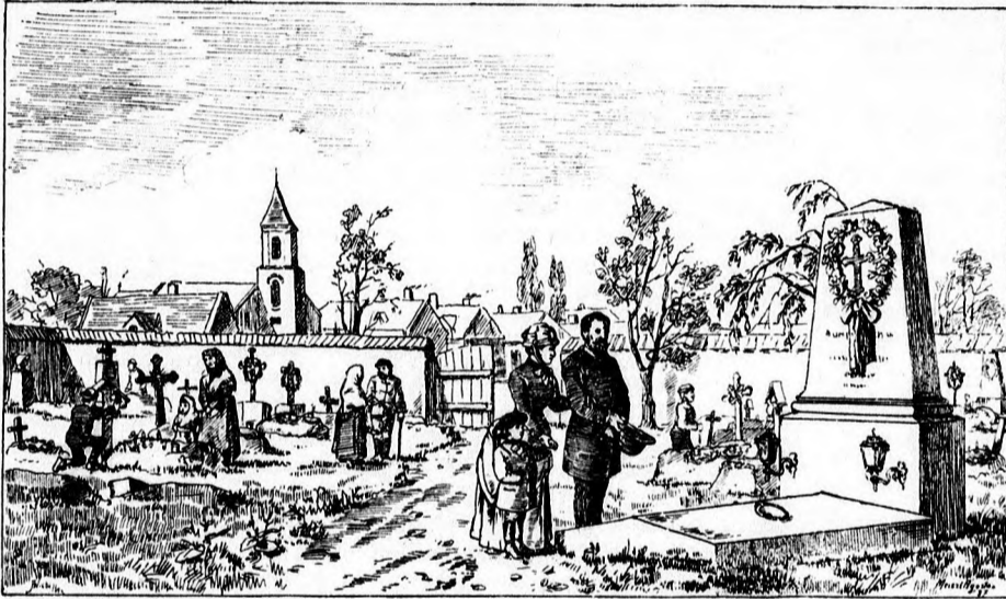
HALOTTAK NAPJÁN. (Szövegét lásd a távezében.)

tiszta, erényes érzelmek honolnak, — de Isottánál nem volt meg ez. — A természet békéje, a szüretől hazatérő paraszt nők éneke, a kik a tavon lassan tova sikamló csónakokon eveztek, neki is eszébe juttaták ugyan a nyugodtabb gondolatokat, ifjú korának napjait. Eszébe jutott az idő, a mikor még mint ártatlan leányka, ama virányokon, a hol az Adda a Póval összefoly, a megerősített Piz-zighetone és a tornyokkal koszorúzott Cremona között rejtekben és szegénységben csendes gondtalan életet élt. Eszébe jutott a szelid atya, anya és a nővér szeretete, a zavartalan békében átélt napok, az esti ima, melyet édes álm követett. Azután hirtelen lelki szemei előtt állt a nap, a melyen Lucillo, Stanga marchesino fia, egészen ama vidékig jutott zajos vadászás közben, s az éj által meglepetve, atyja házában szállást kért. És az a nap volt utolsó nyugodt napja. A nemes értett ahoz, miként lehet a nők tetszését megnyerni; Isotta pedig vigyázatlan volt, s az apai intések nem voltak képesek a szívéken sarjadoszó büszkeséget gyökerestül kiirtani. A nemes szerelemről beszélt, ő elől szédítve, és ártatlanságának vége volt. — A paraszt leány a cremonai paloták csodált és ünnevelt hölgyévé lön.