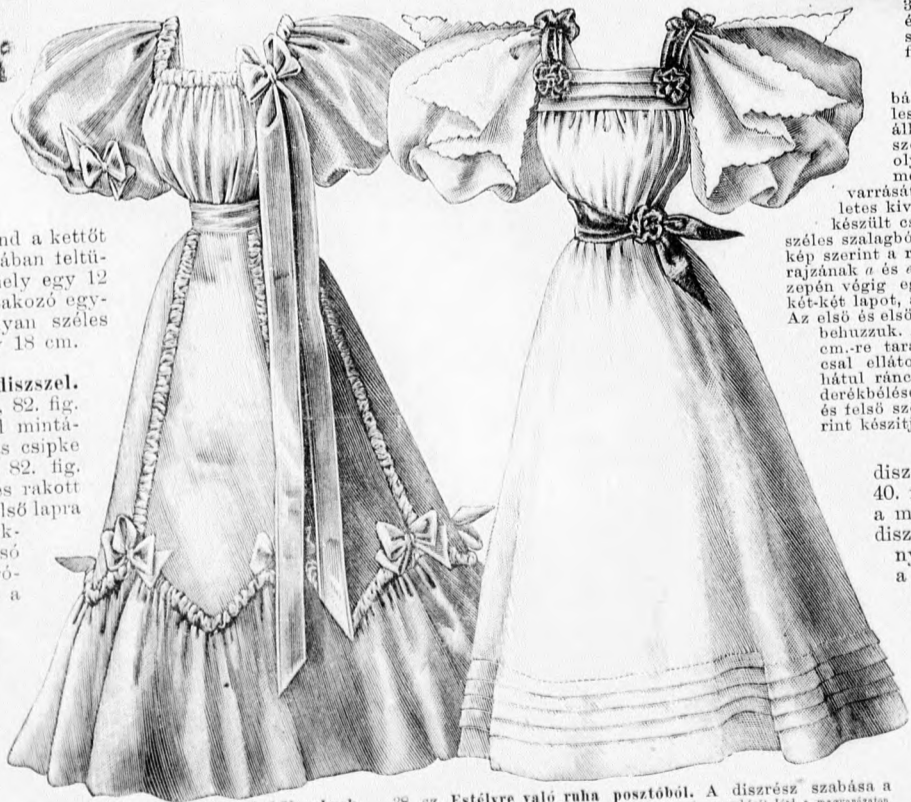
37. sz. Estélyre való ruha fiatal hölgyeknek. Szab.: a minta-iv V. sz., 32-39. fig.

28. sz. Köpeny alátoldott előrészekkel idős hölgyeknek. A köpeny háta, visszája és szabása: a minta-iv X. sz., 63-67b. fig. A végig tarkán csikozott bársonnyal bélelt fekete bongyor-