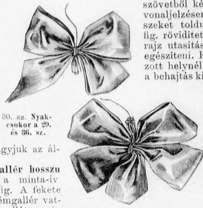
30. sz. Nyakcsokor a 29. és 36. sz.

25. szám. Prémgallér hosszú esüngőkkel. Szabása: a minta-iv XXIII. sz., 141-142. fig. A fekete oposzumból készült prémgallér vattázott atlaszbéllel van ellátva, míg a lehajló gallérja kívül-belül prémes, 23 cm. hosszú farkincák díszítik a gallért köröskörül és a két hosszú vége keresztshelét. A farkincák felvarrásának helye a gallér szabás-mintáján, a melyet a 142. fig. felében ad, pontokkal van jelölve. A gallért elöl végig kapcsoljuk. A 141. fig. be-