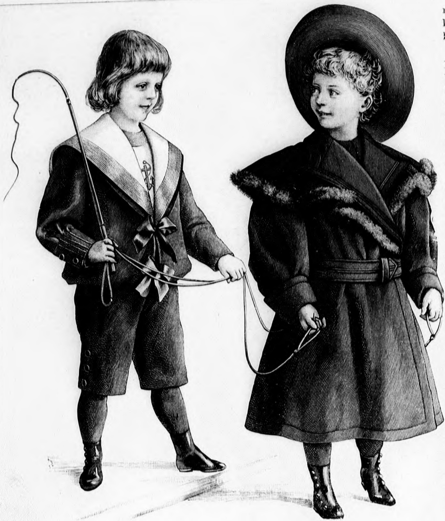
12. sz. Ruha 3-4 éves flunak. Szab.: a minta-iv XI. sz., 68-77. fig. 13. sz. Köpeny 1-2 éves flunak. Szab.: a minta-iv VIII. sz., 41-53. fig.

12. sz. Ruha 3-4 éves flunak. Szabása: a minta-iv XI. sz., 68-77. fig. A nadrág, alsóderék és bluzból 5 kék sevió ruha betétje és külön gallérja fehér posztóból készül, 4 cm. széles, szorosan egymás mellé varrott aranyujtás sorokká és sodrott arannyal himzett horgonynyal. A külön gallér alatt van egy második, a bluzzal egyben függő gallér, a melylyel a bluz fehér gallér nélkül is viselhető. Épp így helyettesíthetjük az alsóderékre gombolt fehér betétet kék betéttel. A bluzt