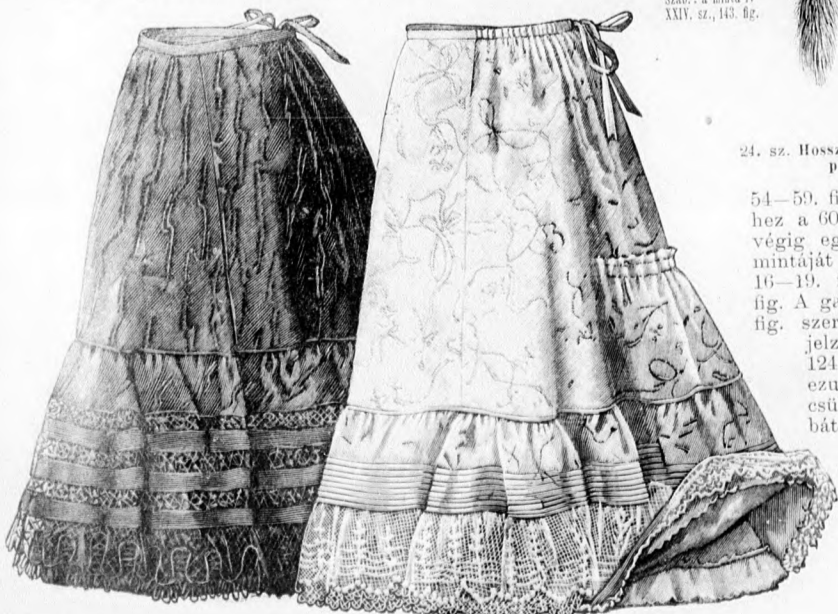
26. sz. Alsószoknya széles fodorral. A szoknya kis rajza: a minta-iv XIV. sz., 81. fig.