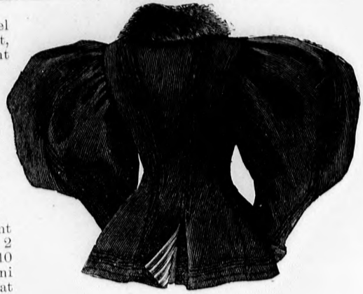
22. sz. A 21. sz. háta.

selyembélésből összeállított prémmel szegett pánt. A szoknya felső szélét, hátul keresztet pontra téve, valamint az a keresztet a pontra téve, két 4 cm. széles rakott ráncba rendezzük és keskeny lényöbe foglaljuk. A csillaggal jelzett helyeken egy 123 cm. hosszú kelmepánt fogja össze a szoknyát. A derekat mai minta-ivünk 111—114. fig. szerint szabjuk. A 87. fig. a posztórész elejét, a 88. fig. a hátulját adja. A 90—90a. és 91. fig. a bársonyrész elejét és hátát. A posztórészeket először is a rövid dupla vonaljelzés szerint be kell vágni, a jelzésen belül 2 cm. szélesen, öt magasan álló, 10 cm. keskeny hosszú hajtásba varni és ekkor az átvágott, elöl 13-at 13-ra, hátul 16-ot 16-ra téve, ismét összevarrjuk. A vállat a vállon, az