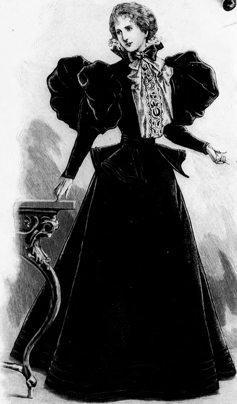
14. sz. Ruha bársonyból himzett paszománttal. Ennek a háta 17. sz. alatt. Az ujj külön 32. a paszománt 35. sz. alatt. Az eleje felső szövevények, a gallér, ujj és lobbenynek szabása, valamint a zsabó és ujj dudorának kis rajza és himzés minta: a minta-iv VII. sz., 99-102. fig. 1 derék és ujj szabását lásd a magy.