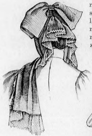
8. sz. A 9. sz. háta.

5. sz. Ruha kreplisszederékkel. A szoknya kis rajza, az ujjá és kézelő szabása: a minta-iv II. sz., 12-16. fig. Mintánk szoknyája és ujjá fekete csíkos rózsaszín tafotából készül. A hátulkapecsokos tekete tafotade-