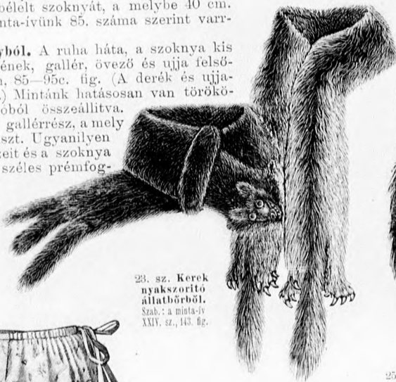
23. sz. Kerek nyakszorító állatbőrű. Szab.: a minta-iv XXIV. sz., 143. fig.

15. szám. Ruha posztó- és bársonyból. A ruha háta, a szoknya kis rajza a szoknyapánt, a derék felsőszövetének, gallér, övező és ujjá felsőszövetének szabása: a minta-iv XVI. szám, 85—95c. fig. (A derék és ujjabélésének szabását lásd a magyarázatban.) Mintánk hatáson van törökös mintázott vászomból és zöld posztóból összeállítva. Fehér posztóból készült keskeny betét és gallérrész, a mely utóbbit fekete paszománt fedi, képezi a dísz. Ugyanilyen paszománt díszíti a derék zöld posztórészeit és a szoknya első lapjának varrását. Ezenkívül 2 cm. széles prémfoglalás és filigrángombok. A szoknya első lapjának bélését fűt, elöl, a közepén 2 cm. mély bevarrással vesszük szűkebbre. A felsőszövetet a bélés szerint varrjuk be 5—14 cm. hosszú keskeny álló hajtásba. Az elöl és hátul alkalmazott bársonydísz mintájának rajza a kis rajzon látható. A bársonydíszhez simul a 86. fig. szerint posztóból, betét- és