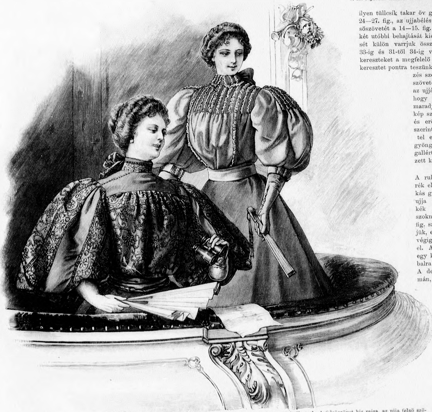
10. sz. Színházba járó blúz kendőkkel. Szab. és magy.: a minta-iv IV. sz., 24-31. fig.