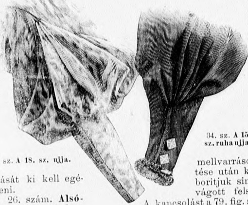
33. sz. A 18. sz. ujjá.