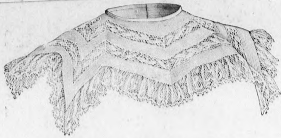
2. sz. Vállgallér batiszt- és csipkebetéttől. Szab. és magy. a minta-iv XIII. sz., 80. fig.

1. sz. Posztókalap bársonyfejjel. A kicsi barna posztó vagy nemezkalap karimája elől 10, hátul 4 cm. széles. A 4 cm. magas fejrésznek 10 cm. széles, 13 cm. hosszú teteje van. A bárettszerű, a kalap tetejét fedő bársonyrész 32 cm. széles, 50 cm. hosszú, elől 7, oldalt 4, hátul 2 cm. szélesen van befelé hajtvva és a behajtás szélessége szerint köröskörül behuzva és a kalpra erősítve. Hátul, oldalt barna bársonyozetta támogatja a karima belsejét. Három magasan álló, kócsaggal vegyített rövid structoll és egy hátrahajló hosszabb díszíti a kalapot.