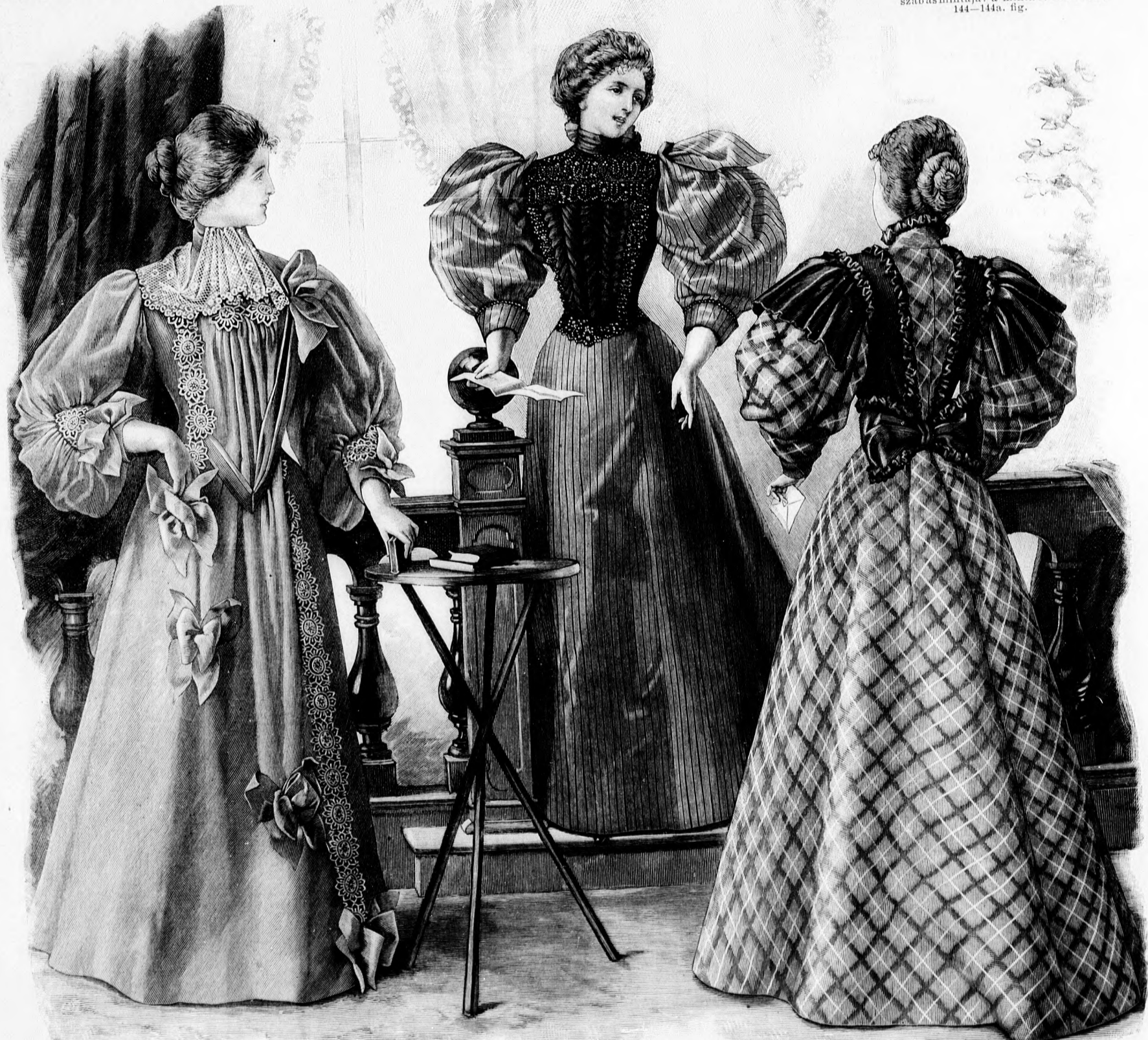
4. sz. Elegáns reggeli ruha. Szabás: a minta-iv I. sz., 1-11. fig.

4. sz. Elegáns reggeli ruha. Szabás: a minta-iv I. sz., 1-11. fig. A világoskék selyemszaténból készült, elől láttatlanul gombolt reggeli ruha díszé 7 cm. széles, sárgás gipűrbetét és 12 cm. széles, kék moáreszalag. Ezenkívül 22 cm. széles sárga tüllcsipke, a mely hátul, az állógallér közepén kezdve, húzódik előre és fűszszerűen ráncolva hull a pongyola elejére. A állógallér közepén kezdve, húzódik előre és fűszszerűen ráncolva hull a pongyola elejére. A gipűrbetétet képszerűen alkalmazzuk, ugyszintén a szalagból készült csokrokat. A pongyolához először is belésszövetből vágunk az 1-3. fig. szerint két-két részt, a kis rajz 4. fig. szerint egy részt a közepén végig egészben hagyva és felsőszövettel borítjuk a bal előrészt. Ha