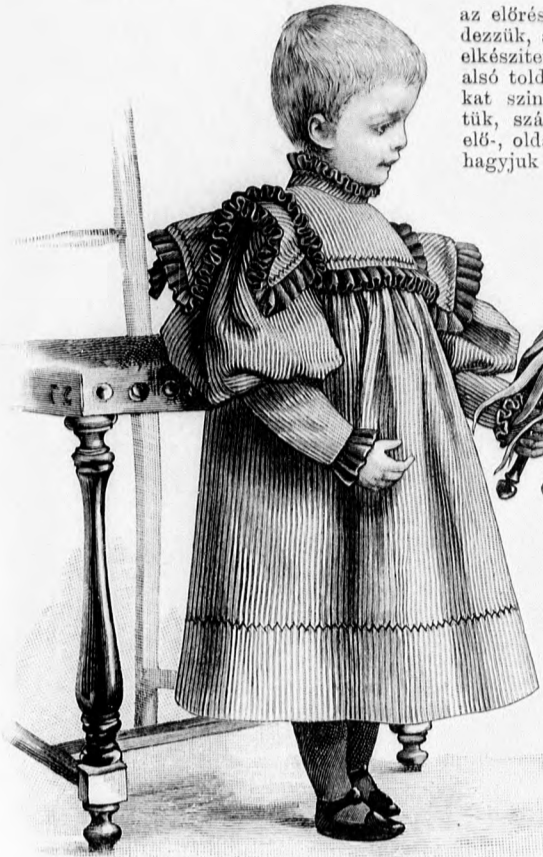
7. sz. Ruha 1-2 éves gyermeknek. Szab. és magy.: a minta-iv III. sz., 17-23. fig.