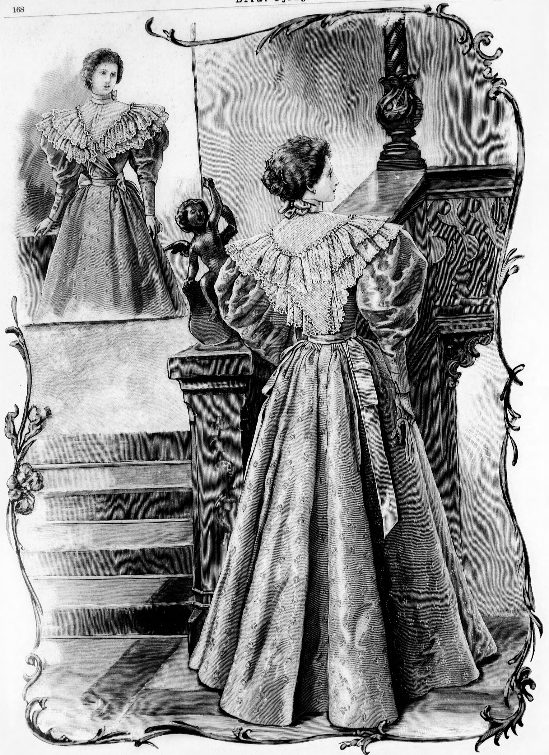
39. és 40. sz. Diszes ruha csipkefűsével. A szoknya kis rajza, kendő és ujj szab. és magy.: a minta-iv XX. sz., 125-130. fig. A bélésderék szabását lásd a magyarázaton.

Feliratos szerkesztő: Csepreghy Ferenc. Kiadó: Kálmán János; Békési Jenő Budapesti Hírlap ujságvállalata (igazgató: Zilahy Simon). Budapesti Hírlap nyomdája. A mai nyolccoldalas főlaphoz 1 színes divatkép, 1 szabasminta-iv, 1 külön szabasminta-iv melléklet és 1 szórakoztató melléklet van csatolva.