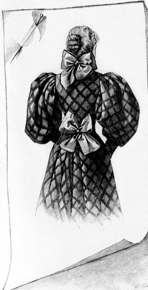
29. sz. A 36. sz. háta. Ehhez a 30. és 31. sz.

5 cm. hosszú prémpánton dugjuk keresztül és ezenkívül kapcsokkal is ellátjuk. A 143. fig. a selyem- és vattabéllel ellátott gallér felét adja.