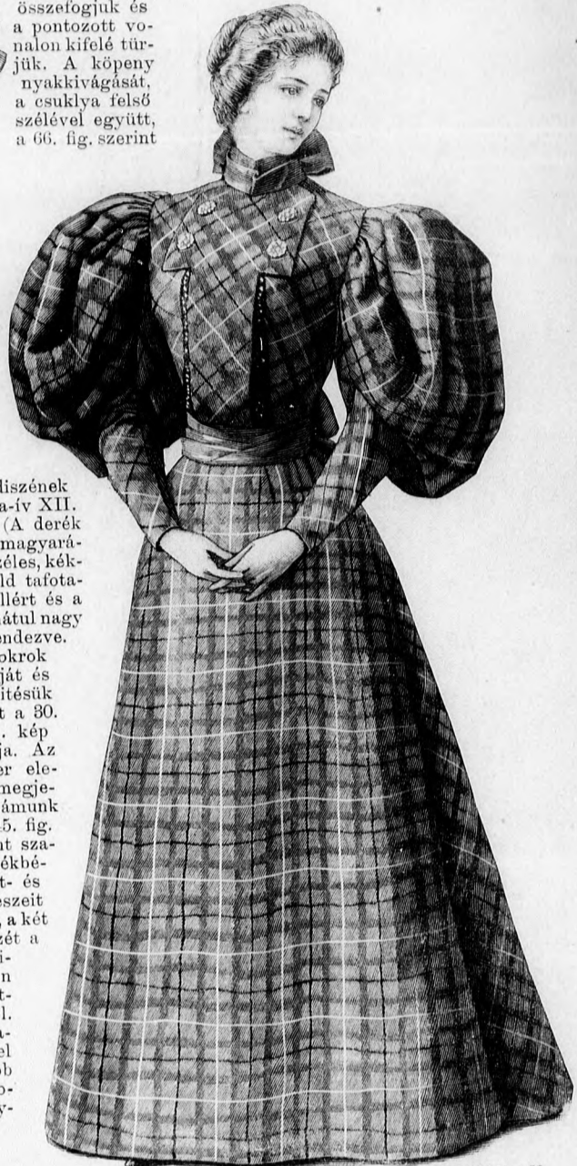
36. sz. Ruha nyak- és övesokorral. Ehhez a 29. és 31. sz. A szoknya kis rajza és az eleje díszének szabása: a minta-iv XIII. sz., 78-79. fig. A derék szabását lásd a magyarázatban.

37. sz. Bál ruha fiatal hölgyeknek. Szabása: a minta-iv V. sz., 32-39. fig. 2 cm. széles sárgás kreplisszodor díszíti a nyolc lapból álló halványzöld selyem-merveleiből készült szoknya minden varrását. 4 cm. széles ugyanolyan színű dudor fedi a 40 cm. széles, 8 cm. mély, cakkokba kivágott a derék négyközögletes kivágását és 6 cm. széles zöld atlaszszalagból készült csokrok díszítik a fodrot és az ujját. 8 cm. széles szalagból készült sallangos csokrot alkalmazunk kép szerint a ruha kivágására. A szoknyához a 32. fig. kis rajzának a és e része szerint egy-egy lapot szabunk a köpenyhez, a melyeket a b és d részek szerint pedig közpön végig egészen hagyva, a b és d részek szerint pedig két-két lapot, a melyeket gáz és selyembéllel látunk el. Az első és első oldallapot fönt kissé betartjuk, a többi behúzzuk. A keskeny lényöt egy 15 cm. széles, hátul 6 cm.-re tarajosan összehúzzott, halocsinttal és kapcsolással alátoldott részutesikkal fedi. A hátalkapcsos, elöl és hátul ráncosan, oldalt simán felszövevvel borított derékbélelét 33-37. fig. szerint szabjuk. Az ujjá belését és felső szöveteit a 38. fig. és a 39. fig. kis rajza szerint készítjük.