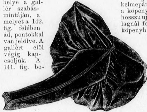
32. sz. A 14. és 17. sz. ujjá.

A csokrok mintáját és elkészítésük módját a 30. és 31. kép mutatja. Az október elején megjelent számunk 41-45. fig. szerint szabott derékbélel, hát- és oldalrészeit egyben, a két előrészt a