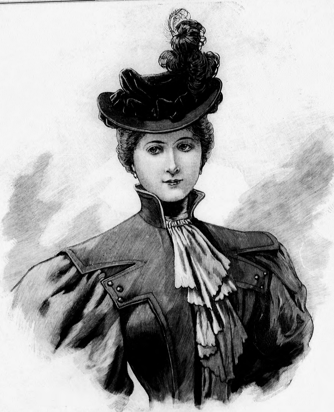
1. sz. Posztókalap bársonyfejjel.

A többé-kevésbé ragyogó selymek, himzések, gyöngy- és pillangódiszkek színhatását annyira keresik a divatos derekakon, hogy manapság alig látni egy szolid, egyszerű ruhát, a melynek szoknyája és dereka egy és ugyanabból a kelméből készülne. A forma ma már szinte mellékes, a díszítés a fő, és ebben annyit ismert, oly tág tért enged a mai divat az egyéni ízlésnek, hogy mindenki kiválaszthatja magának a sokból azt, a mi neki legjobban áll. A legkényelmesebb és legáltalánosabban viselt divatos jöszágmá is a blúz, a mely igen alkalmas arra, hogy a legszeszélyesebb ízlésnek megfelelően díszítették és óriási ellentétben áll leg-többször a szigoru egyszerűséggel készült szoknyával, a melylyel együtt viselik. A blúz többnyire szingazdag chinéselyemből készül dus redőzettel, bő, a vállró leeső ujjal, dus csipke-, gyöngy-, bodor- vagy egy egész Maria Antoinette fichudiszszal. A nyakbodor dus fodrai közül nem ritkán madárfejek, vagy egyes nagy nyíló virág kandikál kifelé, de leggyakrabban csak a blúz selyméből vagy szalagból készült rozettával is beérik rajta. Nagyon kedvesek az elő nyitott, hátul testhez-álló és körülbelül 15 cm. hosszú bőven kiugró leb-benynyel készült perzsabársony-derekak, a melyeknek elejét dus selyem, krepp, vagy tüllből készült csipkés mellfodor, u. n. jabot (zsabó) tölti ki. A derék elejét a jabon kívül széles hajtóká-disz ékíti és redős selyemőv választja el a szoknyától. A divat csábító sze-szélyei dacára is vannak