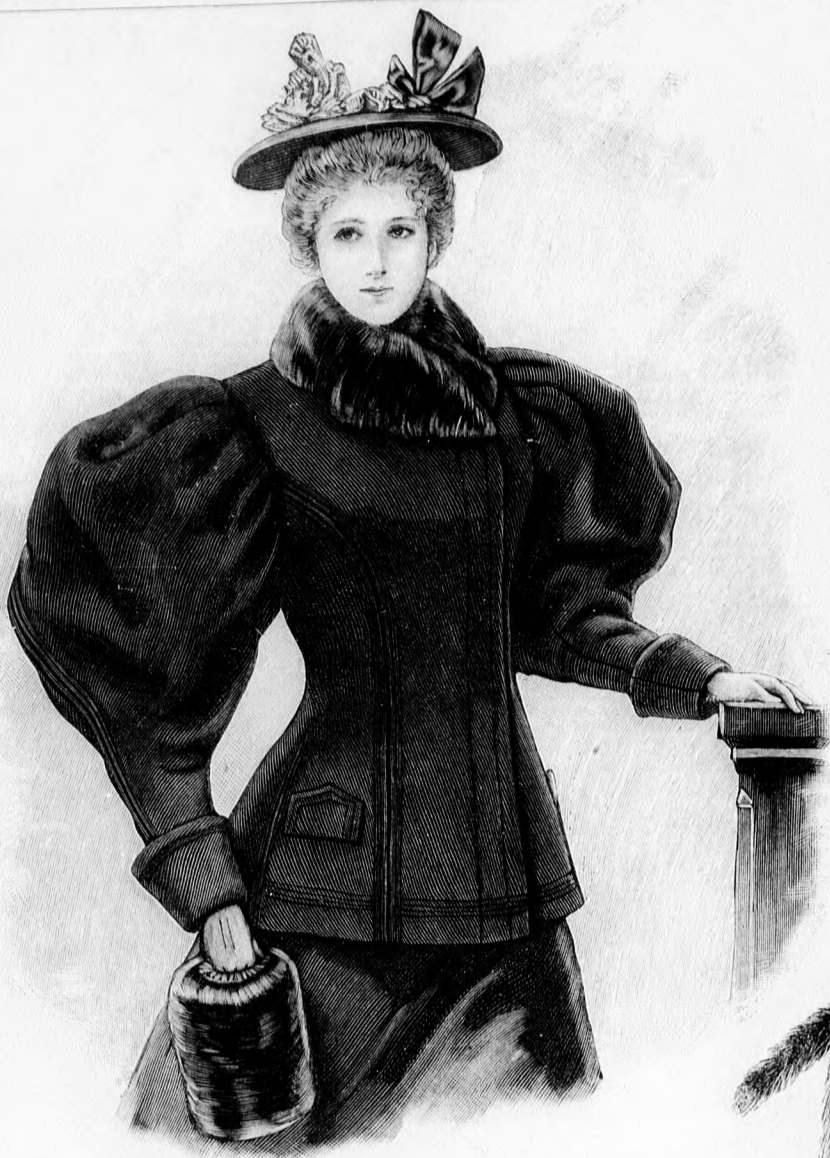
21. sz. Félig testhez álló kabát prémgallérral. Ehhez a 22. sz. Szab.: a minta-iv IX. sz., 54—62a. fig.

az ujjá alsó szélét és fut innen a felső ujján a és dudoron végig, (lásd a 32. képet.) Ugyanilyen paszománt díszíti kétsorosán egymástól 1 cm. távolságban felvarrva a gallért és lebbenyt, a mely utóbbinak a felvarrását fekete atlaszszalag fedi. Egy 2, 3 és 4 cm. széles paszománt díszíti egymástól 3 cm. távolságban a szoknya alját. A végigbélelt szoknyát, a melybe 40 cm. magasan kemény betétet teszünk, mai minta-ivünk 85. száma szerint varratjuk.