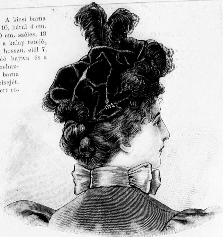
3. sz. Kalap, bársony és tollból. Az alap szabásmintája: a minta-iv XXV. sz., 144-144a. fig.

1. sz. Posztókalap bársonyfejjel. A kicsi barna posztó vagy nemezkalap karimája elől 10, hátul 4 cm. széles. A 4 cm. magas fejrésznek 10 cm. széles, 13 cm. hosszú teteje van. A bárettszerű, a kalap tetejét fedő bársonyrész 32 cm. széles, 50 cm. hosszú, elől 7, oldalt 4, hátul 2 cm. szélesen van befelé hajtvva és a behajtás szélessége szerint köröskörül behuzva és a kalpra erősítve. Hátul, oldalt barna bársonyozetta támogatja a karima belsejét. Három magasan álló, kócsaggal vegyített rövid structoll és egy hátrahajló hosszabb díszíti a kalapot.