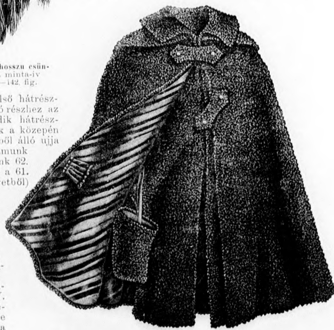
28. sz. Küpeny, alátoldott előrészszel idős hölgyeknek. A küpeny háta, visszaja és szabása: a minta-iv X. sz., 63—67b. fig.

23. sz. Kerek gallér prémből. Szabása: a minta-iv XXIV. sz., 143. fig. A hódpémből készült kerek gallér egyik vége 3—18 cm. hosszú farkban, a másik vége állatfejen végződik. A gallér fejével ellátott végét a másik végére erősített