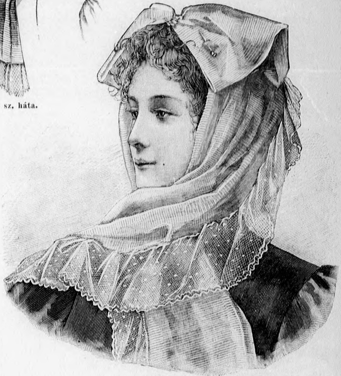
9. sz. Fejkendő elszázi csokorba rendezve. Ehhez a 8. sz.

rekát, a pántrészt kivételével, fekete kreplisszettel borítjuk, a melyet hátul a nyaknál és lent kissé ráncolunk, elől cakkosan plisszírozzuk és kissé bugyogósan erősítünk a derékra. A pántszerű dísz gyönggyel hímzett fekete tüll, a melyből két 6 cm. széles csík a plisszírozott rész két oldalán húzódik a derék széléig, a melyet ugyan-