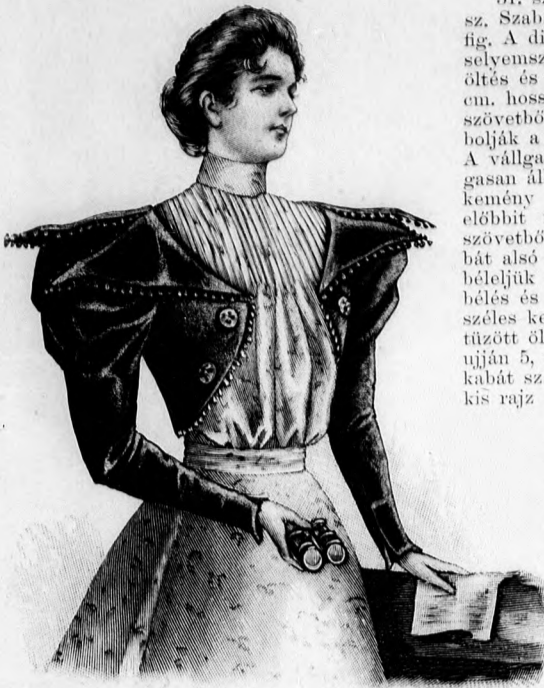
30. sz. Színházba járó kabátka. Szab.: minta v VIII. sz., 50-55. fig.

első vonaljelzés szerint alkalmazott ráncokat a pontozott vonalon befelé tűjük és 61-62-ig kerekre varrjuk össze. Az ujját főt keresztet pontra téve ráncba rendezzük, egyébként az összes részeket számjelzés szerint állítjuk össze.