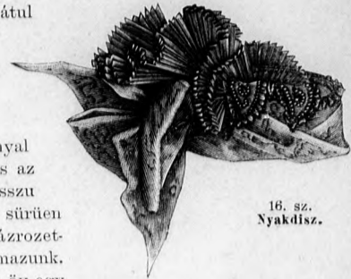
16. sz. Nyakdisz.

15. sz. Nyakdisz. A bármely ruha gallérjába fércelhető dísz egy a közepén 6, a két végén 2 cm. széles, 21 cm. hosszú fehér plisszékreppefodorból és négy 4 1/2 cm. hosszú, 3 1/2 cm. széles fekete tüll-lapból áll, a melyeket drót és sárga csipke foglal és fekete pillangó ékit.