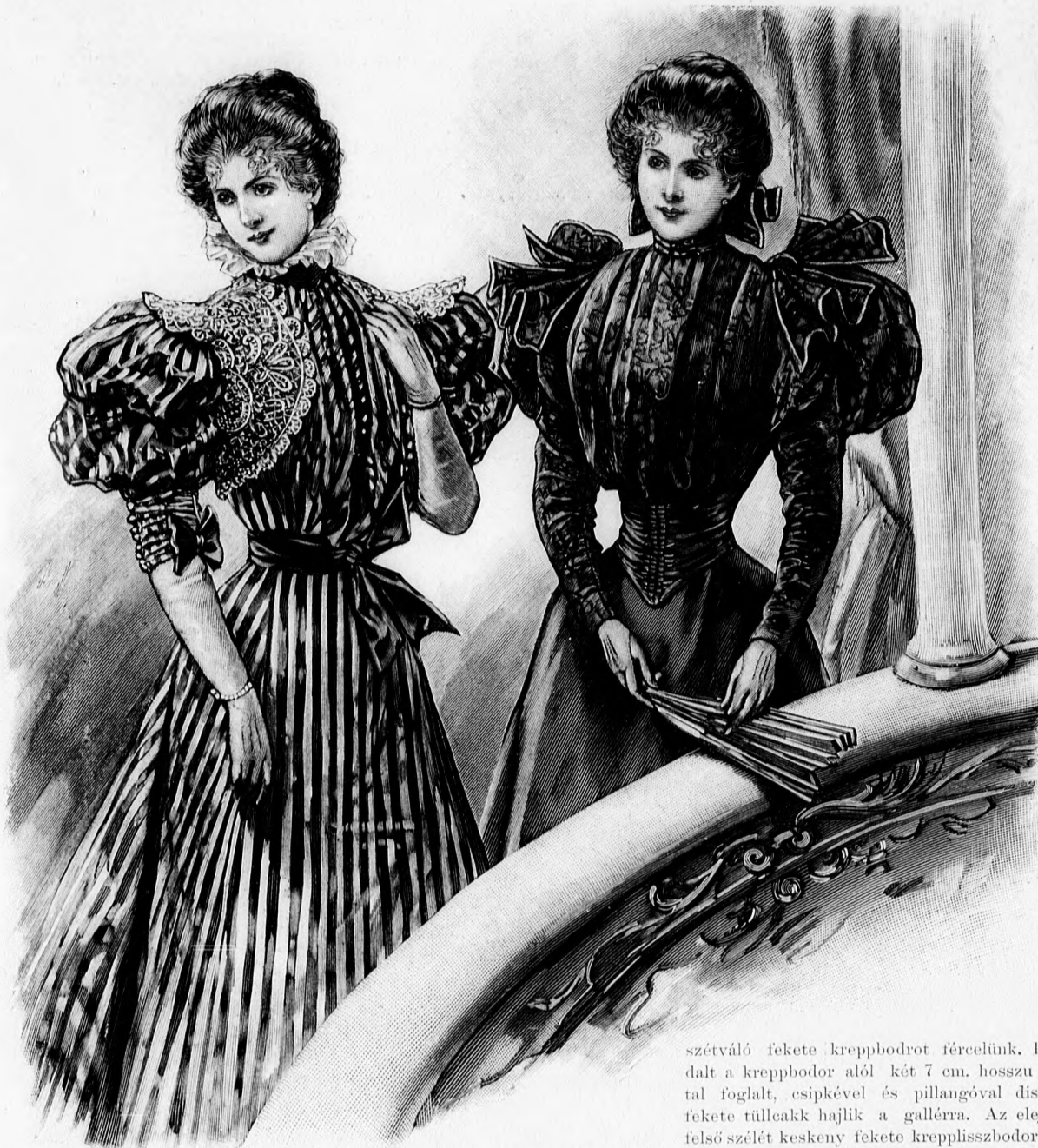
13. sz. Csipkeszakett díszes ruhához. Ehhez a 4. sz. A szakett szab.: mintaiv IX. sz., 56. fig.