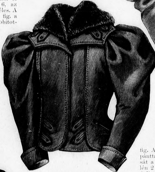
32. sz. Kabát prémgallérral. Ehhez 37. sz. A kabát szab.: mintáiv XII. sz., 65-71. fig. Az ujjá szab, lásd a magy.

be. A válldísz, 87. fig., duplaszövetből készül, vonaljelzés szerint tarajosan van behuzva és 16-17-ig a derékre van varrva. Az egyenes lapokból álló, bélelt, 70 cm. hosszú, 240 cm. bő szoknyarészt be kell beráncolni és a derék szélére varrni. A varrást egy 3 cm. széles, hátul rozetta alatt kapcsolt kelmepánt takarja.