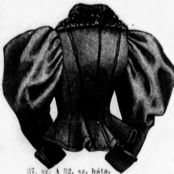
37. sz. A 32. sz. háta.

31. sz. Rövid kabát. Ehhez 36. sz. Szab.: mintáiv V. sz., 30-37. fig. A divatszín dupla posztókabát selyemszín bélésel készül tűzött öltés és paszomántgombdísszel, 7 cm. hosszú, 2 1/2 cm. széles duplaszövetből készült kelmepántok gombolják a kabátot és ékítik az ujját. A vállgallérral egyben szabott magasan álló gallért és az állógallért kemény vászonbetéttel készítjük, előbbit főt vonaljelzésig duplaszövetből, utóbbit bélésel. A kabát alsó szélét betéttel és kelmével béleljük alá. A kabát alsó szélébe bélés és felsőszövet közé 6 cm. széles kemény vásznat tűzünk. A tűzött öltésorok a kabátban 6, az ujján 5, a galléron 3 cm. széles. A kabát számára, ha a 30-32. fig. a kis rajz szerint meghosszabbítottuk és a 36. fig. behajtását kiegészítettük, a 30., 32., 34-37. fig. szerint két-két részt, a 31. és 34. fig. szerint egy-egy részt a közepén végig egyben szabunk. A hátrészt egy mély lapos ráncot képezve, keresztet pontra téve ráncba rendezzük és a pontozott vonalon végig erősen levasaljuk.