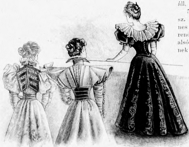
8. sz. A 27. sz. háta.