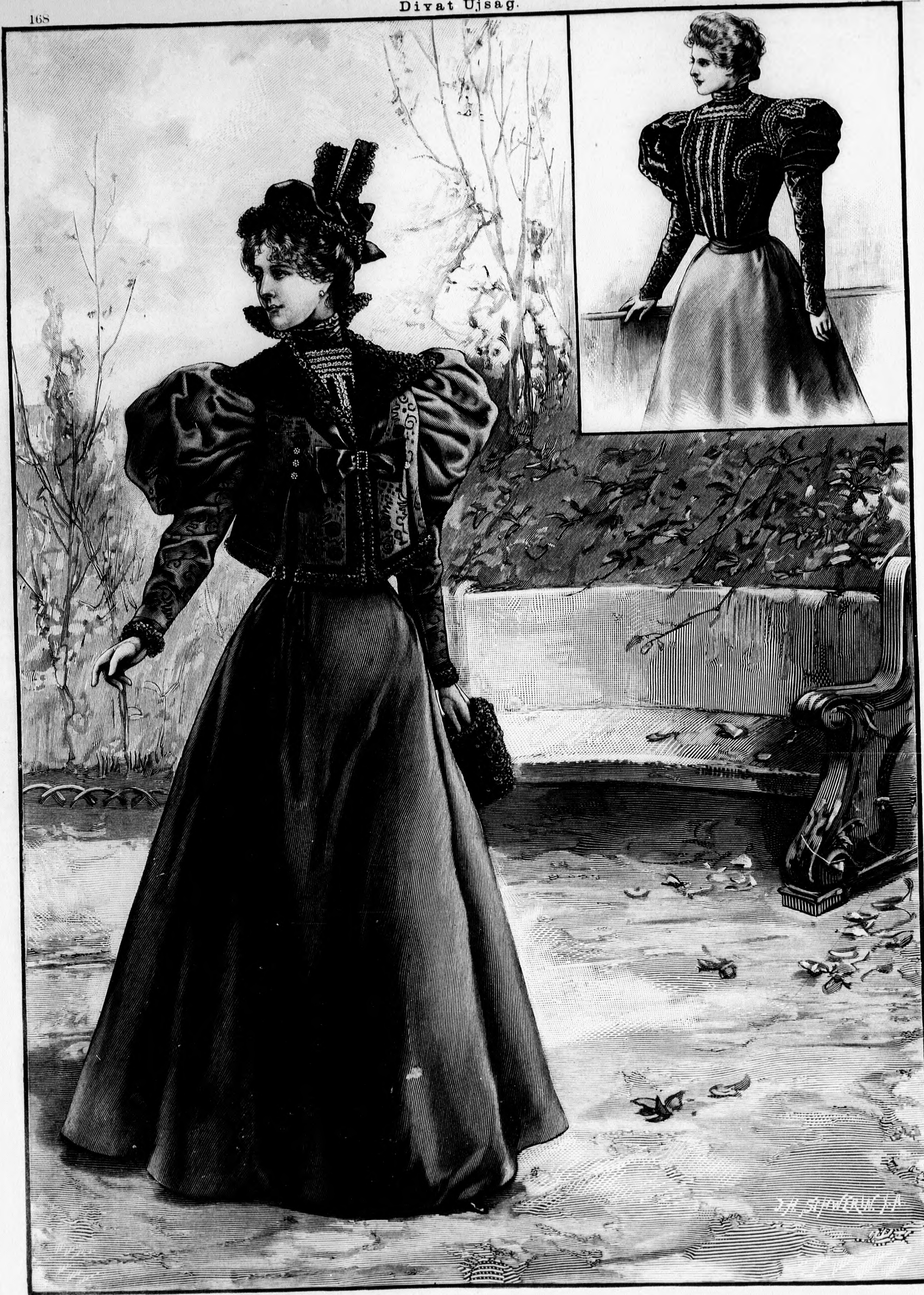
48. sz. Ruha rövid zsakettel és elfőtőszin derékkal. Előhez a zsakett háta a 34. sz. és a ruha eleje zsakett nélkül a 49. sz. alatt látható. A szoknya felsőszövetének kis rajza, a derék elejének alapja, az ujj felsőszöve és a zsakett: mintáiv XVI. sz.. 100-106. fg. A bélelőszoknya derék és zsakett ujjá szab. lásd a magy.