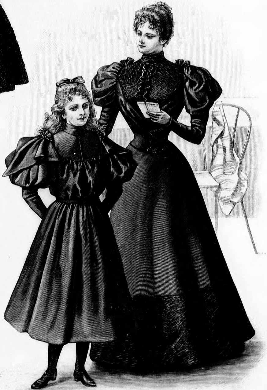
38. sz. Gyászruha 11-13 éves lánynak. Szab.: mintáiv XIV. sz., 80-83. fig.

42-43. sz. Ruha 2-4 éves leánynak és egy színházba járó bluz. Ehhez 41. sz. A kis ruha szab.: mintáiv 7. sz., 1-9. fig. A kis ruha gyapjuszövetből készül bársonypánttal, gallérral és kézelővel. A ruha felvarrását a pántra elől-hátul 7 cm. széles, a két szélén 2 cm. széles tarajjal behuzott kelmebodor fedi. Az ujjá dudorának felvarrását hasonló