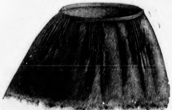
35. sz. A 48-49. sz. szoknya külön.