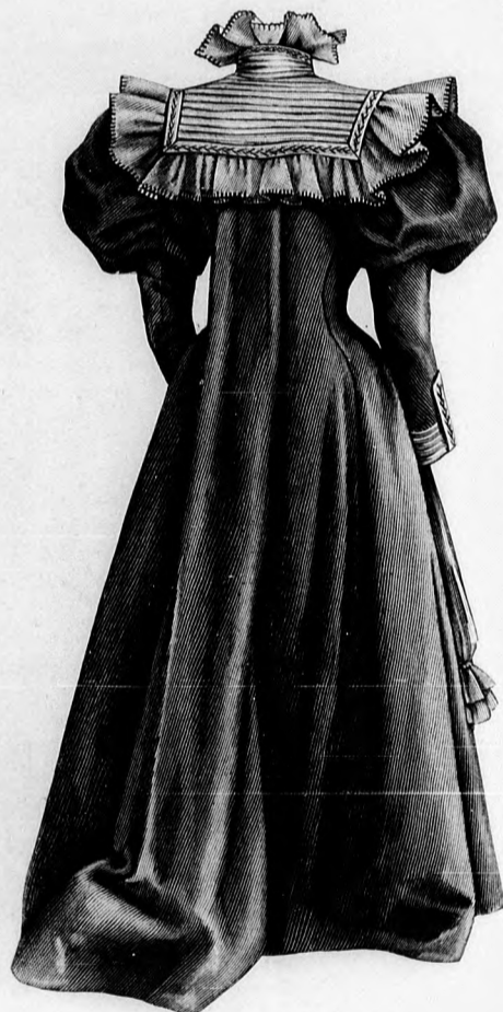
7. sz. Pongyola vattóránecal.

kapcsolt sima kreppcsík takarja. A hajtókat a váll csücskétől a derék alsó széléig varrjuk a sima