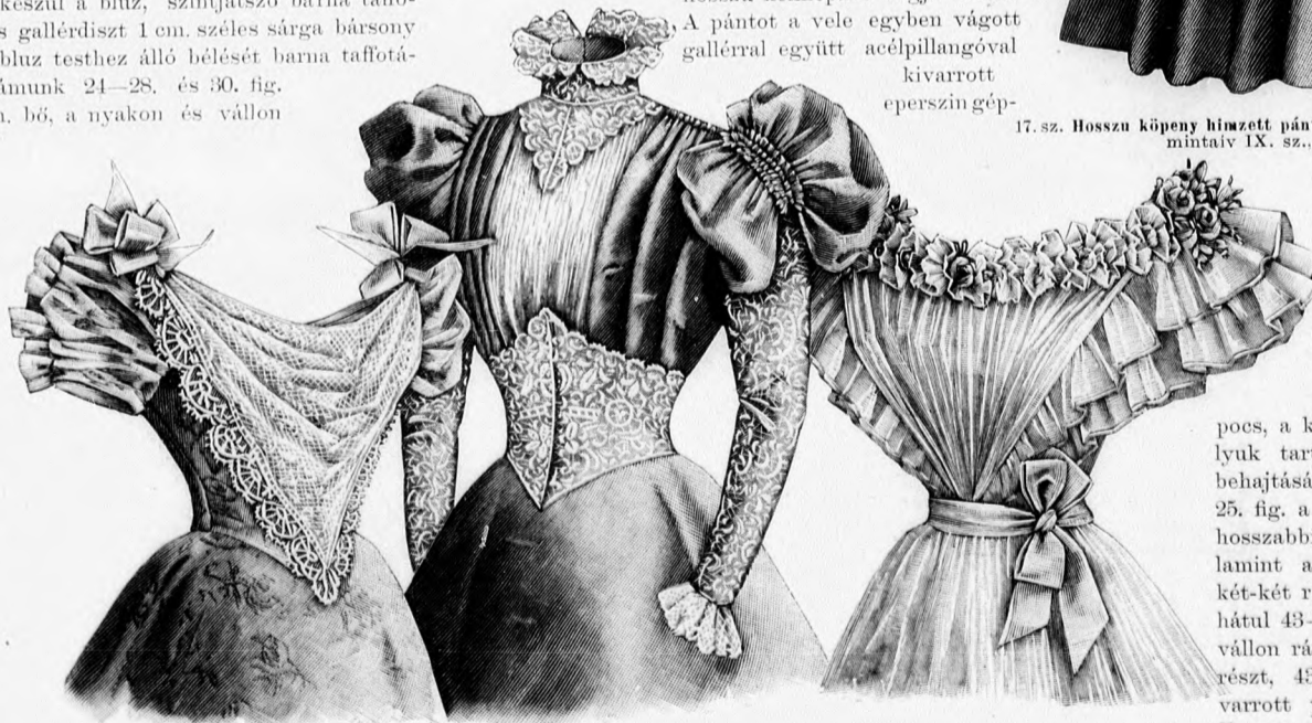
18. sz. Bálruha. Szab.: mintaiv III. sz., 15–23. fig.

ráncolt, lent a közepe felé ráncba rakott, oldalt simán borított gáz van. Egy-egy hát- és oldalrészt egyben borítunk a nyakon és lent ráncolt 40 cm. bő gázzal. A szűk ujjá gázszövetét a belső varráson ráncoljuk. A válldisz két 60 cm. széles, 11 cm. hosszú, az egyik hosszú oldalát kivéve, bársonnyal foglalt gúzesíkből áll, a melynek a foglatlan részét sűrűn összehuzzuk és egy gáz-boggal vászonszerűen összefogva a vállra erősítjük. Ez alatt a dísz alatt mindenik vállra két 48 cm. hosszú, 25 cm. széles gúzesíkot varrunk, még pedig az egyik sűrűn