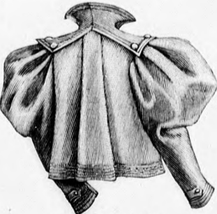
36. sz. A 31. sz. háta.