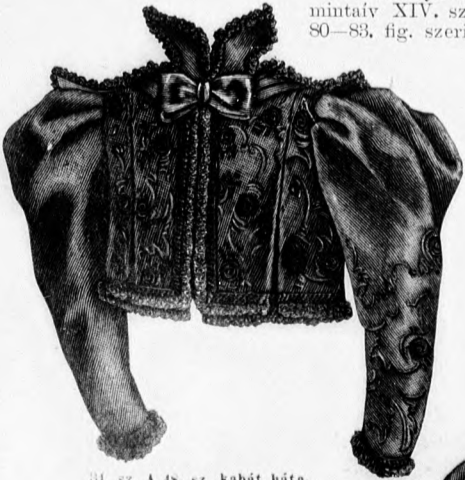
31. sz. A 48. sz. kabát háta.

38. sz. Gyászruha 11-13 éves lánynak. Szab.: mintáiv XIV. sz., 80-83. fig. A fekete sevióruha 80-83. fig. szerint szabott hátulgombos bélésde-