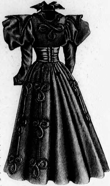
3. sz. A 26. sz. háta.

fodor és kézelő szab.: mintáiv XVII. sz., 107-111. fig. A bélés, az eleje felsőszöve, állógallér, bélés és felsőszövetének szab. lásd a magy. Az elől láttatlanul gombolt sötétkék flanelpongyola bélését októberi számunk 1-4. fig. szerint készíthetjük. Ugyanazon mintáiv 5. fig. szerint szabjuk az előrészt és első oldalrészt borító felsőszövetet. Mai mintáivünk 107. fig., a melyet a 111a. fig. kis rajza szerint hosszabbítunk, megadja a 2. oldalrész és hátrész felsőszövetét, a mely utóbbit a két keresztet pontra téve fönt vattóránca rendezzük, azután vonaljelzés szerint a hátsó varrást képezve csillagtól duplapontig összevarrjuk és számjelzés szerint a 108. fig. szerint szabott pántba foglaljuk. A pongyola díszre bíborvörös flanelből készül, ezt a szövetet a 109. fig. szerint szabott vállgallér számára keskeny hajtásokba varrjuk le. A vállgallért körülítő 8 cm. széles, 330 cm. bő fodor felvarrását egy, 1 1/4 cm. széles kék öltéssel kivarrott pánt fedi. A fodor alsó szélét, valamint a gallérfodor szélét kék öltéssel varrjuk ki. A gallérfodor alsó szélét 26 cm. bőre ráncoljuk be és az állógallér bélése és felsőszöve közé foglaljuk, a mely utóbbit egy oldaltkapcsolt, hajtásokba kivarrott füzös flanelrész borít. A bélésujja alsó részét simán borítjuk felsőszövevel. A 111. fig. szerint készült manzsetta közepét az ujja belső varrására illesztjük, ezenkívül az ujja szélét egy