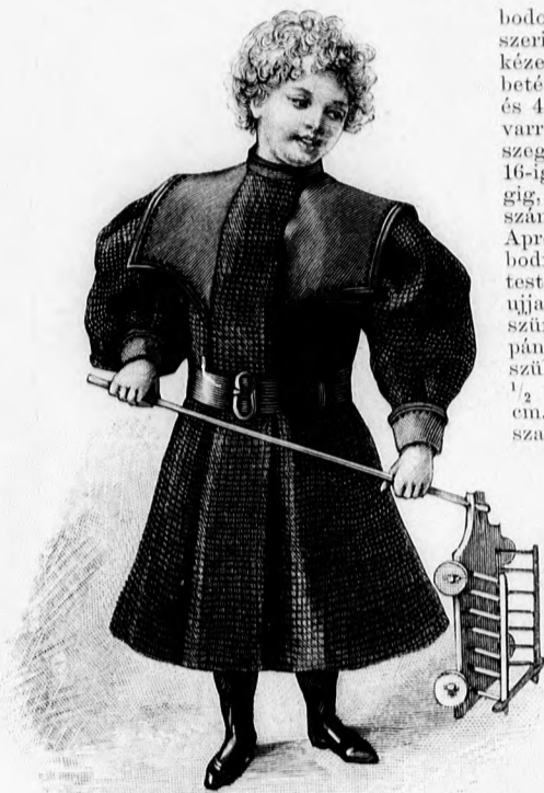
40. sz. Ruha 1-2 éves fiúnak. Szab., a ruha háta és magy.: mintáiv VII. sz., 43-49a. fig.

jük. Hasonló betét fedí az állógallért és a derék szélét, valamint a vállvarrást és ujjá dudorát egyben és a kapcsolást. A vállon és elől 5 cm. széles, az ujján és a derék szélén 7 cm. széles duplafodrot varrunk a betét alá. A blúzbelést, ujját és állógallért bármely egyszerű derék-minta után szabjuk. A főt beráncolt rövid dudort október 1. számunk 70. fig. szerint készíthetjük.