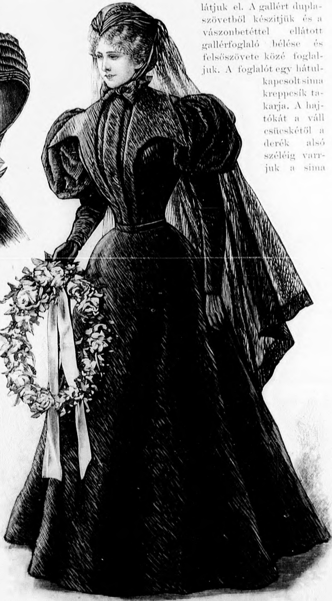
11-12. sz. Ruha és kalap mélygyászhoz. A derék galléria és hajtókájának szab.: mintáiv X. sz., 57-58. fig. A szoknya és derék szab. lásd a magy.