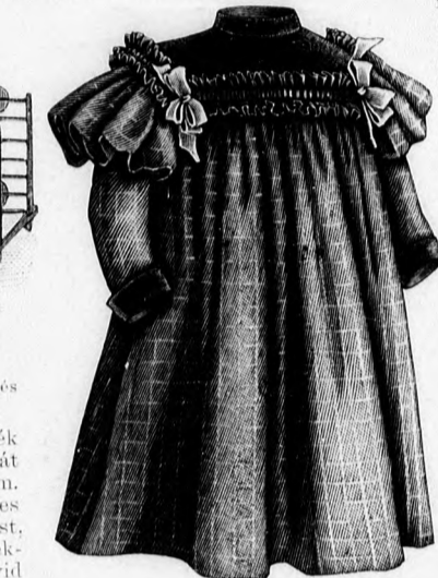
42. sz. Ruha 2-4 éves leány-nak. Szab.: mintáiv I. sz., 1-7. fig.

47. sz. Gyászköpeny. Szab.: mintáiv XX. sz., 124-127. fig. A fekete posztóköpeny első szélét 7 cm. széles betéttel és atlaszszal béleljük. Az alsó szélét keskenyen szegjük. Hátul a köpenyt a pontozott vonalak szerint ráncokba rakjuk és a csillaggal jelzett helyen szorosan összevarrjuk. A váll és kihajtott gallérrészek kreppszo-