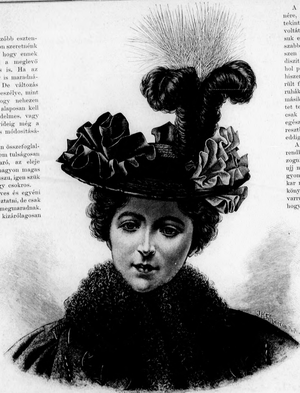
1. sz. Kerek kalap rozettadísszel.

A télire való modellek csaknem kizárólagosan prémmeel készülnek, a vé- kony, rövid szőrű, erre a célra egészen puhára kidol- gozott prémfélékkel, a me- lyeket épp úgy lehet alkal- mazni, mint valami puha szövetet. Nagyon szép és nagyon gazdag, persze, hogy egy kissé költséges divat. A hermelint bársonnyal, a bársonyt posztóval, a vidra- bőrt pompás fekete moiriroz- zott kelmével láttuk alkal- mazva. A hermelin a derék elejét bluzformában ékítette és csak régi ezüstpaszo- mánttal volt a vállhoz erő- sitve. A báránnyal, de igazi szép bongyorbáránnyal be- tétnek volt alkalmazva a de- rék redős, elől szétváló, lazán függő előrészei alatt. A vidra- bőr pántszerűen volt alkal- mazva, mint eddig a bársonyt vagy egyebet alkalmazták.