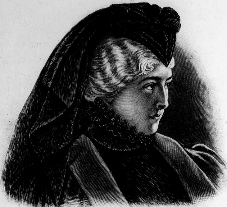
2. sz. Gyászfejkötő fátýollal.

kincáival. Ugy lig-lóg az a sok fark szépeinken, mint egy indián harcson az ellenfeleink a skalpja.