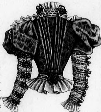
44. sz. A 43. sz. háta.

perzsa prémfogalás díszíti. Perzsa prém borítja a hajtókát és gallérrészt is. A gallér és hajtóká alatt elől és hátul csokorba rendezett 10 cm. széles fekete atlaszszalag ékíti a kabátot, a csokrot acélszett fogja össze. Három egymás fölé tett acélgomb ékíti elől a kabát ráncát. Az egész kabátot ujjával együtt kék moaréval béleljük. Ha a 103-104. fig. szerint szabott elő- és hátrészeket számjelzés szerint összevarrtuk és elől és hátul 45-46-ig és 47-48-ig a rövid varrásokat elkészítettük, keresztet pontra téve ráncba rendezzük és reávarrjuk a posztóval és betéttel bélelt hajtókát és hátul felálló gallérrészeket, 105-106. fig. Az utóbbi dróttal készül. A külön összevarrott felsőszoknya jelzések közt