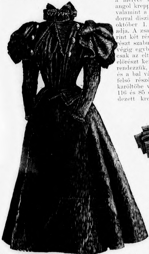
45. sz. Gyászruha bodordíszszel. A szoknya, pánt és lebbény, valamint a derék felsőszövetének és ujjá dísznek szab., magy.: mintáiv I. sz., 8-14a. fig. A szoknya és derékbélés szab. lásd a magy.

a melyet alul a meddig látszik angol kreppel borítunk. A derék, valamint a 4 cm. széles duplabodrorral díszített állógallér mintáját október 1. számunk 24-28. fig. adja. A zsakett számára a 142. fig. szerint két részt, a 143. fig. szerint egy részt szabunk, ez utóbbit a közepén végig egyben, a bal előrészt azonban csak az eltérő vonaljelzésig. A jobb előrészt keresztet pontra téve ráncba rendezzük, egy krepp boggal átfogjuk és a bal vállra gomboljuk. A szűk ujjá felső részét két egymásra hulló, a karöltőbe varrott 20 és 15 cm. széles, 116 és 85 cm. bő rakott ráncba rendezett kreppfodor díszíti. Az ujját,