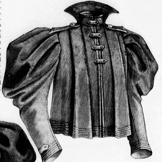
31. sz. Rövid kabát. Ehhez 36. sz. Szab.: mintáiv V. sz., 30-37. fig.

rekát vonaljelzésig pántszerűen borítjuk simán felsőszövettel, azonkívül a 84. és 85. fig. szerint szabott redős felsőszövettel. Ez utóbbit jelzés szerint ráncoljuk be és a pánt széle alá és a derék szélére varrjuk. Hátral a gombolást egy 6 cm. széles laposránc takarja. Az állógallér, 86. fig., bélés- és betéttel készül. A bélésujját, 88. fig., a melyen az alsó ujját jelző vonal figyelembe veendő, lent vonaljelzésig simán borítjuk sevióval, főt a 89. fig. kis rajza szerint készült dudorral. Ez utóbbit főt csillagtól csillagig, lent köröskörül ráncoljuk