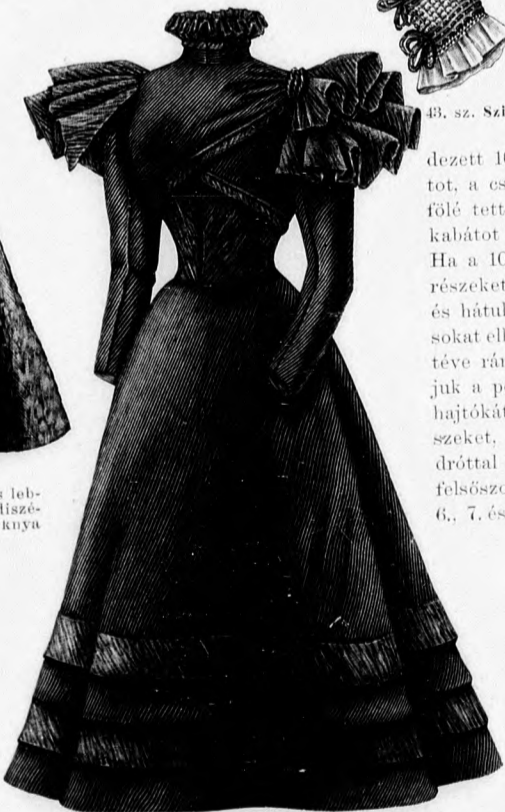
46. sz. Gyászruha zsakettel. A zsakett szab., és a ruha háta: mintáiv XXIX. sz., 142-143a. fig. A szoknya szab. lásd a magy.

vetből készülnek, klottsövetből és bélésel és együtt vannak a nyakkivágásra foglalva. Elöl 6 cm. széles szalagesokor ékíti az előlkapos köpenyt, a melynek mintáját a 124-127. fig. adja. A 124. fig. azonban a 124. fig. kis rajza szerint kell meghosszabbítani.