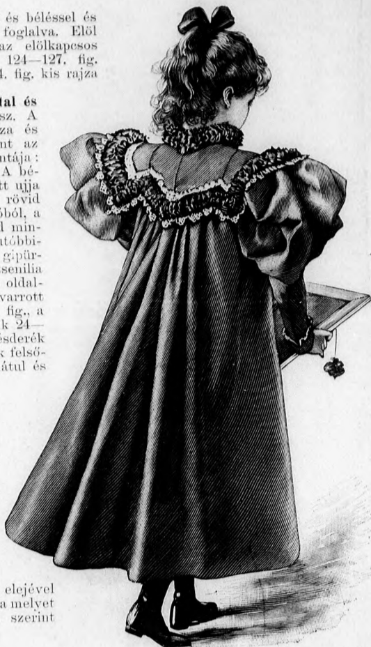
41. sz. Ruha 6-8 éves leány-nak. Szab., a ruha eleje és magy.: mintáiv XV. sz., 90-99a. fig.

48-49. sz. Ruha rövid kabáttal és előtőszin derékkal. Ehhez 34. sz. A szoknya felsőszövetének kis rajza és a derék elejének alapja, valamint az ujjá felsőszöve és zsakett mintája: mintáiv XVI. sz., 100-106. fig. A bélés szoknya, derékbélés és zakett ujjá szab. lásd a magy. Az eredeti rövid zsakett és szoknya kék posztóból, a hátra való blúzderék világoszöld mintázott bársonyból készül, E; utóbbitnak disze 2 1/2 cm. széles sárgás gúpürbetét, a melyet finom fekete zsenília és acélgvöngy ékít. A hát- és oldalrészt, valamint az elől összevarrott és átkapcsolt előrészeket, 101. fig., a melyeket az október 1. számunk 24-27. fig. szerint szabjuk, bélésderék kapcsolását fedí, egyben vannak felsőszövettel borítva, a melyet hátul és elől hosszában négy 1 1/2 cm. széles hajtásba varrunk, a melyek közül kettőt-kettőt, a derék közepe felé fordítva varrunk le. Még pedig a hátrészen 3 1/2 cm. távolságban egymástól, elől kettőt szorosan egymás mellett, közepén 12 cm. távolságban egymástól. A betétet elől és hátul háromszor a közökbé, azonkívül pántszerűen illesztjük a derékra, azután a karöltő körül és az ujjára és a derék elejére kép szerint pálmáfigurát képezve vele. A derék elejével együtt átkapcsolt állógallért, a melyet október 1. számunk 16. fig. szerint