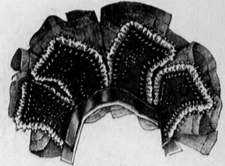
15. sz. Nyakdisz.

beráncolt féllével aszárny alá, a másikkal elő és hátrafelé dudort képezve az ujjára varrjuk. A redős [gázzal borított állógallérra hátul két 10 cm. magas, 40 cm. bő bársonnyal foglalt és az egyik hosszú oldalán sűrűn ráncoltgázszövetet alkalmazunk. A széles öv egy 27 cm. széles rézsutvágott taftotacsíkból áll, a melyet elől és hátul 18 cm-re összehuzzuk és elől és hátul halesonttal látunk el. Az öv hátul kapesos.