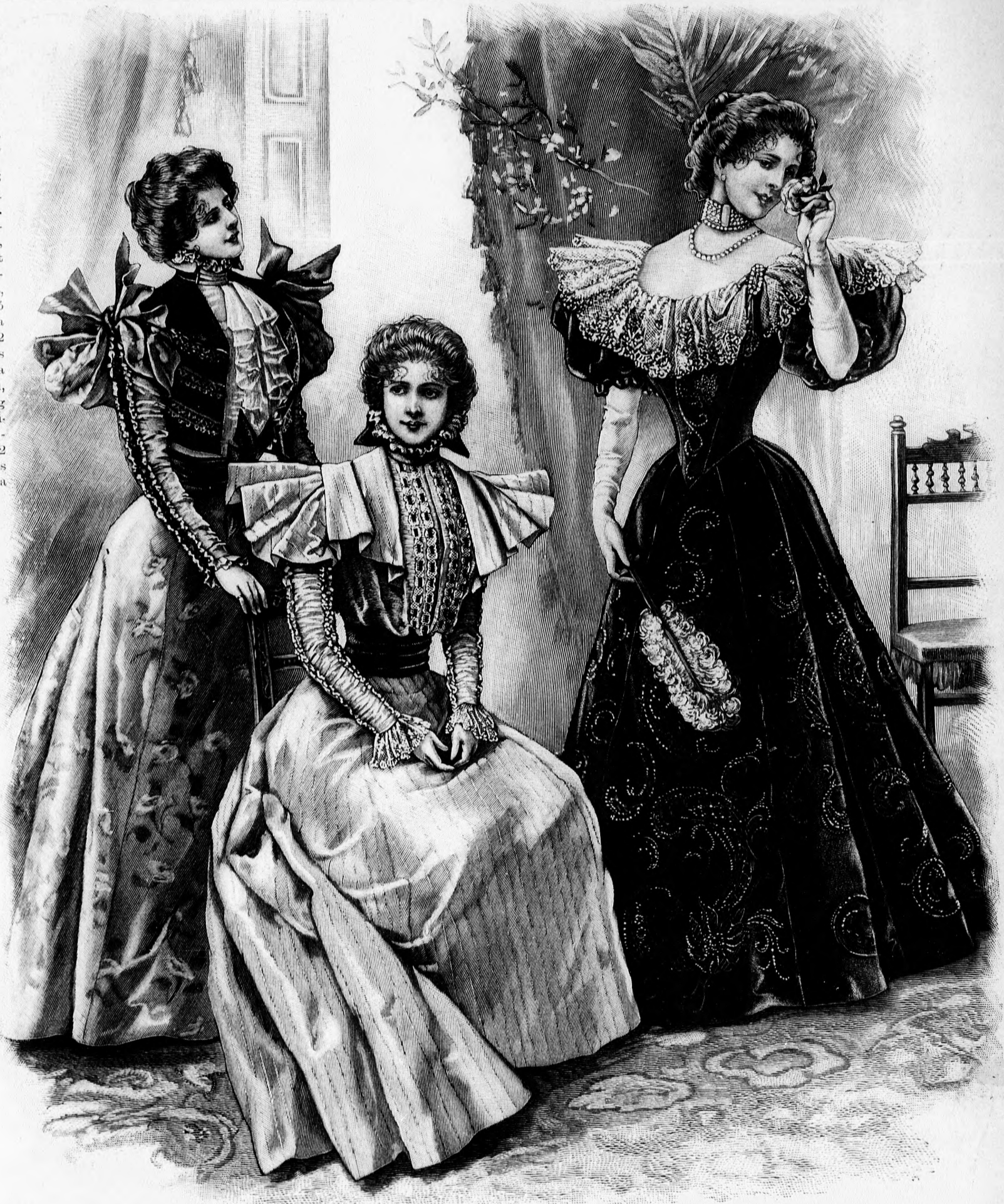
27. sz. Diszes ruha bársonyszakettel. Ehhez 8. sz. A szakett szab. és magy.: a mintaiv XXIII. sz., 137-141. fig. A szoknya szab. lásd a magy.