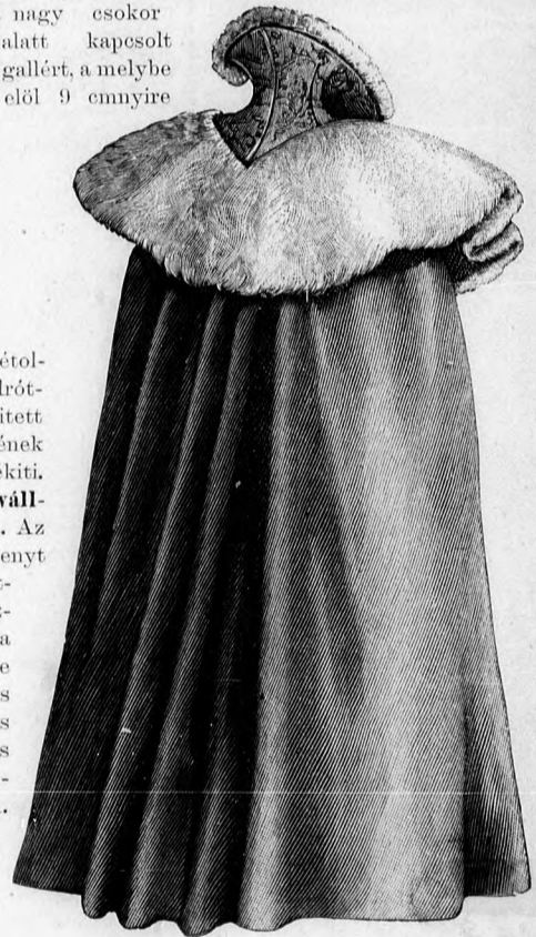
17. sz. Hosszu köpeny himzett pánttal és vállgallérral. Szab.: mintaiv IX. sz., 24–29. fig.

17. sz. Hosszu köpeny himzett pánttal és vállgallérral. Szab.: mintaiv IV. sz., 24–29. fig. Az eperszin kömlyü posztóból készült köpenyt ugyancsak eperszin vattás atlaszbéléssel látjuk el, a melyet azonban csak akkor illesztünk a köpenybe, ha ennek az előrészeit a karok átdugására való hasíték figyelembe vételével a hátrészhez illesztettük. A belés egyben megy az egész köpenyen végig és baloldalon egy 20 cm. széles, 23 cm. magas zsebbel van ellátva. A köpeny hátulsó ráncait a csillaggal jelzett helyen egy 35 cm. hosszú kelmepánt fogja össze. A pántot a vele egyben vágott gallérral együtt acélpillangóval kivarrt eperszin gép-