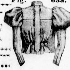
Fig. 63a. 64. fig. Előrszín felosztása. 65. fig. Hátrész felosztása. 66. fig. Vállgallér első része. 67. fig. Vállgallér hátrész fele. 68. fig. Felső és alsó ujj (behajtogatással). 69. fig. Kézoldó fele. 70. fig. Az eredeti nagyságban adott minta kis rajza.

Fig. 57a. 57. fig. Előrszín felosztása. 58. fig. Hátrész felosztása. 59. fig. Vállgallér első része. 60. fig. Vállgallér hátrész fele. 61. fig. Felső és alsó ujj (behajtogatással). 62. fig. Kézoldó fele. 63. fig. Az eredeti nagyságban adott minta kis rajza.