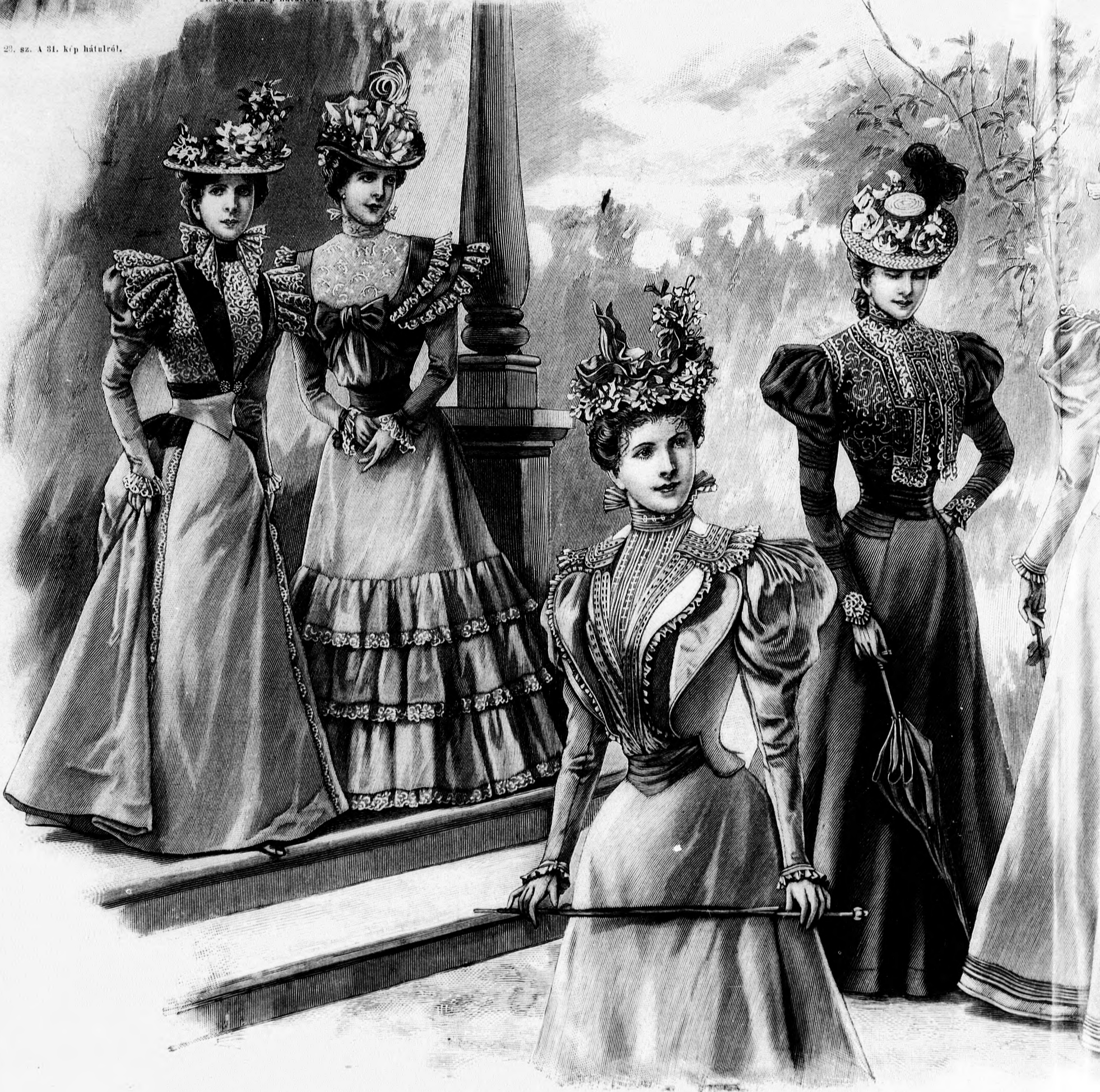
25. sz. Ruha hímzett szövethű szabott derékkal. Ehhez 42. sz. Szab., magy.: mintaiv XVII. sz., 110—116. fig. Kiegészítő szabásrészeket lásd a mintaíven.

betét felett tűzött szegélyből áll (lásd a 29. k. borító, jelzés szerint jobboldalt felvarrt, balra ismét szalmaszál szélességű szegélyekbe varrt szegélyből összeállított rész borul. Az elejére ezen a 14. fig. szerint szabott fűrészeket szá- és vonalzólag oldalt keresztet pontra téve, alul) kereszt szabadon maradt szélekre egy-egy 11 cm. széles hímzett betétsávot alkalmazunk, melyek alul egy vége mintegy folytatása a 17. fig. szerint szabott határolt 5 1 / 2 cm. széles betéttel díszített vállnyire egymást fedik. Egyébként a vállba, karöltőre és selyemmel bélelt, két soros paszpollal szegett részek borítják az elejét, melyekben a mellvarrás alá helyezük a sima vonal mentén felvarrt, dupkeskeny selyemfodorral határolt hajtókát, mely vonalon kitűrünk. Az állógallérba hátul 6 cm. egyébként szegélyekbe varrt lila és divatszínű széles aranygaldoból összeállított díszszel borít-