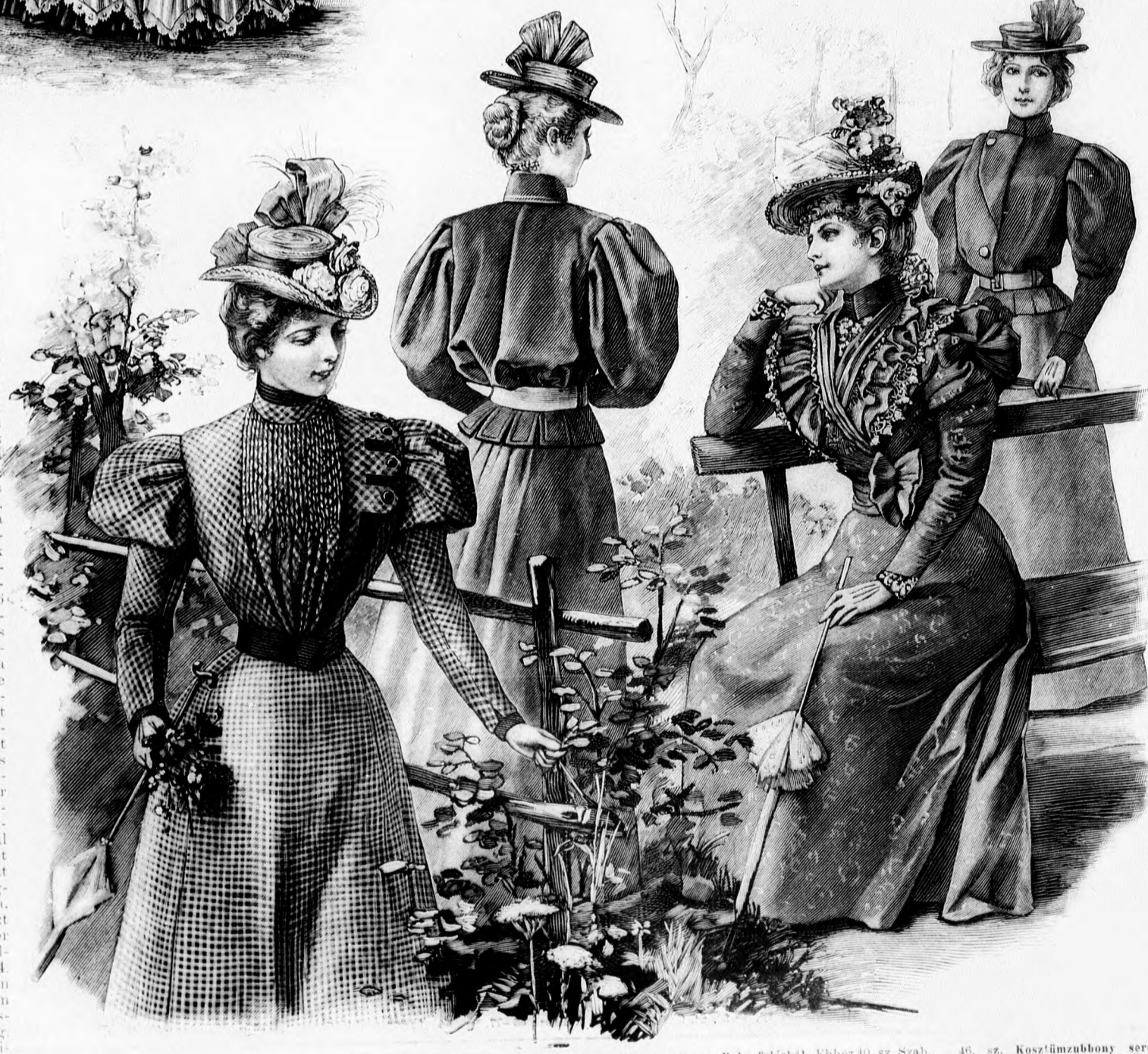
43. sz. Ruha átkapcsolt előrészszel. Ehhez 38. sz. Szab.: mintáiv VI. sz., 38. fig. Kiegészítő szabásrészeket lásd a mintáiv és magy.