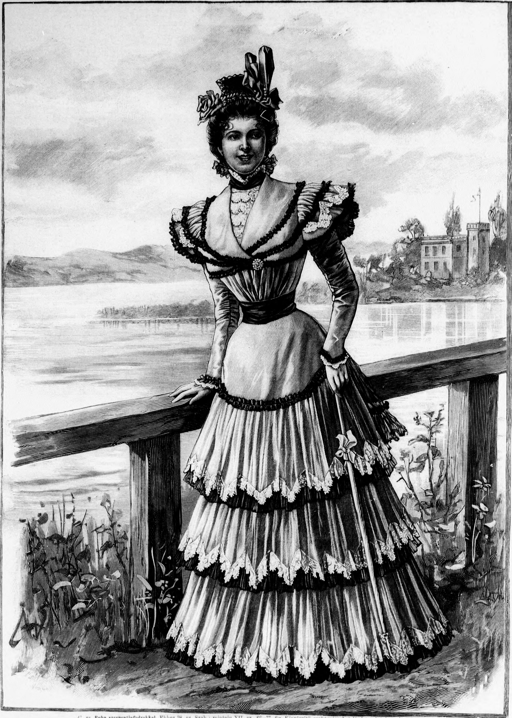
47. sz. Ruha szerpentinfodrokkal. Ehhez 38. sz. Szab.: mintaiv XII. sz., 66-77. fig. Kiegészítő szabásrészeket lásd a mintaiven és nagy.

Felelős szerkesztő: Csepreghy Ferenéc. Kiadótulajdonos: Rákosi Jenő Budapesti Hírlap újságvállalata (igazgató: Zilahy Simon). Budapesti Hírlap nyomdája.