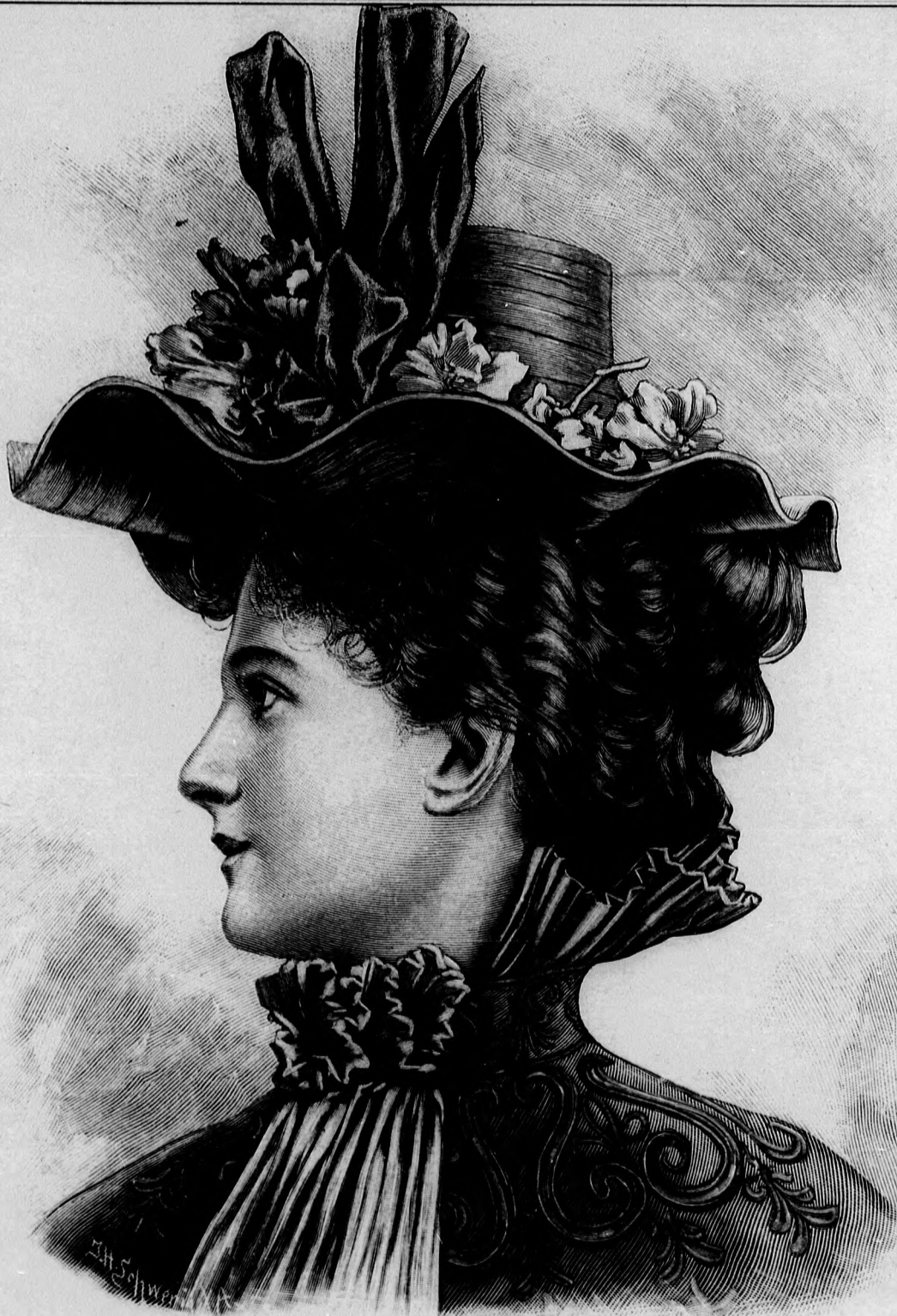
1. sz. Kalap hegyes tetővel.

A tompa, egy színű kasmír-, sevíó- vagy szerzruhákat nagyon szeretik eltérő színű tűzött öltés vagy sujtás és zsinór-sorokkal ékíteni. Majdnem valamennyi tavaszi kimenőruha szoknya és nyitott zsakettből áll, a mely alatt vagy egész selyembluzt vagy csak selyem és csipkéből összeállított smizettet viselnek. A bluz lehet a ruha zsinórdiszével egyforma, de lehet bármily feltűnő színű selyembluz is. Az ilyen ruha fürdőn is szinte nélkülözhetetlen a reggeli séta alkalmával. A mi a déli vagy délutáni sétára vagy akár házi ruhára is divatos szint illeti, az, ha a jelek nem csálnak, ez idén az égő pipacsvörös lesz. Megérjük, hogy ez idén a fürdői sétáló helyeken selyem-