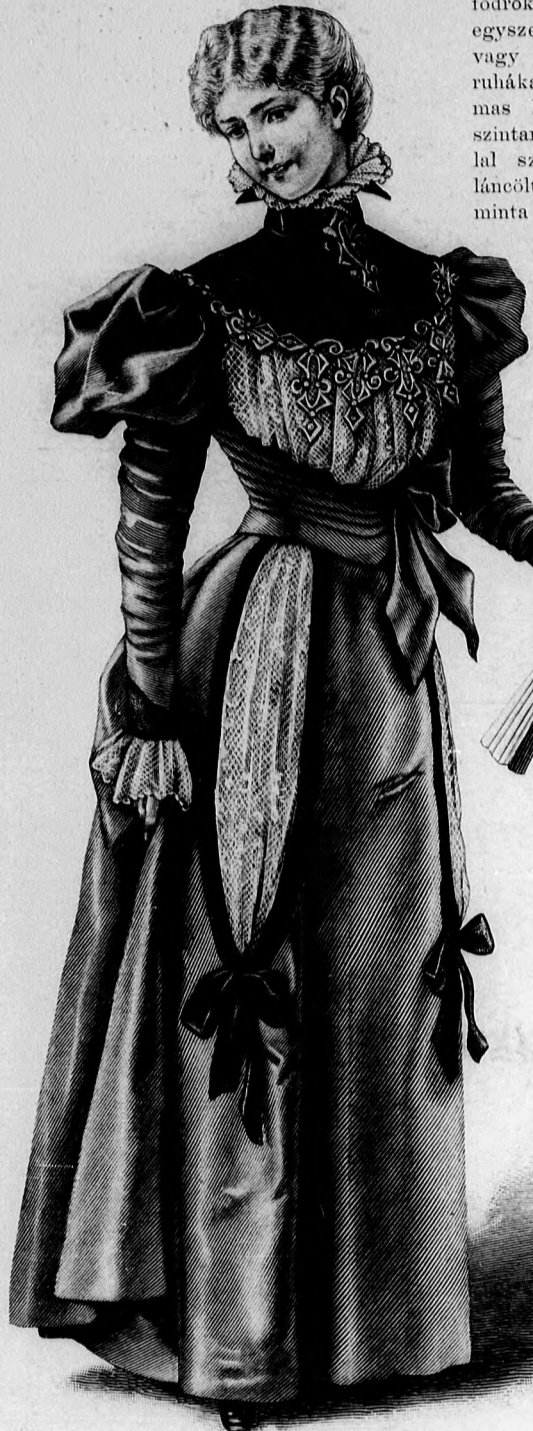
2. sz. Társaságha való ruha fiatal asszonynak. Ehhez 5. sz. Szab. magy.: mintáiv XVI. sz., 107. fig. Kiegészítő szabásrészeket lásd a mintáivon.

legyezőszerű ráncokba van égetve, persze szinte selyembélés fölé, a melyet tetszés szerinti színben választhatunk a világos ruha alá. Az ilyen ruha összes disze rendszeren csak egy széles selyemöv, a melynek hátul két hosszú salangos vége a szoknya széléig ér. A bluz legujabb formája a háton átkapcsolt, a kapcsolást persze csipke és egyéb