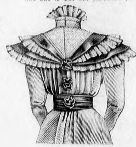
41. sz. A 26. sz. hátulról.