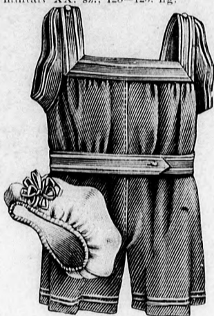
6-7. sz. Füredőruha és füredősapka 6-10 éves leánynak. Szab.: mintáiv V. sz., 35-37. fig.

sze gyanánt kezdik viselni. Ma már csak egy kis apróság az ilyen gallér, arra való, hogy a vállfüzből kiálló felső testrészt egy kissé védje a hűvös idő ellen, ennyiben nemcsak szép, de igen célszerű is és sajátosan díszíti