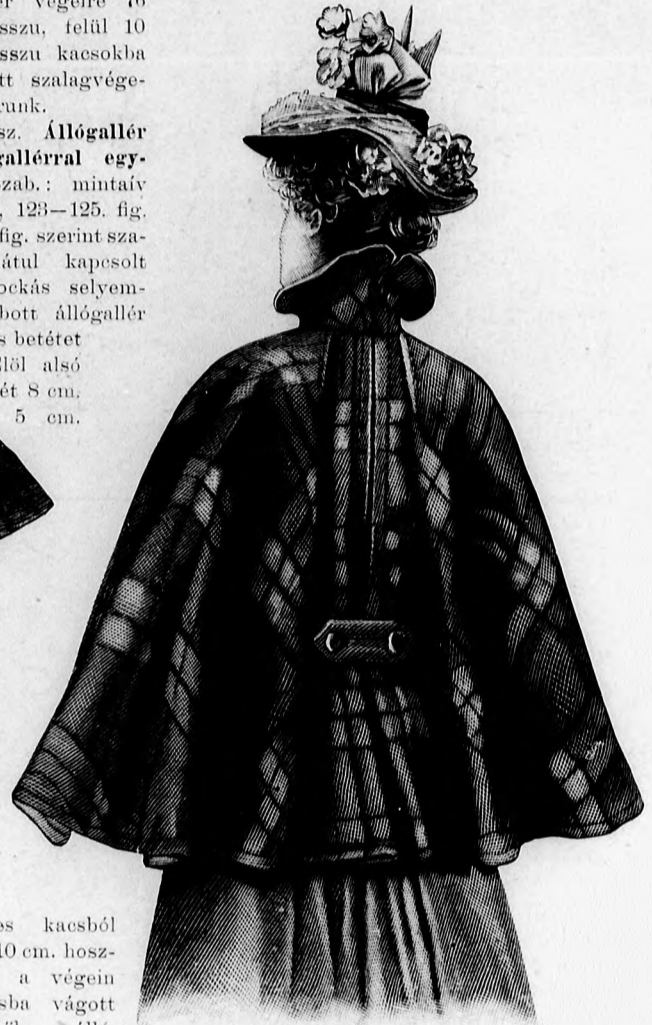
5. sz. Felöltő harangujjakkal kutra járásra alkalmas. A 37. sz. hátképe. Szab. magy.: mintáiv I. sz., 1-7. fig.

4. sz. Állógallér lehajlógallérral egyben. Szab.: mintáiv XX. sz., 123-125. fig. A 123. fig. szerint szabott hátul kapcsolt tarka kockás selyemből szabott állógallér bélést és betétet nyer. Elöl alsó szélét két 8 cm. hosszú, 5 cm.