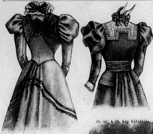
24. sz. A 23. kép hátulról.