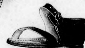
15. sz. Cipő füredés után vagy parti sétákra gyermeknek.

9-14. sz. Füredőruha, füredőköpeny, cipő és sapka hölgyeknek. Ruha és cipő szab.: mintáiv III. sz., 22-29. fig. A kék gyapotköpönyből készült 9. sz. öltözet bluz és nad-