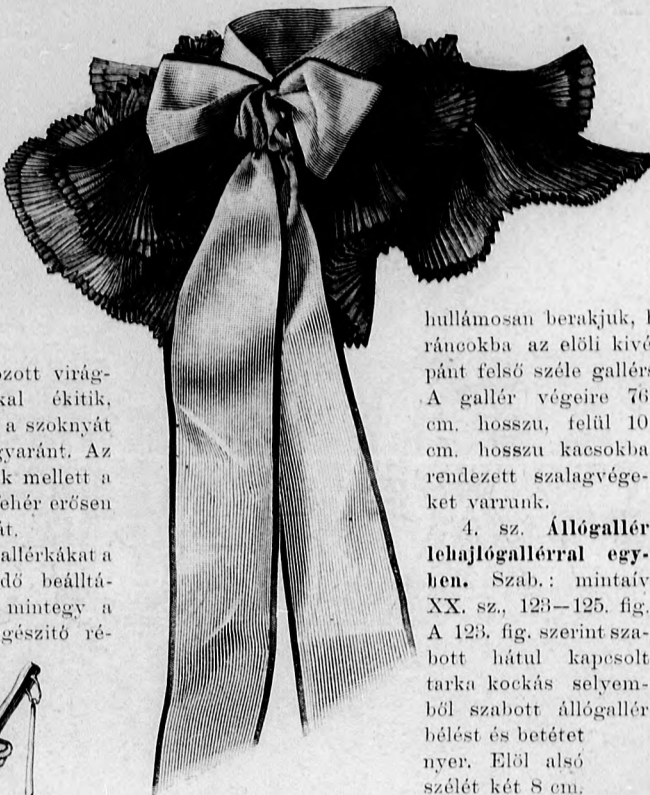
3. sz. Vállgallér gázfodorral. Szab.: mintáiv XII. sz., 127. fig.

A kis gallérekakat a melegebb idő beálltával ismét, mintegy a toilette kiegészítő ré-