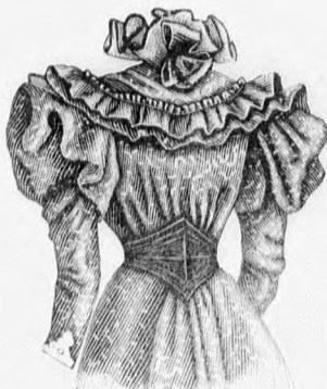
40. sz. A 45. sz. hátképe.