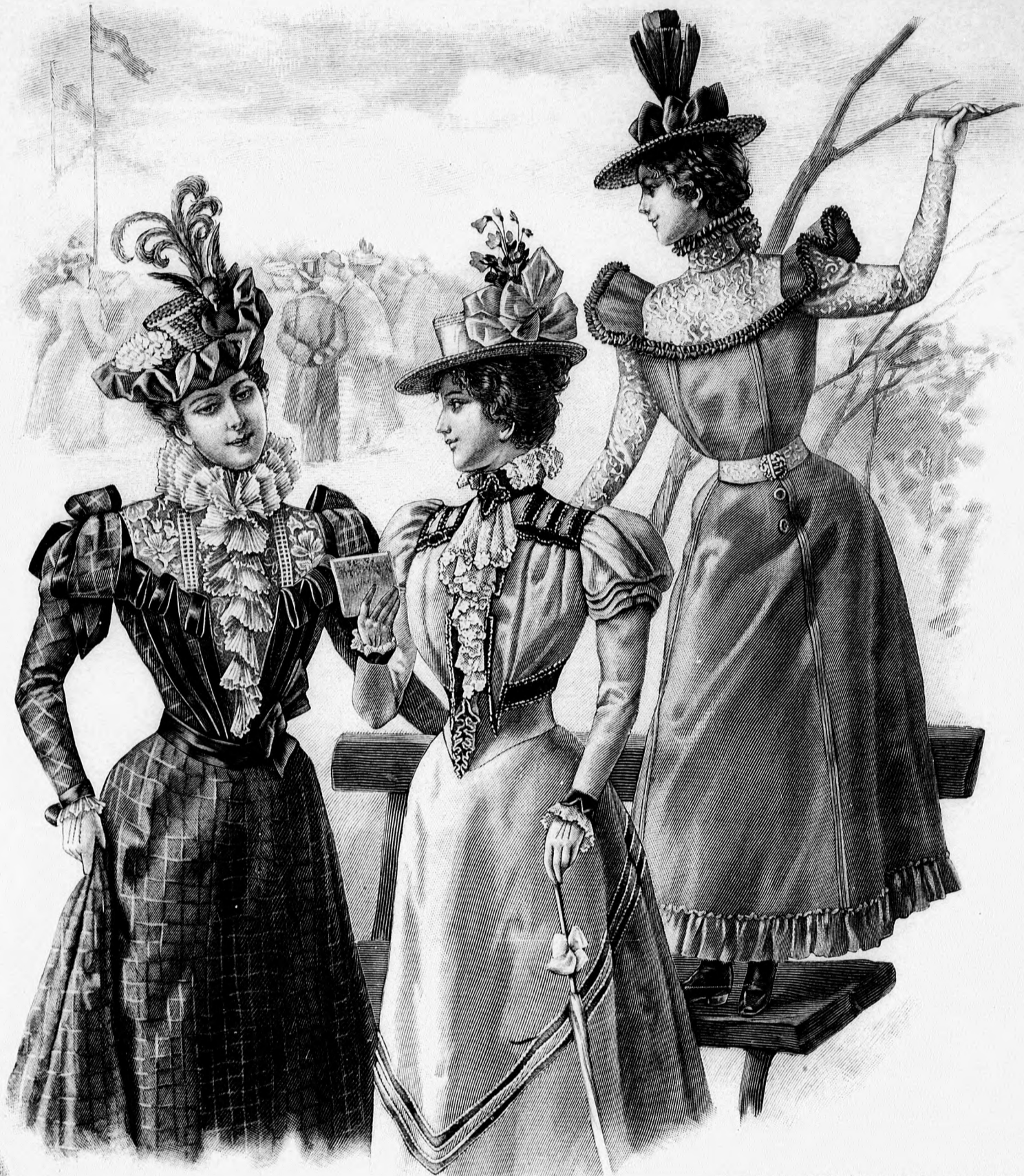
30. sz. Ruha szalagdíszszel. A 19. kép eleje. Szab.: mintáiv XI. sz., 64. fig. Kiegészítő szabásrészeket lásd a mintáiv és magy.

ből áll (lásd a 29. képet). Az elejét először a kapcsolást oldalt felvart, balra átkapcsolt ellenző takarja, melyre szegélyekbe varrt selyemsávokból és 1 cm. széles gipür- ról. Az elejére ezenkívül még a divatszínű selyemből a szeket szá- és vonaljelzés szerint varrjuk fel, megelő- téve, alul) keresztet a) pontra téve berakjuk. Az elől egy-egy 11 cm. széles, aranyfonállal átszött, krémszínű munk, melyek alul egymáson átkapcsolódnak. E betét felső 7. fig. szerint szabott, 2 1/2 cm. széles huzott csipkével tétellel díszített vállgallérrészeknek, melyek hátul 4 cm. rént a vállba, karöltőbe és oldalvarrásba foglalt, vászon- soros paszpollal szegett, 15. fig. szerint szabott szakett- egekben a mellvarrásokat kidolgozzuk. A szakett- mten felvart, duplaszövetből a 16. fig. szerint szabott tárolóhajtókát, melyet a szakettel egyben a pontozott alléba hátul 6 cm. széles lila plüsszédrotot félcelünk, lila és divatszínű selyemsávból, gipürbetéttől és 1/2 cm. állított díszszel borítjuk. A derék alsó szélét elől 18 cm.