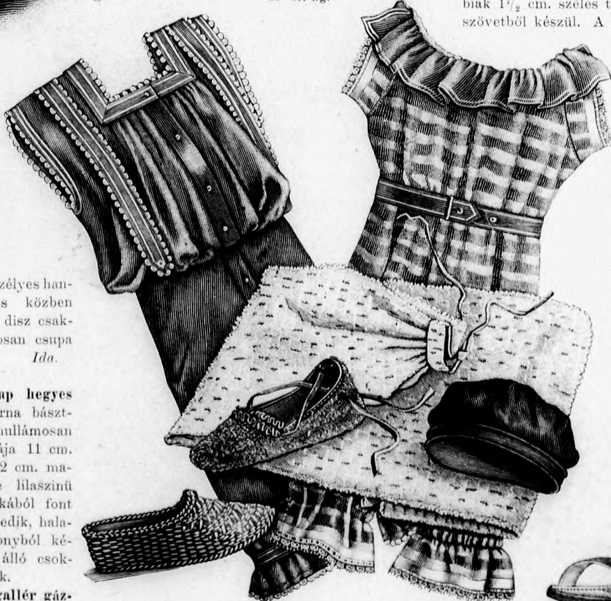
9-14. sz. Füredőruha, füredőköpeny, füredőcipő és sapka hölgyeknek. Ruha és cipő szab.: mintáiv III. sz., 22-29. fig.

könnyű nyári ruhákhoz jól illő gallér selymes-szélű, 25 cm. széles, plisszírozott fekete gázcsikból készül, azonkívül 1/2 cmnyi bársonysávval szegélyezett, 8 cm. széles sárga atlasz-szalag szükséges hozzá. Alapját fekete taftótól a 117. fig. szerint duplaszövet- és betétből álló keskeny vállpánt képezi, melyre először alsó szélén, azután felül a vállpántot takarva 25 cm. széles gázfodrot erősítünk. A felső fodrot előli szélén és még három helyütt egyenlő közökben