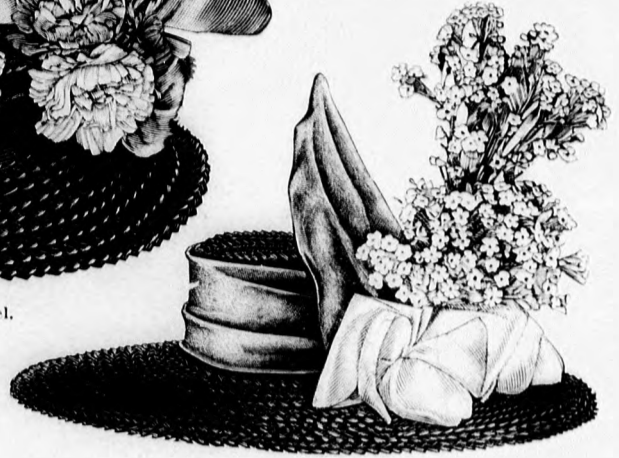
35. sz. Kerek kalap serdülő leányoknak.

pontjelzés szerint berakjuk, jobb oldalt vállba, karöltő és oldalvarrásba foglaljuk, nyakban és derékban a bélésre erősítjük és balra átkapcsoljuk. Az áthajló előli szélét alája helyezett fekete szörgalánd, minden nyelvet 1-1 nagy zsettgomb díszít. Az április közepén megjelent számunk 33. fig. szerint szabott állógallért kép szerint a fent említett galand ékesíti. Bélés- és felsőszövet-ujjak szabását április elején megjelent számunk 27-28. fig. adja. A belső- és külső varrás mentén nem húzzuk be, hanem lefelé fordított ráncba rakjuk és alul az ujjat 2 cm. szélesen szegélyező galandot varrunk. A szoknyát ugyanazon mintáiv 69. fig. szerint szabhatjuk. Széle 30 cm. széles, betétet elátott lényöbe foglalandó, melyet oldalt kapcsolt kaesban végződő galandsáv takar.