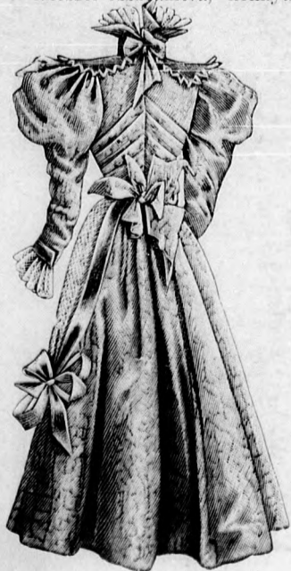
8. sz. A 2. sz. hátképe.

A divatos kalap manapság olyan forma, a milyenre a divatárus nő szeszélyes hangulata díszítés közben hajtogatja. A dísz csaknem kizárólagosan csupa virág.