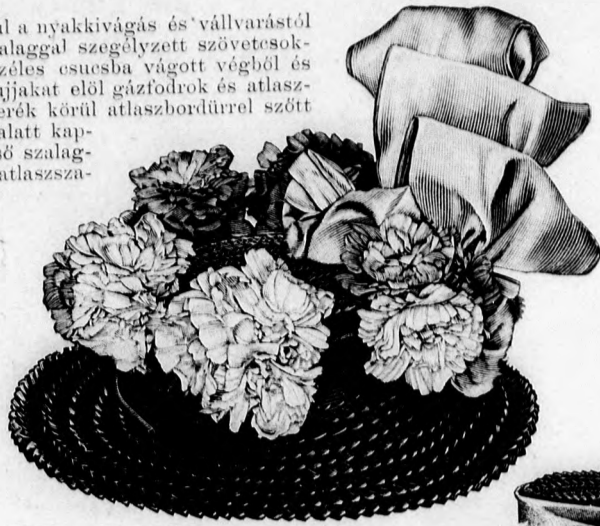
31. sz. Kalap virág- és szalagdíszszel.

43. sz. Ruha átkapcsolt előrészszel. Ehhez 39. sz. Szab.: mintáiv VI. sz., 38. fig. Kiegészítő szabásrészeket lásd a mintáiv és a magy. A fekete-fehér kockás gyapjuszövet ruhán szálegyent vesszük a részeket a rüsz szövettel szabott átkapcsolt előrész kivételével. A bélésderék (április elején megjelent számunk 17-20. fig.) 1. oldalrészeit, valamint a bal elejét külön-külön stina, a 2. oldal- és hátrészt