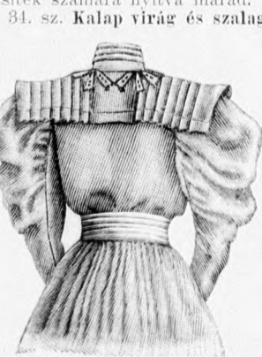
36. sz. A 33. kép hátulról.

vágjuk; és miután a bélés oldal- és hátrészt összevarrtuk és az elején a mellvarrásokat kidolgozzuk, először a vállpántot varrjuk fel, azután a bélést a derékban behuzott felsőszövetrészekkel borítjuk a bal előrész kivételével, melyet pánttal bélelünk. A jobb elején felül a) keresztet a) pontra erősítjük, balra áthajló szélét a) keresztig behajtjuk és felül a vállpánthoz varrjuk, mely felvarrását selyemrüss takarja. Jobb oldalt a behuzott válldísz 97-től 99-ig a karöltőbe foglaljuk, baloldalt a vállpánthoz erősítjük és a karöltő mentén a hátsó pontra kapcsoljuk. Az április elején megjelent számunk 45. fig. szerint szabott szoknya első lapja 2 cm-rel tulmenjen az oldallap szélén, a varrás jobb oldalt zseb-, baloldalt hasiték számára nyitva marad. Végig bélést, alul 12 cm. széles fodrot nyer.