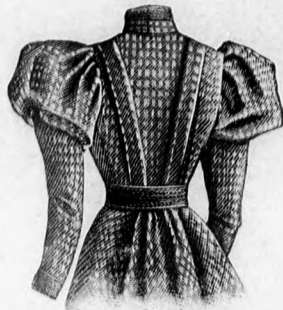
39. sz. A 43. sz. hátulról.

lét 3 cm. széles tüllrüssök szegélyzik. A cakkos ujjfodor szélére, valamint az ujjakba hímzést varrunk. A szoknya felső szélére varrt, elől-hátul halesonttal ellátott, hátul kapcsolt széles övet a 75. fig. szerint szabjuk és berakott tülllel borítjuk. Hátul két 36 cm. széles, 42 cm. hosszú, 13 cm. széles fodorral szegett, fenn sűrűn behuzott duplaszövetből vágott esarpót alkalmazunk. Az öv tarajosan húzott fodor alatt kapcsolódik. A béleletlen, csakis az első vonalig betéttel és béléssel ellátott szoknya szabását a kis rajz 65. fig. adja. A két alsó fodrot jelzés szerint varrjuk fel, a harmadikat a tunikára erősítjük. A kerek szabásu fodrokat felső szélén keskeny, alul szélesebb ráncokba vasaljuk. A tunikaszerű rész szabását felében a 66. fig. adja: hátul kereszt- és pontjelzés szerint berakjuk. A felső fodor számára a 67. fig. szerint közepén végig egészen 1 részt szabunk, a 68. fig. szerint pedig, melyen a behajtás kiegészítendő, 2 részt vágunk. A középső fodor a 68. fig. szerint szabott 4 részt, az alsó