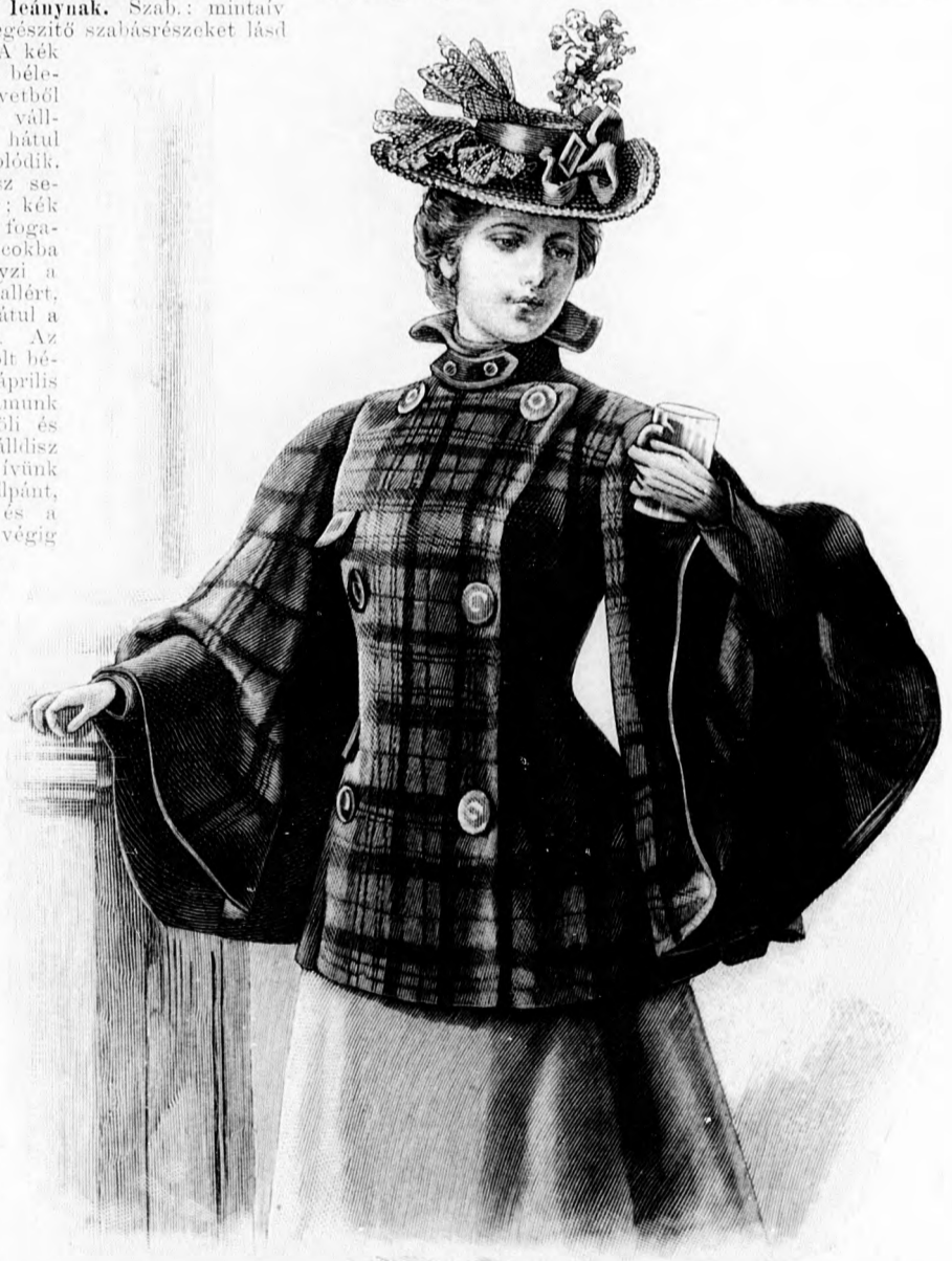
37. sz. Felöltő harangujjakkal kutra járásra alkalmas. Az 5. sz. előlől Szab.: mintáiv I. sz., 1-7. fig.

44-46. sz. Kosztümzubbony serdülő leányoknak. Szab.: mintáiv IV. sz., 30-34. fig. Kiegészítő mintarészeket lásd a mintáiv és magy. Eredetünk világoskék posztóbból készült, de kiválóan alkalmas szabásánál fogva arra, hogy megfelelő szoknyával teljes öltözetet képezzen. A kényelmes, bő hátrész, az eleje és az ujjak béleletlenek, a hasított lebleny és áthajlógallér duplaszövetből készül és betétet nyer, épp úgy, mint a megbélelt gallér. A hajtokával egy-