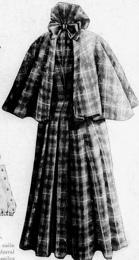
22. sz. Porköpeny vándorgallérral. Ehhez 20. sz. Szab., magy.: mintaiv XIII. sz., 78-83. fig.