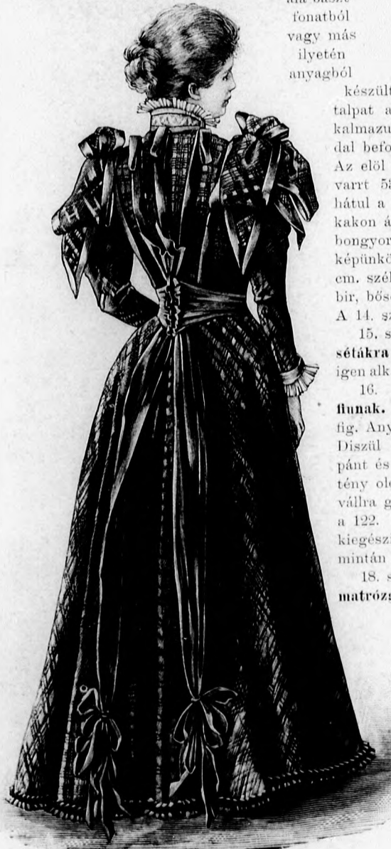
19. sz. Ruha szalagdíszű. A B. kép háta. Szab.: mintaiv XI. sz., 64. fig. Kiegészítő szabásrészeket lásd a mintaivon és a magy.