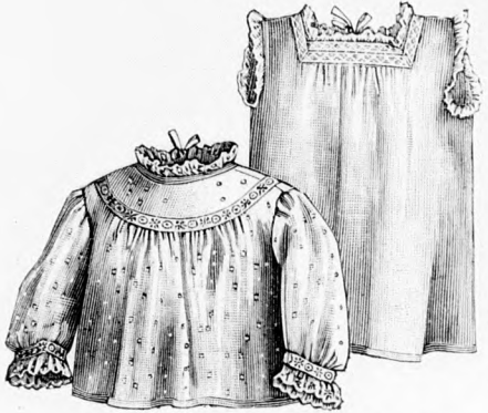
7-8. sz. Babaujjas és ing. Szab. és magy.: mintáiv XI. sz., 62-68. fig.