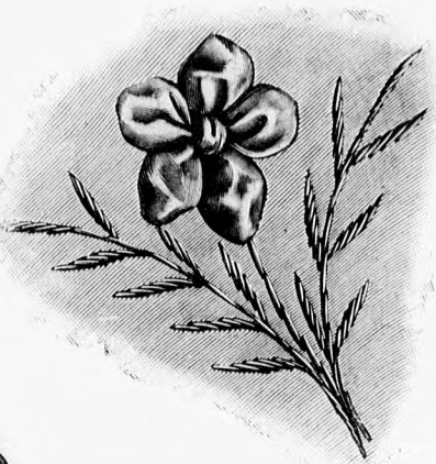
10. sz. Gallérdisz a 12. számhoz. (Természetes nagyság.)

25. sz. Reformruha pántídszettel. Ehhez 27. sz. Szab. és magy.: mintáiv I. sz., 1-9. fig. A divatoszínű etaminruhán a látható módon alkalmazott pántídszettel gazdagon átűzzük és tafotapaszpollal látjuk el. A vállgallért 9 cm. széles, fehér posztópánt és divatoszínű posztóból készített szőlő- és