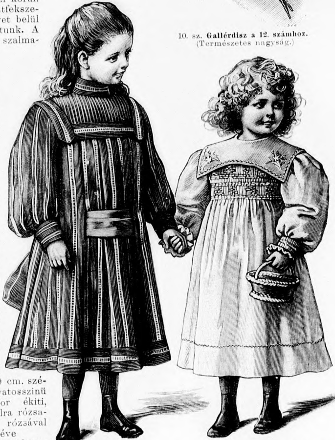
11. sz. Csüngőruha esarppal 4-6 éves leányoknak. Szab. hátkép és magy.: mintáiv IX. sz., 50-55a. fig.