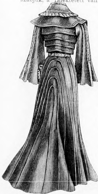
46. sz. A 61. szám háta.