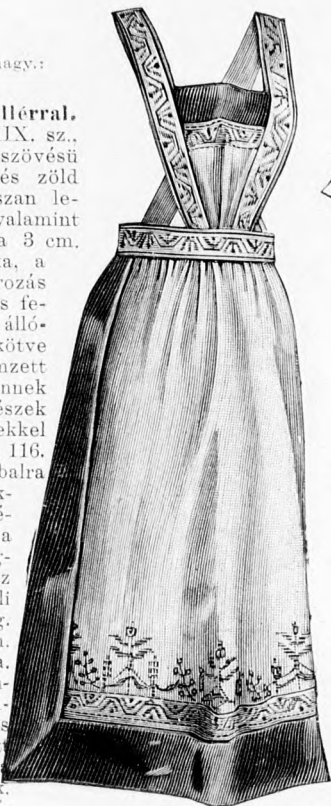
42. sz. Kötény tarka himzéssel. Ehhez alaprajz: mintáiv 73a. fig.

41. sz. Tarsoly. (Pompadour.) A világoskék és fehér mintázatu velourcsíkos ripszből készített elegáns tarsolyba bodrozott összekötő részeket foglalunk. A matt acélfoglalást szimilivel és türkiszszel díszítjük és aprózemű lánchoz erősítjük.