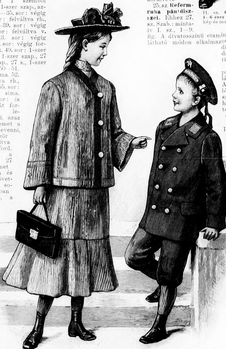
15. sz. Ruha zakettel 12-14 éves leányoknak. Szab. hátkép és magy.: mintáiv XXI. sz., 127-131a. fig.