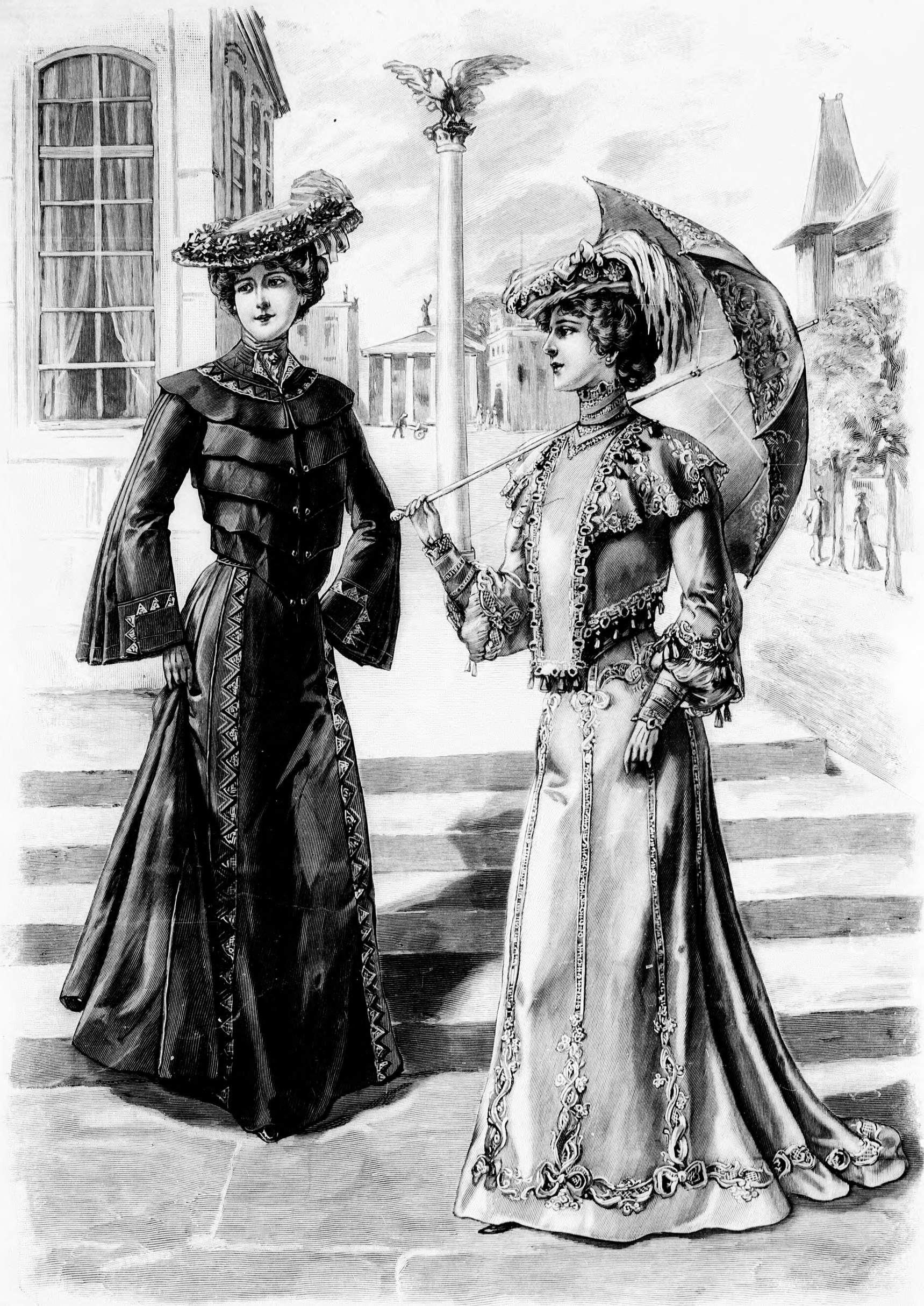
64. sz. Sétaruha pántszerűleg díszített zaketes derékkal. Ehhez 46. sz.