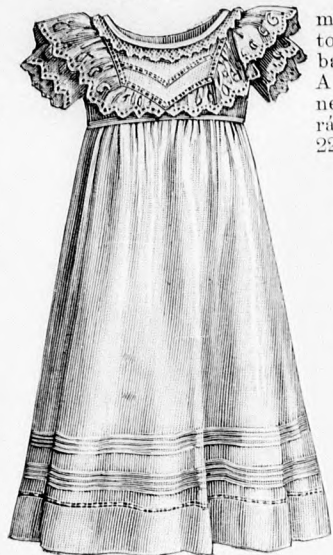
6. sz. Vivóruha batiztból betétídszettel. Szab. és magy.: mintáiv XIII. sz., 72. és 73. fig.