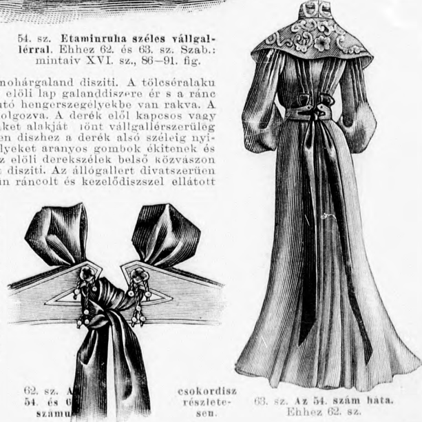
62. sz. A 54. és 63. szám