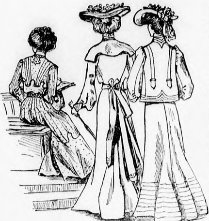
17-19. sz. A 35-37. szám háta.