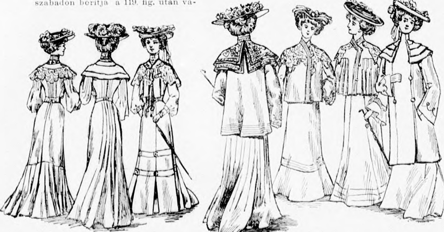
55-57. sz. A 28-30. szám háta és eleje.

65. sz. Nyári ruha himzés- és csipke-díszszel. Ehhez 50. sz. A halvány fehér posztóruha himzése hasonló szövetszőből való, széles, izezett bordúrán, sarga-kek selyem- és aranyonállal, laposhimzésrel van kidolgozva. A himzés iven 3/4 cm. hosszú harkolt hasítékok vannak, kettősevel sűrűn egymás mellett, a melyeken keresztül keskeny fekete hárszonszalagot húzunk át. Kek-fehér rojtok díszítik a derék zaketjét és ujjakat. A szoknyát és deréket pedig, a látható módon keskeny spachtelbetét és hasonló csipkefigurák ékítik. A derék a szoknyát főt és a meddig a zaket alul kilátszik, bodrozott fehér sifonnal van borítva.