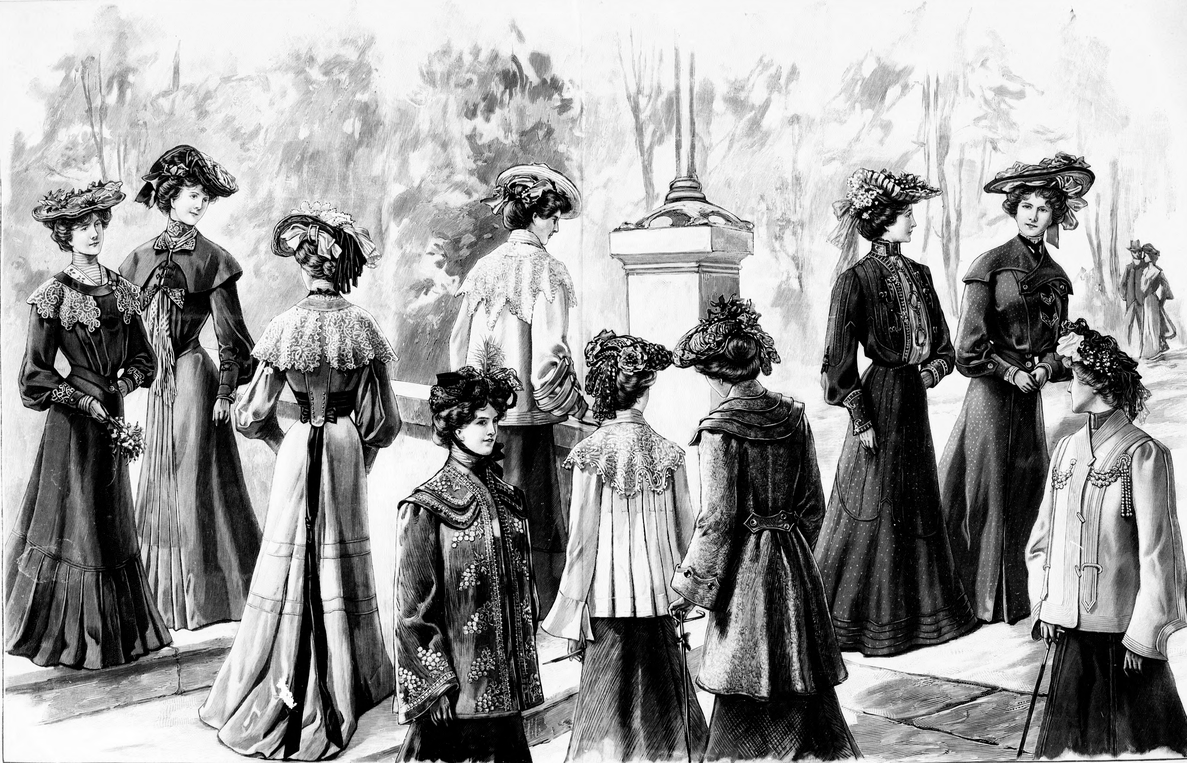
28. sz. Ruha szalagból való gallér és közelével. Ehhez 55. sz. Szab., magy.: mintáiv XV. sz., 79-85. fig.