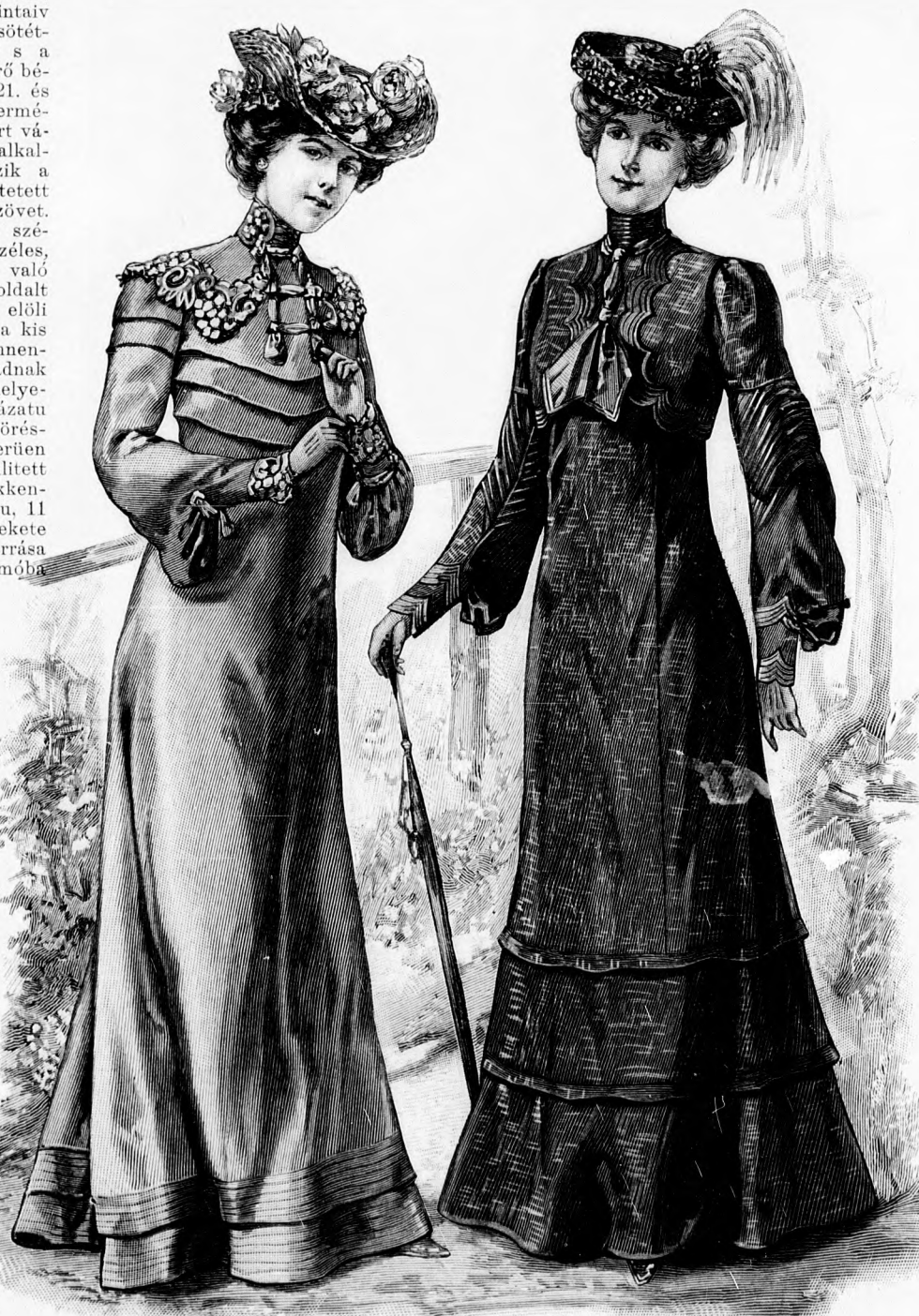
25. sz. Reformruha pántdíszszel. Ehhez 27. sz. Szab.: mintáiv I. sz., 1-9. fig.

35. sz. Ruha pánt- és paszpoldíszszel. Ehhez 17. sz. A sötétszürke-fehér mintázatu gyapju-