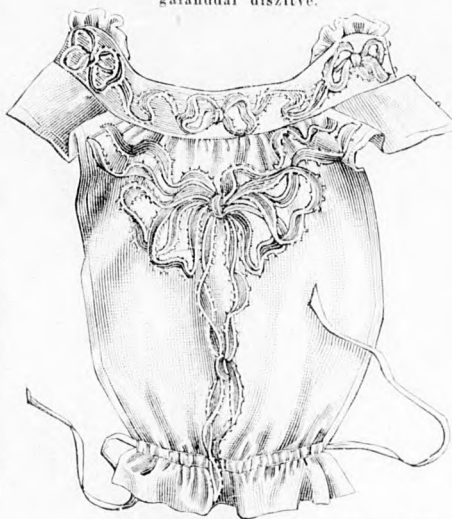
43. sz. Betét bársony rátétdiszszel zakates ruhákhoz. Szab. és magy.: mintáiv XII. sz., 69-71. fig.