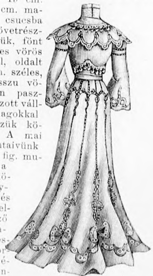
50. sz. A 65. szám háta.

42. sz. Kötény tarka himzéssel. Ehhez alaprajz: mintáiv 73a. fig. Az 52 cm. széles, 70 cm. hosszú kötényt részben barnás drellből készí- tük és 9 cm. széles élénk- vörös drell- esik- kal szegé- lyez- zük. A kö- tényt fönt 22 cm. szélesen behuzzuk s egy 4 cm. széles, vörösen paszpoldiszszel, 48 cm. hosszú egyenes lényöbe foglaljuk, a vörös csíkok simán maradnak. A kötő- szalagok 6 cm. szélesek, 52 cm. hosszuk. A lényöt 19 cm. széles, 20 cm. magas, alul csuesba ráncolt szövetrészből készítjük, fönt 3 cm. széles vörös drellesikkal, oldalt pedig 4 cm. széles, 90 cm. hosszú vö- rösen paszpoldiszszel váll- szalagokkal vesszük kö- rül. A mai mintáivünk 73a. fig. mu- tatja a kö- tényt- szel és az el- lenző him- zését. A kes- keny szelbor- dűrből ké- szítjük a lé- nyöt s a váll- szalagokat.