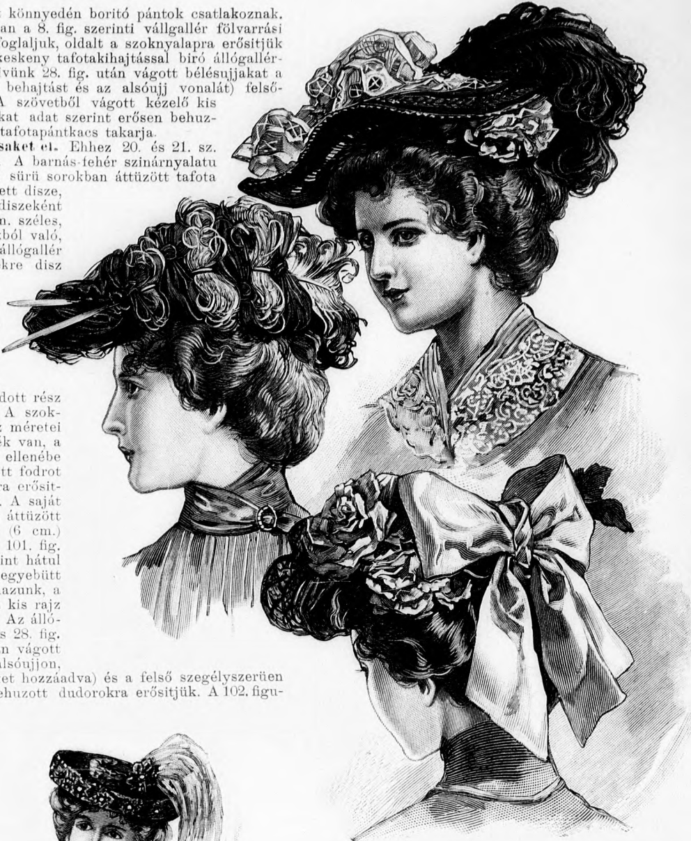
22-24. sz. Divatos kalapok.

bugygyosan ráfektetve fődik a felsőszövetujjak fölvarrását; a kézelőn adva van az alsó fél, az áttűzött pánt és a fűnt áthajtott lap rajza, a melyen alul szegélybe varrt foglaló látszik ki. A bélés szoknyát a 119. fig. szerint szabjuk plüssétoldással és a felső szövet szoknyával együttesen lényöbe foglaljuk. A 120. fig. után vágott egyszerű szoknyarészeket kereszt és pont szerint az adott hosszban letűzött ráncokba rakjuk, oldalt pedig bevarrással látjuk el.