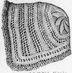
5. sz. Gyermekfejkötő. Kötés és horgolás.