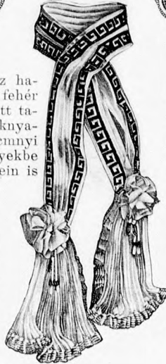
39. sz. Kabátgallér szalagmunkából és filészetből selyembetettel.

más ellen fektetett ráncokat, az adott hosszban letűzzük. Az előrajzolt s a szoknya baloldalán kidolgozandó hasítékot a négyszeres, 13 cm. széles hátsó laporáncok el-seje takarja, a melyet előbb a törésvonalon 15 cm. hosszúra letűzzük. A szoknya felső szélét csipőbevarrás szükíti oldalt s a 119. fig. szerinti plissézével töltött bélészoknyával egy lényöbe foglaljuk.