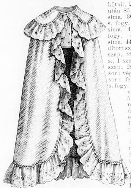
9. sz. Vivókabát rövid aláerősített ujjassal. Szab. magy. és belseje: mintáiv X. sz., 56-61a. fig.

míg más utasítás nem adatik, érintetlenül maradnak. 57. sor: a munkát fordítsd, leemelni (míg más utasítás nem jön, addig minden sorban a munkát fordítjuk s az első szemet leemeljük), végig simán. 58. sor: végig fordítottan. 59. sor: végig sima. 60-63. sor: egyenlő az 56-59. sorral. 64-68. sor: felváltva 1 sor végig simán, 1 sor végig fordítva (e szerint a színét. 5 fordítottnak látszó sor). 69-71. sor: látszó sor). 72-75. 76-79. 80-83. sor: szerint a munka színén 3 fordítottnak felváltva 1 sor sima, 1 sor fordított (e egyenlő az 56-59. sorral. 84-103. sor: egyenlő a 64-83. sorral. 104. sor: a munka megfordítása nélkül felveszünk a 103-56. sor szélszemeiből 22 szemet s simán lekötjük és most az 56. sor érintetlenül hagyott 27 szemjét szintén lekötjük s a most következő 56. sornak szélszemeiből egész a 103. sorig ismét 22 szemet simán lekötünk, azután a 103. sor valamennyi szemjét végig simán lekötjük. Ezután nem is fordítjuk többé munkánkat s ismét valamennyi meglevő szemem dolgozunk 105-109. sor: végig