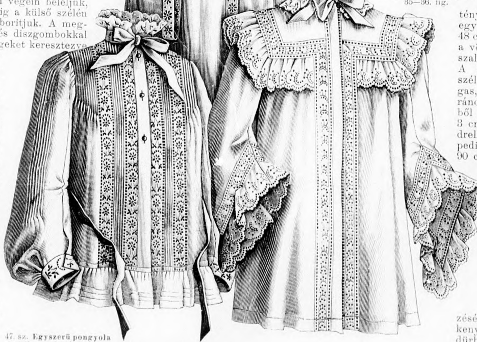
47. sz. Egyszerű pongyola szelvény és betétdiszszel. Szab., hátkép és magy.: mintáiv XXIII. sz., 138-140a. fig.