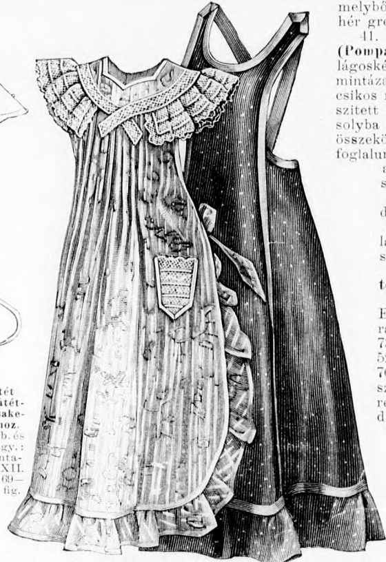
44. sz. Házikötény a reformviselethez. Szab., magy.: mintáiv VI. sz., 35-36. fig.