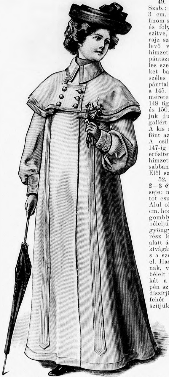
51. sz. Utazó- vagy esőköpeny dupla vállgallérral. Szab., magy., hátkép, valamint részlet a zseb alkalmazásához: mintaiv. II. sz., 10-16b. fig.

49. sz. Fésülködőköpeny hölgyeknek. Szab.: mintaiv XXV. sz., 145-151. fig. 3 cm. széles himzett betét egyesíti a finom sirtingköpeny vállpánt s alsóréseit és folytatódik a köpenyrészeket kiegészítve, elől az alsó széléig. A betét és rajz szerint behuzott köpenyrészek közt levő varrásba 9 cm. széles bodrozott himzett csikot (265 cm.) foglalunk vállpántszerűleg. A köpeny szélét 3 cm. széles szegéssel biztosítjuk. Az előli széleket balra gombos, jobbra pedig 3 cm. széles toldott hasíték alatt gomblyukpánttal látjuk el. Az alsó köpenyrészeket a 145. és 146. fig. után vágjuk, a kis rajz méretei szerint kiegészítve. A 147. és 148. fig. szerint a vállpántrészeket, a 149. és 150. fig. szerint pedig a foglalót vágjuk duplaszövetből, valamint a lehajló-gallért himzésből a foglalóba erősítve. A kis rajz 151. fig. adja az ujjak felét, főt az alsó ujjfelek vonalának rajzával. A csillagtól csillagig behuzott, 146 tól 147-ig összevarrt és 147-tel a karöltőbe erősített ujjak alsó szélét 9 cm. széles himzett csik (119 cm.), 3 cm-rel magasabban pedig beékelt betét határolja. Elöl színes szalagsokrot alkalmazunk.