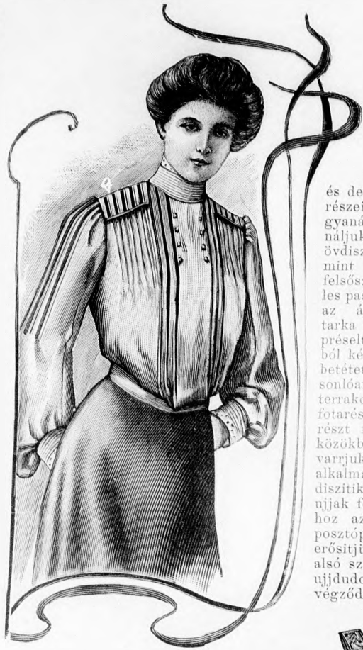
38. sz. Blaz paszpoldiszszel. Szab. és magy.: mintáiv VII. sz., 37-42. fig.

szövetruhát borvörös színű posztó, ezüstfó-nállal kivart fekete bársony, valamint fekete-vörös-fehér grelók díszítik. A posztót a szoknya és derék ivezett részén paszpoldiszszel gyanánt használjuk. A derék övdíszét, valamint az előli felsőszövet széles paszpoldiszszel és az állógallérét tarka mintázatu préselt bársonyból készítjük. A betétet az állógallér előli díszéhez hasonlóan sárgás túllból csináljuk, fehér terrakota színű selyemmel kihimzett tartarészszel díszítve. A felső szoknyarészt fönt mintegy 3, alul 8-9 cmnyi közökben sugáralakban hengergözegekbe varrjuk, a melyeket a fodor szélein is alkalmazunk. Hasonló szegélyek díszítik a derék és a felsőszövet-ujjak felső részét, a mely utóbbihoz az alsó részeket, illetve a posztópaspoldiszszel ellátott dudorokat erősítjük. A derék felsőszövetének alsó széléhez az övet csatoljuk. Az újdudorok a kapcsolt kézelőkkel végződnek.