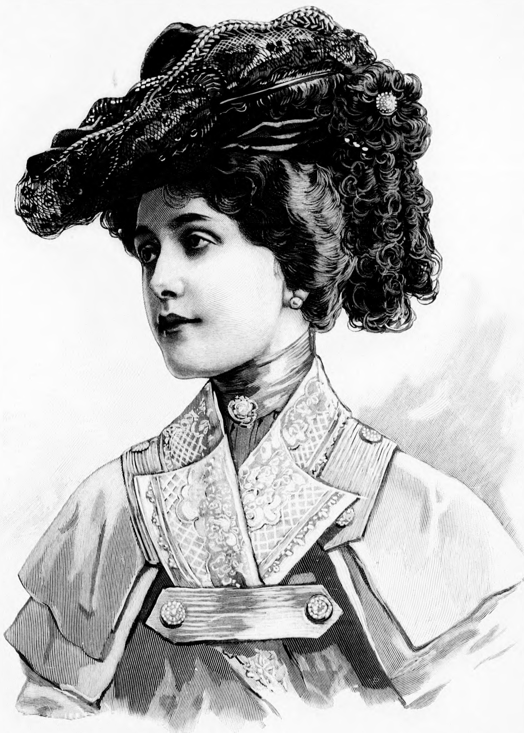
1. sz. Kalap tolldíszszel.

felül tágul, innen lefelé azután tetszés szerinti bőségre és hosszúságra varrathatja mindenki. A divat teljesen szabad kezét enged ebben, fő, hogy mindenkinek legalább egy rövid angol sétalóruhája legyen, a többi azután lehet hosszú. De utána a ruhát felfogni teljesen divatját multa, azért is a ki gyalog jár, elegáns rövid szoknyában jár. Hosszu szoknya látogatóba, zsorra és olyan tiszta sétálóhelyekre való, mint a Park-klub vagy a Margitsziget, a piszkos városban nem, hacsak kocsin nem járunk. De nem kell hinni, hogy a bluzok kivonulnak a divatból. Azt hiszem, hogy annyira megszoktuk őket, hogy el sem tudnánk lenni nélkülük. Kivált a selyembluzok nélkül, melyek otthon, színházban, utcán és uton, szóval mindenütt jók. Végezetül még a kelmékről kellene írnom, de helyszűke miatt alig lehet. Annyit mégis, hogy tavaszi ruhán az angol kelmék sokfélesége uralkodik, a későbbiekben pedig úgy látjuk, hogy az etamin, még pedig a legdurvább szálutól kezdve, a melyre majdnem szőnyeget lehetne himezni, a legingébb és legfinomabb szálú, majdnem fátyszerű etaminig és minden elképzelhető színben divatos. Azt hittük, hogy a színek közül az idén a szürke kerekedik fölül, de félelmünk fölösleges volt, azt lehetne mondani, hogy minden elképzelhető szép színi divat.