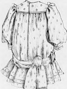
34. sz. A 39. szám háta