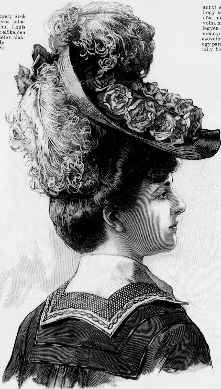
1. sz. Szalmakalap különös formával, rózsá- és tolldíszszel.

Különbözik pedig azt is rebesgetik, hogy a könnyű selyem és nyári selyem ez idén kiköncsül a divatból minden egyéb kelmét. No már ezt meg éppen nem hiszem, mert épp könnyű tavaszi, de kivált nyári szövetekben a gyárak által ilyenkor előre küldött minta-kollekciók