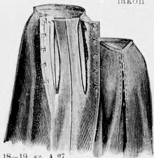
18-19. sz. A 27. számú szoknya rövidítve hátulról.

24. sz. Ruha bluzzal és kabáttal, paszpollal szegélyezve. Ehhez 55. sz. Szab.: mintáiv XVI. sz. 117-125. fig. Anyag: 5 m. hosszú, 110 cm. széles gyapjuszövet, 1/2 m. hosszú tükröbársony és 1/2 m. hosszú atlasz, 54-54 cm. szélességben, 1 1/4 m. atlaszpaspoll, 66 paszomántgomb hurokkal és 14 greló. A szürke, sötétzöld koc-