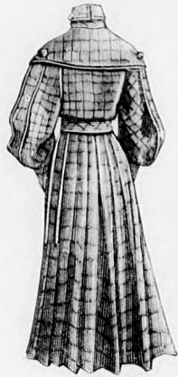
35. sz. A 38. szám háta

A csinos szabásu, előgombolt, tarkán színárnyalt, barna gyapjuszövetből készítettük. A magas kezelt, valamint a hátul fölgombolt le-hajtott gallérját zöld bőrrel díszítettük. A derek hosszában szerzsel bélelt kabátot hátul, a ráncolt hátrészre fekvő, belőle vágott pántok fogják össze.