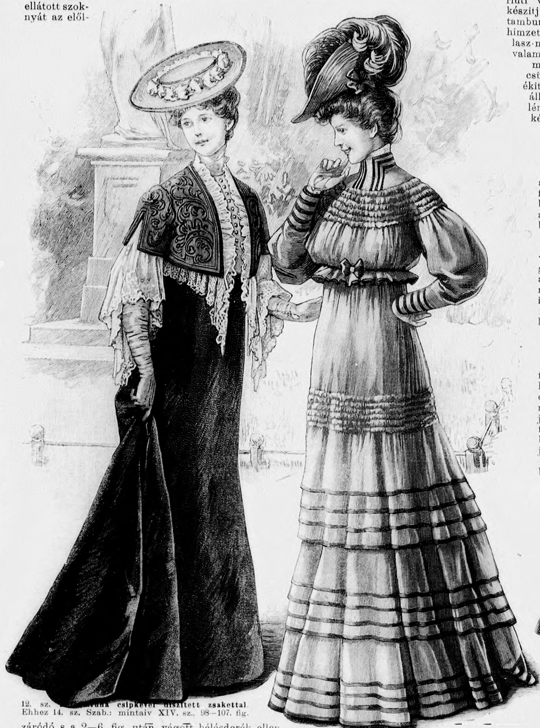
12. sz. Ruha csipkével díszített zsakkal. Ehhez 14. sz. Szab.: mintáiv XIV. sz. 98-107. fig.

bevarrással, hátul pedig állóránccokkal és kép szerint 12 cm. széles sötét és galanddal határolt díszszel látjuk el. Hasonló díszítése van a zsaket alsó szélének s a 7-9., valamint a kis rajz 13b. fig. után vágott lehajtott ujjaknak. A vállpántot a 10. fig. szerint aláfekvő mellényrészszel s a 14. fig. szerinti kézelőkkel, valamint a hátrésznek rajz szerint felerősített vállpánt díszét sötét szövettel készítjük. Az elől balra hasítékkal ellátott szoknyát az elől-