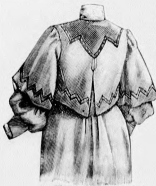
22. sz. A 23. szám háta.