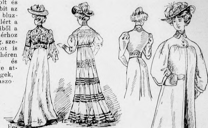
16-17. sz. A 317. és 32. szám eleje és háta.

ket. Fekete grelók határolják az alsó pántszélt. A 124. fig. szerint a behajtás és az alsóujjak belső körvonalának figyelembe vételével vágott ujjakat a felső ujjrészekben az izezett vonal mentén, valamint a rajzon belül hengergzegelyekbe varrjuk, a felső szélükön kereszt és pont szerint ráncoljuk és megfelelő széles béléssel látjuk el. A szoknyát a kis rajz 117.