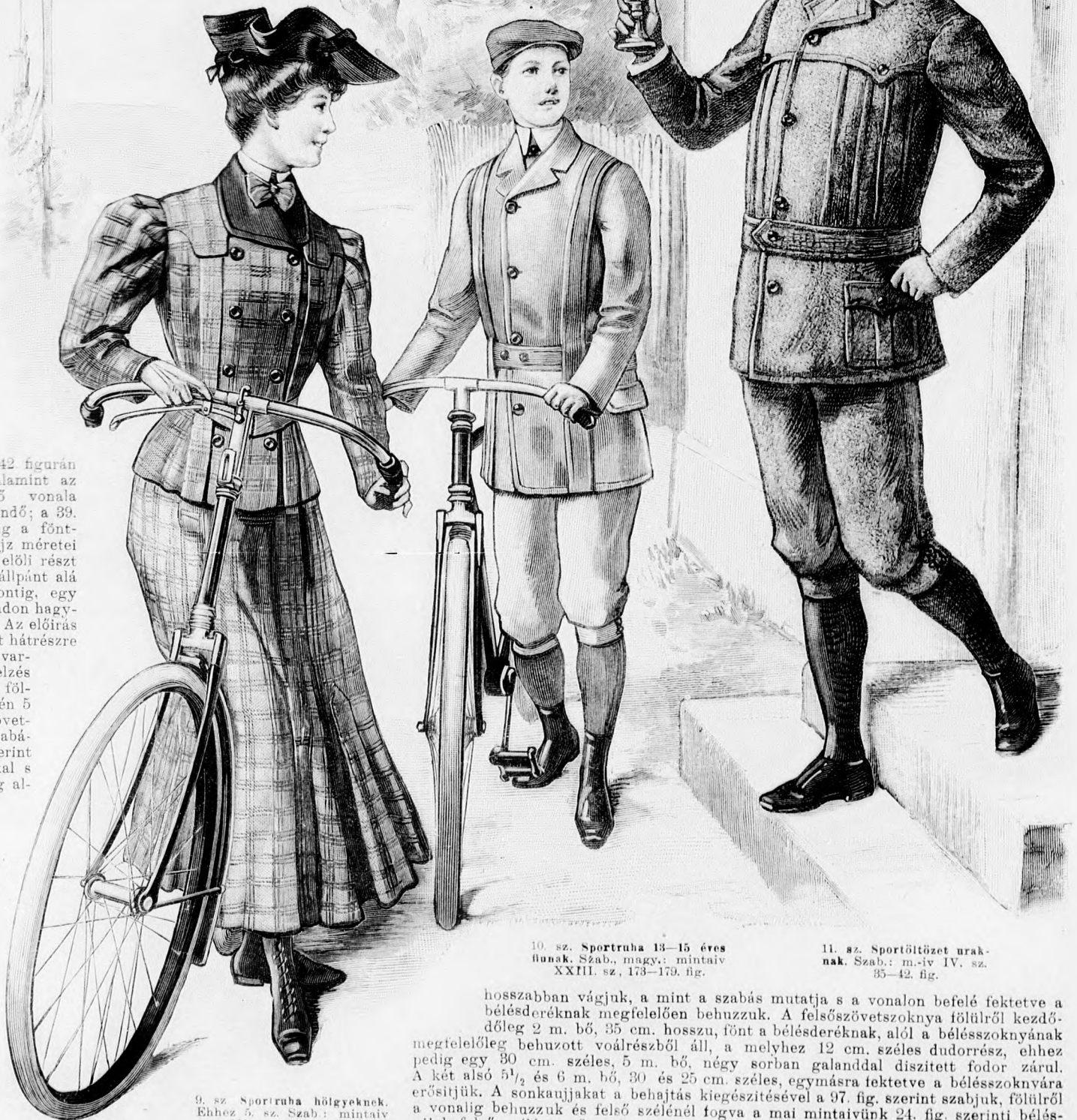
10. sz. Sportruha 13-15 éves fiúknak. Szab. magy.: mintáiv XXIII. sz., 173-179. fig.