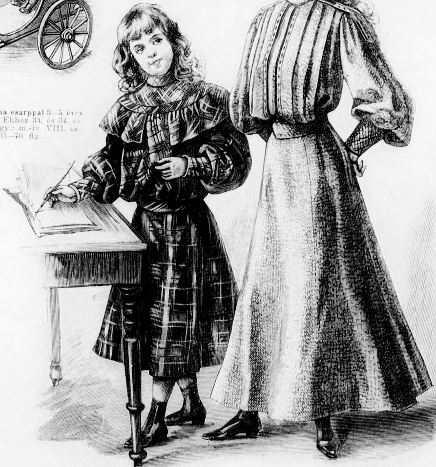
42. sz. Ruha 8-10 éves leányknak. Szab., magy.: mintáiv XX. sz. 157-163. fig.