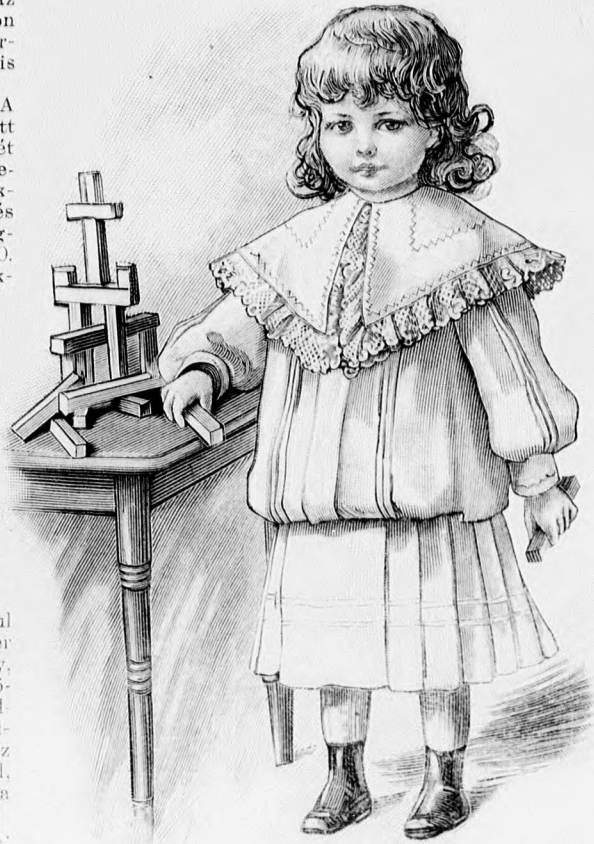
36. sz. Ruha vállgallerral 1 éves gyermeknek. Szab., magy.: mintáiv VII. sz. 59-64. fig.

58-60. sz. Divatos nyári alszoknyák. Kis rajz: mintáiv XII. sz. 92. fig. Anyag az 58. számú képhez: 3 1/2 m. hosszú, 115 cm. széles alpakka, 1 1/2 m. hosszú rézsutvágott 54 cm. széles selyem; az 59. sz.-hoz: 4 1/4 m. hosszú világoszöld és 3/4 m. hosszú világosbarna alpakka, 115-115 cm. szélességben, 30 m. hosszú, 3/4 cm. széles galand; a 60. sz.-hoz: 4 1/2 m. hosszú, keményített, 3/4 m. hosszú fehér és 1/2 m. hosszú fekete perkal, 80-80 cm. szélességben, és 30 m. hosszú, 3/4 cm. széles atlaszszalag. Ezen három divatos alszoknyát a kis rajz 92. fig. szerint szabjuk. Az 58. sz. világosszürke alpakka alszoknyának