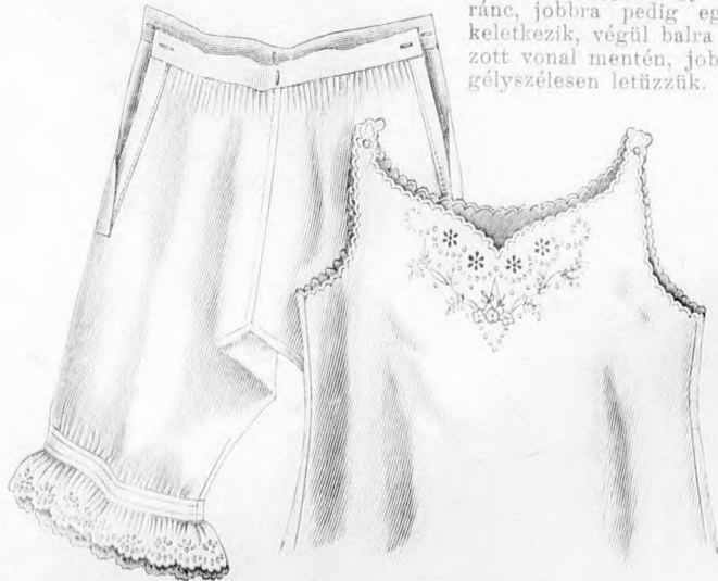
40-41. sz. Nappali ing és nadrág 10-12 éves leányknak. Szab., magy.: mintáiv X. sz. 78-79. fig.

46-48. sz. Ingek és vászongallér uraknak. Szabások: mintáiv XI. sz. 80-91. fig. Anyag az ingekhez: 3-3 m. hosszú, 88 cm. széles mosószövet s a 48. számhoz még 45 cm. hosszú, 80 cm. széles piké. A 47. számú vászongallérhoz 1/2 m. hosszú, 20 cm. széles vászon. A 46. számú, finom mosószövetből való, nem keményített ing számára a 80. és 81. fig. szerint, a kis rajz 91a. fig. méreteinek megfelelőleg meghosszabbított, egy-egy részt szabunk közepén végig egészben. A hátsó vállpántot és nyakfogalót a 82. és 83. fig. szerint szabjuk, a 26 cm. bő, 4 1/4 cm. széles gombolt ujjfogalóhoz hasonlóan duplaszövetből. Az ujjakat épp úgy mint a 48. számú inget a kis rajz 91. fig. szerint szabjuk. Az előli ingaljon haránt- és hosszhasítékokat dolgozunk ki. Ezután az ingaljat kereszt és pont szerint ráncba rakjuk s az előli hasítékeket mindkét törésvonal mentén kihajtjuk, úgy, hogy balra hasíték-ránc, jobbra pedig egy aláérő rész keletkezik, végül balra az első pontozott vonal mentén, jobbra pedig szegélyszélesen letűzzük. A duplapont a közepén a duplapontra fekszik. A haránthatítéket keskeny pánt takarja. A vállpántnak duplaszöveve közé foglalt hátsó ingaljat előirás szerint behuzzuk. A duplán vett szövetből készített 47. számú állógallért finom vászonnál a 84. fig. szerint készítjük, gomblyakkal ellátva s a pontozott vonal mentén kifelé vasalva. A 88. fig. szerinti finoman