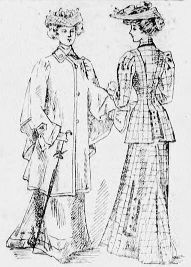
7-8. sz. A 29. és 30. szám eleje és háta.

13. sz. Reformruha sonkaújjakkal. Ehhez 15. sz. Szab.: mintáiv XIII. sz., 93-97. fig. Anyag: 10 m. hosszú, 50 cm. széles bélésstatota, 6 m. hosszú, 120 cm. széles voál, 70 m. hosszú, 1 1/2 cm. széles selyemgaland. Az izléses, könnyű, matt-lila voál nyári ruhát hasonlószerű tafotabélés-alappal és fekete selyemgalanddísszel látunk el. A bélésderéket a 98-100. fig. s a bélészoknyát pedig a mai mintáivunk 93. fig. adja; a bodros felsőszöveget az előrajzolt vonal mentén erősítjük rá. Az előli egymásra fekvő s a 94. és 95. fig. szerint szabott vállpántreszeket fönt a vonalig sima, a vonaltól az alsó szélig pedig kis dudorokba húzott voál díszíti. Ezen dudoros részt előli a baloldalon, a középtől a vállvarrásig nem erősítjük a bélésre, hanem tafotával béleljük s a balvállra átkapcsoljuk. A kis rajz 96. fig. szerinti bluzszerű felsőszöveget körülbrodnoza a dudorok alá erősítjük és balra az oldalon átkapcsoljuk. A bluzrészeket az alsó szélükön 7 cm.-rel