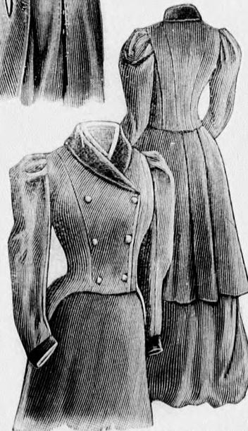
20-21. sz. A 27. szám bogombolt eleje és hátulja.

szegélybe varrt s a 120. fig. után vágott felsőszövet borítja. A hátsó középső felsőrész rajz szerint folytatódik a ráncolt fekete atlaszszal borított, előlkapcsolt és fejecskevel záródó 123. fig. szerinti övön. Az utóbbit az elől mindkét kereszt és pont szerint ráncolt alsó bluzszél ellen varrjuk. A 121. fig. után vágott állógallért a felső szélén a vonalig zöld bársony borítja, a miből a 125. fig. után vágott kézelőket s elől az állógallérhoz záruló 122. fig. szerinti vállpántot is készítjük Fehéren tamburirozott és himzett fekete atlasz-négyszögek, valamint paszománt-csüngők ékítik az állógallért és kézelő-