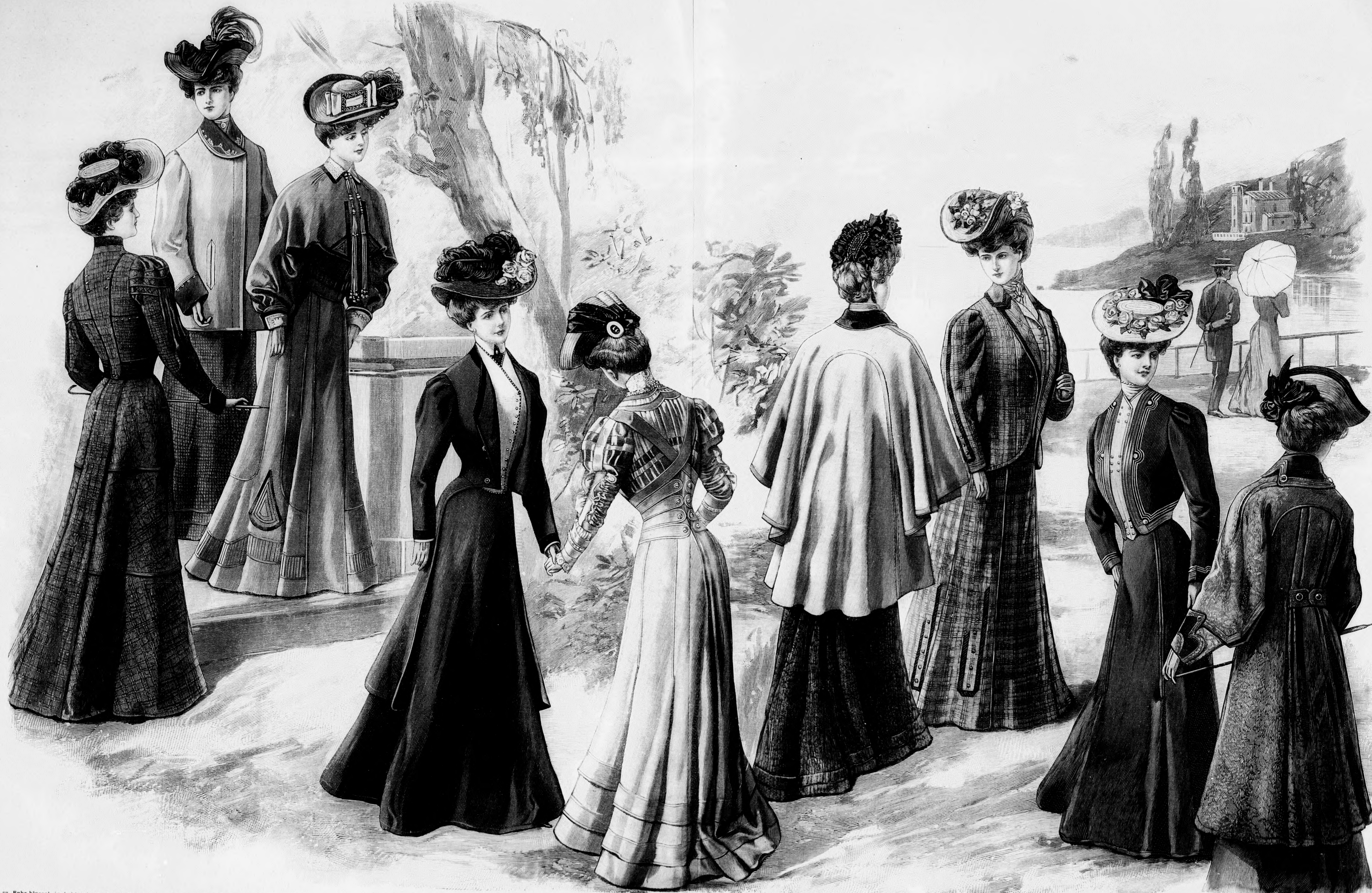
24. sz. Ruha bíszal és kabattal, pasapollal díszítve. Ehhez 55. sz. Szab. mintaiv XVI. sz. 117-125. fig.