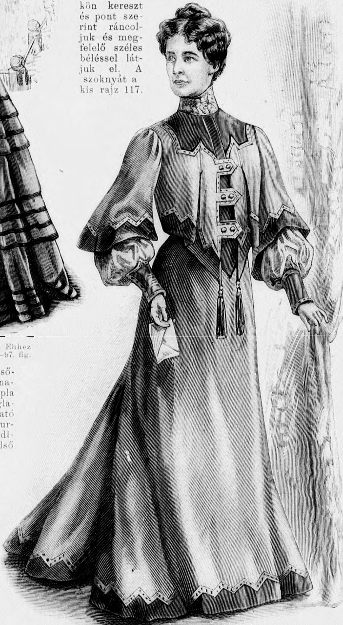
23. sz. Ruha étecsőbb erős hölgyeknek. Ehhez 22. sz. Szab.: mintáiv I. sz. 1-14. fig.

28. sz. Tavasz ruha keresztetett derék díszszel. Ehhez 56. és 57. sz. Anyag: 360 cm. hosszú, 48 cm. széles selyem, 5 m. hosszú, 120 cm. széles gyapjuszövet, 1 1/4 m. hosszú, 4 cm. széles hurkolt galand, 180 cm. hosszú, 7 cm. széles csipke és 18 paszomántgomb. Az elegáns világoszürke gyapjuszövetruhának derék- és újdudordiszét hasonló, zöld csikokkal szalagszerűen beszőtt selyem képezi. Fehér, magasan kiálló nefelejtspontokkal átszőtt csipkéből készítjük az állógallért, ujjfogalót s a három 4 cm. széles, felsőszövetpánttal kivarrt bélés-ujjak vállpántdíszét. A felsőszövetujjak gyapjuszövet-részenek kézelőt a töntemlített zöld csikokkal díszített fehér hurkolt galandok ékítik, a melyek az állógallért is határolják s az elől hajtokaszerűen kihajtott előli díszesz felsőszövetét is emeli. A zöldes-szürkén befont paszomántgombokat kép szerint varrjuk a derékra és szoknyára.