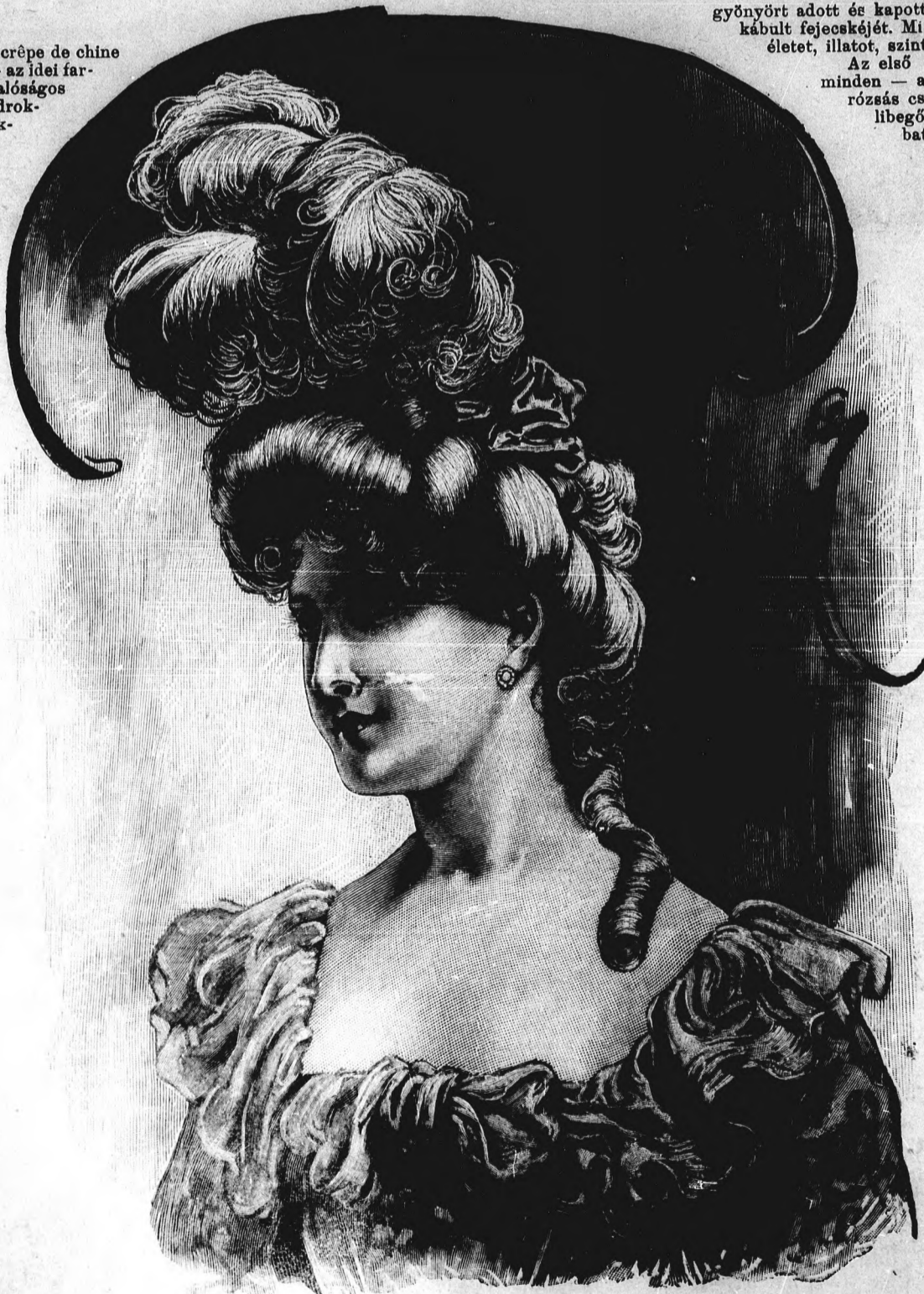
1. sz. Rokokó-hajviselet. Ehhez 39. sz.

Életünk jelképe — élt, élvezett, kötelességét teljesítve