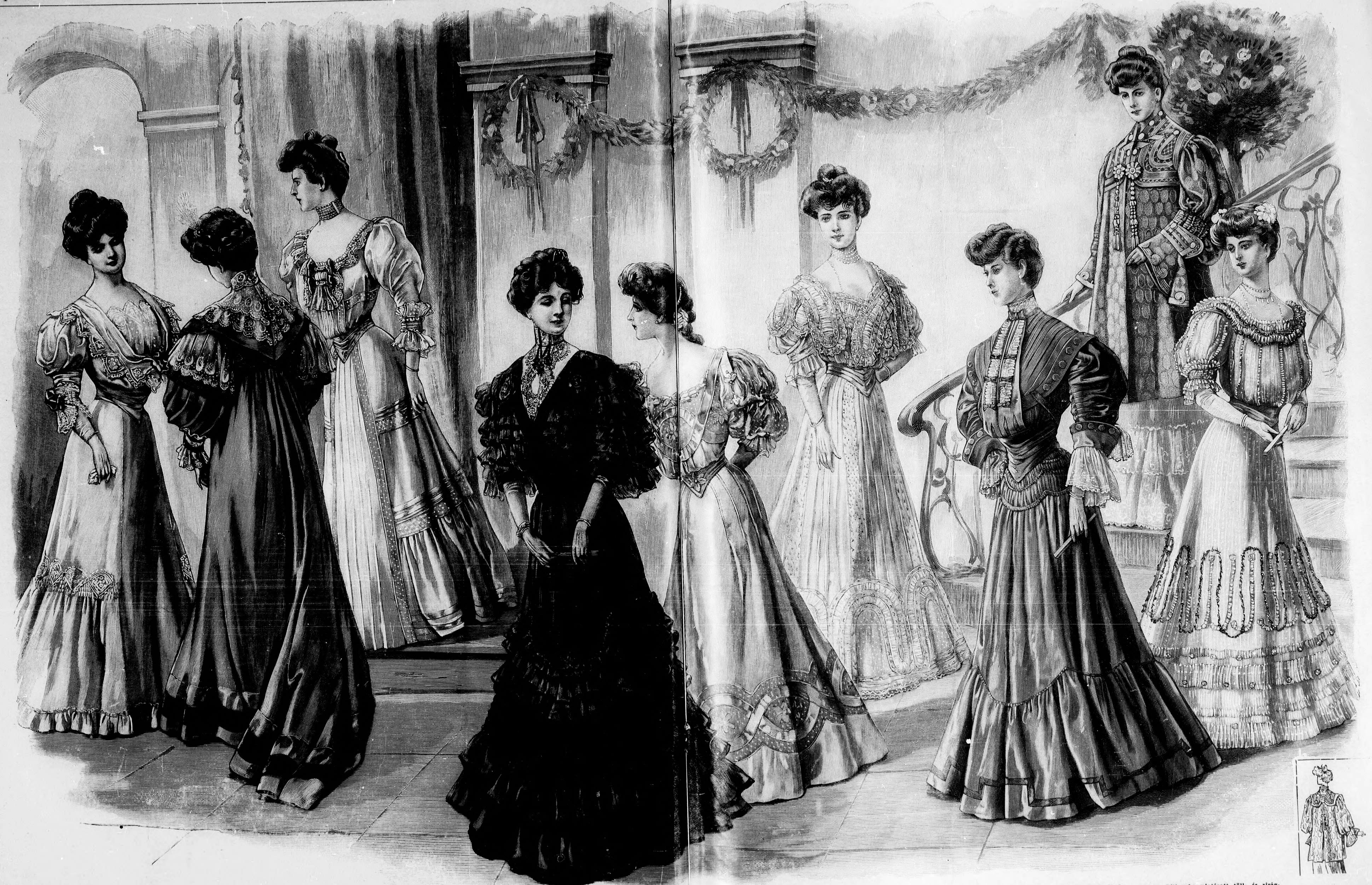
22. sz. Bál ruha fiatal leányok sok csipkedíszrel. Ehhez 13. sz. Szab.; mintáiv XIX. sz. 106-112. fig.