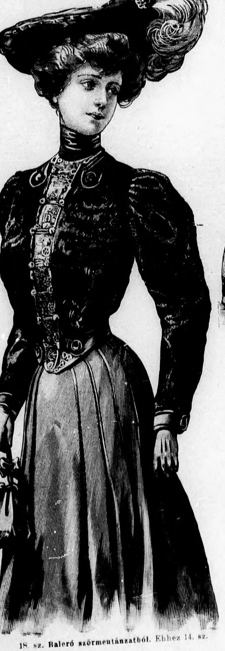
18. sz. Baleró szörmeutánszabój. Ehhez 14. sz.

23. sz. Alkalmi ruha empirformában. Ehhez 17. és 21. sz. Szab.: mintáiv I. sz., 1-5. fig. Anyag: 8 m. hosszú világosrezedazöld-színű 116 cm. széles crepp de chine, 2 3/4 m.