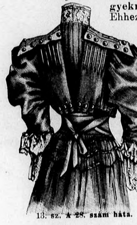
13. sz. A 28. szám háta.