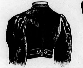
14. sz. A 18. szám háta.

való. A szoknyát és derekat csinos rendezésben, cakkos, szép valenzien-csipke díszíti, keskeny bodros valenzien-csipkével határolva. A csipke alul a szövötet mindenütt kivágjuk. Elütti libertiszalag-csokrok fogják össze az előli derékdísz, valamint a félhosszu ujjak kélőit díszítik. Az előli és hátsó betétet világoskék selyempettyekkel kihimzett, finom fehér mullból készítettük, épp úgy, mint a kélőket. Az előli betét 35 cm. hosszúságnál 30 cm. félszélességű, a hátsó pedig 27 cm. h., 48 cm. széles. A felsőszövet kivágáshoz szakálkaszerű dísz erősítünk. Ez 14 cm. széles s a derék felsőszövetének előli közepén csillagnál kezdődő s itt ráncolt rézsut csikból áll, a melyet a szélén cakkos csipkével díszítünk, a vállvarásokon bodrozunk. A derekat