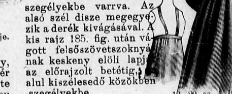
19-20. sz. A 16. szám háta és a szoknya külön.

bevarrandó szegélyek rajza. A felső és alsó behuzzott széleket a bélésen rendezzük. A hátsó zárás láthatatlan. A felső kivágászált dupla húzott sifonbodon kívül bodrozott tüllcsipke is díszíti, a mely előli a látható módon négyzetes betétdísz gyanánt folytatódik. Itt még tarkán mintázott chine selyemből még pántokat és kacsokat is alkalmazunk. Ebből készítjük a 20 cm. széles rézsutcsikból való ráncolt övdísz is. A belső varráson 26 cm. hosszú sima, fehér sifonujjakat a kis rajz 187. fig. után vágott felsőszövegetre erősítjük, a mely haránt irányban szövöt hozzáadásával szegélyekbe varrva. Az alsó szél dísz megegyezik a derék kivágásával. A kis rajz 185. fig. után vágott felsőszöveget szoknyának keskeny előli lapját az előrajzolt betétig, alul kiszélesedő közökben szegélyekbe varrjuk. A szövötet ehhez külön számítottuk épp úgy, mint a hátsó lap három részére számára is a melyeket a felső rész betétjén 1 cm. rel, a középső rész betétjén 1 1/2 cm. rel, az alsó rész alól szélén 2 cm. szélesen varrjuk. betétek közül a felső 4, az alsó 6 cm. széles.