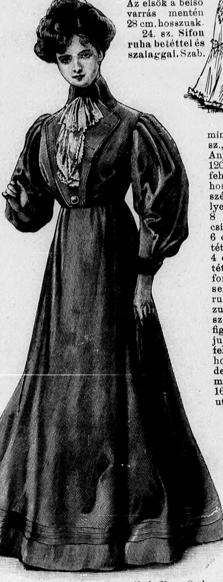
16. sz. Reformruha. Ehhez 19. és 20. sz. Szab.: mintáiv VI., 40-48. fig.

bevarrandó szegélyek rajza. A felső és alsó behuzzott széleket a bélésen rendezzük. A hátsó zárás láthatatlan. A felső kivágászált dupla húzott sifonbodon kívül bodrozott tüllcsipke is díszíti, a mely előli a látható módon négyzetes betétdísz gyanánt folytatódik. Itt még tarkán mintázott chine selyemből még pántokat és kacsokat is alkalmazunk. Ebből készítjük a 20 cm. széles rézsutcsikból való ráncolt övdísz is. A belső varráson 26 cm. hosszú sima, fehér sifonujjakat a kis rajz 187. fig. után vágott felsőszövegetre erősítjük, a mely haránt irányban szövöt hozzáadásával szegélyekbe varrva. Az alsó szél dísz megegyezik a derék kivágásával. A kis rajz 185. fig. után vágott felsőszöveget szoknyának keskeny előli lapját az előrajzolt betétig, alul kiszélesedő közökben szegélyekbe varrjuk. A szövötet ehhez külön számítottuk épp úgy, mint a hátsó lap három részére számára is a melyeket a felső rész betétjén 1 cm. rel, a középső rész betétjén 1 1/2 cm. rel, az alsó rész alól szélén 2 cm. szélesen varrjuk. betétek közül a felső 4, az alsó 6 cm. széles.