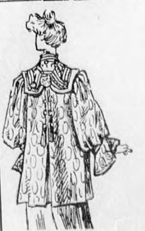
31. sz. A 29. szám háta.

A bemutatott modellek és kosztümök szövetei kaphatók: Stern József női divatruházában (Budapest, IV., Kálvin-tér 1. szám).