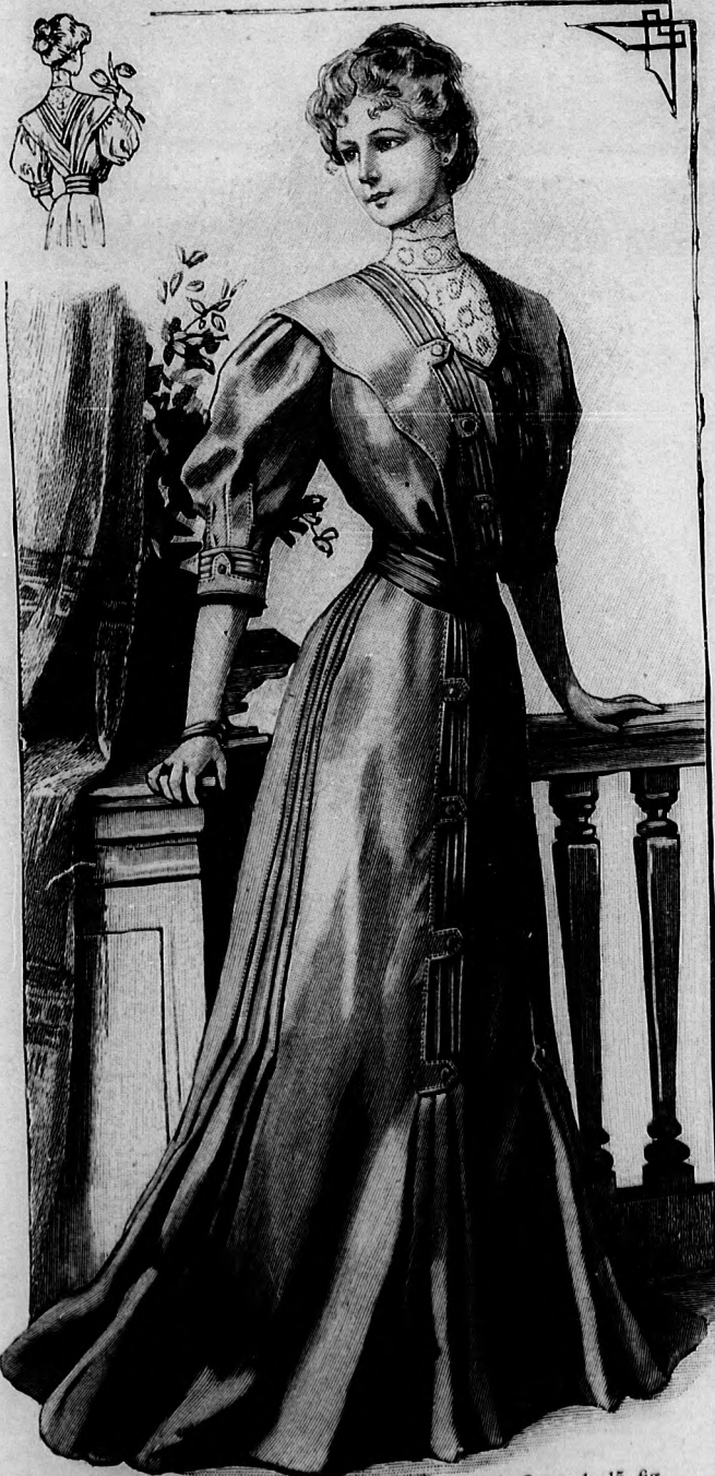
18-19. sz. Ruha pántdíszszel. Szab.: mintáiv I. sz., 1-15. fig.