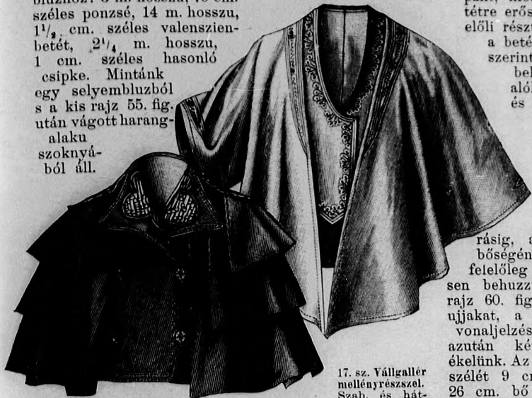
16. sz. Háromsoros vállgallér zsaketrésszel. Szab. magy. és hátkép: mintáiv VI. sz., 43-48a. fig.

bluzhoz: 3 m. hosszú, 70 cm. széles ponzsé, 14 m. hosszú, 1 1/2 cm. széles valenszientet, 2 1/4 m. hosszú, 1 cm. széles hasonló csipke. Mintánk egy selyembluzból s a kis rajz 55. fig. után vágott harangalaku szoknyából áll.