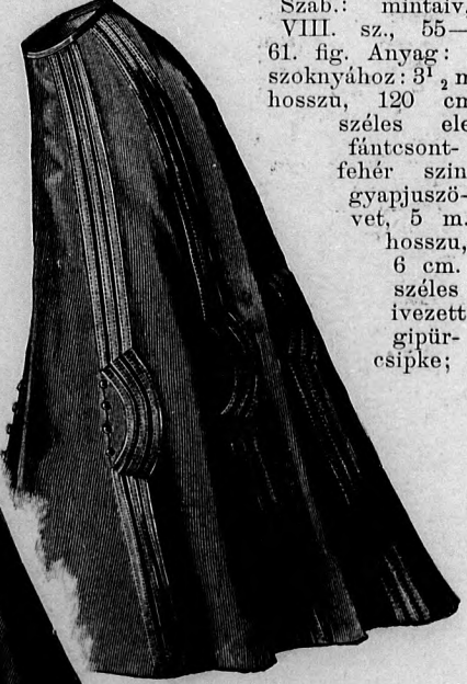
14. sz. Szoknya bluzhoz pántdíszszel. Kis rajz és magy.: mintaiv XIII. sz., 82. fig.