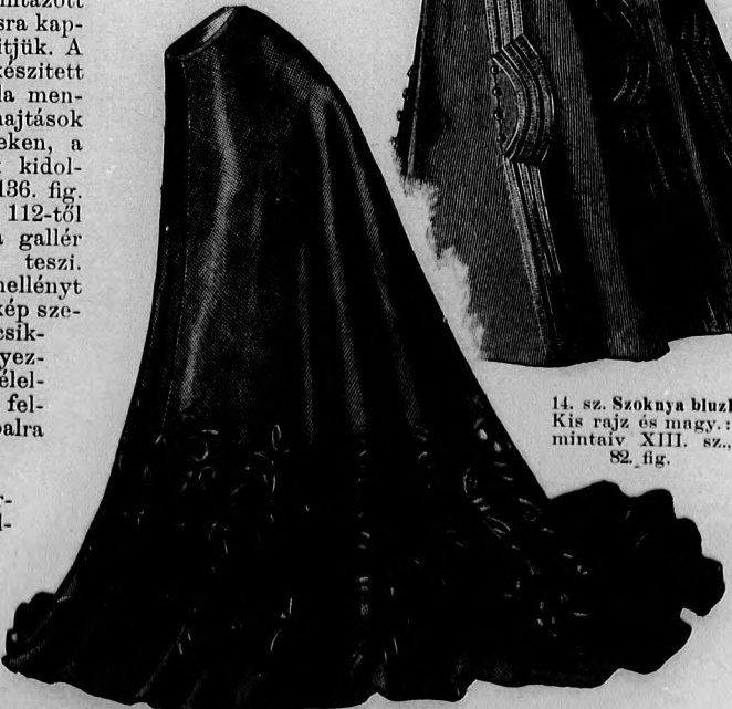
13. sz. Elegans szoknya dűs tafotaapplikkálóval. Szab. magy.: mintaiv XXIII. sz., 138. fig. 15. sz. A 31. szám hátképe.