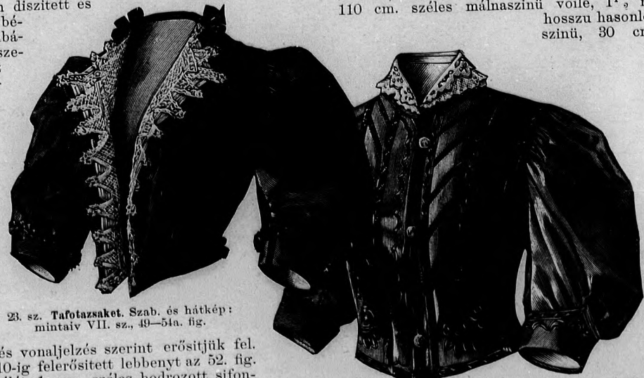
23. sz. Tafotaszakét. Szab. és hátkép: mintáiv VII. sz., 49-54a. fig.

25. sz. Látogatóruha. Szab. és hátkép: mintáiv III. sz., 24-34a. fig. Anyag: 7 m. hosszú, 110 cm. széles málnaszínü voile, 1 1/4 m. hosszú hasonló színü, 30 cm.