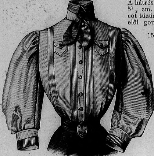
2. sz. Egyszerű bluz sporthoz. Sz.: mintaiv XXVII. sz., 154-158. fig.

2. sz. Egyszerű bluz. Szab.: mintaiv XXVII. sz., 154-158. fig. Anyag: 2 1/2 m. hosszú, 70 cm. széles flanell, 1 m. hosszú, 50 cm. széles fekete-féher csikos selyem, 8 drb aranygomb. A praktikus bluz elejét és hátát a 154. és 155. fig. szerint szabjuk, a kis rajz méretei szerint kiegészítve. A 154. fig. szerinti előli részt a finom vonalakon belől és kép szerint, hat-hat finom szegélyből álló szegélycsoportokat tűzünk le, közöttük vonaljelzés szerint kis zsebet alkalmazunk, a melynek felső selyemmel paszpólirozott pántját gombbal ékítjük.