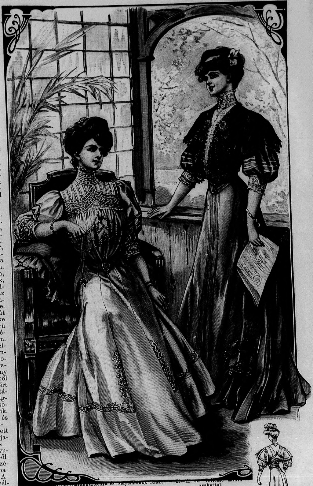
21. és 22. sz. Öltözet. Szab. és hátkép: mintáiv VIII. sz., 55-61. fig.

23. sz. Tafotakabát. Szab. és hátkép: mintáiv VII. sz., 49-54a. fig. Anyag: 4 m. hosszú, 50 cm. széles tafota, 7 1/2 m. hosszú, 2 1/2 cm. széles bársonyszalag, 2 1/2 m. hosszú, 3/4 cm. széles hasonló szalag, 6 m. hosszú, 1 cm. széles sifonszalag, 1 1/4 m. hosszú, 115 cm. széles sifon, 1 1/4 m. hosszú, 13 cm. széles spachtelcsipke, 2 drb díszgomb. A bársonyszalaggal gazdagon díszített és fehér selyemmel bélelt fekete tafotakabátot a 49-54. fig. szerint szabjuk. Az 50. fig. bevarrásainak kidolgozása után vászonnal keményítjük és a törésvonal mentén kihajtjuk az előli széleket. Az előli és hátrészt a dudorodásig egyforma közőkben 2 1/4 cm. széles bársonyszalag díszíti. A dudordísz 2 cm. széles, a szélein zsinórfellett behuzott tafotacsipkéből készítjük és vonaljelzés szerint erősítjük fel. A hátul 107-től 110-ig felerősített lebbent az 52. fig. adja. A külső szélét 1 cm. széles bodrozott sifonszalag és keskeny bársonyszalag, míg a belsőt széles bársonyszalag határolja. A kabát alsó szélét széles