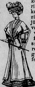
10-11. sz. Pongyola széles gallér. Sz.: magy.: m.-iv IX. sz., 88. fig.

A 137. fig. szerinti mellényt könnyedén béleljük, kép szerint mintázott aranycsik-kalesgalanddszegélyez-zük és selyemmel béleljük. Zárásul a jobbra felvarrt horgok és balra vonaljelzés szerint felerősített hurkok szolgáljanak. A gallér-részt a sujtas kidolgozása után (a felső szelen kép szerint, az ujjakon pedig félkör alakban) 110-től 118-ig a mellényre erősítjük. A mellényt hátul a derék-