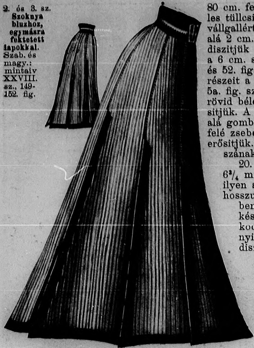
2. és 3. sz. Szoknya bluzhoz, egymásra fektetett lapokkal. Szab. és magy.: mintáiv XXVIII. sz., 149-152. fig.

80 cm. fekete-fehér csikos muszlin, 5 1/2 m. hosszú, 11 cm. széles tüllosipke, 2 m. hosszú, 4 1/2 cm. széles himzett gallon. A vállgallért határoló csipkefodor, valamint a 90 cm. bő ujjfodor alá 2 cm. széles muszlinplisszét foglalunk. Himzett gallonnal díszítjük a vállgallért, valamint belőle és muszlinból készítjük a 6 cm. széles ujjfogalót. Az 1-5. fig., valamint a 19. és 52. fig. szerint szabjuk a pongyolát, a melynek csingórészeit a 3. és 4. fig. adja rövidítve s így a kis rajz 5a. fig. szerint kiegészítendők. A részeket behuzva, a rövid bélésrészeken előrajzolt sima vállpántdísz alá erősítjük. A láthatlan gombolás számára a jobb előli szél alá gomblyukpántot erősítünk. Jobboldalt csillagtól befelé zsebeket foglalunk. A vállgallért a nyakkivágáshoz erősítjük. A bélésujjakat a felső szövetujjak belső hosszának megfelelőleg meghosszabbítjuk.