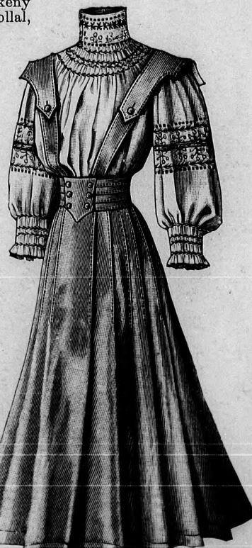
27. sz. Ruha bluzzal (ránccal szoknya váltartókkal és román bluzzal) 13-15 éves leányoknak. Ehhez 59. sz. Szab. és himzés minta: mintáiv XI. sz. 56-61a. fig.

ritásának elől a dupla ponttól csillagig behuzott alsó szélét, a dupla ponttól, a csillagig, 89-en át a bélésderek derekába erősítjük, a behuzott felső szélét 91-től 92-ön át, 93-ig a vállpánt ellen fekszük. Az ujjaknak alsó, 90-től 90-ig terjedő szélét, dupla pontok között szintén állóránccokkal szűkítjük és 90-nél fogva az alsó ujj b. dupla pontjára fektetve, vonal mentén a bélésujjra erősítjük. A bélésujjakat határoló keskeny filécsipkéhez, világoskék selyempaszpollal, 3 cm. széles, 70 cm. bő tüllescipkével határolt és még egy bővebb csipkefodor zárul. A csupán elől egy-két öltéssel felerősített fekete tafotaföt 15 cm. széles rézsut csikból készítjük, a melyet elől, a 44. fig. után vászonból vágott, halcsonttal keményített alapra ráncolva erősítünk (lásd a 44a. fig.), hátul pedig rozetták alatt zárva 5 cm. magasan behuzzuk és halcsonttal meg-erősítjük.