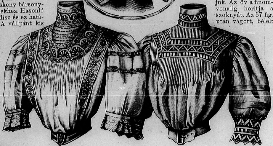
7. sz. Batisztbluz galanddíszszel. Ehhez 53. sz. Szab. hátkép és magy.: mintáiv XXVII. sz., 144-148a. fig.