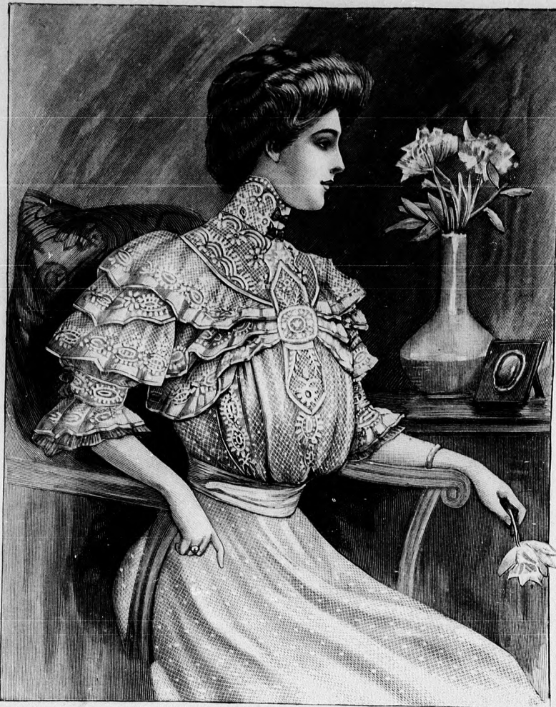
42. sz. Elegáns csipkebluz. Szab.: mintáiv XX. sz., 107. és 108. fig.

38. sz. Batisztruha csipkediszszel. Anyag: 9 m. hosszu, 80 cm. széles világoskék batiszt és 1 m. hosszu, pettyes, fehér, ugyanilyen széles mull, 80-85 cm. hosszu, 1 1/2 cm. széles csipkebetét (vertcsipke utánzat), 16 m. hosszu, 2 cm. széles hasonló csipke, 1 m. hosszu, 1 cm. széles gipürbetét, 1 spachtelfigura, 1 1/2 m. hosszu, 9 cm. széles fehér libertyszalag. A nyári öltözetet gazdagon díszítik a csipkebetétek, a melyek közül a szoknya díszítésére, kettőt-kettőt egymás mellé fektetünk. A grekkyszerűen felerősített betéteket részben a látható módon bekelt fehér mullrészek veszik körül. Az egyenes lapokból álló, elől 86, hátul 99 cm. hosszu felső szoknyarész 266 cm. bő, a felső szélét 3 cmnyi közökben, mintegy 22 cm. hosszu levart, 1/2 cm. széles szegélyek szűkítik, a melyeket főtt összehuzunk. Betétet erősítjük fel a 390 cm. bő, elől 25, hátul 35 cm. magas egyenes fodrot, a melyre alul két 6-6 cm. széles csipkével határolt fodrot varrunk, főtt betétet határolva. A bluzrészeket főtt látszólag a legfinomabb szegélyek díszítik, a melyek a mullszegélybe varrt batiszt és betétekből készített és bodros csipkével határolt vállpántig terjednek. Az állógallér és ujjfogaló a vállpánthoz hasonló anyagból való. A hátul láthatlanul zárt bluznak behuzott alsó szélét egyenes foglalóba erősítjük. Az övet fehér szalagból készítjük.