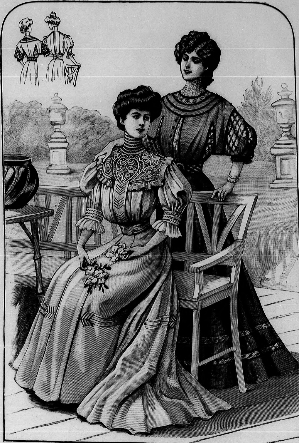
17. és 18. sz. A 19. és 20. szám háta rövidítve.

33. sz. Ruha hosszú csipkevállpánttal. Ehhez 30. sz. Szab.: mintáiv VII. sz., 42-44a. fig. Anyag: 7 m. hosszú, 110 cm. széles kék-fehér mintázatu voál, 1/2 m. hosszú, 50 cm. széles fekete és 30 cm. ugyanilyen széles világoskék tafota, 1 3/4 m. hosszú, 20 cm. széles ékrúszintű filécsipke, 3 m. hosszú, 6 cm. széles hasonló csipke, 3 m. hosszú, 1 cm. széles tüllescipke. Mintáknak egyenes lapokból álló, 4 m. bő, főt behuzott szoknyáját pánthoz s a derekat a divatos, az ujjakkal egyben szabott felsőszövet díszíti. A 3 1/2 és 7 cm. szélesség között variáló rézsut pánthoz a szoknyaszéltől 26, illetve 36 cm. nyire varrjuk fel. A hátulzart bélésderekát az állógallérral és bélészeknyával a 14-20. fig. adja. A fehér sifonnal bélelt csipkevállpántot a 43. fig. szerint szabjuk, ezt az állógallérhoz hasonlóan, főt a vonalig sima csipkével borítjuk, a melyre a behuzott, 140 cm. hosszú csipkevégeket erősítjük. Számára a vállakon kellőleg kikerekített csipkét, főt 1 cm. fejcskébe huzzuk az izezett alsó szélével simán varrjuk fel, a derék felsőszövetének felvarrását borító, fekete selyempaszpolhoz hasonlóan. Hasonló paszpolt foglalunk a vállpánt csipkeszélei alá fent. Az állógallér felső szélét világoskék paszpolt díszíti. A derék illetve ujj felsőszövetét a kis rajz 42. fig. szerint szabjuk. A varrását oldalt 89-től 90-ig dolgozzuk ki, a derék bo-