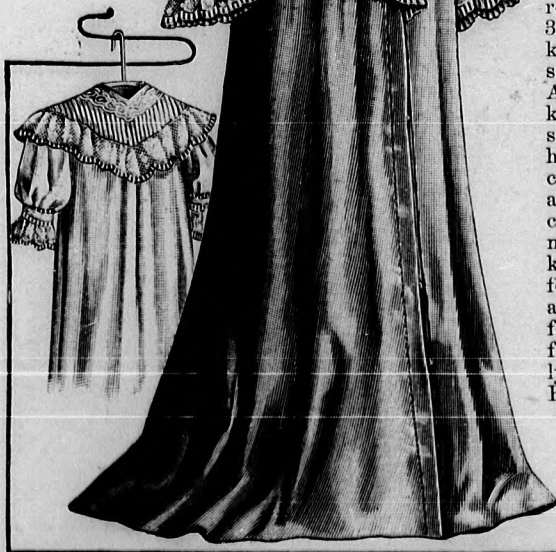
15. és 16. sz. Egyszerű pongyola. Szab.: mintáiv I. sz., 1-5. fig.

32. sz. Öltözet idősebb hölgyeknek. Ehhez 29. sz. Szab.: m.-iv IV. sz., 24-29. fig. Anyag: 6 1/2 m. hosszú, 100 cm. széles mull, 18 m. hosszú, 8 cm. széles giprűbetét, 1/2 m. zöld, 3/4 m. fekete rézsut vágott tafota, 3 m. hosszú, 4 cm. széles valenzienscipke, 1/4 m. hosszú, 100 cm. széles fehér tüll, 1/4 m. ugyanilyen szélesfeketepettyes tüll. Fekete, fehérpettyes mull (plumetis) és fekete, tisztán beékelt giprűbetétekből készítjük az öltözetet, a mely-