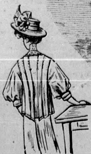
4. sz. A 6. szám hála rövidítve.

15. és 16. sz. Egyszerű ponyola. Szab. mintáiv I. sz., 1-5. fig. Anyag: 6 1/2 m. hosszú, 105 cm. széles orgonaszínű gyapjúkrepp, 4 m. hosszú,