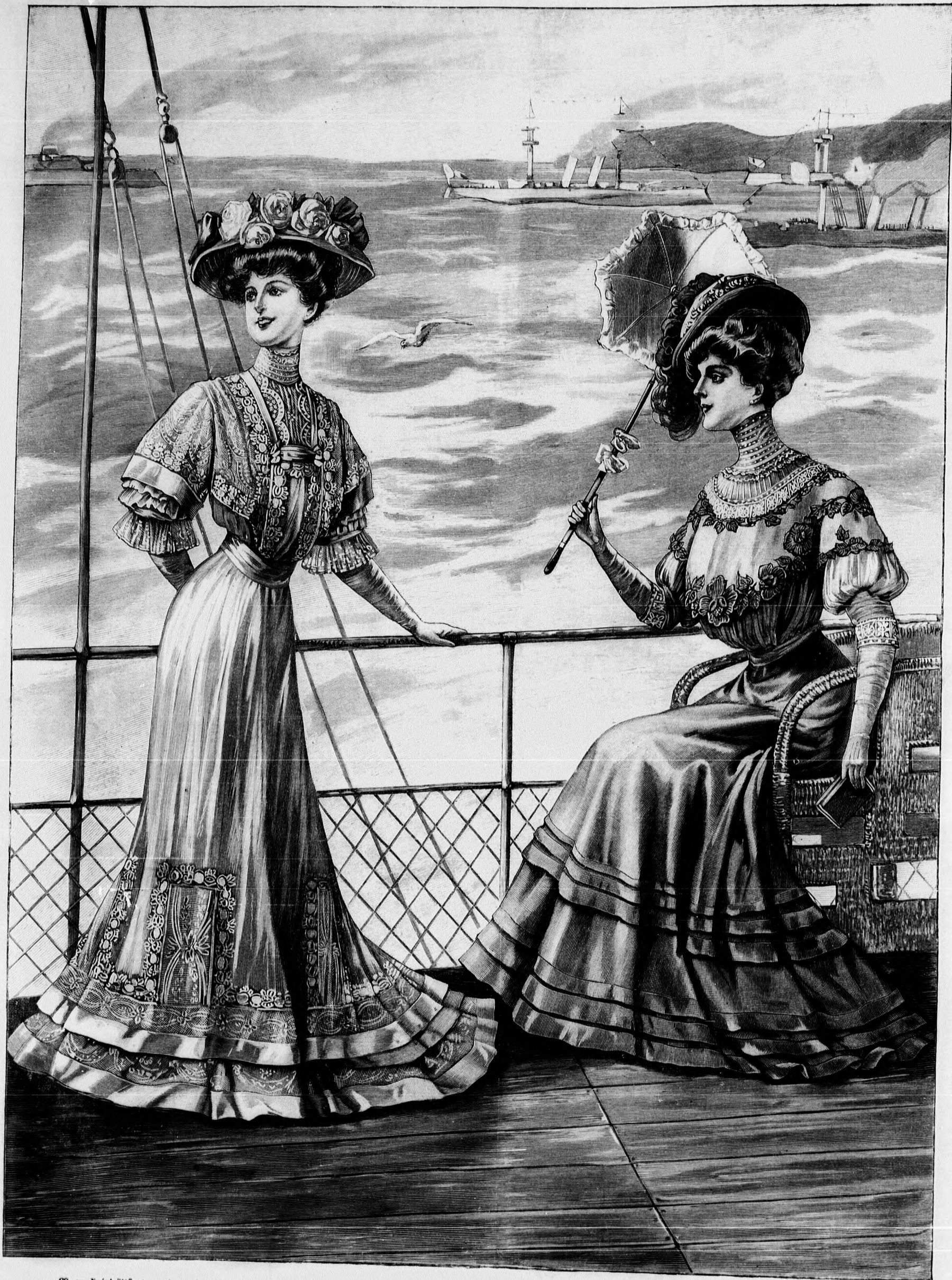
60. sz. Nyári öltözet gazdag csipkedíszszel. A 165. fig. háta a mintaívén.