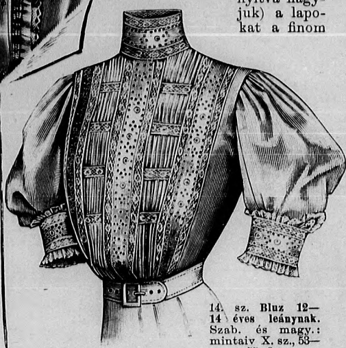
14. sz. Bluz 12-14 éves leányoknak. Szab. és magy.: mintáiv X. sz., 53-55. fig.

nek eleganciáját emeli a fehér alsórúha. A bélészeknyát, derekat, ujjakat és állógallért a 14-20. fig. adják. A felsőszövetzeknyát a kis rajz 24. fig. szerint szabjuk. Az a-c. fig. összevarrása után (a hátsó varrást nyitva hagyjuk) a lapokat a finom