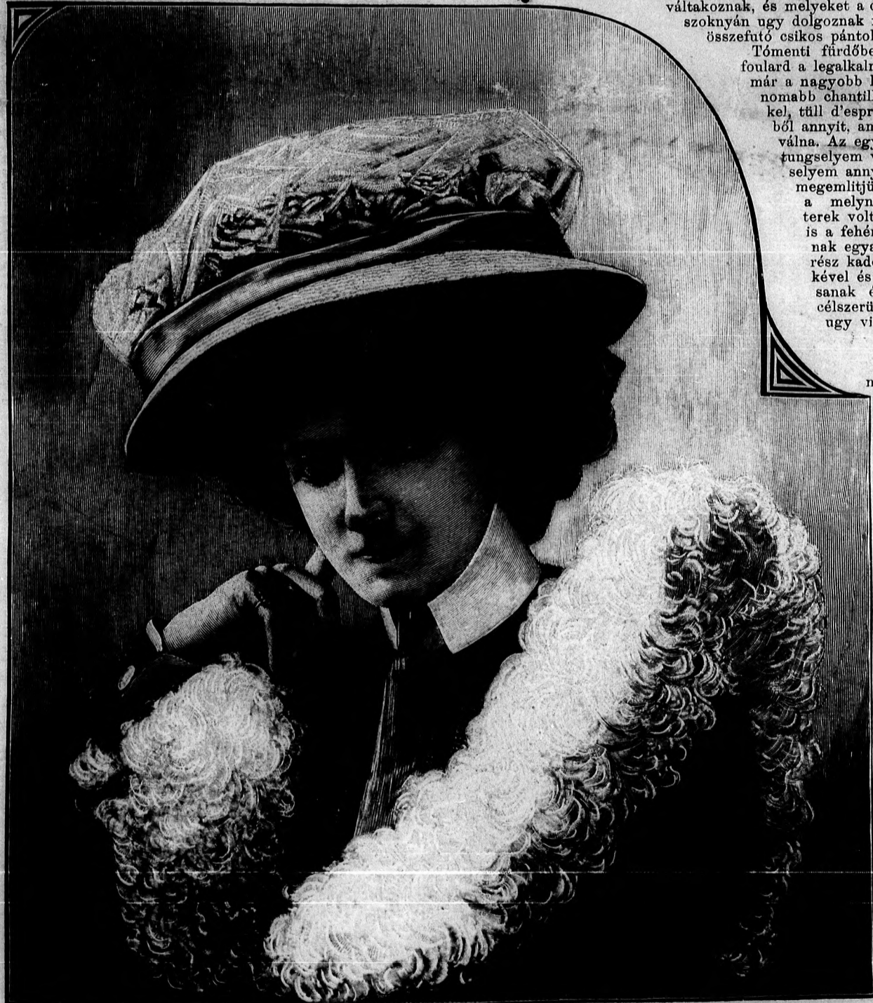
1. sz. Nyári kalap fiatal hölgynek.

Magyarország északi fűrdőiben csak augusztusban kezdődik a főszezon, ellenben a balatoni fűrdőkben már júliusban a tetőfokán áll és alkalmat ad a gonddal elkészített toiletteknél arra, a mi tulajdonképpen főcéljuk, hogy viselőjüket díszítsék és megcsodáltassák.