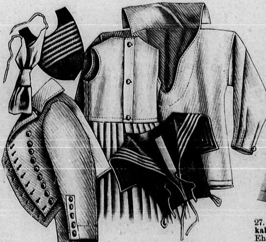
21-23. sz. A 34. szám egyes részei.