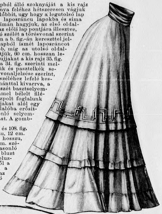
43. sz. Elegáns szoknyabluzhoz. Kis rajz és magy.: m.-iv. XVI. sz., 86. fig.

42. sz. Elegáns csipkebluz. Szab.: mintáiv XX. sz., 107. és 108. fig. Anyag: 1 m. hosszu, 120 cm. széles tüll, 12 m. hosszu, 12 cm. széles tüllcsipke; 2 m. hosszu, 6 cm. széles tüllbetét, 2 m. hosszu, 50 cm. széles selyem, 1 spachtelfigura, 1 m. hosszu, 1 cm. széles spachtelcsipke. A csinos, pettyes fehér tüllből és hasonló világoskék selyempaszpallal szegélyezett csipkéből való bluzt minden elegáns fehér bluzszoknyához viselhetjük. A bluznak a 107. és 108. fig. után vágott hátulzárt belését, elől a vállpántot jelző első vonaltól, az alsó vonalig, hátul a deréktig sima tüllrel borítjuk. A legalsó vonaltól lefelé az előli részt ráncolt tüllrel borítjuk, a melyet a látható módon három hosszu betétel díszítünk. A vállpántot hosszában egymáshoz varrt csipkéből készítjük, a melynek ívei az előli közepén találkoznak. Rajz és kép szerint erősítjük fel a három 12-12 cm. széles és 90 cm. bő, végeiken lekerekített csipkefodrot. Az előli közepet csipkefigura díszíti, a 107. fig. rajza szerint. A csipke állógallér előli selyemcsikkal díszíti. A belső varrásán 16 cm. hosszu bélesújjak