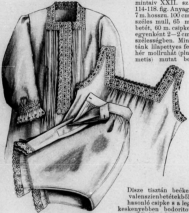
10-12. sz. Fehérnemű (háló-, nappali ing és nadrág) 8-10 éves leány-nak. Szab. és magy.: mintáiv XV. sz., 73-85. fig.

31. sz. Öltözlet valenziendíszszel. Ehhez 28. sz. Szab.: mintáiv XXII. sz., 114-118. fig. Anyag: 7 m. hosszú, 100 cm. széles mull, 65 m. betét, 60 m. csipke, egyenként 2-2 cm. szélességben. Mintánk lilapettyes fehér mollruhát (plumetis) mutat be.