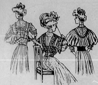
28-30. sz. A 31-33. szám háta rövidítve.