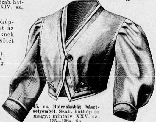
45. sz. Bolerókabát básztselyemből. Szab. hátkép és magy.: mintáiv XXV. sz., 135-138a. fig.

41. sz. Zsaketes ruha básztselyemből. Ehhez 58. sz. Szab.: mintáiv V. sz., 30-35. fig. Anyag: 10 m. hosszu, 60 cm. széles básztselyem, 130 cm. hosszu, 20 cm. széles filécsipke, 110 cm. hosszu, 10 cm. széles hasonló csipke, 30 cm. hosszu, 10 cm. széles pasztelkék tafota, mindkettő részut vágya, 1 tücsüt legapróbb aranygomb, 50 cm. hosszu, 1 1/2 cm. széles