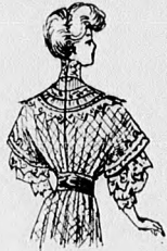
46. sz. A 48. sz. háta rövidítve.

38. sz. Batisztruha csipkediszszel. Anyag: 9 m. hosszu, 80 cm. széles világoskék batiszt és 1 m. hosszu, pettyes, fehér, ugyanilyen széles mull, 80-85 cm. hosszu, 1 1/2 cm. széles csipkebetét (vertcsipke utánzat), 16 m. hosszu, 2 cm. széles hasonló csipke, 1 m. hosszu, 1 cm. széles gipürbetét, 1 spachtelfigura, 1 1/2 m. hosszu, 9 cm. széles fehér libertyszalag. A nyári öltözetet gazdagon díszítik a csipkebetétek, a melyek közül a szoknya díszítésére, kettőt-kettőt egymás mellé fektetünk. A grekkyszerűen felerősített betéteket részben a látható módon bekelt fehér mullrészek veszik körül. Az egyenes lapokból álló, elől 86, hátul 99 cm. hosszu felső szoknyarész 266 cm. bő, a felső szélét 3 cmnyi közökben, mintegy 22 cm. hosszu levart, 1/2 cm. széles szegélyek szűkítik, a melyeket főtt összehuzunk. Betétet erősítjük fel a 390 cm. bő, elől 25, hátul 35 cm. magas egyenes fodrot, a melyre alul két 6-6 cm. széles csipkével határolt fodrot varrunk, főtt betétet határolva. A bluzrészeket főtt látszólag a legfinomabb szegélyek díszítik, a melyek a mullszegélybe varrt batiszt és betétekből készített és bodros csipkével határolt vállpántig terjednek. Az állógallér és ujjfogaló a vállpánthoz hasonló anyagból való. A hátul láthatlanul zárt bluznak behuzott alsó szélét egyenes foglalóba erősítjük. Az övet fehér szalagból készítjük.