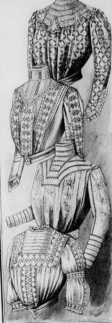
22-23. sz. Bluz madéra himzett szövetből Szab., magy.: mintáiv XIX. sz., 118-121. fig.