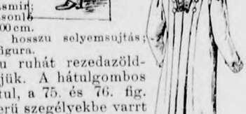
12. sz. A 3. sz. hátképe.