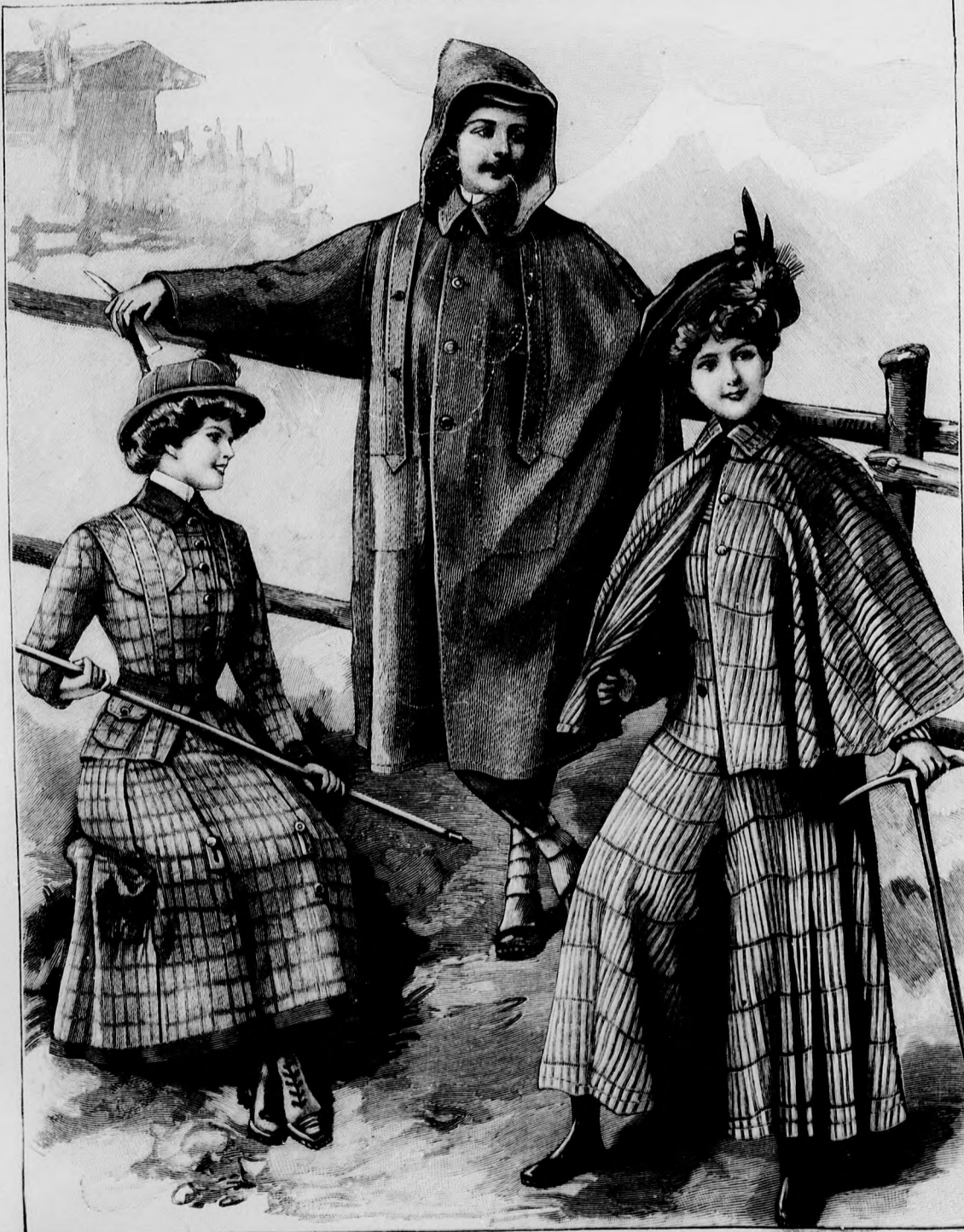
6. sz. Célszerű ruha utazásra és sporthoz; kilenc szélpánttal, nadrág, ingbluz és kabát. Ehhez 2. sz. Szab., magy. és hátkép: mintáiv XIV. sz., 81-94c. fig.