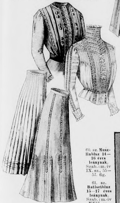
60. sz. Musz- linblúz 14- 16 éves leánynak. Szab.: m.-iv IX. sz., 55- 57. fig.

A célszerű ruha az alsó derékkal egyben szabott bő nad- rágból és egy kimonószerű csüngőből áll. A nadrág számára a 146. és 147. fig. szerint a behajtásokat figyelembe véve, az előli és hátsó részt szabjuk. A részeket főt vonaljelzés szerint szegélybe varrt szövetből vállpántszertien díszítjük és a nyaki- vágásnál zsinórszalaggal díszítjük. A gombolás számára a bal hátsó hasitek szeléhez 2 cm. széles gombospántot, a jobbra pedig hasonló széles gomblyukpántot varrunk. A nadrágszá- rakat behuzunk és 25 cm. bő szalaggal díszített foglalóba erősítjük. Allóráncok szűkítik a 148. fig. szerinti dudoros ujjakat is, a melynek alsó szélét keskeny, 30 cm. bő galand- dal díszített foglalóba foglaljuk. A csüngőt az előli és hátsó középen végig egöszben, tehát egy darabból szabjuk a 149. fig. szerint, az előli és hátsó nyakvágást jelző körvonalak figyelembe vételével és a kis rajz méretei szerint kiegészítve. A hátsó hasiteket a finom dupla vonal jelzi. A gombolás lát- hatatlan.