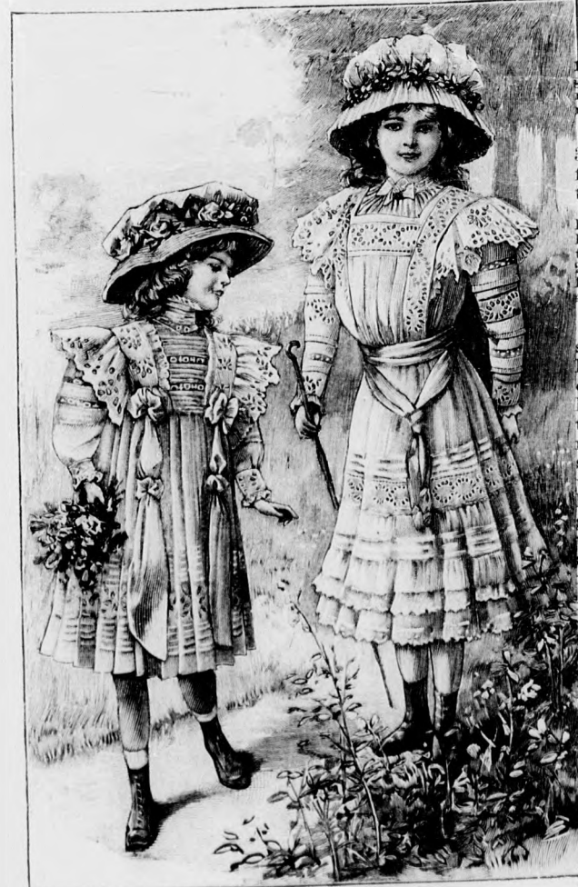
17. sz. Csüngő batiztruha 8-10 éves leány-nak. Szab., magy. és hátkep: mintaiv XXII. sz., 132-137a. fig. 18. sz. Batiztruha 10-12 éves leány-nak. Szab., magy. és az alsóruha külön: mintaiv VI. sz., 36-44b. fig.