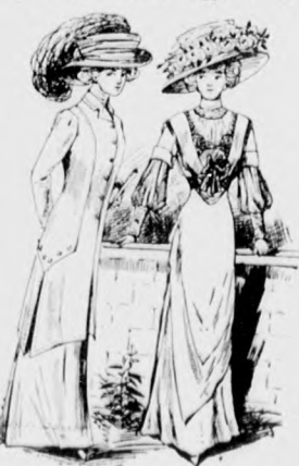
58-59. sz. Az 52. és 53. szám ellenkező oldalról.