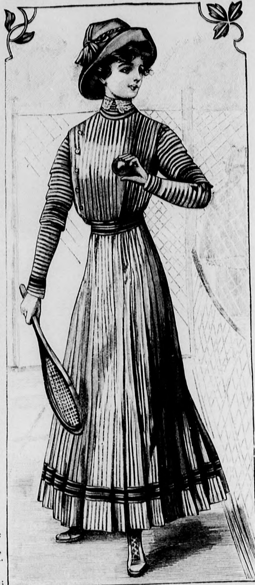
9. sz. Ruha szélpántos szövetből 15-17 éves leánynak. Szab.: mintáiv V. sz., 28-35. fig.

24. és 25. sz. Batisztbluz lyukacsos nimzes-díszszel. Anyag: 2 m. hosszú, 100 cm. széles fehér batiszt; 250 cm. hosszú, 6 cm. széles lyukacsos himzésű betét; 10 m. hosszú, 1 cm. széles valanszienbetét; 40 cm. hosszú, 45 cm. széles szegélybe varrt túllszövet betétekkel.