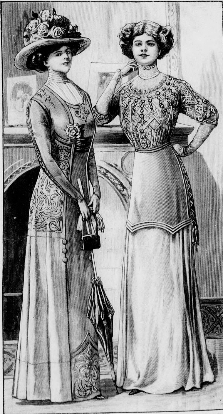
67. sz. Alkalmi vagy sétaruha sajtással díszítve. Ehhez hátkep: mintáiv 189. fig.

69. sz. Ruha fehér pikéből. Anyag: 7 m. hosszú, 80 cm. széles fehér piké; 20 cm. hosszú, 100 cm. széles fehér batízst; 10 cm. hosszú, 100 cm. széles lila batízst; 4 m. hosszú, 45 cm. széles csipke- betét; 45 cm. hosszú, 5 cm. széles betét- szövet; 25 cm. csüngős galand; 25 nagyobb, 7 kisebb, szövetbe behuzott gomb. Az eredeti mintánk könnyű fehér pikéből