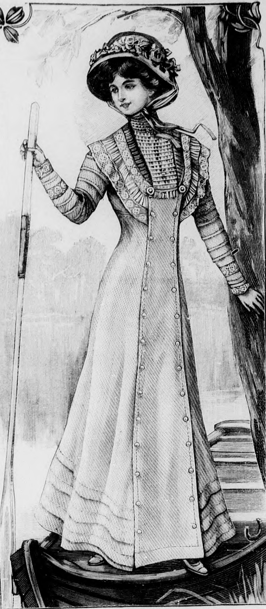
69. sz. Ruha fehér pikéből gallérrészel, hátul hölgyeknek. Szab. és hátkep: mintáiv XV. sz., 95-103a. fig.

A vörös sevíóból készített fürdőruhát kék petyekkel hímezett vörös szelvényt és kék esarp díszíti. A blúzt és madrágot 3 cm. széles öv egyesíti, az alj különálló. A baloldalt gombolt blúz a 138. és 139. fig. szerint szabjuk.