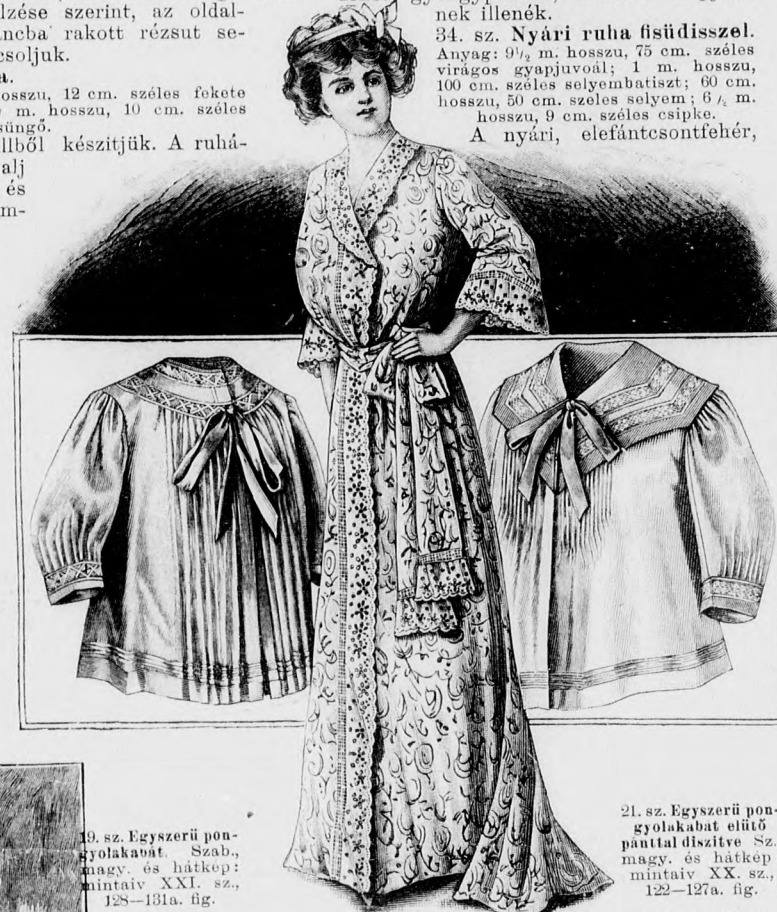
21. sz. Egyszerű pongyolakabát előli pantiál díszítve. Sz., magy. és hátkep: mintaiv XX. sz., 122-127a. fig.