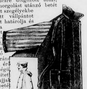
10-11. sz. A 7. sz. visszája és oldalképe.

Az egyszerű szabású ruhát rezedazöldszínű kasmirból készítjük. A hátulgombos belésderekat elől és hátul, a 75. és 76. fig. szerint szabott, sugárszerű szegélyekbe varrt és csipkefigurákkal díszített túll borítja. Ehhez hasonló az állógallér. A 77. fig. szerint szabott előli melldiszt a szövet színéhez hasonló színű himzés díszíti. A melldisznek felső szélét az előrajzolt vonalig pánt borítja. A dereknak a 78. és 79. fig. szerint szabott felsőszöveve csupán derékig ér. Mindkét részén, valamint a melldiszen is, finom harántvonal jelzi az alj felvarrását, a melyet