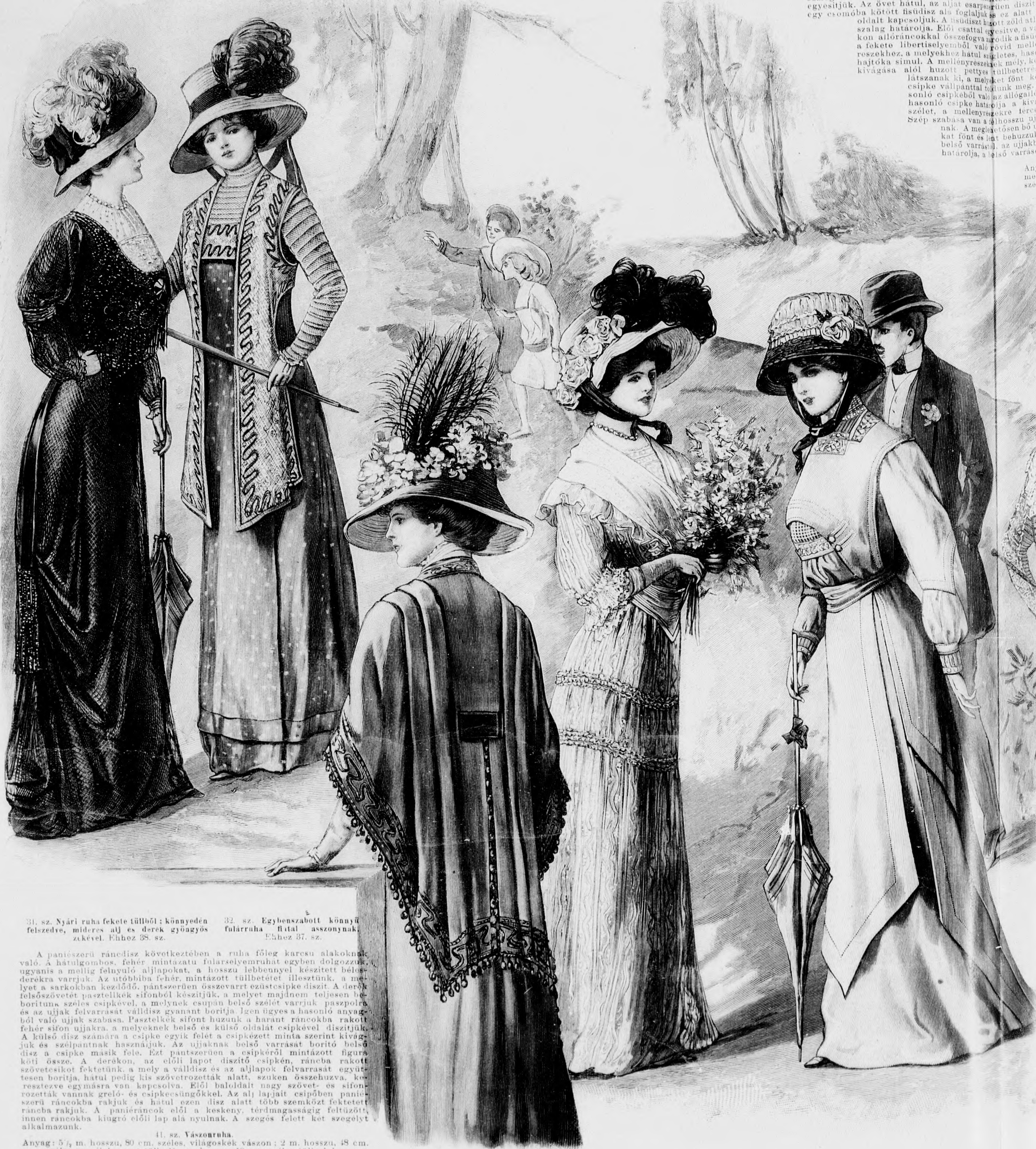
31. sz. Nyári ruha fekete túllból; könnyűen felszedve, mideres alj és derek gyöngyös akével. Ehhez 35. sz. 32. sz. Egybensabott könnyű fulárruha fital asszonyoknak. Ehhez 37. sz.

Az ujtás mintánkon főleg az egyenes, 4 m. bő alján az alsó felső szegzett dudoros díszet látszik meg. Az alj füzös állása miatt az alsó szegelt díszet, a melynek alját a felső szegelt díszet egészíti ki, előre fektetett ráncokba rakjuk a ráncolt libertiselyem szalag öv alatt testhezálló bélelssel kedvelt derékot egyesítjük. Az övet hátul, az alját esarpáruen díszítő egy esomóba kötött füzös dísz alá foglaljuk és az alját oldalt kapcsoljuk. A füzös díszet zöld atlan szalag határolja. Előli csattal egyesítve, a vállakon allóránccal összekötve a füzös díszet a fekete libertiselyemből való rövid mellrészekhez, a melyekhez hátul szögletes, hasonló hajtóka simul. A mellrészeket mely, kor kivágása alól huzott pettyes túllbetéttel látszanak ki, a melyket fűt kör csipke vállpánttal kötünk meg. A hasonló csipkéből való az allógallér hasonló csipke határolja a kivágott szegelt, a mellrészekre fűtünk szép szabása van a füzös díszünk. A megátörsön bő oldalt fűt és let behuzunk belső varrást, az ujjakban határolja, a felső varrást