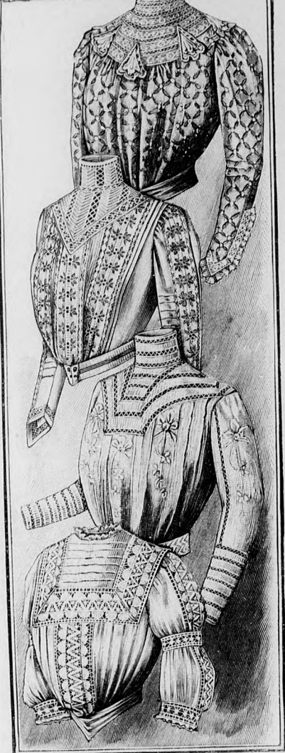
22-23. sz. Bluz madéra himzett szövetből. Szab., magy.: mintaiv XIX. sz., 118-121. fig. 24-25. sz. Batiztbluz lyukaesoshimzéssel. 26-27. sz. Bluz divatos gyapotkreppből kézi-himzéssel. Szab., magy. és rajz: mintaiv XVIII. sz., 114-117. fig. 28-29. sz. Batiztbluz betéttel díszítve.