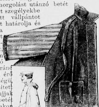
10-11. sz. A 7. sz. visszája és oldalképe.

Az egyszerű szabású ruhát rezedazöldszínü kasmirból készítjük. A hátulgombos beléderekat elől és hátul, a 75. és 76. fig. szerint szabott, sugárszerű szegélyekbe varrt és csipkefigurákkal díszített túll borítja. Ehhez hasonló az állógallér. A 77. fig. szerint szabott előli mellidisztt a szövötvé színéhez hasonló színü himzés díszíti. A mellidiszttnek felső szélét az előrajzolt vonalig pánt borítja. A deréknek a 78. és 79. fig. szerint szabott felsőszöveve csupán derékig ér. Mindkét részén, valamint a mellidisztt is, finom harántvonal jelzi az alj felvarrását, a melyet