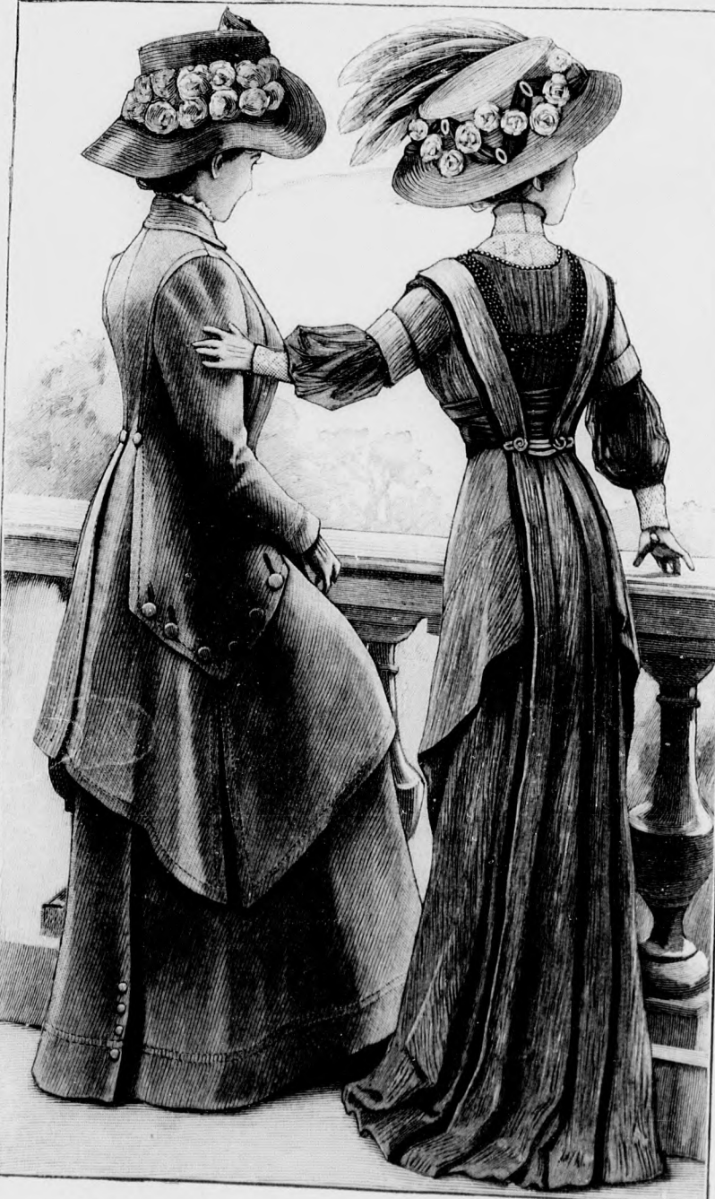
52. sz. Ujszabásu kabátos ruha; mideresalj. Félig testhezálló kabát. Ehhez 58. sz.

Sajátos magában egy- szerű mideres alj elkészítése. Míg a haranglap jobb fele teljes hosszában simán az előli lapra fekszik, a bal felet tunikaszerűen szabjuk. Az alj lapját a kis rajz 103-105. fig. szerint szabjuk. A haranglapot a 164. fig. szerint közepén előli egyben szabjuk, 11-től 31-ig a jobb alj fél szá- mára pedig csupán az alsó szeg- ély nyúló körvonalig, a baloldali számára pedig a csipkézott kör- vonalig. A 165. fig. szerinti előli lapnak jobb felet szintén a kör- vonalig és a bal a külső szeg- élyes kivágásig szabjuk. A har- ranglapok széleit a betűjelzések szerint aláfelel előli lapra tűz- zük, kép szerint ügyelve arra