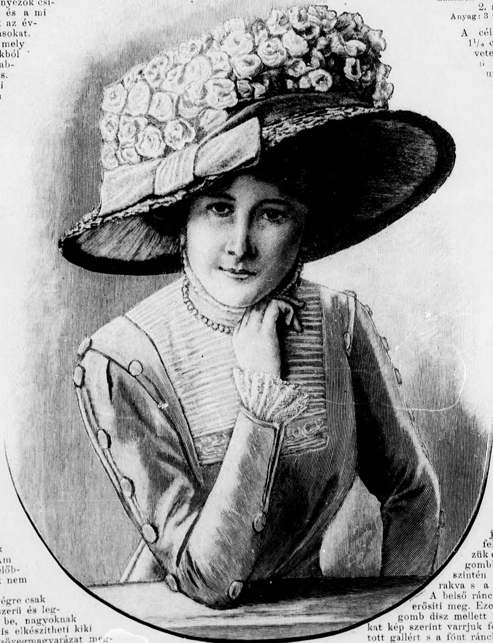
1. sz. Nyári kalap látogatásra vagy setához.

Anyag: 4 1/2 m. hosszú, 120 cm. széles szövet; 1 1/2 m. hosszú, 50 cm. széles rezsut vagott selyem; 18 selyemmel behuzott gomb; 2 bojt.