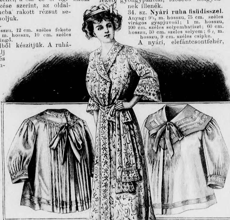
19. sz. Egyszerű pon-gyolakaat. Szab., magy. és hátkep: mintáiv XXI. sz., 128-131a. fig.