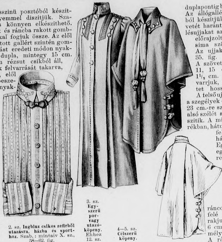
2. sz. Ingbluz csikos zefírből utazásra, házba és sporthoz. Szab.: mintaiv X. sz., 58-62. fig.

3. sz. Ruha szélpántos szövötvéből fiatal leánynek. Anyag: 7 m. hosszú, 75 cm. széles muszlin szélpánttal; 5 közepes nagy, 4 kicsi aranygomb. A kék és fehér csikos muszlinruhának alját és derekát egybe dolgozzuk. A szövötvének 5 cm. széles vöröszöld-fekete és fehér csikos szélpántját díszül használjuk. A hátul gombos beléderekat a 28-32. fig. szerint szabjuk. A belésujjakon az alsó ujjakat jelző körvonalak figyelembe veendő, szintugy a felső ujjak csillagai, a felső és külső szélein, a melyek között az ujjakat rátartjuk. A deréknek a 33. és 34. fig. szerint szabott felsőszövetének bal hátrészét csupán az előrajzolt körvonalig szabjuk ki. A jobb hátrész a gombolást takarva átnyulik a hátsó közepén. A felsőszövet-részeket a pontozott vonalak és kereszt és pont szerint ráncokba rakjuk, s a ráncokat szegélyek gyanánt bevarrjuk. Az alsó szélét a szegélyek összehúzásával, s elől csillagig behúzza, kellő bőségűvé tesszük. A külső ráncot jobboldalt öt s aranygombbal díszítjük, baloldalt pedig felvartt szélpántcsikkal borítjuk. A karöltőnél a vállakon külön összevartt felsőszövet, a vállat kiszélesítve, duplaponttól