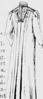
12. sz. A 3. sz. hátképe.