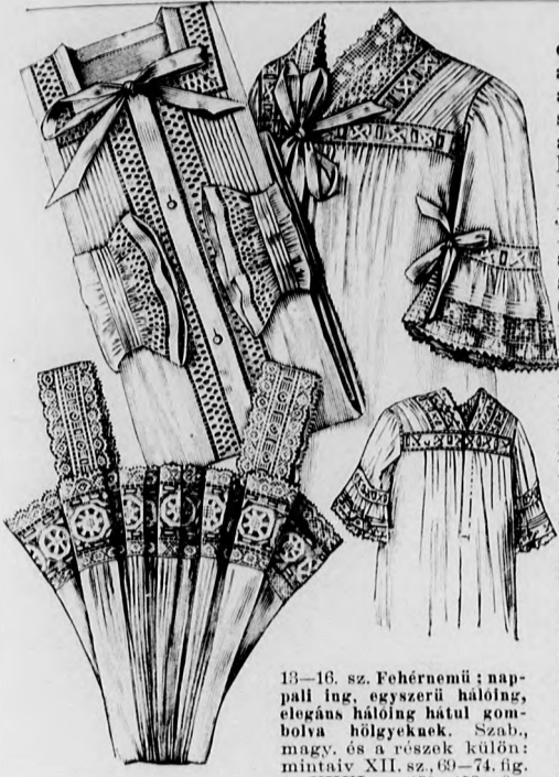
13-16. sz. Fehérnemű: nap-pall laz, egyszerű hálóing, elegáns hálóing hátul gombolva hőlgyeknek. Szab., magy. és a részek külön: mintáiv XII. sz. 69-74. fig. és XXVI. sz. 150-153a. fig.

lapra fekszik. Az aljnak a derékra való felvarrását ráncba rakott részut se-lyemcsik borítja. Az aljat és övet hátul baloldalt kapcsoljuk.