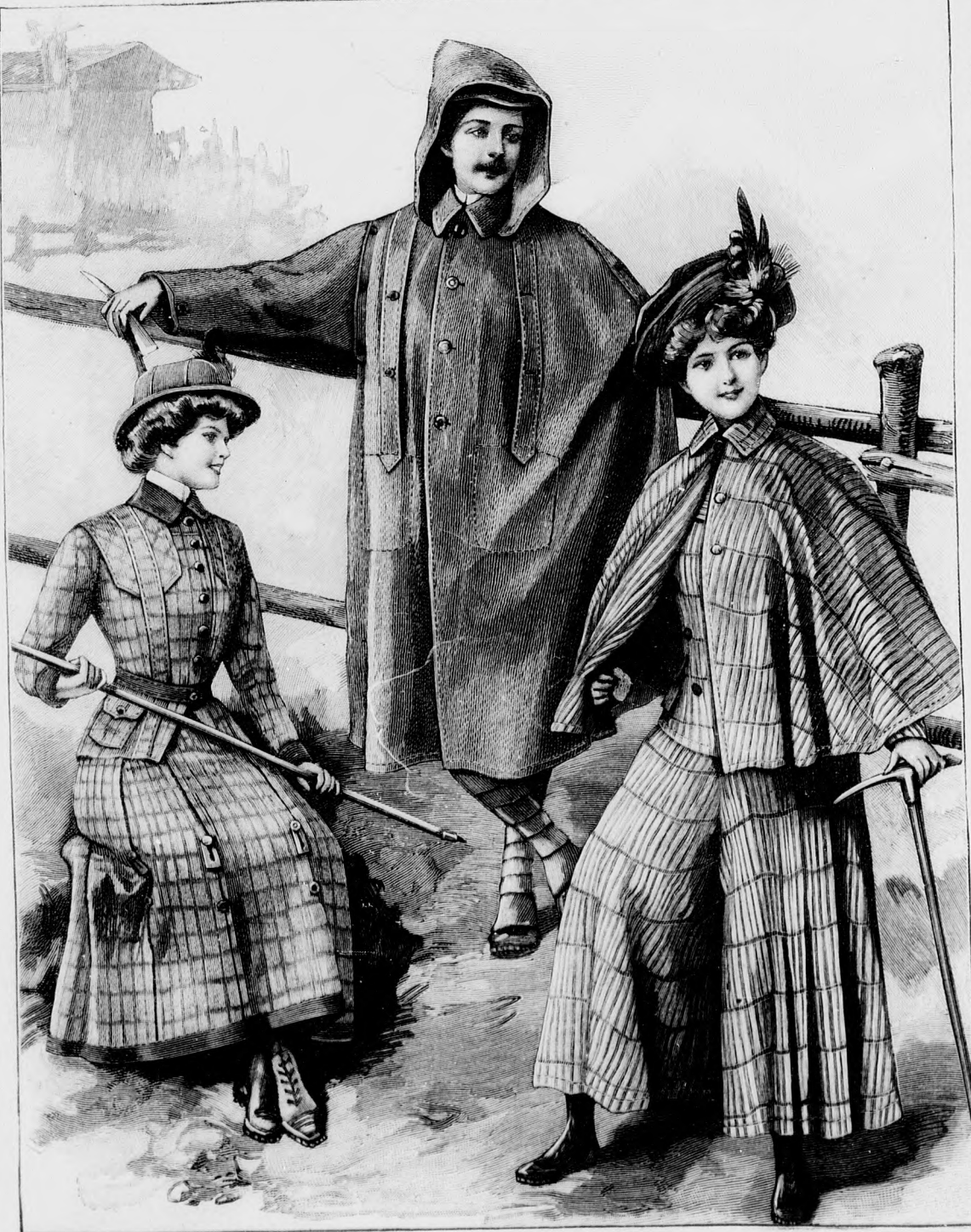
6. sz. Célszerű ruha utazásra és sporthoz; kilenc szélből való alj, nadrág, ingbluz és kabát. Ehhez 2. sz. Szab., magy.: mintaiiv XIV. sz., 81-94c. fig.