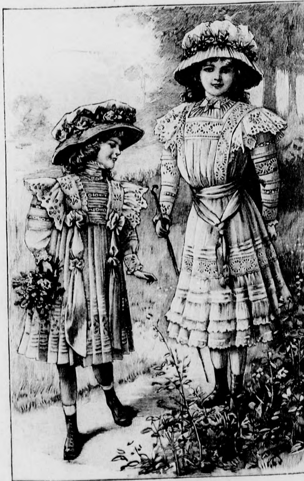
17. sz. Csüngő batisztruha 8-10 éves leány-lányoknak. Szab., magy. és hátkep: mintáiv XXII. sz., 132-137a. fig.

A málnaszínű básztselyemből való csinos ruhát, hasonlószínű gyöngytűzes (kordometselyemre húzva) díszíti előkelően. Eredeti a béleletlen alj szabása. A szögletes rövid előli lapot szélesen beszegve, a haranglapba foglaljuk. A fönt kissé behuzzott hátsó lapokat hasonlóképpen két egymásra eső részt jelezve állítjuk össze és oldalt a haranglap-hoz varrjuk. Az aljat elől baloldalt gomboljuk. Az alj felső szélét határoló ráncolt övet csinos csokor alatt hátul átkapcsoljuk. A hátulkapcsos derekat tisztán beékelt, elől sarkos, hátul szögle-tes, fehér, szegélybe varrt tüllyből és szélpántból készített vállpánt díszíti, a melyet a felsőszövet-részekhez varrunk. A külső széléin szintén gyöngy-tűzéssel díszített felsőszövetrészek szabadon borít-