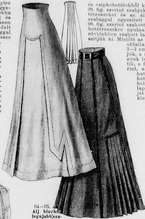
64-65. sz. Alj blúzhoz legujabbszá. bassal, herakott hátsó széllel. Kis

Az idősebb hölgyeknek is alkalmas ruha igen tetszetős. A ruhat lilaszínű lágy gyapju- szövetből készíthetjük, hasonlószínű selyem- szalaggal. Elkészíthetjük azonban baszt- selyemből vagy vászomból és egyszerűbb sajtáshímzéssel. Az előli és hátrész két rész- ből áll. Az első előli és második hátrész a második előli, illetve az első hátrész alá nyúlik. Mindkét előli említett részt sze- gélybe varrt tüllettel fölött kerék ki- vágjuk a felső szélén sajtással hímé- zük. Az alsó szögös fölött megismetlő-