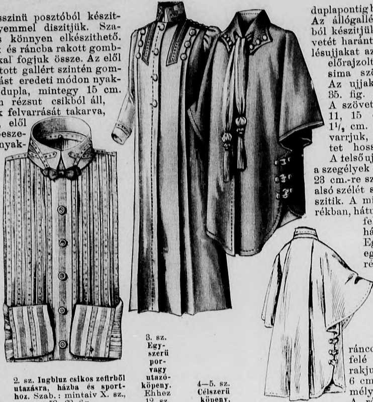
2. sz. Ingbluz csikos zsefből utazásra, háza és sporthoz. Szab.: mintáiv X. sz., 58-62. fig.

A kék és fehér csikos muszlinruhának alját és derekát egybe dolgozzuk. A szövetnek 5 cm. széles vöröszöld-fekete és fehér csikos szélpántját díszül használjuk. A hátul gombos belésderekat a 28-32. fig. szerint szabjuk. A belésűjjakon az alsó ujjakat jelző körvonalak figyelembe veendő, szintugy a felső ujjak csillagai, a felső és külső szélein, a melyek között az ujjakat rátartjuk. A dereknak a 33. és 34. fig. szerint szabott felsőszövetének bal hátrészét csupán az előrajzolt körvonalig szabjuk ki. A jobb hátrész a gombolást takarva átnyulik a hátsó közepén. A felsőszövetrészeket a pontozott vonalig és kereszt és pont szerint ráncokba rakjuk, s a ráncokat szegélyek gyanánt bevarrjuk. Az alsó szélét a szegélyek összehúzásával, s elől csillagig behuzva, kellő bőségűvé tesszük. A külső ráncot jobboldalt öt aranygombbal díszítjük, baloldalt pedig felvarrt szélpántcsikkal borítjuk. A karöltőnél a vállakon külön összevarrt felsőszövet, a vállat kiszélesítve, duplaponttól