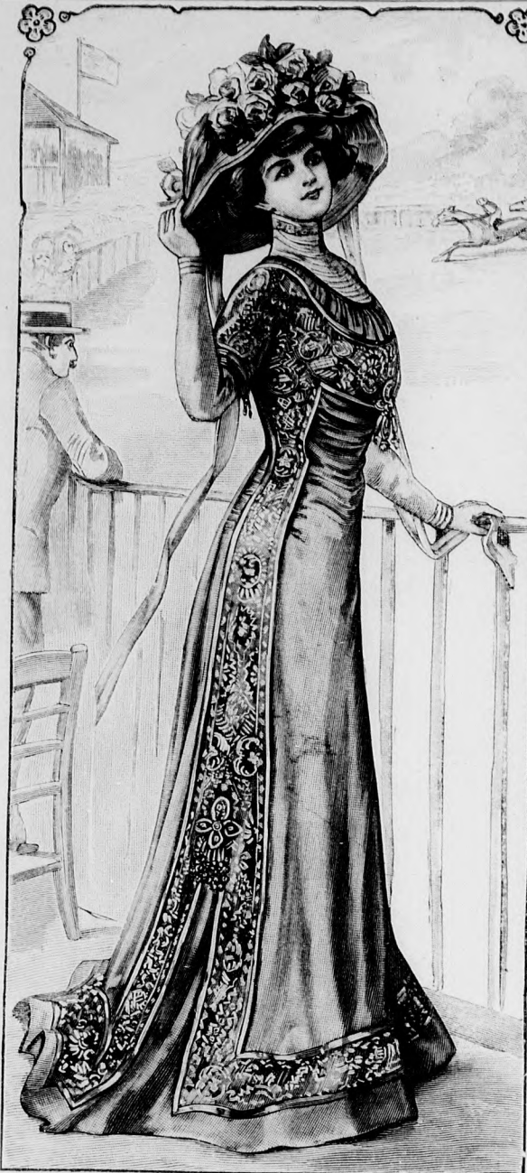
47. sz. Egyenszabott nyári ruha túll szélpánttal díszítve, különböző alkalmakra (regatta, gyógysetára stb.-re).

náljelzés szerint a 107. és 108. fig. szerint csipkeszövetből szabott felsőszövetrészeket erősítjük. Mintánknak kivágásszélét a csipke- szövetből vett minták díszítik, sűrű egymás mellé varrva. Ez alá kivágó vonalban selyemből készített, sűrű mintákkal díszítjük az előli rész alsó szélét, a 107. fig. rajza szerint. A karöltő felső fele, mint a kivágás széle, figurákkal díszítve, dupla ponttól dupla pontig, az ujjakra fekszik. Az utóbbihoz szükséges alap, a béléshez és felső- szövethez is alkalmas. A bélésujjak alsó szélét 15 cm. magas csipke- szövetből készíthetjük sifonalapon. Az ujjak felsőszövetét, melynek szélessége 1-1 cm. széles rancokba rakjuk. A ránca rakott selyemövet hátul csokor alatt kapcsoljuk. Túllbodor határolja a szegélybe varrt túll állógallert és az ujjak szélét.