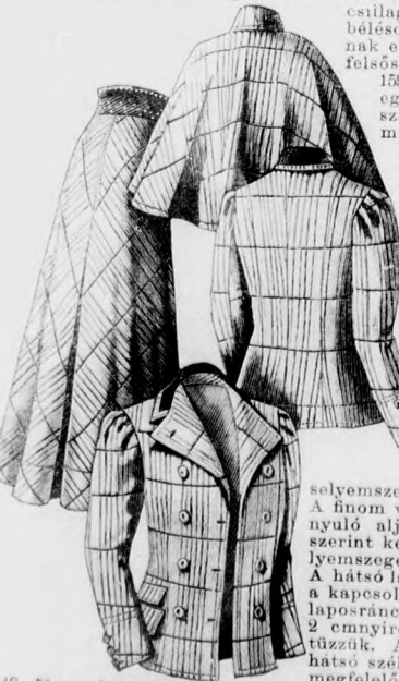
48-51. sz. A 8. szám ellenkező oldalról neveve.

lénzöbe foglaljuk. A ránca szabott selyemövet hátul egy fejecske alatt kapcsoljuk. Baloldalt esárpárisz van.