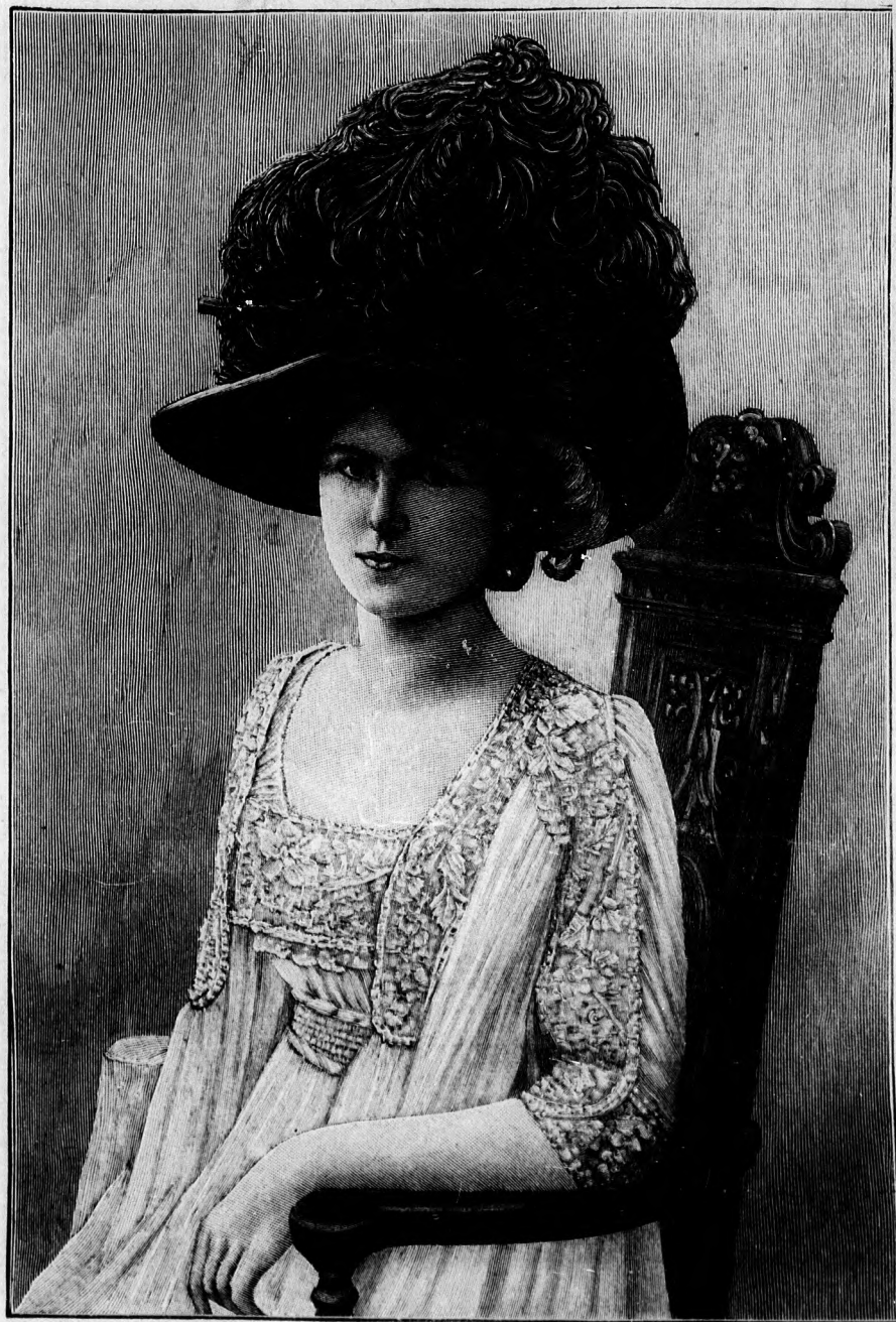
1. sz. Nagy kalap dús tollal.

Az egyszerű ruhának egybeszabott alja fehér vászomból, a bluzza pedig batisztból készült, kézihimzés díszel. Ha fehér vagy világosszínű szövetből készítjük, akkor a