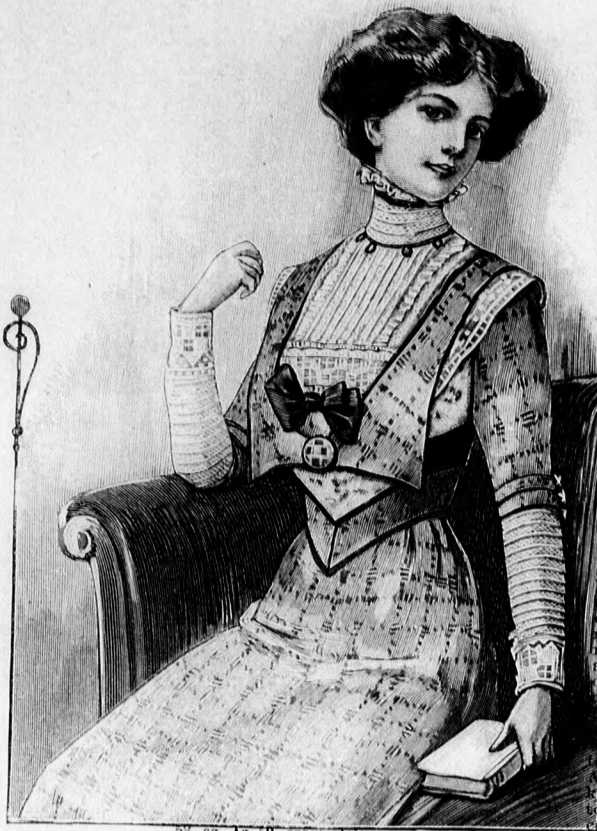
33. sz. Az 69. szám eleje.

32. sz. Ruha atlaszpántlisszal. Anyag: 5 1/2 m. hosszú, 130 cm. széles sevió; 1 1/2 m. hosszú, 20 cm. széles fekete atlasz; 2 1/2 m. hosszú, 15 cm. széles fekete libertiszalag; 1/2 m. hosszú, 120 cm. széles zöld sifon; 1/2 m. hosszú, 50 cm. széles szegélybe varrt batizs; 3 m. hosszú, 2 cm. széles valansziencsípke; 2 bajt. Az eredeti párisi minta szerint készült, már többször említett „moyen age” szabású ruha sötéttek sevióból való. De a gyapjuszöveten kívül fehér és vörös fularból, vagy bátszelyemből is elkészíthetjük, a mely szövetek szintén igen alkalmasak ehhez a szabáshoz; az utóbbi említett sinek pedig főleg tengeri fürdőzéshez alkalmasak. A ruhát gyakorlott kéznek kell készítenie, mivel a jó szabás a faja mag neki a jó szabó formát. A hosszú, félig széthálló derékrészek az első szélükön haránt irányban összehajtottak és 2, illetve 3 cm. széles atlaszsal vannak szegve. A derekat hátul gömbölyű és szalagosokkal szítjük. Erőlekes a gallerszerű dísz, a mellyel a hosszú ujjak egyben vannak szabva. A gallerszövetet atszegés határozza. Az előli gallerszövet csomozottatlaszokkal és bajttal végződik. Az előli gallerszövet egy második atlasz és egy harmadik szegélybe varrt csípkevel határolt batizsgallér borítja. A kiegészítő is két sor atlaszpántlissal készült. A ujjakat atlaszszegély és batizshajlaka, valamint túllámpikefelett zöld sifonborítja. Az alj lapjai kissé be vannak