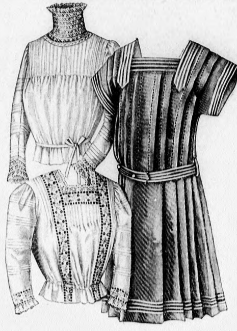
61. sz. Ruha kerek vállpántal 11-13 éves leányknak. Szab., magy. és hatkép; mintáiv IX. sz., 57-62. és 70a. fig.

A csinos, meleg nyárra való fehér tarka virágos fularból készített ruhát fehér csipke és csipkebetétek díszítik, valamint halványzöld bársonnyal beszegett szalag. A felsőszövet alját könnyű bélesaljjal viseljük; az előbbinek felső sima csipópántszerűen szabott részét négy részből szabjuk. A hátrész keskeny laposrészert mutat. Az alj alsó felét szegélybe varrt csipke, való felvarrást. A szegélyes ráncokba rakjuk és a felsőrészt alá tűzzük. Disze bársonyszalaghurkok és szövetgombok. A hátul kapcsos derekat előli és hátul szegélyes szegélybe varrt, tisztán beékelte betét díszíti. A derek szövete sima és majdnem teljesen borítja a füstgallér, a mely hátul az öv alatt eltűnik és előli három csokorral egyesítve balra átnyúlik. A gallér két betétekből egy szá-