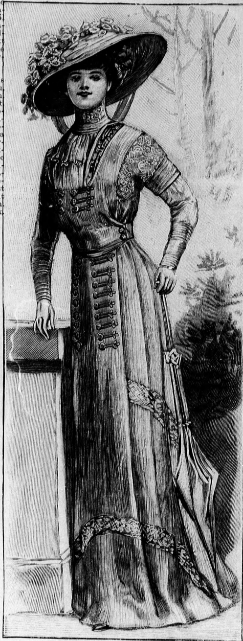
69. sz. Elegáns kreponetruha egybedolgozott alja és derék. Látogatásra, sétára, loversenyre, evezős versenyre stb. Ehhez a 40. sz.

Az eredeti mintánk fehér vászonnal való. A vadszőlőágakat ábrázoló, könnyen kidolgozható, laposhimzés igen csinos és elegáns teszi a kabatot. Az izeveten kivágott vállpántreszeket, mint látható, különböző nagyságú lapos pettyekkel himezzük. A himzéshez fényfonalat használunk, amelynek vastagsága a szövethöz hasonló. A himzést egyénizles szerint a szövet színében, vagy pedig színes szöveten fehérrel, vagy fehér szöveten színesen dolgozzuk ki. Eredeti a hengerdísz is. Ezt keskeny, erős zsinór betéttel, részben szövet esikből készítjük. Osigalában összesodorva és gombdísz utánzatként felvarrva. Ezeket a csigalakat kökát részben dupla sorban varrjuk fel és hengerekkel egyesítjük. Így foglalja össze az oldalhasítókat, valamint a kabát előli szeleit is és itt a keskeny kapcsolt mellényrészeket át balra átkapcsoljuk. Hasonló dísz van a hengerhatárolt gallérnak is az egyszerű ujjának, amelynek felsőujja hasított.