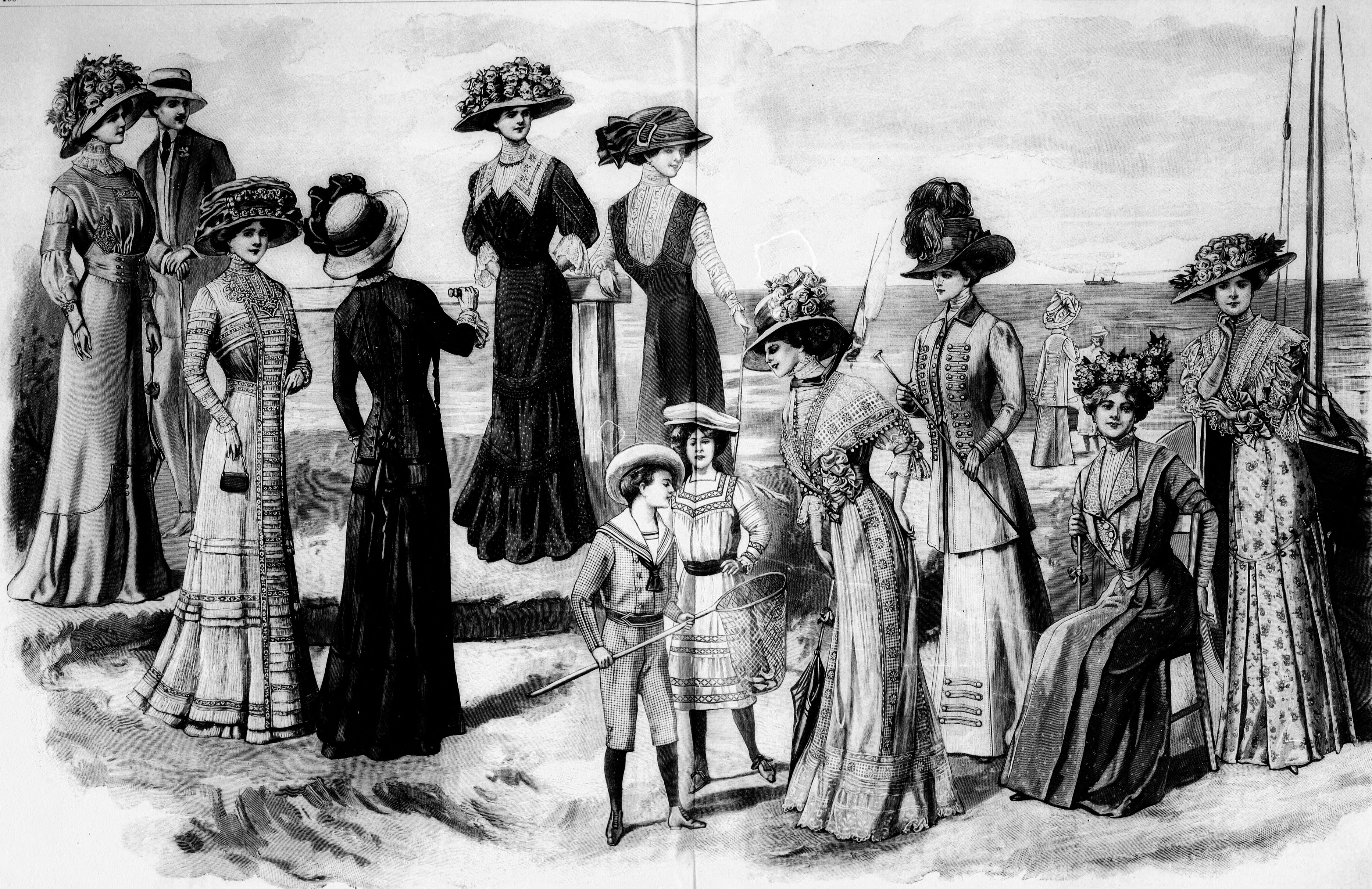
41. sz. Ruha (uj, a derekban jelzett derek- vonallal) basztelyemből; az alj és derek egybedolgozva. Ehhez 10. sz. 42. sz. Egybeszabott ruha fehér krepon- ból betétlisszel. Ehhez 17. sz. Szab. mintáiv XV. sz., 100-107. fig. 43. sz. Ruha atlaszpánttal és esarpdisszel; állógallér nélkül moyen-áge szabás. Ehhez 18. sz. 44. sz. Célzerű falarruha derekát és mosható batist- disszel. Ehhez 19. sz. 45. sz. Célzerű ruha egybeszabva blúzsal, könnyű tamburirózással. köp- retb alakra is alkalmas. Ehhez 20. sz. A szoknya szab.: mintáiv XVIII. sz. 110-120a. fig. 46. sz. Matrózöltöny 11-13 éves fiúknak. Szab., magy.: mintáiv XXV. sz., 132-141. fig. 47. sz. Mosóruha 11-13 éves leányoknak. Szab., magy.: mintáiv XXIV. sz., 147-151. fig. 48. sz. Elegáns nyári ruha fehérhímzéssel és elűtő derekka; az alj csipkével díszítve, a derek csucsbán végződik. Ehhez a 71. sz. 49-50. sz. Célzerű kabátos ruha, hat szelvével való aljjal és mellény- rezes kabáttal. 51. sz. Ruha falröböl hajlékával külsőrebb lédesebb hűtőgyekek. Ehhez 72. sz. Szab., magy.: mintáiv II. és III. sz., 8-25. fig. 52. sz. Ruha virágos falröböl herakott alj csipőpánttal és hűtő- derekka. Ehhez 73. sz.