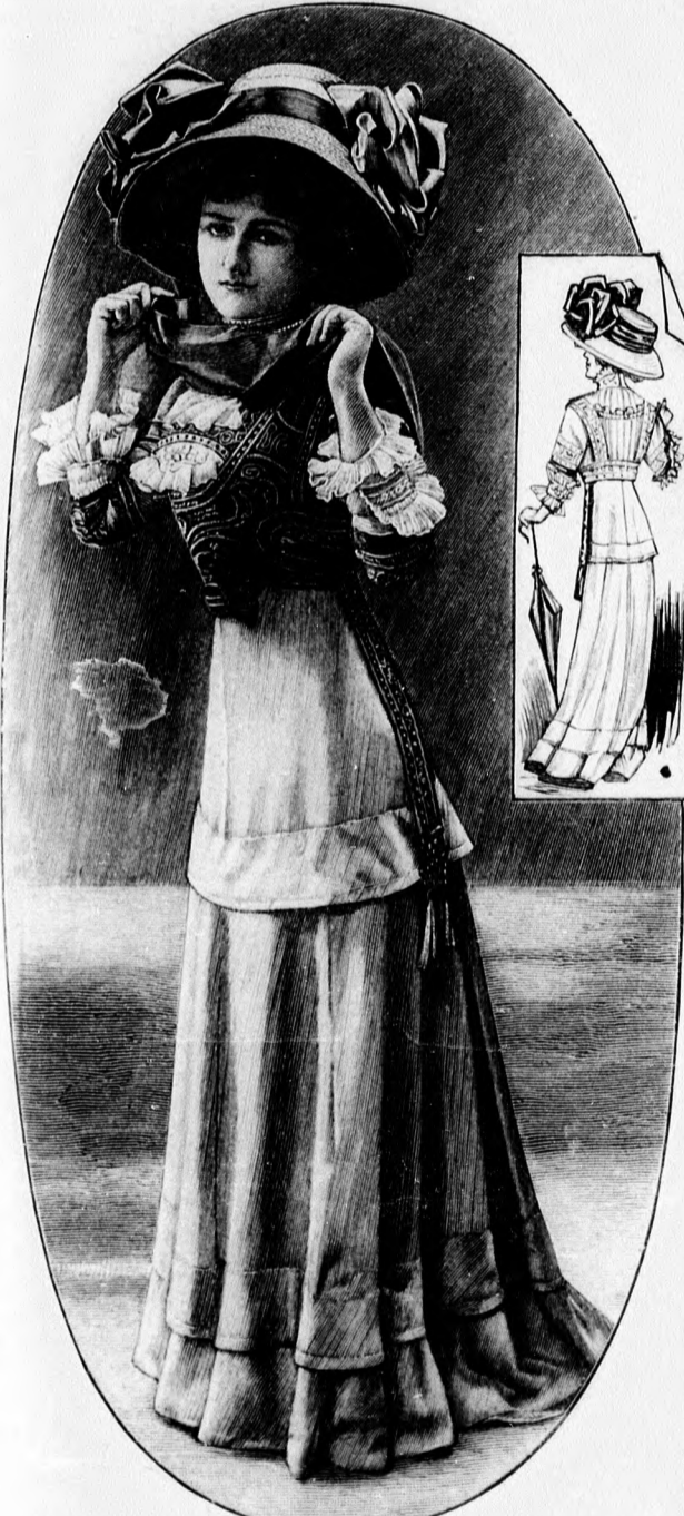
85-86. sz. Elegáns ruha; a derék és alj egybedolgozva, divatos mideresalaj csipőpánt utánzattal és zekedisszel.