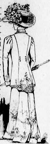
13. sz. A 2. szám hátképe