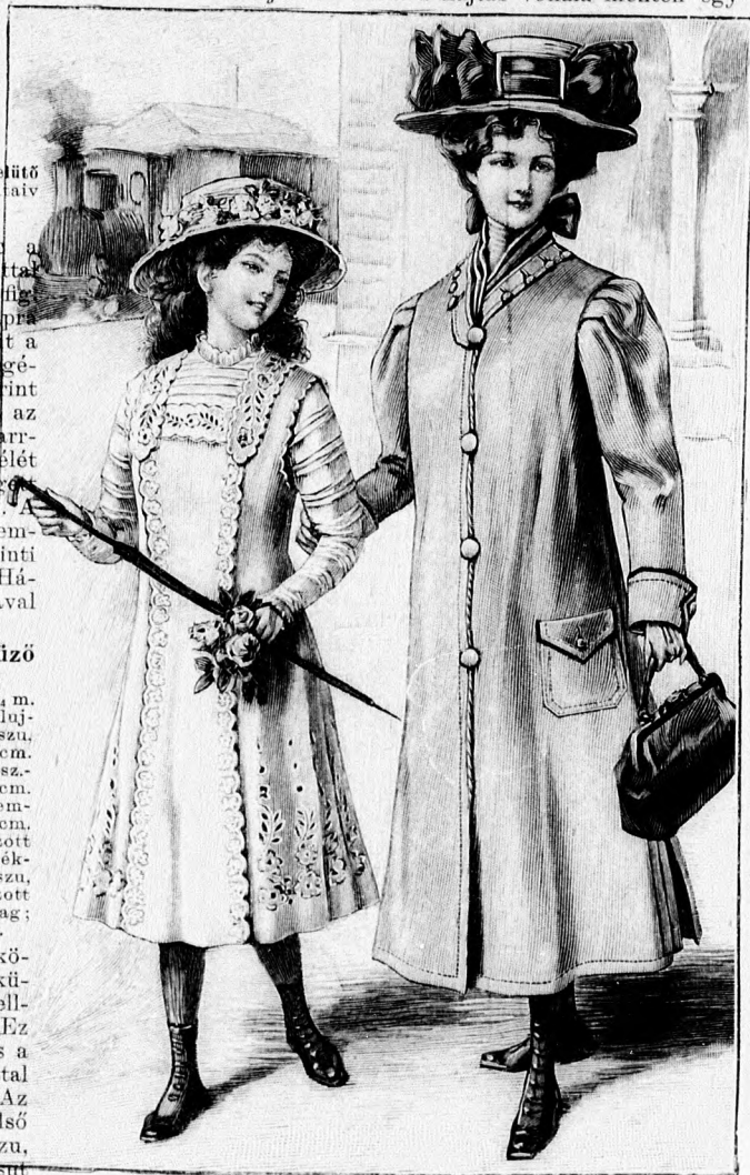
14. sz. Egyszerű nyári ruha kézhímzéssel változtatható bluzsal 8-10 éves leányknak. Szab., és hátkép: mintáiv X. sz., 63-70a. fig.