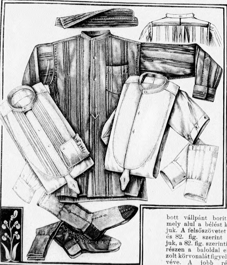
3-10. sz. Fehérnemű férfiak: sporting, nappali ing puha pikémellel, ing esikós rászón mellet és különálló alsó ujjal, rövid színes harisnya. Szab., magy. a 3-5., 7. és 8. sz.: mintáiv XII. sz., 72-79. fig. és XXVI. sz., 162-169. fig.

bott vállpánt borítja, a mely alul a bélést kivágjuk. A felsőszövetet a 81. és 82. fig. szerint szabjuk, a 82. fig. szerinti hátrészen a baloldal előrajzolt körvonalt figyelembe véve. A jobb részből vágott, kereszt és pont szerint rakott laposráncot a szélein letűzzük és a kapcsolást vele borítjuk. A laposránc mellett és a hátsó bal részbe rajz sze-