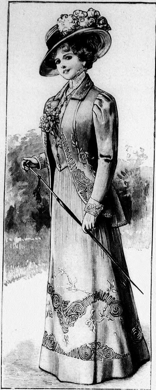
2. sz. Vászorruha; harangalj és mellnyrészes kabát, sujtással és laposhímzéssel díszítve. Ehhez 13. sz.

6 m. hosszú, 3 cm. széles valansziencsipke; 1 m. hosszú, 3 cm. széles zsinórszalag; 1/2 tuat kicsi, fehér, gyöngyházbomb.