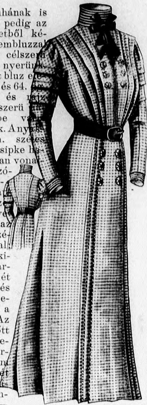
11-12. sz. Egyszerű házi ruha előli selyemdíszsel. Szab., magy.: mintáiv XVI. sz., 108-112. fig.

20. sz. Ruha fehér moll gallér- és kézelődíszsel. Anyag: 8 1/2 m. hosszú, 80 cm. széles gyapjuszalag; 7 m. hosszú, 55 cm. széles sötétkék libertiselyem; 1 m. hosszú, 100 cm. széles fehér moll;