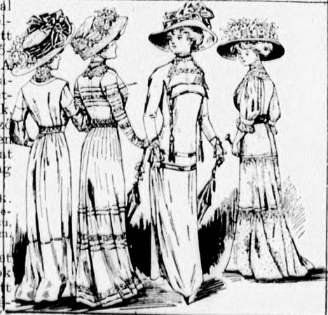
16-19. sz. A 41-44. szám ellenkező oldalról nézve.

bott vállpánt borítja, a mely alul a bélést kivágjuk. A felsőszövetet a 81. és 82. fig. szerint szabjuk, a 82. fig. szerinti hátrészen a baloldal előrajzolt körvonalt figyelembe véve. A jobb részből vágott, kereszt és pont szerint rakott laposráncot a szélein letűzzük és a kapcsolást vele borítjuk. A laposránc mellett és a hátsó bal részbe rajz sze-