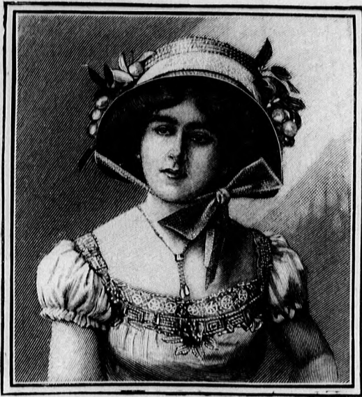
64. sz. Kosáralaku kalap gyümölcésszel.

határolja. Az utóbbi a részut fektetett, pánttal díszített oldalrészre nyúlik. A hátsó gombolást laposrácserű hátsólap borítja. A sima blúz egyszerű buggyos ujjait magas szegélybe varrt túll közelítő borítványokat ezüstszalag és fekete atlaszszalag díszít. A keresztbe fektetett szegélyek határolják a hátsó részeket. A zsebek csinosba varrt kivágásából valanszienpipkével határolt fehér túllborító és allógallér dísz látszik ki. A nyakkendő fekete atlaszból való. A zseke szabása igen csinos és kövérebb hölgyekre is alkalmas. A kissé hosszabb előli részek redősen lógnak le és széles hajtogatással vannak díszítve. A rövid s a külső szélén kissé csipkézett ujjakat a zsekerészekből szabjuk. A zseket előli egymást borító mellényrészek egyesítik.