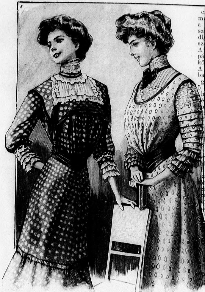
Két célszerű ruha falából és gyapotmuszlinból is készíthető. 20. sz. Ruha fehér null gallér- és kezélfé- disszel. Szab. és hátkép: mintav XIII. sz., 80-91a. fig. 21. sz. Ruha csipkével díszítve és esu- ces derékkal. Szab., magy. és hátkép: mintav XVII. sz., 113-118a. fig.

szegélybe varrjuk és a 126. fig. szerint szabjuk, a behajtás kiegészítésével. Az előli varrás kidolgozása után, az előrajzolt vonaltól kezdődően, egyforma közőkben, négy valanszienbetét varrunk az ujjakba. Az ujjak alsó szélét pliszés csipke határolja, épp úgy mint a szegélybe varrt batizst állógallér felső szélét.