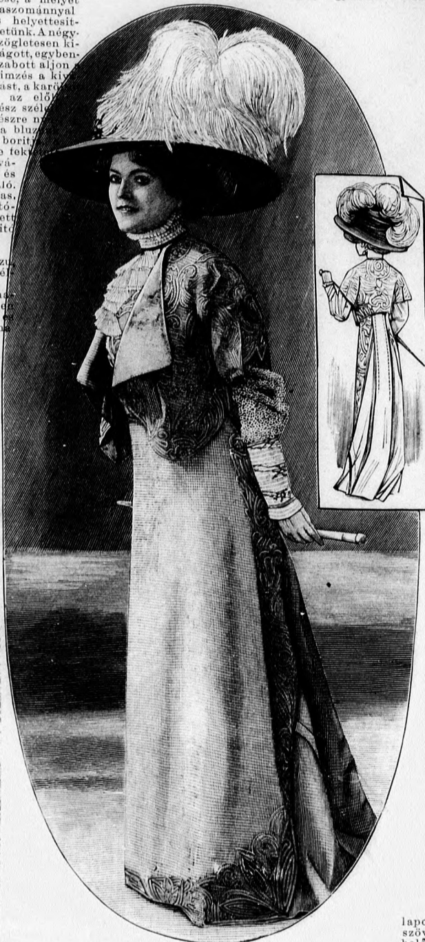
67-68. sz. Elegáns ruha egybeszabva blúzzal és rövid zsekvél, sétára, látogatásra stb.

Eredeti elegáns mintánk egyben szabott alját és derékát ezüstszürke popelinből, a blúz pedig betéttel krakela túllból és sima fehér túllból készítjük. Igen csinos az öltözéknek dísz és színéhez hasonló zsinórhimzése, amelyet paszománnyal is helyettesíthetünk. A négy-szögletesen kivágott, egyben szabott alján himzés a kinyugt, a karján s az előli rész széles