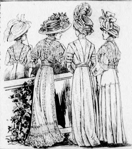
70-73. sz. A 45., 48., 51-52. szám hátképe.

A csinos, hátul kapesolt ruhát részben haránt, részben függőleges irányban szabott kék-fehér csikos gyapjuszövetből készítjük. A felsőszövetet előli és hátul három 4 cm. széles laposrácba rakjuk, a melynek köréit az előli részen haránt csikos szövettel töltjük ki. A nyakkivágást kék szövöveget határolja és belőle készítjük az egyszerű buggyos ujjaknak 7 cm. széles közelítő. Az alját 250 cm. bő