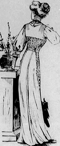
12. sz. A 13. szám hátképe.

rek kivágását fehér, függőleges szegélybe varrt túll vállpánt tölti ki. Ehhez hasonló az állógallér és túllbodor. A blúz felsőszövet részein a selyemnek széles feketé csikjait 1 cm. széles szegélybe tűzzük s az előli és hátrészt részut tekintve szabjuk, hogy a csikok előli és hátul halszállkaszerűen sorakoznak egymás mellé 12 cm. széles, ivetetten egymásba nyúló sujtással és zsett gombokkal kivarrt, 12 cm. széles szürke túllpánt az előli dísz. A vállpánt széleit 6 cm. széles pánt határolja. Az egyszerű hosszú ujjak selymét szintén szegélyekbe varrjuk és haránt tekintjük. Az ujjak alsó szélét túllbodor határolja.