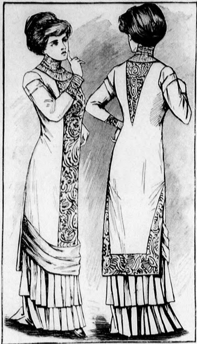
44-45. sz. Zsákformájú párisi öltözék kerek aljjal.

Az igen divatos szabásu, lila gyapjusza- ten ruhának ezüsttűll a dísz. Az állógallér, a betétrészek és kézelők túlljét soronkint lilaselyem sujtással varjuk ki. A szintén ezüsttűll zekének ráncait gombok díszítik s a széle rojttal végződik. A ruhát hátul- kapcsolt bélésderékra dolgozzuk, hozzávarrt bélésaljjal. Az egymást keresztező előli ré- szek simán borítják a vállakat és a laposrán- cokba rakott hátrészekre gallérszerűen van feltűzve. Az alsó széleit két oldalt két pántba hajtjuk, ezeket egymásra tűzzük és övsze-