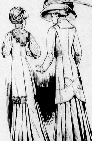
62-63. sz. Az 57. és 58. szám hátkepe.

66. sz. Aikalmi ruha tülldísszel idősebb nőgyeknek.