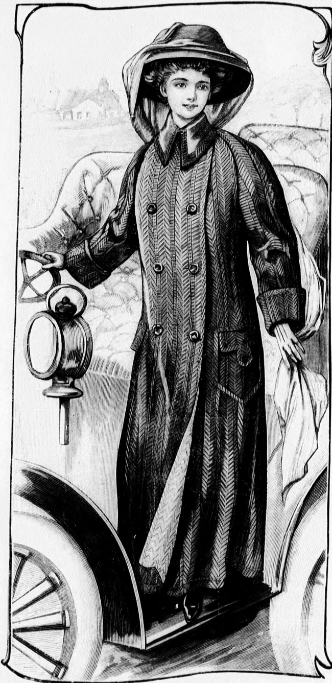
47. sz. Célszerű köpeny raglanujjakkal. Utazásra, sportolásra és automobilo- zashoz. Szab. és hátkép: mintaiv XIV. sz., 88-93a. fig.

légj terjedő első előli részei oldalt pántszerűen a rövidített második előli részre nyúlnak, amelyeket ráncolt leb- benyrésszel toldunk meg. A pántok sujtással vannak kivarrva, szegélye- zettek és látszólag gombokkal vannak felelősitve. A széles egybeszabott hát- résznek az oldalrészekkel egyesítő var- rását lent ráncokba rakjuk. A kabát- nak egysorosán gombolt, egymást szélesen borító előli széleit 15 cm. szé- les vászonnal béleljük, sálgallérszerűen visszahajtuk és fekete ottománselyem- mel borítjuk. A kabátot négyyszögletes fekete bársonygallér díszíti, most diva- tos kis matrógallért utánozva. Az egy- szerű sonkaújjakat a felső karöltőnél az első előli és hátrész alá tűzzük. A sujtás- sal kivarrt pántszerű kézelőket látszó- lag gomboljuk. A kabátot végigselyem- mel béleljük, az alj béleletlen marad.