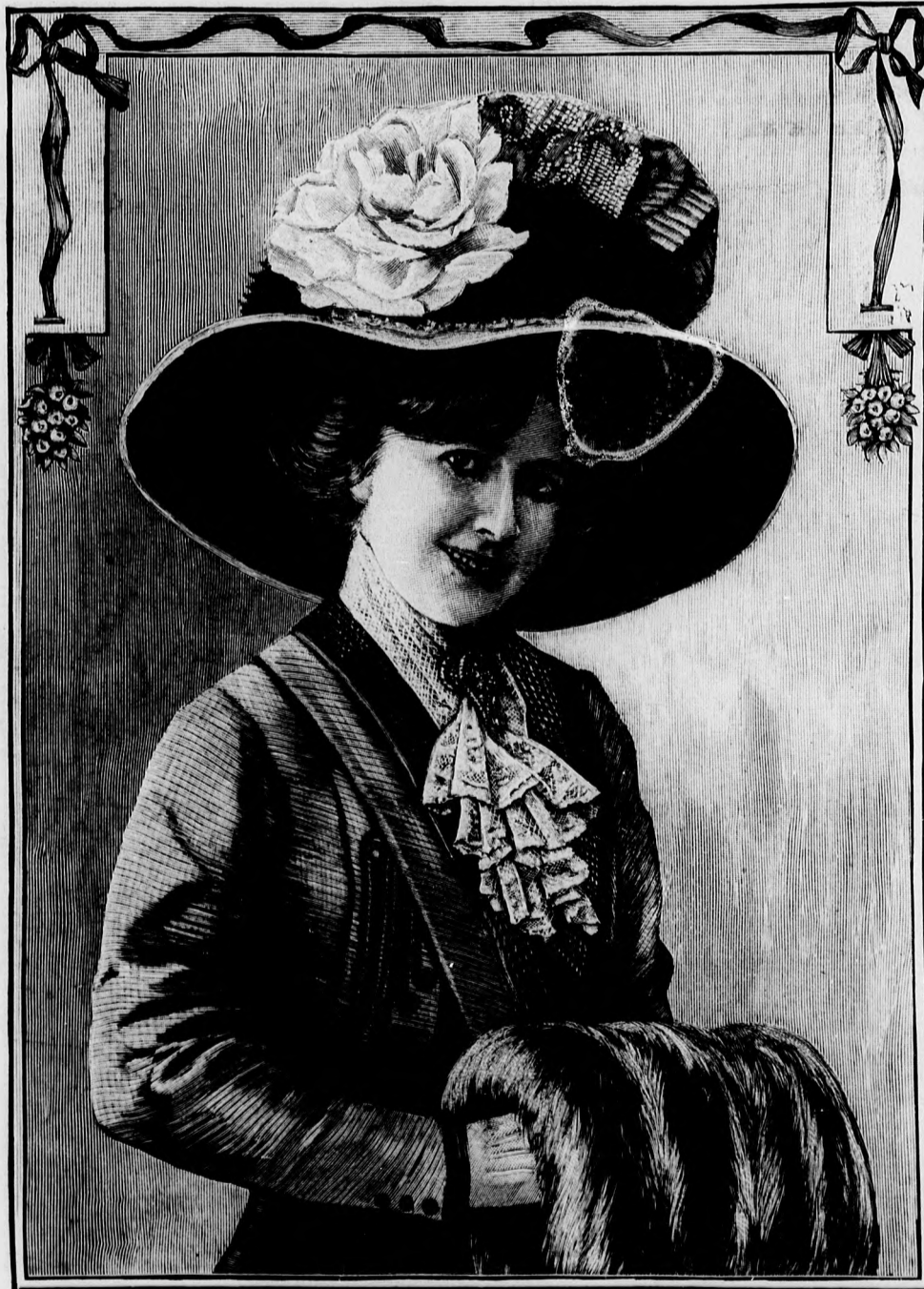
1. sz. Csinos téli kalap prémdíszel.

hátul mélyebb legyen, mint elől és csúcsos legyen. Ami különben a kivágást illeti, a divat most nagyon engedékeny, a mi viszont helyes is, mert a kivágásnak olyannak kell lennie, hogy emelje az arc s a nyak szépségét és ez a tulajdonsága a csúcsos és a kerek kivágásnak megvan. Már most aztán azt, hogy a kivágás mélyebb legyen-e vagy kevésbé mély, abban egyrészt dönt a hölgy alakja, másrészt az egyéni érzés; ám ne hogy tulságos szemérmességéből valaki nagyon is szerényre szabassa a kivágást, mert ezzel könnyen elronthatja az egész ruhát. Az uszály természetesen hosszú, sőt nagyon hosszú, miután a köztudatban benne van már az a felfogás, hogy az eleganciát az uszály hosszúsága adja meg. Pedig ez nem helyes, mert éppen az mondható elegánsnak, aki eltér az ilyen általános divattól és mi azt tanácsoljuk, hogy húsz-húszöt centiméternél hosszabb ne legyen, és bársony, moaré vagy damasztruhának az uszályát szabassuk szögletesre. Ez a „modern” szögletes forma az uszályrészt keresztbe szabva mutatja, vagyis a hátsó szél vagy húsz centiméterrel rövidebb az oldalrészeknél és egyenes szögletes résszel van kiegészítve. A felső széle kissé húzott és úgy van bele varrva a hátsó lapba, hogy annak alsó széle lazán rásik.