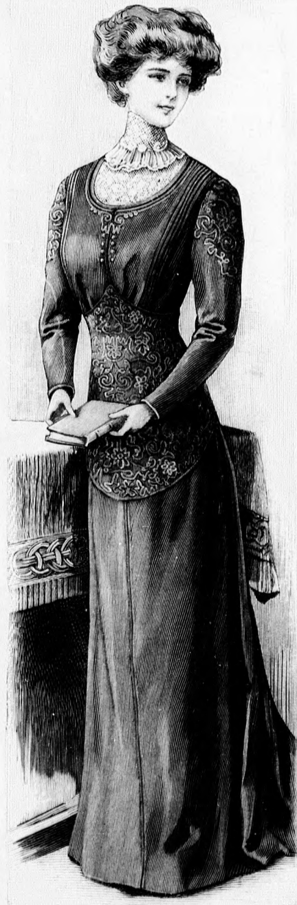
46. sz. Egyszerű ruha sujtással kivarrva. Az alj és derék egyhedolgozva. Ehhez 30. sz. Szab. magy.: mintaiv XVIII. sz., 121-130. fig.

Az aláfoglalt szövetrészt felső szélére var- juk a tulajdonképpeni zsebet. A zsebpántot jelzés szerint a felső kivágás széle alá tűz- zük. A pántba gomblyukat dolgozzuk ki, a megfelelő gombot az aláfoglalt szövetrészt varrva. A nyakkivágás bevarrásának kidol- gozása után az előli szélét belülről fönt 20, lent 15 cm. széles szövetet borítjuk. Min- tánkon a 92. fig. szerint szabott lehajtott gallért barna bőrral borítjuk és 2 cm. szé- les szövetpánttal határoljuk. Az ujjak alsó, kereszt és pont szerint rácba rakott szélét a 93. fig. szerint szabott hajtóka határolja. Az alsó fél előrajzolt oldalszéle figyelembe veendő. Ezt a felső részre szám szerint a bélés alá varjuk. A hajtókának felnyúló részebe rajz szerint gomblyukat dolgozzuk ki, miáltal az alsó részre csillag jelzések szerint felvarrt gombok egyikével, vagy má- sikával tetszésszerint bővebbre, vagy szű- kebbre vehetjük.