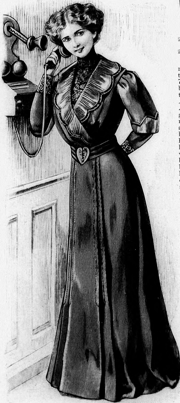
22-23. sz. Ruha gallérral díszített kövőbb hőtgyeknek. Szab., magy.: mintáiv I. és II. sz., 1-16. fig.