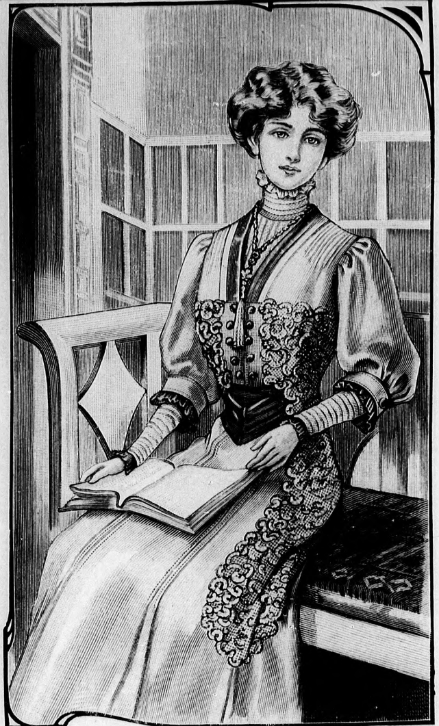
13. sz. Látogatórúha; hat lapból való alj, hegyes derék kabátformájú díszszel, kövérebb hölgyeknek is alkalmas. Ehhez 11. és 12. sz. Szab.: mintáiv XV. sz., 94-107. fig.