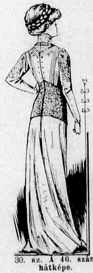
30. sz. A 46. szám hátképe.