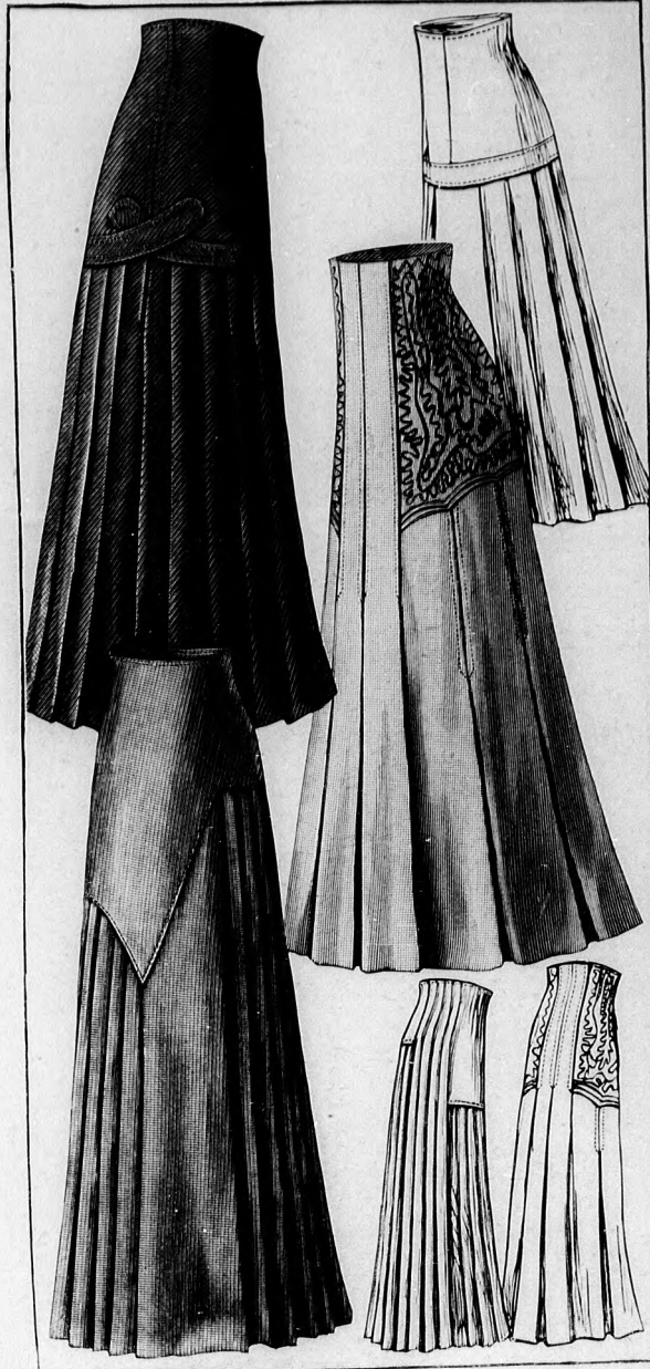
24-25. sz. Az 58. szám alja külön.

Az elegáns formájú kasmirruha alját mély plisszébe rakjuk, a hosszú derékat pedig hasonló színű (puha) tafotából készítjük. A ruha for-