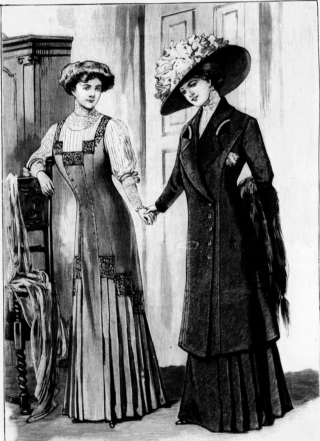
57. sz. Célserü házi ruha. Egybeszabott alj elcserehető bluzsal. Ehhez 62. sz. Szab., magy.: mintáiv XVI. sz., 109-113. fig.

Ujítás a mintánkon az, hogy bársony és tüll van benne egyesítve. Az alsó ruhának három részből álló, hátul rövid miderbe nyuló harangalja, a vele egyesített sima derékrészekkel szürke bársonyból való, míg a zsákszerű felsőruha, világosabb szürke pettyes tüll. A tüllbe egyes van beszőve a tamburirozott tüllből vett figurák, a széles szélpánt gyanánt. A fisűszerű, hátul egymást borító derék-dísz a derékon együttesen van szabva a zsákszerű díszrésszel. Ez utóbbiaknak a deréka való felvarrását, oldalt és előli, ráncolt libertiszalagból borítja. Az átnyuló jobb fisűrészt egy teljes szalagocokor díszíti. A bélésderék előli kapcsolását ezüst tüllalapa dolgozott, szegélybevartt tüllbetét borítja. A fisűrészek közé hátul hasonló betéte foglalunk. A vállpánthoz hasonlóan a szegélybevartt hosszú tüllujjak, amelyeket szélpánttal szegélyezett tüll felső-ujjak borítanak.