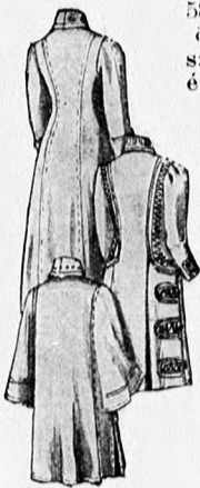
51-53. sz. Az 54-56. sz. ellenkező oldalról.

Az egyszerű szabásu köpenyen jellemző, hogy a jobb előli rész kissé húzott és hogy az egybeszabott széles hátrész haránt van fektetve. Az alsó rövidebb rész kissé húzott és annyira van a felsőrész alá varrva, hogy ez szabadon boríthassa. A drága eredeti párisi minta perzsapréméből való, skunksz sűlgallérral és ujjhajtókákkal; oldalt három zsettgombbal gomboljuk. Az ujjak simák. Az egész kabátot elefántszürke atlással béleljük. A szabása alkalmas bárszony, bordázott velvő, posztó és angol kabát szöveteiből való elkészítésére is.