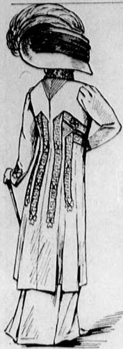
31. sz. A 36. szám hát.