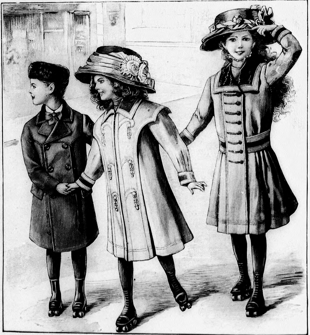
14. sz. Kabát 4-6 éves fiúnak. Szab., magy.: mintáiv VIII. sz., 51-58. fig.