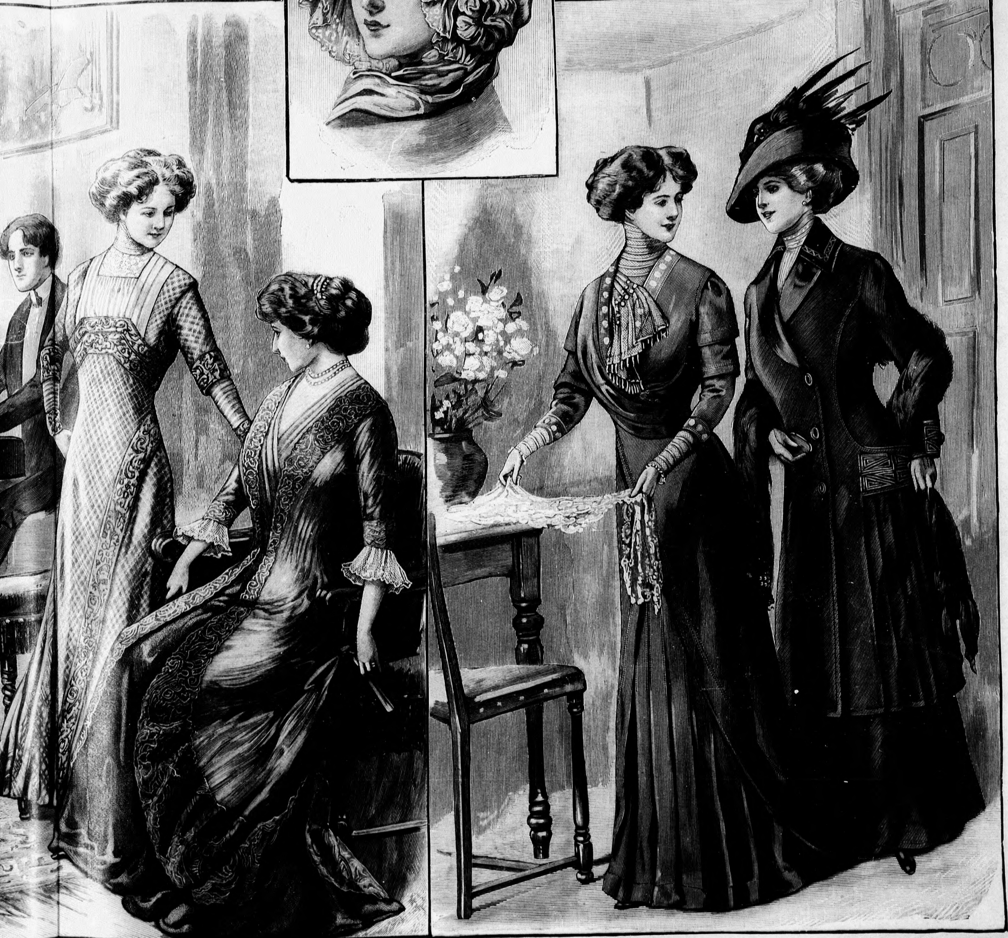
szövetből egyfelől díszszel. Az alj és derék egybedolgozva. Ehhez 33. sz.