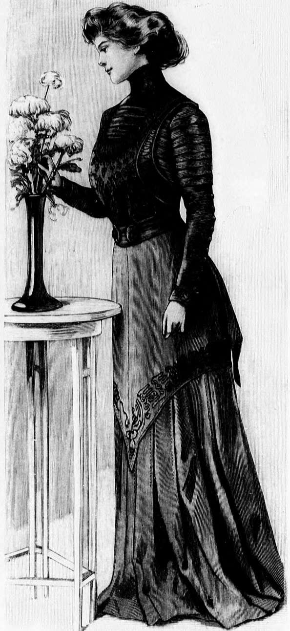
48. sz. Ruha sujtással kivarrva. Gyászhoz is alkalmas. A derékon zse- kformájú dísz, az alj csipőpántos. Szab. magy. és hátkép: mintaiv IV. sz., 23-31a. fig.

A hetvenes évekre emlékeztető, meglehető- sen különö külsejű, sza- lonba való ruha kétféle szövetből: bársonyból és posztóból készül. A hosszú zsákformát sötétkék bár- sonyból, a plisséziszt fe- kete tafotából készítjük. Díszül fekete selyemhim- zés szolgál, amely plas- tronszerűen húzódik az előli részre, míg a hátón szögletes betétet utánoz és a szabad hátsó rész alsó és oldalsó szélét szél- pántszerűen határolja. Az orosz ingeskéhez hason- lító kis kerek vállpánt ezüsttűll alpra mintázott fehér túllból van készítve. Ehhez hasonlít az álló- gallér. A szűk ujjakat a felső szélén szegélydísz, az alsó szélén himzett szélpánt és túllkélző dí- szíti. A ruhát előli kapcsolt