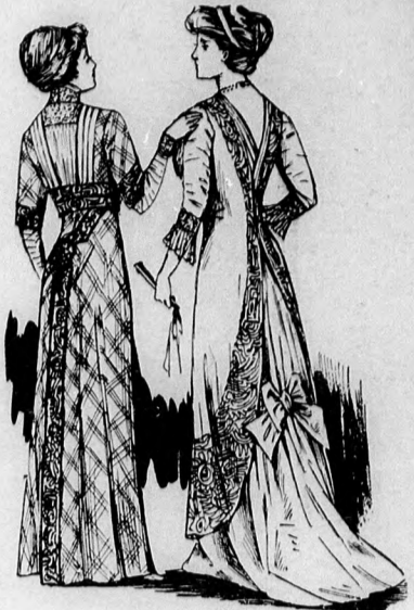
39-41. sz. A 39. és 40. szám hátképe

Anyag: 7 m. hosszú, 110 cm. széles lila gyapjúszatén; 1 m. hosszú, 50 cm. széles ezüsttüll; 3 m. lila sujtás; 25 cm. ezüstroj; 16 sujtásgomb; 25 cm. lila csüngős rojt; 1 sujtásos csatt.