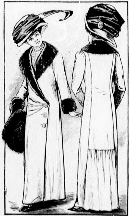
49-50. sz. Ujszabásu hosszú köpeny szörme- dísszel. Párisi model.

2 cmnyire ez előtt egy rész szövetet kívá- gunk, s a széleit a rajz szerint ki- hajtjuk. A kivá- gás alá egy old- alsó és egy lent a jelzést 2 cm- nyire túlhaladó szövetrészt a ki- vágás alá ferec- lünk és a kivá- gás széleit a rajz mögött 1 cm- nyire feltűzzük.