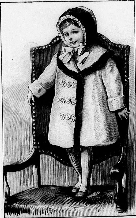
20-21. sz. Kabát és fejkötő 2-4 éves leánynak. Szab.: mintáiv IX. sz., 59-66. fig.

részt 15 cmnyi közökben a 161. fig. mintája szerint készített pántokkal díszítjük, amelyeket epp úgy, mint az előlieket és a külső szélét határoló 1 1/2 cm. széles pántokat letűzzük. Nehéz posztónál a pántok vágott szélük maradnak. A részeket a vállvarrás kidolgozása után a kabátra varrjuk. A kabátot kapcsoljuk. A 163. fig. szerint vászomból és bélésből készített lehajtott gallért fordított var-