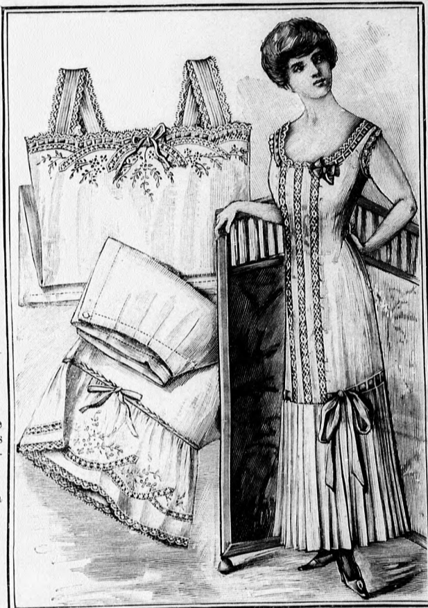
59-60. sz. Bálj ing és nadrág kézhímzéssel. Szab., magy. és rajz: mintáiv X. sz., 67-70. fig.

tábol készített öltözék való, amelynek kabátját egy háromszögletes csipkekendőből szabjuk. A kendő mély ráncokba lóg le hátul s a vállakon átvetve, a derék szögletes kivágást határolva és előli egy nagy zsettfigurával megerősítve