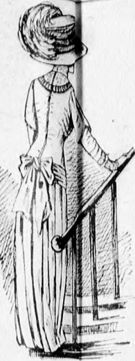
32. sz. A 35. szám hátkepe.

Egyszerű, de mégis elegáns az egybedolgozott szürke, zöld, fekete nagy kockás, rézsut fektetve szabott gyapjuszövetruha, melynek egyoldalú eredeti alj dísz hímzett szélpánt. Amint látjuk, a hátul kapcsolt deréknak elől és hátul egyforma halványzöld pettyes túll betétjét zöld alapra húzott sötétszürke sifonrész egészíti ki. A kivágás