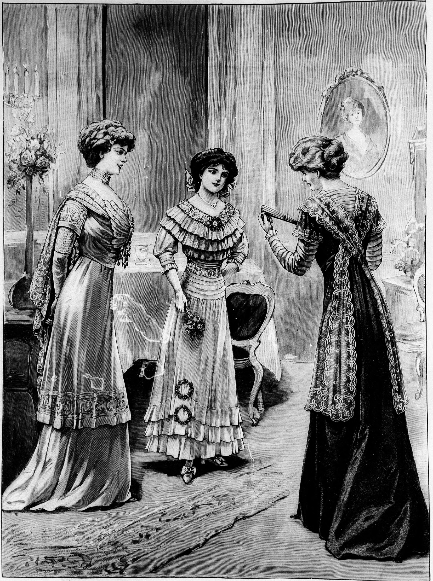
64. sz. Alkalmi ruha; tunikás mideres alj estpkekendővel díszített derékkal. Ehhez hátkép: mintaiv 79a. fig.