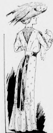
5. sz. A 4. szám hátképe.

Az egybedolgozott ezüstszirke poplénruha alját és derekát hasonlószínű selyemmel dolgozott tamburirozás díszíti. Ha azt akarjuk, hogy a ruha egyszerűbb legyen, akkor a himzést elhagyjuk s a derekat vállpántszerűen paszomány szelántal díszítjük, szintúgy az övet s az ujjak széléit. A hátul kapcsolt bélésderékát az 1-5. fig. szerint szabjuk s a 21. fig. szerinti túll vállpántot tisztán ékeljük bele. Ehhez hasonló a 7. fig. szerint szabott állógallér. A felsõ-