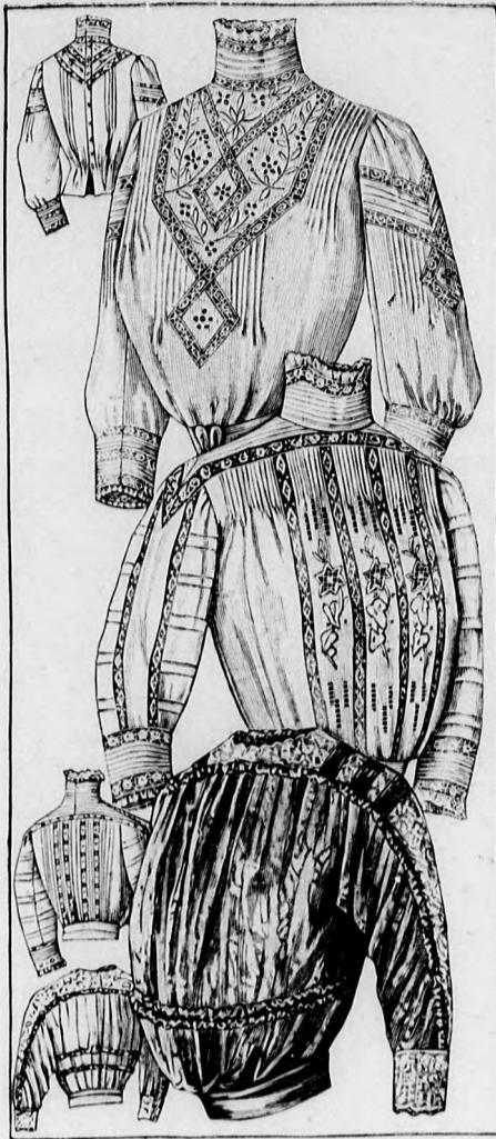
14-15. sz. Batisztbluz könnyű kézihimzéssel és vert-csipkebetéttel.