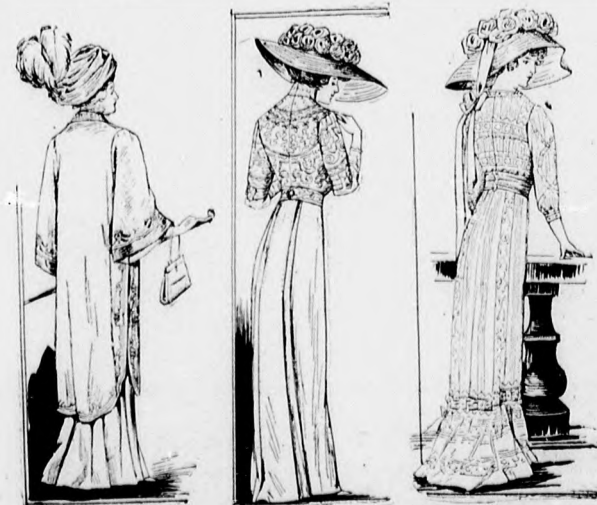
20-22. sz. A 35, 39. és 42. szám ellenkező oldalról.

A fehér indiai mullból való eredeti béleletlen mintánkat részben a legkeskenyebb hengersizegélycsoportokba varrjuk és különböző csipkeneművel díszítjük. A 70 cm. hosszú aljat a felső szélén kissé rátartott fodor