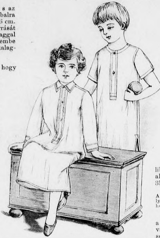
7-8. sz. Nappali és hátiing 7-8 éves lányok. Szab. magy.: mintaiv XIII. sz., 75-87. fig.

Díszes és szép az egyszerű batisztbluz, amelyet lyukacsos- és szaróltésű himzés, vert csipkebetét és finom hengerszegély díszít. Elejét, amint a képen is láthatjuk, tisztán beékelte betét díszíti vállpántszerűen, két soron és határolja a már említett himzést; a kis négyszögekben egy-egy lyukacsos himzés-minta van. A vállnál hét szegélyből álló szegélycsoport kezdődik, amelyek mellnél kiállanak; hasonló szegélycsoport díszíti elől a vállpánt szélével. A hát-