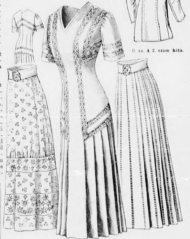
10. sz. Bluz alj himzett szövetsből. Kis rajz, szab. és magy.: mintaiv XIV. sz., 88. fig.