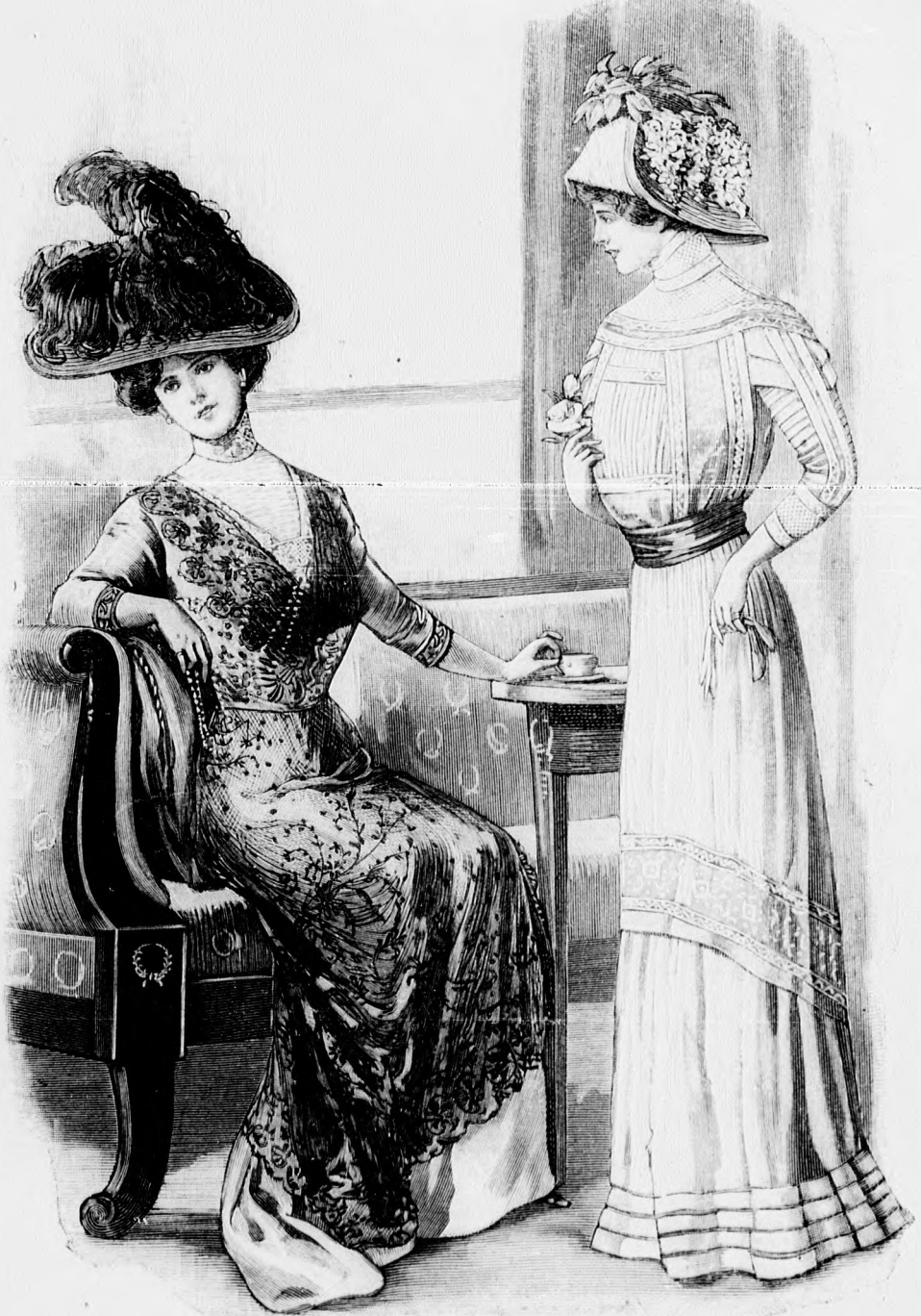
54. sz. Elegáns csipkernya; örömanyanak vagy kertimulatságra kövőbb hölgynek is alkalmas forma. Ehhez 51. és 52. sz.