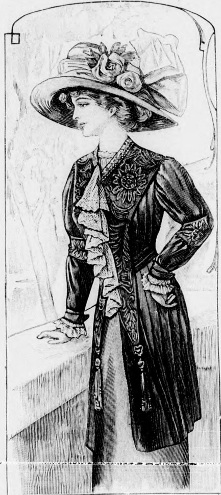
46. sz. Kabát fekete libertiselyemből sujtás- és rátédísszel. Ehhez 6. és 53. sz.

hatlan öltésekkel megerősítjük. A sujtással és selyemmel ki-varrt és bélelt, amint a 6. számú képen látható, laposhimzessel díszített gallérrész előli deréktől szabadon lóg le és gyöngyös bojttal végződik s a vállakon át hátul vállpánt gyanánt folyta-tódik. A kivágás szélét buza-virágkék gallérpánt díszíti, arany-tűl pánthallal kivarva. A selyem-pántnak, amint a képen láthat-juk, díszes selyemhimzés a dísz-e. A himzést kek, zöld, ékrűszíniű és tekete selyemmel dolgozzuk ki. Jobboldalt túllíplisszével ha-tárolt, szabószzerű túllíplisszé-dísz