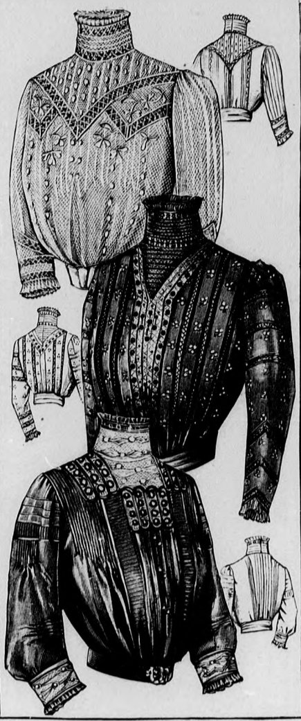
27-28. sz. Túllbluz könnyű kézihimzéssel. Szab., magy.: mintáiv XXIII. sz., 158-162. fig.

A nagy melege való ruha mintázott fulárból készül. A fehér alapszínű halványzöld mintázott s a széles zöld szélpántját fehér mintázattal díszíti. A szélpántból készítjük a ráncolt fodrot, amellyel a belsőaljat határoljuk. A fodrot elől laposráncba, majd hátrafelé fektetett plisszéráncokba rakjuk. Ezt a felső szélén behúzott tunika borítja, amelyet alól szélpánt határol. A tunikát elől baloldalt, előli kapcsolást utánozva, fekete moarépánttal, ezt pedig közepnagyságu selyemmel behúzott gombokkal és gomblyukakat utánozó sujtáshurkokkal díszítjük. A pánt belső szélétől 1 cm. nyire sujtás húzódik. A tunika hátsó ráncainak 100 cm. rel szélesebb szövet szükséges. A bőrségét derékban csomóba húzzuk, onnan természetes ráncokba hull alá. A tunika előli gombdíszét a ráncolt moaréövön is láthatjuk. A derék bluzszerű