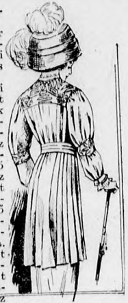
53. sz. A 46. sz. háta.

A fehér voál ruhát himzett és csetneki csipkebetétek díszítik gazdagon. Az övet ehhez okkerszínű libertiszalagból készítjük és ráncba rakva, hátul csinos csokorba köt-jük. A bőleleten, hátul kapcsolt derék váll-pántját csetneki csipkebetét díszítjük. Az állógallérral pedig ugyanolyan betéttel egye-sítjük. A vállpánt alsó szélét két hasonló betét díszíti, a vállakon keresztveződik s az ujjakon folytatódik, ahol azután haránt szegélyekbe rakott résszel végződik. A váll-pánthoz úgy előli, mint hátul egy középső felsőszövetrészt zárul, amelyet keskeny heng-szegélyekkel díszítünk, előli csipkebetét-tel s az alsó szélén himzett betéttel felváltva. Hasonló himzett és csipkebetéttel határolt rész nyúlik fel válltámaszra és a külső szél-én részt pánttal végződik. A derékat oldalt sima felsőszövettel borítjuk. A részt pán-tból sima két szegélyvel díszített epoletrészt nyúlik az ujjakra. Ennek az elejét haránt szegélyekbe varrjuk s a hátsó, illetve alsó részét hosszabban behúzzuk. Az ujjakat csipke-betéttel határolt közel egészíti ki. A két részből álló harangalj felső szélét keskeny hengszegélyekkel szűkítjük s az alsó szélét négy 3-3 cm. széles szegély díszíti. Az alját hátul dupla laposráncba rakott hátsó lap egészíti ki. A haranglapot himzett betét díszíti tunikaszerűen, ezt csipkebetét és ezenkívül az alsó szélén egy részt pánt díszíti.