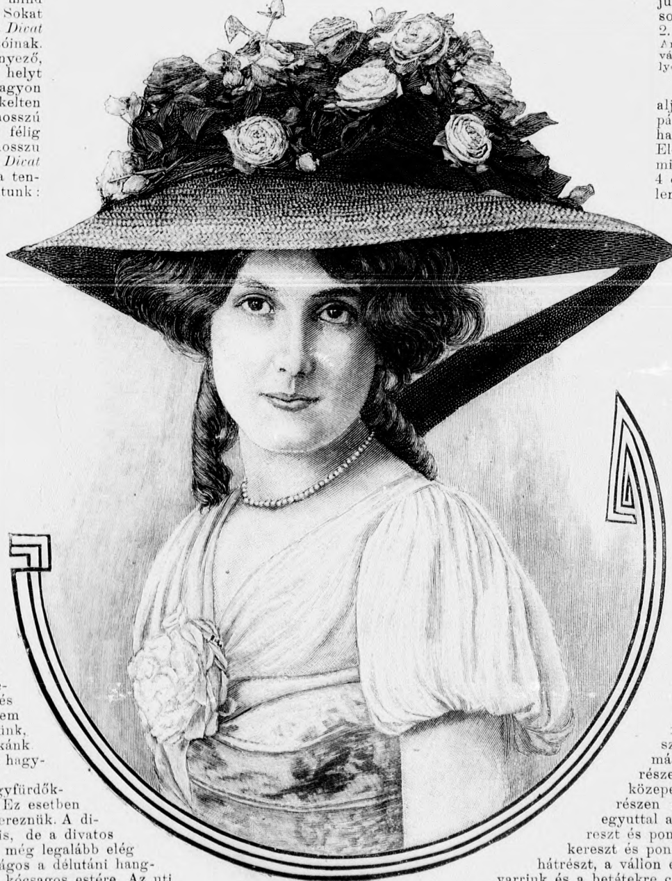
1. sz. Nyárikalap virág- és bársonyszalagdíszsel.