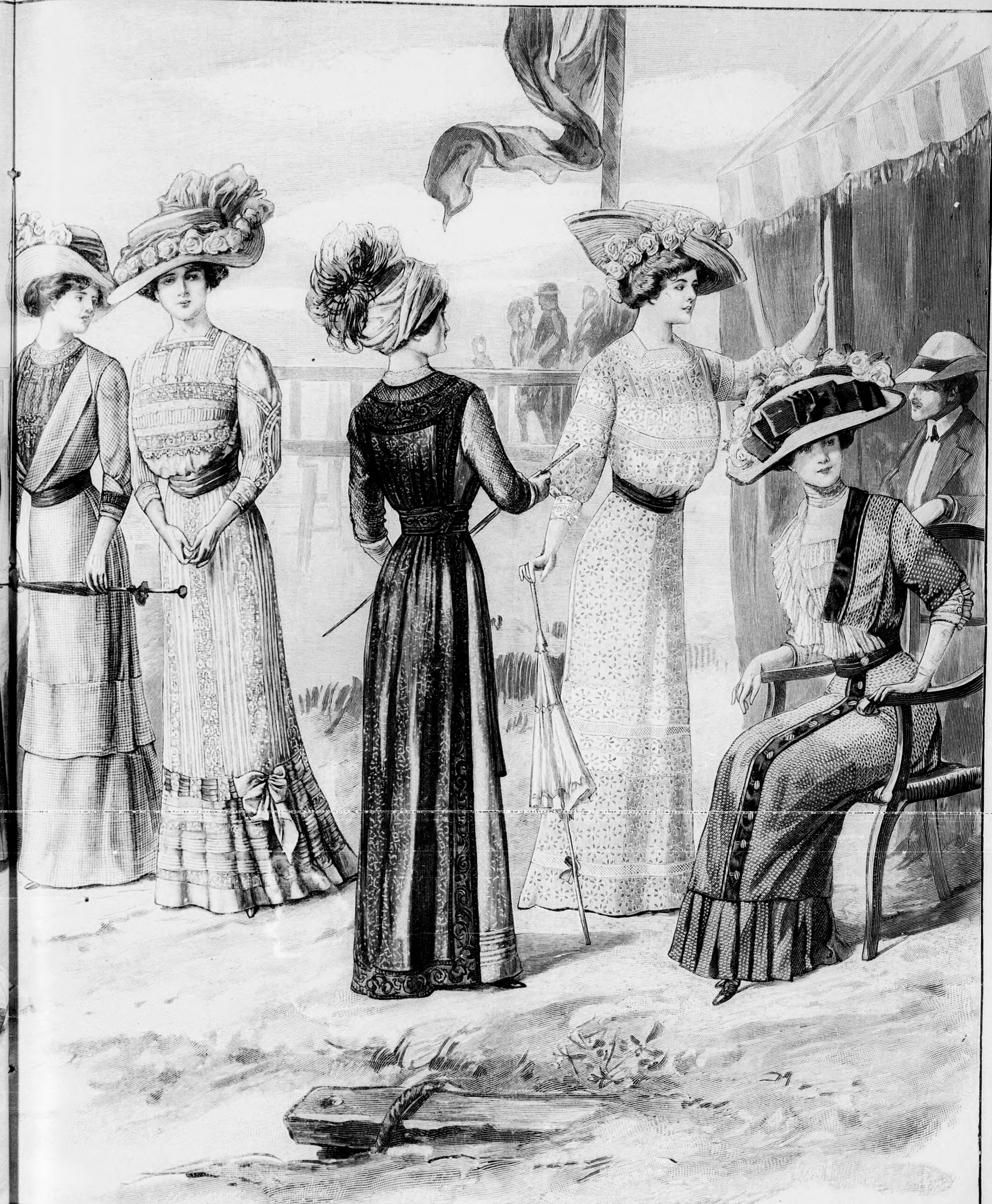
41. sz. Elegáns látogatórúha; baljós és dupla all. mintá- val. Ehhez 25. sz. Szab.; magy.; mintái XX. sz. 133-142. fig.