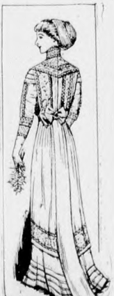
47. sz. Az 55. szám háta.

A nagyon elegáns ruha különösen alkalmas esküvőre örömanyanak vagy valamely szép kerti ünnepélyre is. Izléses és a célnak megfelelő módon az alsó ruhát violaszíniű vagy ezüst-szürke libertiselyemből készíthetjük; de a komoly fekete santillsálhoz halvány-sárga szín is illik. Az eredeti min-tánk alsó ruháját ezüstszerű libertiselyemből, a felső ruhát pedig fekete santillselyemből készítjük, az aljára úgy tűzzük, hogy hátul térdig az alját borítja, az a szé-lei előli baloldalt egymást borítják. A bal szélét csinos ráncokba rakjuk és fekete szalagdísszel részben a jobb széle alá, részben egy rozettával az aljra erősítjük. A sál felső szélét, a deréknak, dúsan tarkított keleti izlésű himzett miderérszébe erősítjük. A mider baloldalt ma-gasan hátranyúl, míg jobboldalt övszerűen hátranyúl és a sima santillesipkével borított hátrészen egymást borítják. A hátul kapcsolt deréknak szögletes kivágását szegélybe varrt sifon vállpánt borítja. Ehhez előli a de-rekat vállpántszertien borító brüsszeli csipkét erősít-jük, amely hátrafelé a vállakon át, mint válldísz foly-tatódik és előli részben a fisűszerű, fekete santillesipke derékdísszel van borítva. Az alsó ruha színéhez hasonló egyszerű, háromnegyed hosszú ujjak keleti himzés csikkal végződnek. A nagy fekete tagol szalmafonatú kalapot fekete ó-arany színben színárnyalt structollak díszítik.