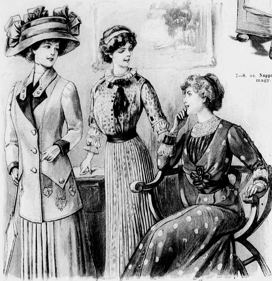
2. sz. Öltözék vászonból elől díszrel. Ehhez 3. sz.