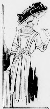
63-64. sz. Egyszerű sétaruha egybeszabott előrészel kövérebb és fiatal hölgyeknek.