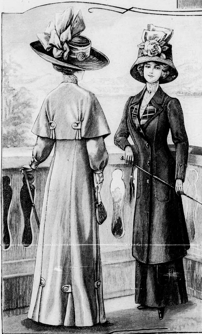
56. sz. Legujabb formájú por- vagy utazó-köpeny rövid gallerral. Ehhez 59. sz.

A képkönnön látható ruhának bár egyszerű a szabása és nem sok a dísz,