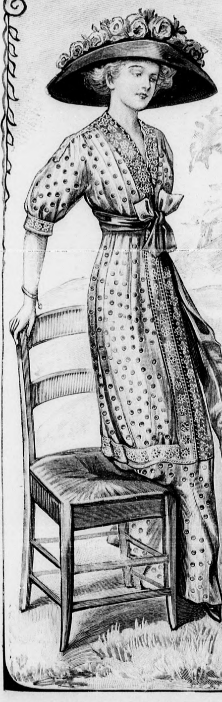
26. sz. Reformszabású célszerű nyári ruha. Szab. és hátkép: mintáiv II. és III. sz., 8-16a. fig.

23-25. sz. A 38, 40-41. sz. ellenkező oldalról.