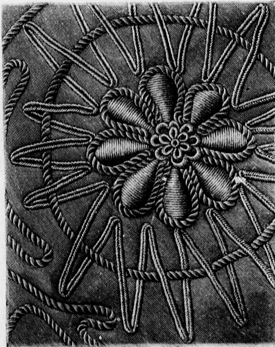
6. sz. A 46. számú kabát díszítése természetes nagyságban.

Az egyszerű nyáriruhát lyukacsos himzett szövetsből készítjük és betéttel díszítjük. Az előli kapcsolt batiszt bélésderékát a 8. és 9. fig. szerint szabjuk; a csucsos kivágás vékony vonalát figyelembe véve. A bélésujjakat a 6. fig. szerint körülbelül 28 cm. hosszúra vágjuk s a bélésderékba varrjuk. A derék felsőszövetét a 10a-b. fig. szerint szabjuk, hozzávágva az ujját is. Elõli hosszában bevágjuk, azután A-B-ig és C-D-ig összevarrjuk (lásd a kis rajzot). A 10a. és 10b. figurát a dupla-vonal mentén bevágjuk és az oldal- és ujjvarrás közé szám szerint a 11. fig. után vágott eresztéket varrjuk (lásd mai számunk házi szab.). A vonal mentén a vállat csillagtól a nyak-