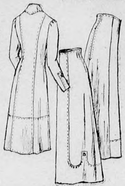
59-62. sz. Az 56. és 57. szám ellenkező oldalról.