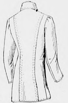
9. sz. A 2. szám háta.

A könnyű ruhácskát tetszés szerint szines, nagy fehér alsó ruha fölé készítjük. Hátul gomboljuk s a nyakkivágást húzókorral látjuk el. A bõlet vállpántot a 171. és 172. fig. szerint szabjuk. Az ehhez varrt derékreszeket a 173. és 174. fig. szerint szabjuk, fõnt és lent behúzzuk s a karöltõnél kereszt és pont szerint rakott ráncokkal szükítjük 75 cm. hosszú lyukacsos himzéssel szegélyezzük a derek alsó szélével. Az ezen áthúzott szalagot hátul csokorba kötjük, elől oldalt pedig teljes csokor 20-20 cm. hosszú végekkel. A lyukacsos himzést alul a szok-