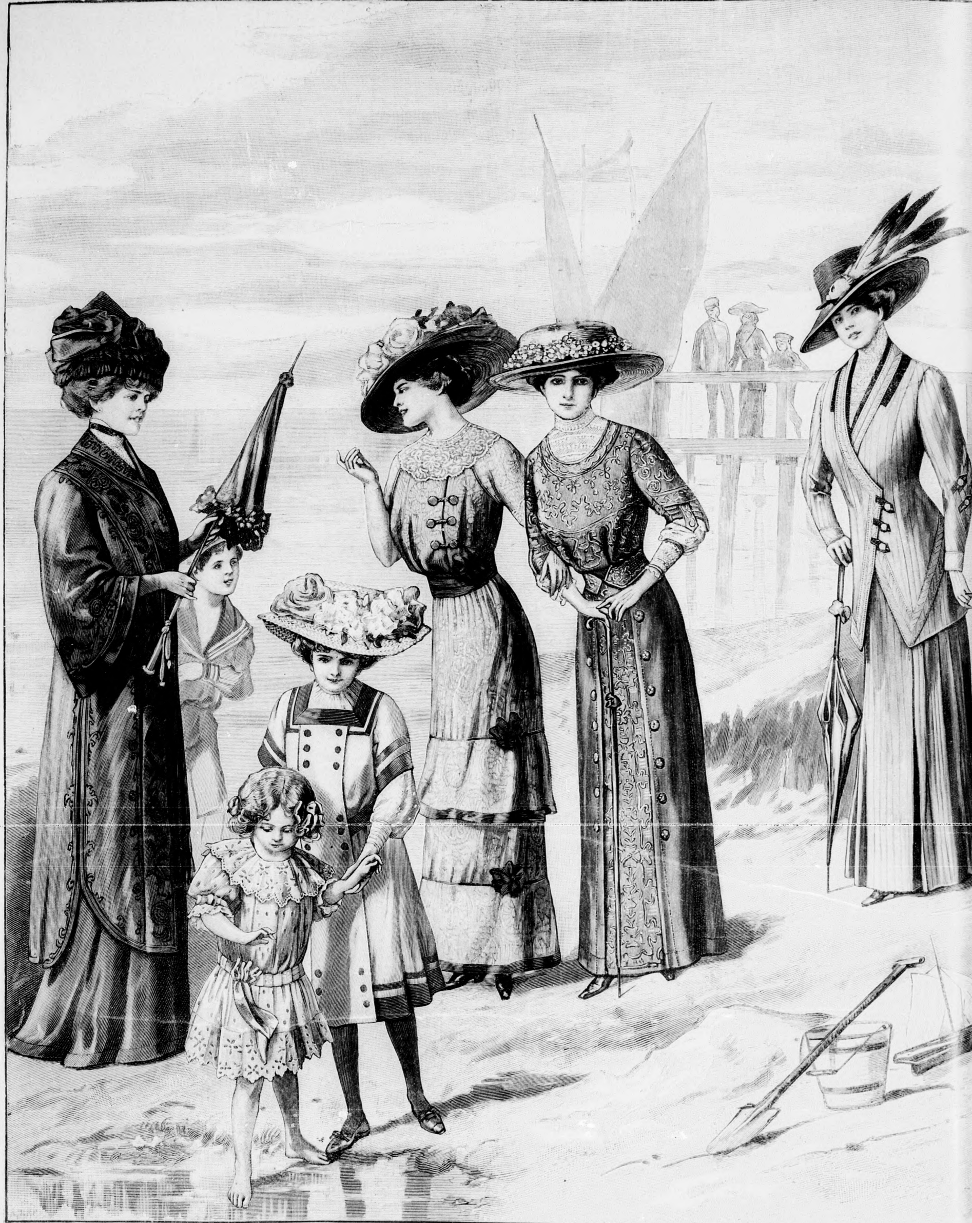
35. sz. Nyári köpeny paszmány- díszrel fűzős és hűlőnek. Ehhez 30. sz. Szab.; mintái XXV. sz. 167-170. fig.