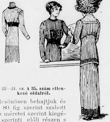
22-24. sz. A 35. szám ellenkező oldalról.