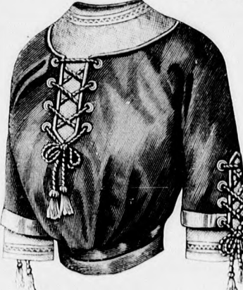
Rendes szabás szám M 5103. I. II. és III. nagyság.

4. sz. Béleletlen bluz himzett szövetből. Szab., magy.: mintav. I. XXI. sz. 124-127. fig.