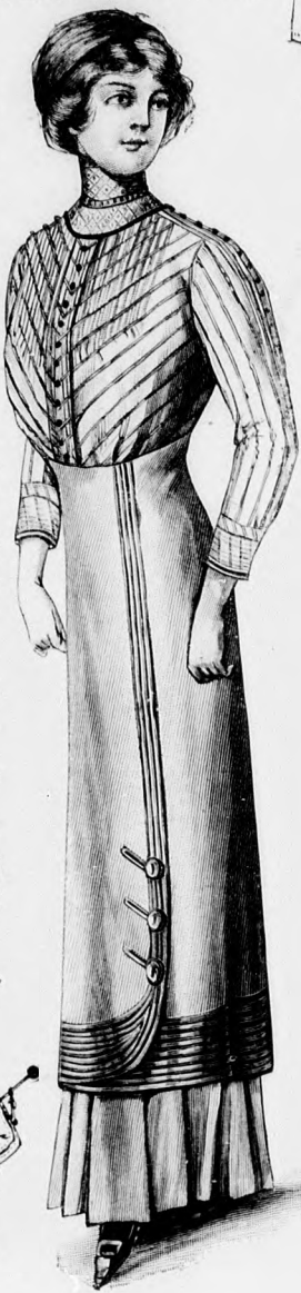
Rendes szabás szám M 5104. I. II. és III. nagyság.

Anyag: 1 m. hosszú, 10 cm. széles acélkék selyem; 1/2 m. hosszú, 50 cm. széles rózsaszín selyem; 3 1/2 m. selyemszínor; 6 bojt; 20 hur-