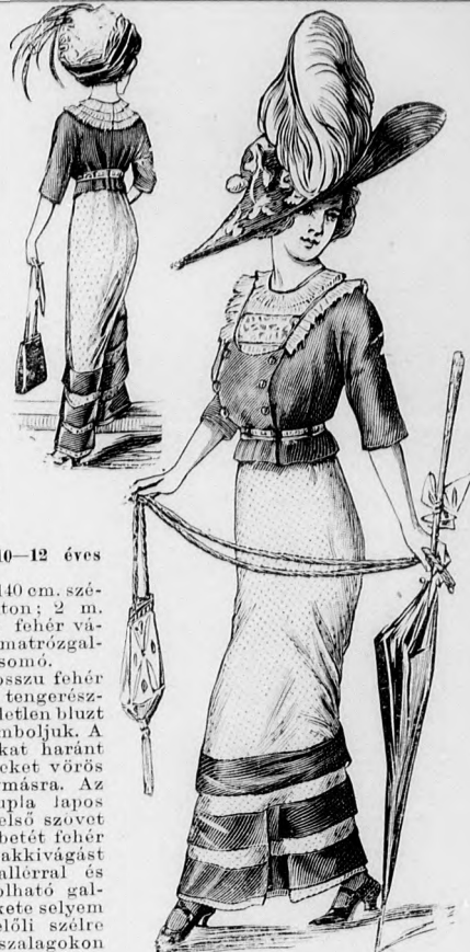
Rendes szabás szám M 5134. I. és II. nagyság.

Anyag: 8 m. h., 80 cm. sz. sötétkék vászon. A sötétkék vászonruha díszét részben láncozott, részben tanburozott öltésű és fehér vászon fonállal kidolgozott tanburozás adja. A bokáig érő alj négy részből áll és hátul baloldalt van kapcsolva. A béleletlen orosz bluz felső részét derékban behúzzuk és itt a sima lebonyolásokkal egyesítjük. A felső részek oldalszéleit felsőszövetekre tűzzük. Az övet a bluzrészekhez hasonlóan, előli baloldalt kapcsoljuk. Az ujjakat tanburozott kézelők díszítik.