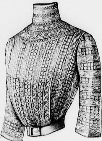
Rendes szabás szám M 5101. I. II. és III. nagyság.

A csinos mideres aljat finom fekete posztóból szabjuk; a pántokat fekete liberti selyemből. A külső szegélyt az alj felső része alá tűzzük tunikaszerűen. A belső pántot az alap szerint tűzzük fel. A pántok mellett s az alj alsó szélé mentén több sor tűzészív van. A hátsó lapot sima laposráncba rakjuk. Az aljat hátul baloldalt kapcsoljuk, különböző szövetből varrt bluz fehér ponzi selyembélsőre dolgozzuk. Ezt elől a mell alatt tarkán mintázott pasztelkék alapon halvány rózsaszínű rózsák, közepén fekete ponttal és halványzöld lombokkal mintázva. Ezt a vállpántig pettyes, szegélyekbe varrt fekete túll borítja. A fekete pettyes fehér recetű vállpánt, az ujjak felső közepén mint pánt folytatódik, epp úgy, mint az ujjak alsó szélén is. A vállpántot fekete-fehér túllgalond határolja, szintugy, mint az álló gallért s a belésujjakat határoló kézelőt.