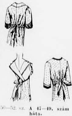
50-52. sz. A 47-49. szám háta.

49. sz. Ruhakötény félhosszu ujjakkal. Ehhez 52. sz. Szab. és magy.: mintaiv I. XII. sz. 67-72. fig.