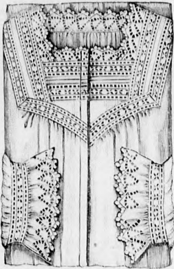
Rendes szabás szám M 5127. I. II. és III. nagyság.

33. sz. Ruha mintázott fularból. Anyag: 8 m. hosszú, 60 cm. széles