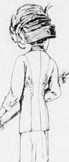
43. sz. A 62. szám háta.

valamint a 12 cm. széles közelőket is, amelyeket a 22 cm. belső hosszúsággal szabott bélésujjakra varrunk. Ezt csupán a bélésderékba varrjuk. A derék felső szövetét a 111. és 112. fig. szerint szabjuk; a jobboldala elől és hátul a balra átnyúlik, amint ezt az előli és hátsó közepe jelzi. Az oldalvarrás kidolgozása után a részeket a 113. fig. szerinti ujjakra tűzzük. Az ujjak széleit fekete selyem szegélyezi. A 114-116. fig. szerint szabott aljon figyelembe veendő a derékát jelző finom vonal és a fonál iránya. Az előli lapot a keskeny, fekete selyem betétre tűzzük, a finom vonal jelzése szerint túlértő széllel. Az elől csillagtól rátartott, hátul behuzott felső szélét megfelelő magasságban a derékra varrjuk. A ráncolt öv és az esarp fekete selyemből való.