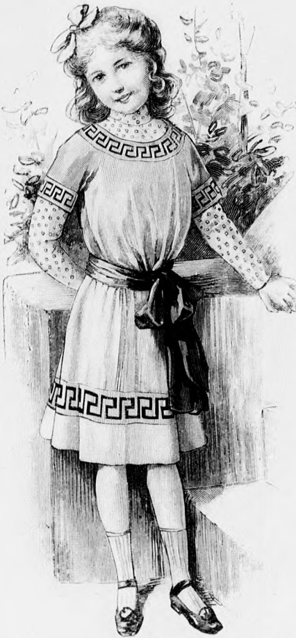
Rendes szabás szám M 5133. 4-6, 6-8 és 8-10 éveseknek kapható.

61. sz. Matrózóöltöny hosszú nadrággal és bluzzal 10-12 éves fiúknak.