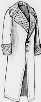
3. sz. A 29. sz. ellenkező oldalról.

15. sz. Mideres luzalj csavart tunikával. Ehhez hátkep: mintav. I. 78b. fig.