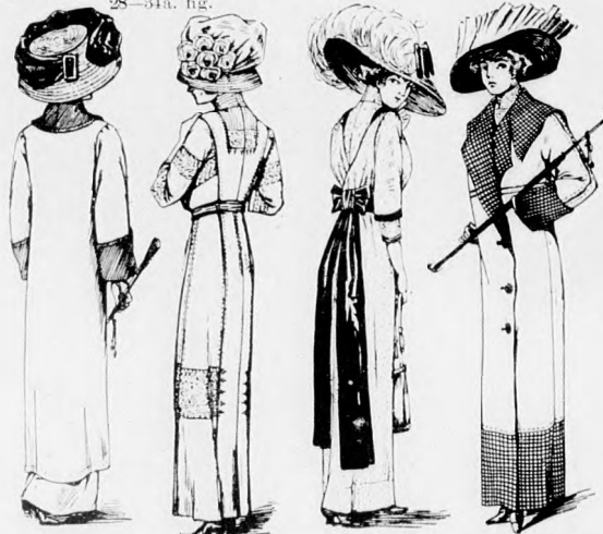
10-13. sz. A 29., 30., 33. és 25. szám ellenkező oldalról.

A díszes bluz túll vállpántját a 117. fig. szerint szabjuk s a hátul kapcsoló belésre varrjuk. A nyakkivágásnál köröskörül levágunk 1 1/2 cm. széles túllrészt és 2 cm. széles duplán vett túllszegéllyel pótoljuk, amelyet lyukacsos galanggal varrunk hozzá. Az ujjak alsó 23 cm. széles részét hasonló szegéllyel határoljuk és a megfelelően rövidített belésujjakhoz varrjuk. A bluz felsőszövetét a 118a. és 118b. fig. szerint szabjuk, szabás előtt a hasítékvonal mentén G-H-ig egyestve. Az ujjak szélén a szövetet a pántszerű vonal mentén kivágjuk s a kivágás alá rózsaszín szegélyt tűzünk; előbb azonban a 119. fig. szerinti alsó ujjat bevarrjuk. Az ujjak szélét 2 cm. széles rózsaszín selyempánt díszíti. A bluz kivágásának szélét selyemszegély határolja. A zsinórozás számára kivágott lyukakba horgolt karikákat illesztünk. A bluz alsó, elől és hátul behuzott szélét a derék bőségének megfelelő foglalóba erősítjük.