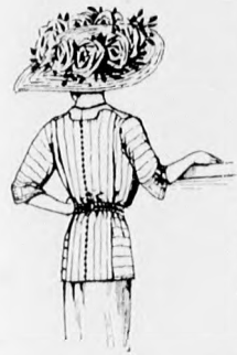
20. sz. A 26. szám háta.

behúzott selyemtűll borítja. A drága dísz hátul a fejreszhez erősített fehér toll képezi. A nagy fekete, 21. számú florentin kalapot szép brüsszeli csipke borítja, a karimán fodorszerűen lelógva. A fejreszt dudorosán díszíti. A kalapot a legsötétebben színárnyalt rózsaszín veszi körül, halvány lila és fehér anemónával felváltva.