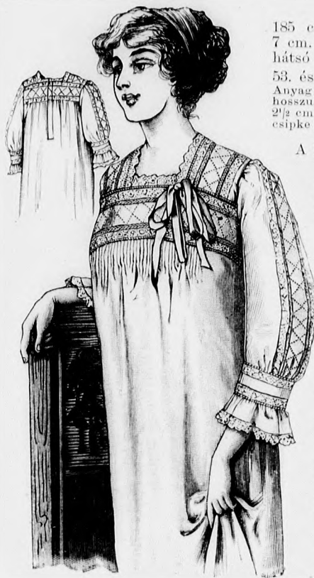
Rendes szabás szám M 5132. II., III. és IV. nagyság.

53. és 53a. sz. Hátul gombos elegáns hálóing.