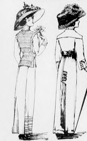
45. és 46. sz. A 63. és 37. szám háta.

35. sz. Seta- és latogatoruha. Anyag: 8 m. hosszú, 50 cm. széles, fekete-fehér csikos selyem; 4 m. hosszú, 130 cm. széles, fekete étamin; 3/4 m. hosszú fekete, 1/4 m. vörös iberti selyem, 50-50 cm. szélességben; 40 m. fekete selyemhenger.