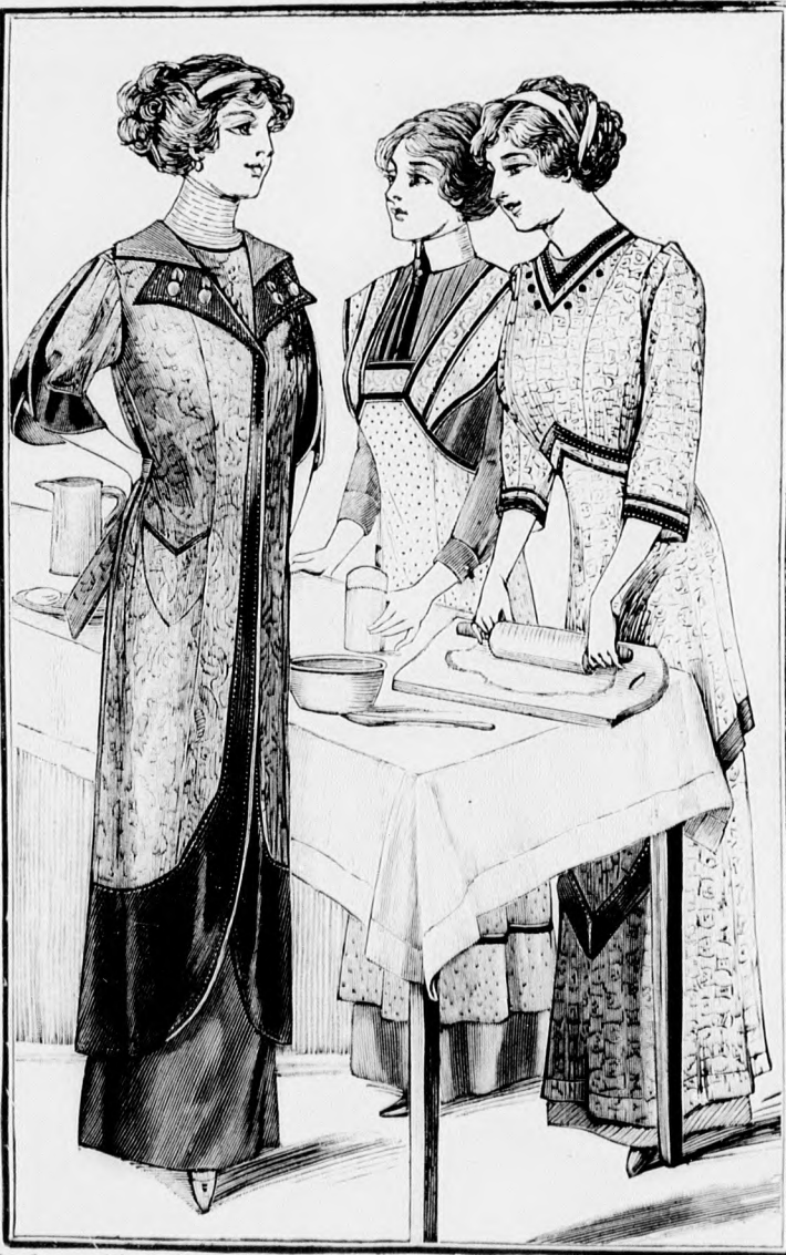
Rendes szabás szám M 5129. II. és III. nagyság.

A kötényt fekete, 1 cm. széles világoskékkel szegélyezett szaténpánt díszíti. A válltartókat és a mider kis övrészét világoskék alapra dolgozott himzett betét adja, pántokkal megerősítve. A kötényrészeket a 161. és 162. fig. szerint szabjuk s a kis rajz méretei szerint kiegészítjük. A tartókat a 163. fig. szerint szabjuk a behajtás figyelembe vételével. A hátsó kötényrészt rajz szerint bevarrásokat dolgozunk ki; a zsebet baloldalt rajz szerint tűzzük fel. A betét rajza a 161. és 163. fig.-án látható. A tartókat elől vonaljelzés szerint a kötényre erősítjük. Lent a kötényt 13 cm. széles,