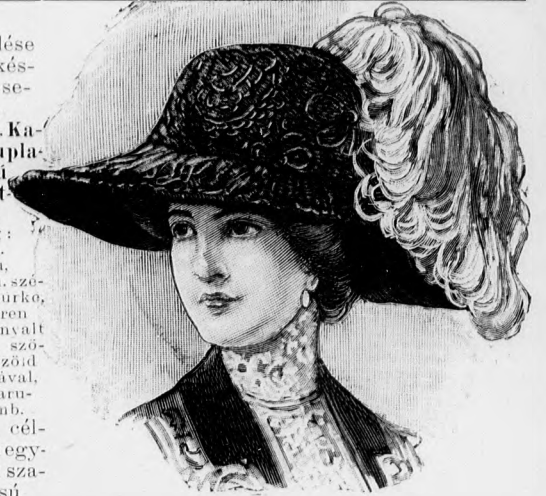
19. sz. Nagy kalap fekete selyempipúr tolldíszsel.

Az egyszerűsége mellett is nagyon csinos ruha levendulakék voalból készül. Bélésderékéből és aljból