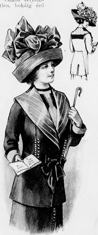
Rendes szabás szám M 5112. I. és II. nagyság.

26-27. sz. Seta- vagy látogatóruha kabátal (27. sz.) egyszínű szövetből és csikos selyemből. Ehhez 20., 27. és 27a. sz.