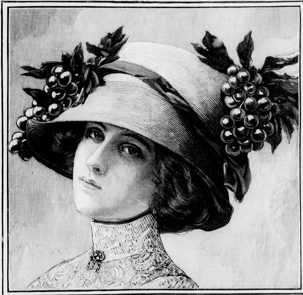
1. sz. Diszes szalmakalap gyümölcs- és lombdísszel.

Még néhány szót a gyermekkalapokról és ruhákról . A gyermekek ruháit a nagyokénak megfelelően szín tén többnyire csíkos és mintás szövetből készítik, csak természetesen a színek élénkebbek és más a forma. A gyermekruhánál is leginkább a kimonószabás a szokásos. A kalapnak nagy a feje, többnyire harangformájú a széle és nagyon hátrafelé tölva viselik. Leginkább kedvelt a fekete világos dísszel. A serdülő leány nagy fekete kalapja finom szalmából van fonva, fekete-fehér csíkos szalagdísszel és keskeny piros szegélyezéssel.