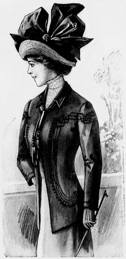
Rendes szabás szám M 5113. II., III. és IV. nagyság.

27. és 27a. sz. Félhosszu kabát a 26. számhoz.