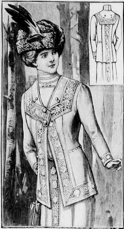
Rendes szabás szám M 5125. I. II. és III. nagyság.

40. és 40a. sz. Béleletlen vászonkabát betétdisszel a 44. számhoz. Szab. és magy.: mintaiv I. IX. sz. 50-58. fig.