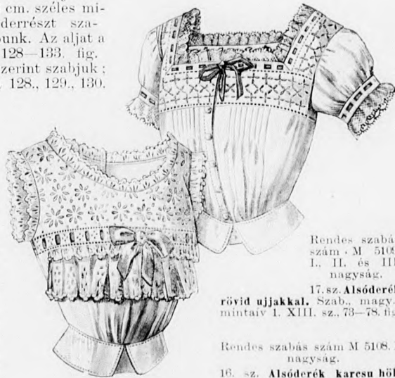
Rendes szabás szám M 5109. I. II. és III. nagyság.

A csinos bluzaljat tunikával szabjuk, amelyet elől a fodorral borított belésaljra erősítünk. A tunikát látszólag hátul baloldalt kezdve, elől baloldalt végződve az alj körül csavarjuk. A tunika széleihez rézsut varrással skót kockás rézsut pántokat varrunk, ezt fölfelé hajtjuk és letűzzük. Az aljat hátul a varráson gomboljuk. Az aljat csupán könnyű szövetből szabhatjuk.