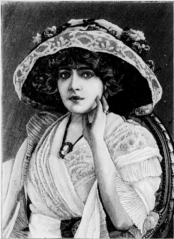
21. sz. Nagy kalap csipke- és virágdíszsel.

Anyag: 1/4 m. hosszú, 120 cm. széles gyapjuszövet; 5 m. csikos selyem; 1/2 m. fekete bársony; 1/4 m. fehér csipkésövet, egyenként 50-50 cm. szélességben; egy fekete lakköv; 150 gömbölyű gomb; 130 gombforma.