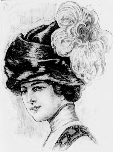
18. sz. Tokformájú kalap tolldíszsel.

behúzott selyemtűll borítja. A drága dísz hátul a fejreszhez erősített fehér toll képezi. A nagy fekete, 21. számú florentin kalapot szép brüsszeli csipke borítja, a karimán fodorszerűen lelógva. A fejreszt dudorosán díszíti. A kalapot a legsötétebben színárnyalt rózsaszín veszi körül, halvány lila és fehér anemónával felváltva.