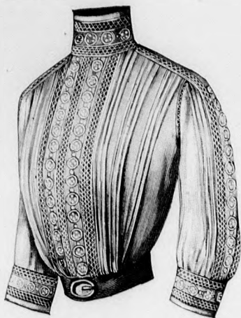
Rendes szabás szám 5100. II. és III. nagyság. 2. sz. Batisztbluz betét- és szegélydísszel. Szab. és hátkep: mintav. I. XX. sz. 120-123a. fig.