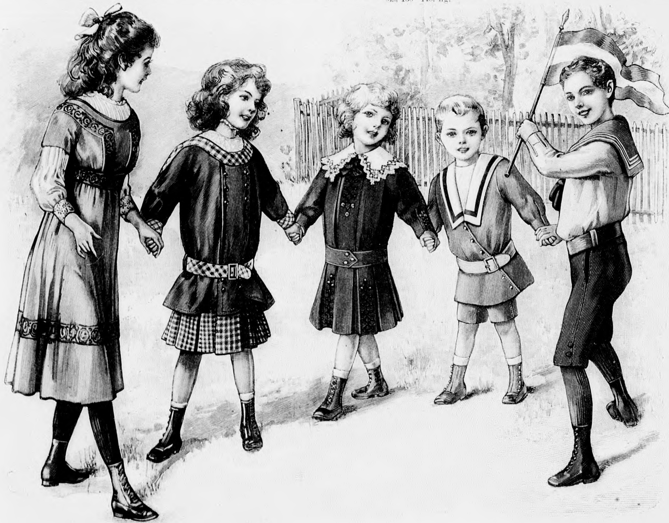
Rendes szabás szám M 5135. 8-10, 10-12 és 12-14 éveseknek kapható. 56. sz. Egybeszabott alj kieserélhető bluzzal 10-12 éves leányknak. Szab. háta és magy.: mintáiv I. XXIV. sz., 141-149a. fig.

54. sz. Célszerű ruha kieserélhető bluzzal 8-10 éves leányknak. Szab. és magy.: mintáiv I. XXIII. sz., 130-140. fig.