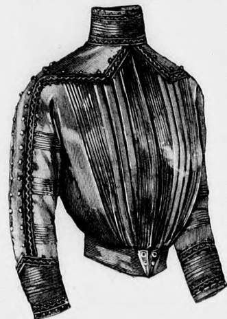
Rendes szabás szám M 5102. II. III. és IV. nagyság. 5. sz. Fekete selyembluz szegélydísszel. Kővérebb alakra is alkalmas forma. Szab. és hátkep: mintav. I. VI. sz. 28-34a. fig.