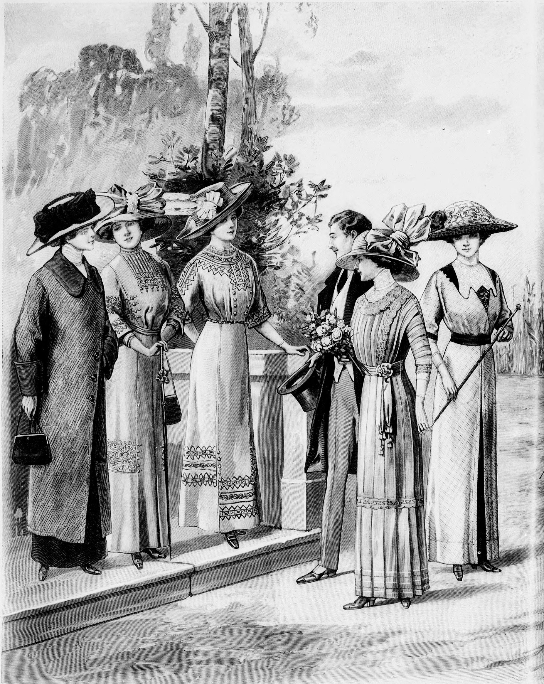
Rendes szabás szám M 511. I. II. és III. nagyság. 29. sz. Kabát dupla szövetből. Mind a két oldalán ríszhető. Előző és 10. sz. Szab. mintái I. XIV. sz. 70-81. fig.