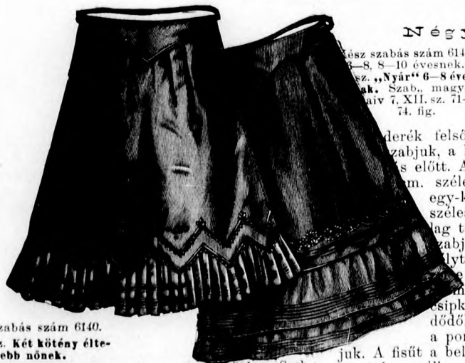
Kész szabás szám 6140. 31-32. sz. Két kötény éltebb nőnek. 31. sz. Selyemkötény. Szab.: mintaiv 7. IX. sz., 46-47. fig.

Kész szabás szám 6141. 8-8, 8-10 évesnek. 33. sz. „Nyári” 6-8 éves leányknak. Szab., magy.: mintaiv 7. XII. sz. 71-74. fig. Kész szabás szám 6142. 6-8, 8-10 évesnek. 34. sz. „Virágáros leány” 6-8 éves leányknak. Kész szabás szám 6143. 10-12, 12-14 évesnek. 35. sz. „Bandita” 10-12 éves leányknak. Ehhez 35a. sz. Szab., magy.: mintaiv 7. XIV. sz., 81-87. fig. Kész szabás szám 6144. 10-12, 12-14 évesnek. 36. sz. „Bohóc” 12-14 éves fiúknak.