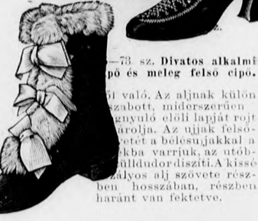
73. sz. Divatos alkalmi cipő és meleg felső cipő.

való. Az alján külön szabott, miderszerűen csomósuló elől lapját rojt borítja. Az ujjak felső részét a belesujakkal a csipke varrjuk, az utóbbi hülludor díszíti. A kissé ályvos alj szöveve részben hosszában, részben haránt van fektetve.