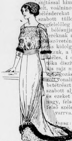
74. sz. Az 54. számú libertisé-hátkepe.

fig. szerint szabott vállpánt, amely kimonoszerűen szabott, a hátukapcsolt blúz díszíti és fekete gyöngyhímzésből készül. A 120a. és 120b. fig. szerinti részeket szabás előtt a hímíték vonala mentén C-D-ig egyesítjük. Az elől szélekre, a 121. fig. szerint szegélybe varrt túllibetétet foglunk. Az ujjak széleit a 123. fig. szerint szabott gyöngyhímzéses túllesipke kezelő díszíti. A blúz sima fehér selyemmel béleljük. A kis rajz 124-127. fig. szerint szabott aljának, a 124. fig. szerinti elől lapjának bal szélét az előrajzolt finom vonalig a bal oldali apratűzzük. A 127. fig. szerinti hátsó lapot kereszt és pont szerint ráncba rakjuk. A hátsó közepeket a finom dupla vonal szerint hasítékkal látjuk el. A felső széle alá 3 cm. széles lenzöt tűzünk, 25 cm. széles duplán vett selymesk adja az esarpót.