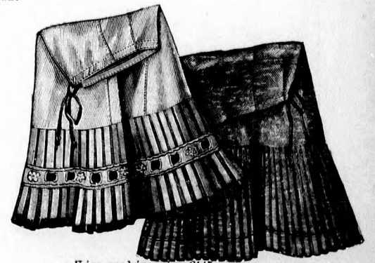
Kész szabás szám 6145. 37-38. sz. Két alsósoknya 12-14 éves leányknak. Szab., magy.: mintaiv 7. XV. sz. 88-90. fig.

derék felsőszövetét az ujjakkal, a 21a. és 21b. fig. szerint szabjuk, a hasíték vonala mentén C-től D-ig egyesítve, kiszűrés előtt. Az alsó szélén csillagig behuzzuk. Az ujjak szélét 5 cm. széles csipke határolja. Az ujjakat kissé összefogva, egy-két öltéssel a bélésujjakra varrjuk és két 8 és 10 cm. széles tüllboddorral díszítjük, melyeknek felvarrását szalag takarja. A fisűt a kis rajz 22. fig. szerint tüllből szabjuk. A finom vonalat finom vonalra téve két szélpántot varrunk le s ezt a részt a külső szélén és 5 cm.-re fölött, a második szegély alatt, kissé behuzott, 5 cm. széles csipkével díszítjük. A belső szélére szintén csipkét varrunk, 3 cm.-el a pontozott vonal mögött kezdődőleg, amelyet a színével lefelé simán varrunk fel és a pontozott vonal mentén, rózsaszín szalagon át kihajtjuk. A fisűt a belső szélénél fogva, a csipke alatt, a felsőszövetre varrjuk, a vállon csillagtól-csillagig rátartva. A derékon tüllöz alját a kis rajz 23a. és 23b. fig. szerint szabjuk, a derekat jelző vonal