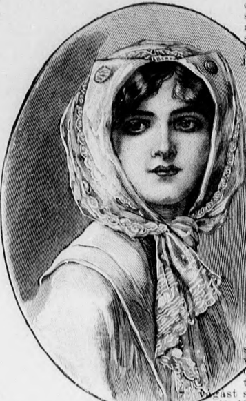
64. sz. Elegáns fejszál.

A biborkék posztókőpenyét csinosná teszi a széles, hátul stólasze-