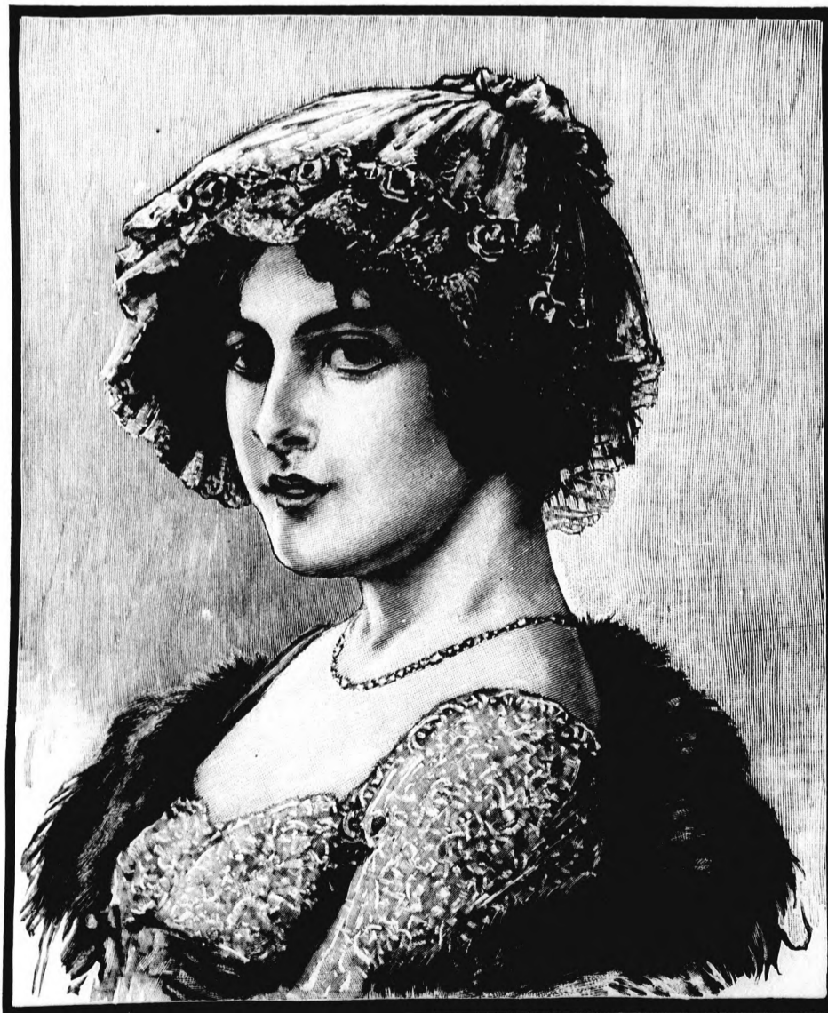
1. sz. Csipkefejkötő alkalmi ruhához, színházba vagy hangversenyre.

A bluz felsőrészt, az ujjakkal együtt, mintázott tüllből szabjuk s a mintázat szerint két-két szegélyből álló szegélycsoportha varrjuk. Az alsó része csipkeszövet, közbe csipkét illesztünk, úgy, hogy a csipkezetével a felső részre nyuljon. A felső részbe tisztán ékelt vállpánt szintén csipkéből való, valamint csipke határolja az ujjakat is. A tüll állógallért keskeny csipke, az ujjak széleit pedig világoskék szegély határolja. A bluzt a 35 és 36. fig. szerint szabjuk, a vállpánt vonaljelzését az ujjak, valamint az