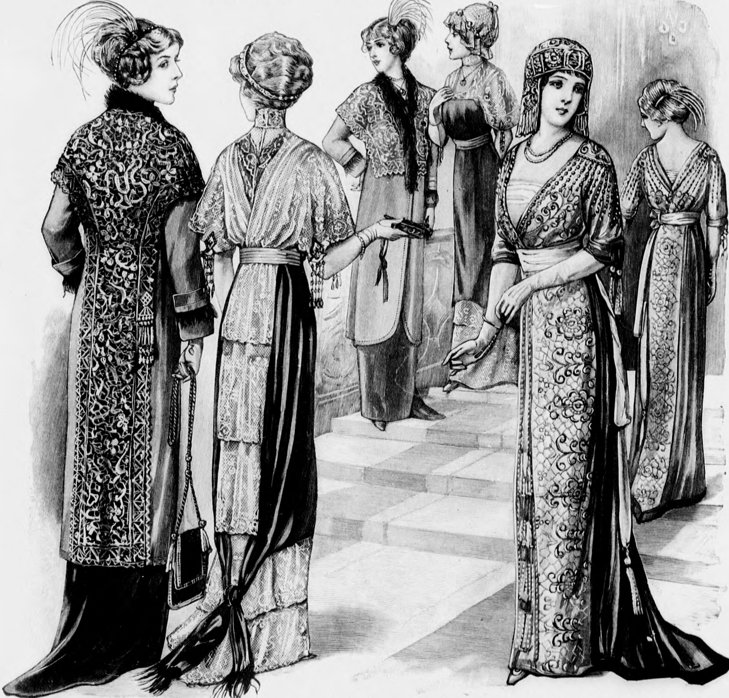
Kész szabás szám 6161. II. III. nagyságban kapható.