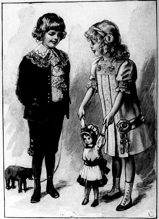
Kész szabás sz. 6138. 4-6 és 6-8 évesnek. 29. sz. Ünneplő öltöny fekete bársonyból 4-6 éves fiúknak. Ehhez 28. sz. Szab., magy.: mintaiv 7. XXXI. sz., 171-184. fig.

51. sz. Ruha csipkedíszsel. Anyag: 2 1/2 m. hosszú, 100 cm. széles tüll; 9 1/2 m. hosszú, 14 cm. széles csipke; 4 m. hosszú, 8 cm. széles csipke; 1 m. hosszú, 2 1/2 cm. széles csipke; 7 m. hosszú, 4 1/2 cm. széles szalag; 30 cm. hosszú, 45 cm. széles mintázott tüll. A csipkével és rózsaszín szalaggal díszített, könnyű fehér tüll ruha rózsaszín japán selyem vagy szatin alsórúhával készül. A derék bélését a 19. fig. szerint szabjuk és úgy mint hátul rajz szerint mintázott tülllel díszítjük. A nyakkivágást csipke határolja. A 20. fig. szerint szabott bélésujjakon figyelembe veendő az előrajzolt körvonal. A