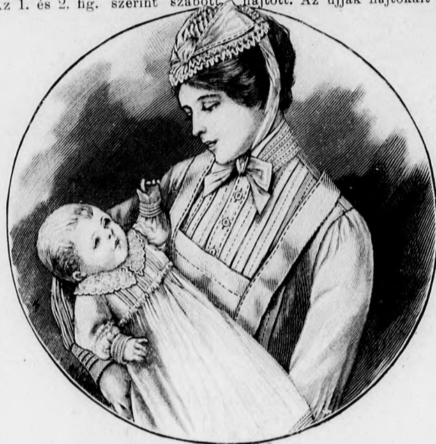
Kész szabás szám 8684. II. és III. nagyságban kapható. 23a-c. sz. Dajkának való ruha, kötény és fejkötő. Szab. és hátkep.: m.-iv 23. V. sz., 36-48a. fig.

A ruhából és bluzszerű kabátból álló öltözéket acélkék lágy selyemből szabjuk. A kimonó derék részei előli és hátul egymást borítják és előli hamis gombolással vannak díszítve. A szögletes kivágást előli ráncolt tüllből való keskeny mellényrész, hátul előli ráncolt betét tölti ki. A szélét pedig csetneki csipkegallér határolja. Az ujjak alsó széleit s a hasiték széleit tüllplisszé határolja. Az alj két lapból áll, amelyek közül a jobb lap baloldalt a bal borítja. A