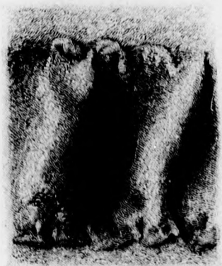
27. sz. Az 1. és 2. számú kabát belső bodordíszének behúzása.

selyem; 1 1/2 m. hosszú, 100 cm. széles tüll; 1/2 m. hosszú, 8 cm. széles csipke; 3 drb gomb. A ruhát sötétkék szövettel, új keskenyen bordázott gyapjúköperből és hasonlószerű selyemből szabjuk. Az előli sima, hátul egy laposrácba rakott alsó aljrészt a rövidített bélésaljra varrjuk. Az ezt borító tunikarész hátul hosszabbá válik és egy lekerekített hátsó lappal van megtoldva, amely látszólag a selymderékon is folyta-