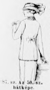
87. sz. Az 50. sz. hátkepe.

Az egyszerű látogatóruhát fecskekék grenadinselyemből szabjuk, halványlila selyemmel szegélyezzük és ugyanilyen gombokkal díszítjük. A plisszírozott túllcsipkével zsabó szerüen díszített túllbetét felett keresztvezőnek az előli derékrészek, amelynek függőleges szélei az oldalsó derékrészekre nyulnak. Ezeket a