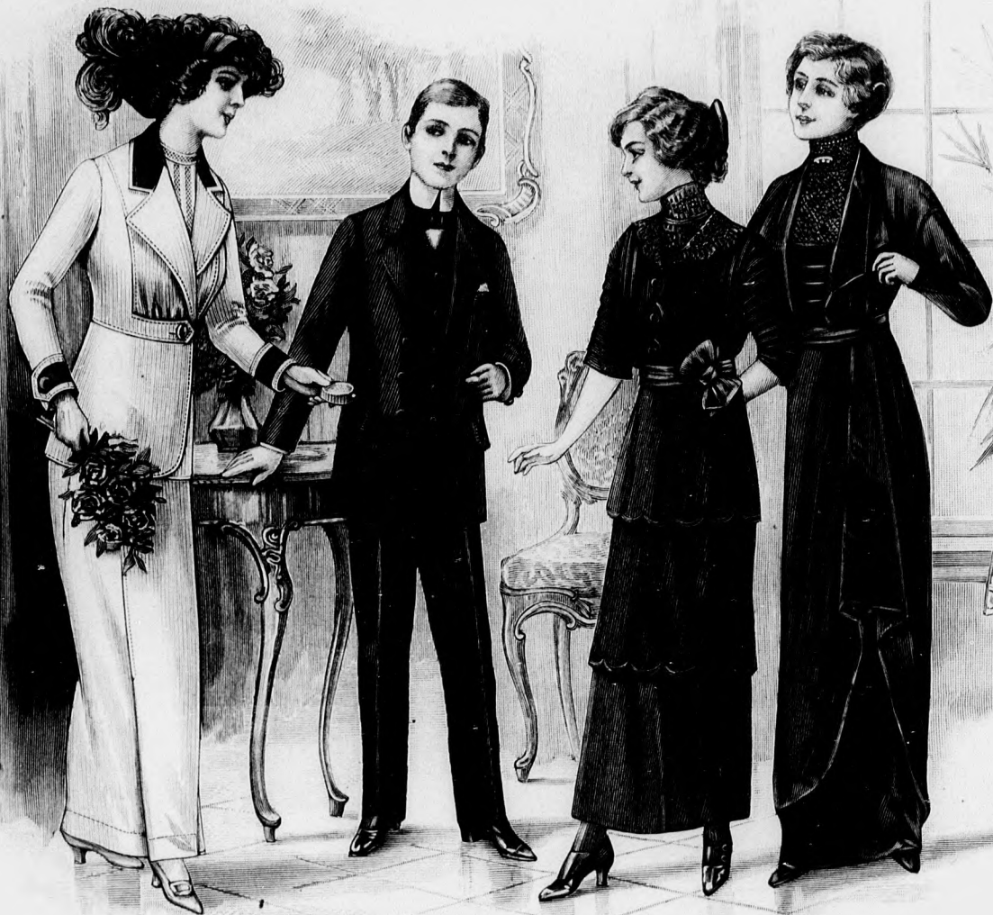
Kész szabás szám 8715. I. és II. nagyságban kapható. 77. sz. Csinos öltözék fiatal hölgynek. Ehhez 83. sz.