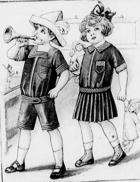
Kész szabás szám 8687. és 8688. 4-6 és 6-8 évesnek. 28-29. sz. Játsszóruhák 2-4 éves gyermekeknek. Szab. és magy.: mintáiv 23. XVII. és XVIII. sz. 99-104. fig.

tűzés alatt a lent lekerekített széleire keskeny szövetesikot tűzünk. A bal lapnak hátsó túlerő szélét egy rácba is tűzzük s itt kapcsoljuk. Az új bluzszerű kabát haránt és függőlegesen is ketté van osztva. A pánttal határolt ujjakat az oldal részekből szabjuk. A szegély alatt feltűzött ujjakat szintén függőlegesen osztjuk ketté és zsettgombokkal díszítjük. A