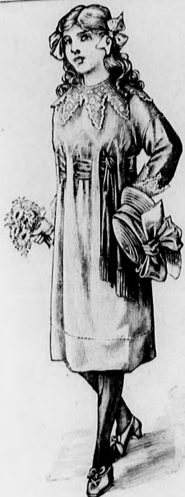
Kész szabás szám 8681. 4-6, 6-8 és 8-10 évesnek. 20. sz. Ünneplő ruha 8-10 éves leányoknak.

kis rajzon adott aláérő pántot szabjuk. Az előli széleket, a válltól kiinduló bevarrásokat figyelembe véve 18 cm. széles vászonnal és felsőszövettel béleljük és középen egysorosán egymásra gomboljuk. A lehajtott gallért az 5. fig. szerint felsőszövetből és vászonnál szabjuk és szám szerint felvarrjuk, azután szövettel borítva a hajtókával együtt kihajtjuk. A bal előli rész 12 cm. hosszú mellzsebe számára a finom duplavonal mentén