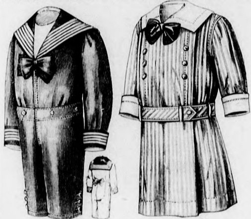
Kész szabás szám 8682. 4-6 és 6-8 évesnek. 25-25a. sz. Matrózöltöny körül felgombolt nadrággal 4-6 éves fiúknak. Szab., magy.: mintáiv 23. XXXII. sz., 194-202a. fig.

kis rajzon adott aláérő pántot szabjuk. Az előli széleket, a válltól kiinduló bevarrásokat figyelembe véve 18 cm. széles vászonnal és felsőszövettel béleljük és középen egysorosán egymásra gomboljuk. A lehajtott gallért az 5. fig. szerint felsőszövetből és vászonnál szabjuk és szám szerint felvarrjuk, azután szövettel borítva a hajtókával együtt kihajtjuk. A bal előli rész 12 cm. hosszú mellzsebe számára a finom duplavonal mentén