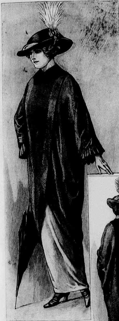
Kész szabás szám 8688. II. nagyságban kapható. 1-2. sz. Elegáns sétaköpeny háromnegyed hosszúságban, bő kimonó szabással. Ehhez a belső bodorresziet külön 27. sz.

A bluzt az 56-60. fig. szerint szabjuk. Az 56a. és b. fig.