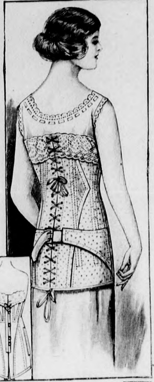
9-9a. sz. Vállfűző csipőpánttal kövérebb nőnek.

A blúzból és aljból álló, elől kapcsolt fehér pikéruhát a 36-43. fig. szerint szabjuk, a 36. fig. szerinti részt a kis rajz méretei szerint kiegészítve. Az elejét és hátát kereszt és pont szerint ráncokba tűzzük. A jobb előli szélre 5 cm. széles ráncot tűzünk. A hátrész derékába rajz szerint húzókorcot varrunk. A 38. fig. szerinti ujjakat az alsó szélükön jelzés szerint ráncokba tűzzük és 22 cm. bőségre behúzzuk. A hasítékot a dupla vonal mentén dolgozzuk ki, amelynek előli széleit csupán keskenyen szegjük be, a hasíték hátsó szélére pedig egy 2 cm. széles pántszerű, túlerő csíkot tűzünk. A 8 cm. széles kézelőt szegélyekbe varrjuk. A 39. fig. szerinti gallérfogalót gomblyukakkal látjuk el, a 40. fig. szerint szabott állógallér felgombolhatása miatt, amelyet a függőleges vonalak között szintén szegélyek díszítenek, amelyek számára a szövetsét külön számítjuk. Ezenkívül keskeny mosható lehajtott gallért is félcelünk a foglalóra. Az elől kapcsolt aljat a