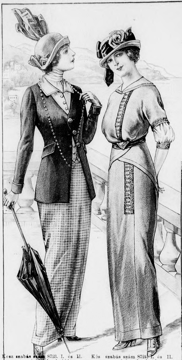
Kész szabás szám 8723. I. és II. nagyságban kapható. 92. sz. Csinos öltözék, szürke-fekete kockás alj és feketés-zöld posztókabát; fehér mellényel. Ehhez 95. sz. Kész szabás szám 8724. I. és II. nagyságban kapható. 93. sz. Ruha divatos csarppal. Ehhez 42. sz.

hosszu, 100 cm. széles voál; 250 cm. hosszú, cm. széles szélpánt 7/8 m. hosszú, 45 cm. széles selyem; 1/4 m. hosszú grelós rojt. A piskótaszínű kreppruhát tarka, készen kapható szélpánt díszíti gép- és sujtáshimzészéből. Az aljat és derekat elől himzett szélpánt díszíti. A derék kimonószabású. A felsőszövet matrozgallért kissé kisebb hasonló alaku fehér voálgallér borítja. Az utóbbihoz hasonlóak a kicsi újdudorok, amelyeket szélpántból való foglaló határol. A ráncolt selyemövet elől szélpántból való háromszög díszíti. A sima előli aljrészeket elől egymást borító csipőpántrészek egészítik ki, míg a hátsó lapokat kissé behuzzuk. Ezeket az övnél kezdődő szabad csomóba kötött fésarp fogja át. A végét selyemgreló díszíti. A derekat elől, az aljat hátul kapcsoljuk.