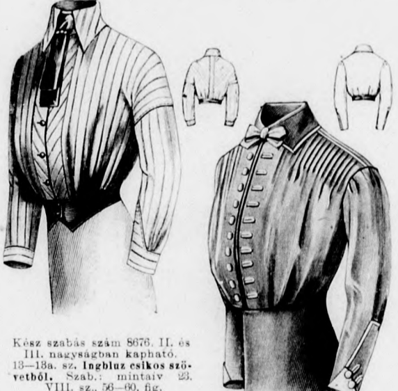
Kész szabás szám 8676. II. és III. nagyságban kapható. 13-13a. sz. Ingblúz csikos szövetsből. Szab.: mintaiv 23. VIII. sz. 56-60. fig.

12. sz. Az 51. sz. Öltözék ruhája külön.