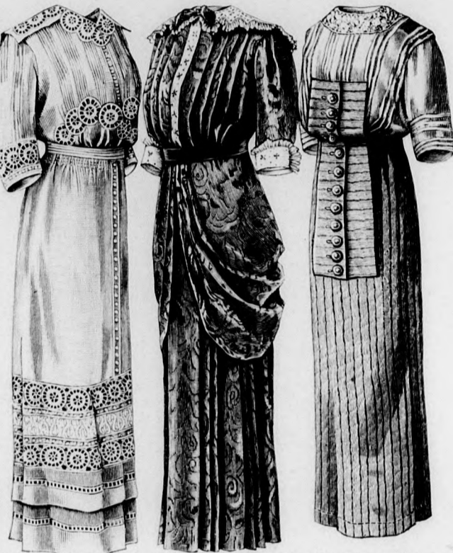
Kész szabás szám 8673. I. és II. nagyságban kapható.

A blúzból és aljból álló, elől kapcsolt fehér pikéruhát a 36-43. fig. szerint szabjuk, a 36. fig. szerinti részt a kis rajz méretei szerint kiegészítve. Az elejét és hátát kereszt és pont szerint ráncokba tűzzük. A jobb előli szélre 5 cm. széles ráncot tűzünk. A hátrész derékába rajz szerint húzókorcot varrunk. A 38. fig. szerinti ujjakat az alsó szélükön jelzés szerint ráncokba tűzzük és 22 cm. bőségre behúzzuk. A hasítékot a dupla vonal mentén dolgozzuk ki, amelynek előli széleit csupán keskenyen szegjük be, a hasíték hátsó szélére pedig egy 2 cm. széles pántszerű, túlerő csíkot tűzünk. A 8 cm. széles kézelőt szegélyekbe varrjuk. A 39. fig. szerinti gallérfogalót gomblyukakkal látjuk el, a 40. fig. szerint szabott állógallér felgombolhatása miatt, amelyet a függőleges vonalak között szintén szegélyek díszítenek, amelyek számára a szövetsét külön számítjuk. Ezenkívül keskeny mosható lehajtott gallért is félcelünk a foglalóra. Az elől kapcsolt aljat a