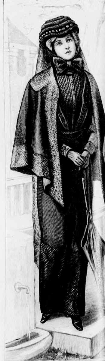
Kész szabás szám 8096. a ruha, 8897. a gallér, III. és IV. nagyságban kapható. 46a-c. sz. Gyászruha kövérebb és idősebb nők; gallér és kalap. Ehhez 81a-81c. sz.

A csinos öltözk. kekeszürke popl., hasonló frízaljból és sötétkék poplénkabátból. Az öltözk. juk. A blúzának a 129a. és b. fig. szerinti belső vonala mentén, E-től F-ig egyesítjük, előrajzolt v. előtt, 5 cm-nyi közökben három 1 cm-es szegély zúnik le. Az ujjak széleit hasonlóképeszövetet a adva. A vállpántot a 128. fig. szerinti betétekből. A 130. fig. szerinti csikos frízéből való részt könnyű ellátva, szám szerint a blúza varrjuk szabadon a rint szabott aljra fektetve. A 131. fig. szerinti előli le. A 132. fig. szerinti hátsó lapot tűzzük fel. A 133-138. fig. szerinti szabott kabát hátsó lapját a kis rajz szerint egészítjük ki, a hosszát deréktól mérve. Az előli rész méretei a kis rajz szerint egyesítjük. A lebbenyrészt a derék fogva, az előli és hátrészen előrajzolt ujjak között behúzzuk. Az ujjakat 14 tel rövidített rinti hajtókaival díszítjük. A 137. fig. szerinti alakban a közbéllel ellátott, a hajtás vonalán kihajtott gombdíszít kép szerint varrjuk fel. A 138. fig. szerinti