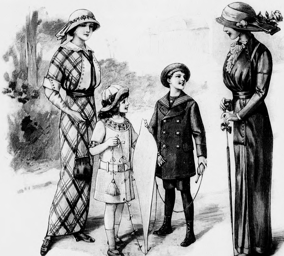
Kész szabás szám 8722. I. és II. nagyságban kapható. 91. sz. Selyemruha csipkezsabóval. Ehhez 80. sz.

részét szegéllyel az alsóra tűzzük. Az aljnak jobb lapját elől fönt, túléző szélel a balra tűzzük. Ez alatt a jobb lapot szegély szélesen haránt feltűzzük és függőleges ráncokba vasaljuk, itt a bal lapnak letűzött szélét a jobbra fektetjük; a folsó gombolás hamis. Hátul a ráncolt öv alá rövid esarpot erősítünk, amelyet duplán összehajtunk és lilán szegélyezünk. Az övnek legyezőszerűen ráncolt végét lila selyempánt díszíti. A ruhát gyapjupoplénból, gyapjukreppből, bársonyból vagy posztóból is szabhatjuk. Az állógallért túllbetéttől készítjük.