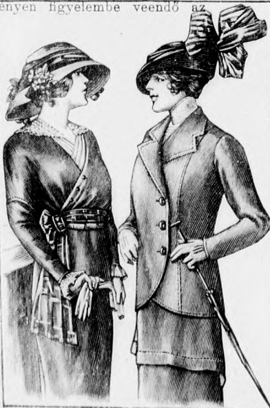
Kész szabás szám 8090. I. és II. nagyságban kapható. 40. sz. A 41. számú látogatórúha dereka külön.

posztóból készülnek. A gallért és a kabát pántjait aranybarna, közepeskék és vörös pamuthímzés díszíti. Az alját a kis rajz 147-150. fig. szerint szabjuk. A 148. fig. szerinti bal előli lapot kereszt és pont szerint ráncba rakjuk és vonaljelzés szerint alátűzzük a 149. fig. szerinti kiegészítőrésszt. A 147. fig. szerinti jobb előli lapot vonal és betűjelzés szerint tűzzük fel. A 150. fig. szerinti hátsó lapot egyszerűen varrjuk fel. Az alj felső szélét bevarrások és állóránccok szűkítik. A 7 cm. széles övet hátul 16 cm. hosszú himzett pánt díszíti. A 151-155. fig. szerint szabott kabát hátát a kis rajz szerint egészítjük ki, a hosszát deréktől mérve. A 152. fig. szerinti szabott előli részt jelzés szerint behúzzuk és a 153. fig. szerinti szabott részre varrjuk. A 154. fig. szerint, a derék vonalát figyelembe véve szabott lebbenyrész kis pánttal a hátrésze nyúlik. A 151. fig. szerinti mellényen figyelembe veendő az