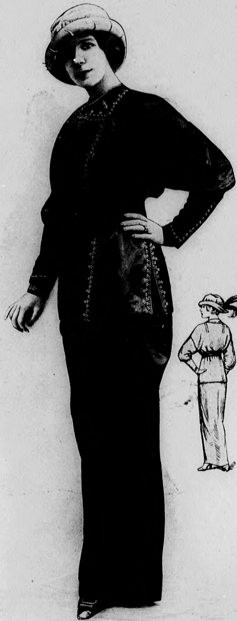
Kész szabás szám 8689. I. és II. nagyságban kapható. 3-3a. sz. Legujabb szabásu ruha könnyű és szép himzéssel.

Szabásminták megrendelése közvetlenül a Divat Ujság kiadóhivatalába kell címezni: VIII., Rökk Szilárd-u. 4.