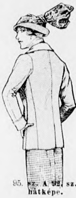
95. sz. A 92. sz. hátkepe.