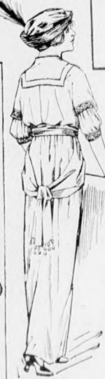
42. sz. A 93. sz. hátképe.