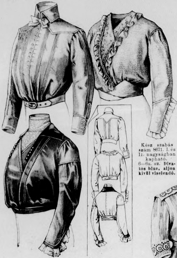
Kész szabás szám 8671. I. és II. nagyságban kapható. 6-8a. sz. Divatos blúz, aljlon kívül viselendő.