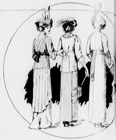
34-35. sz. A 49., 51. és 53. szám hátképe.

részen a kimonórész is, amely előli és hátul, a fehérpetyves túllbetétek fölött egymást borítják. Ehhez hasonló az állógallér. Az ujjakat hajtóka és gomb díszíti. A vöröses lila szalag-övet csinos csokor díszíti.