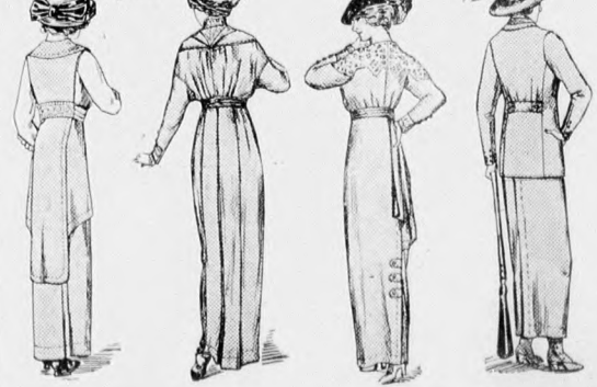
54-57. sz. A 32., 33., 52. és 94. sz. hátképe.

Az ujjakat a 209. fig. szerint szabjuk, amelyeknek hasítékát, valamint az ing oldalsó 20 cm. hosszú hasítékát is ékkel biztosítjuk.