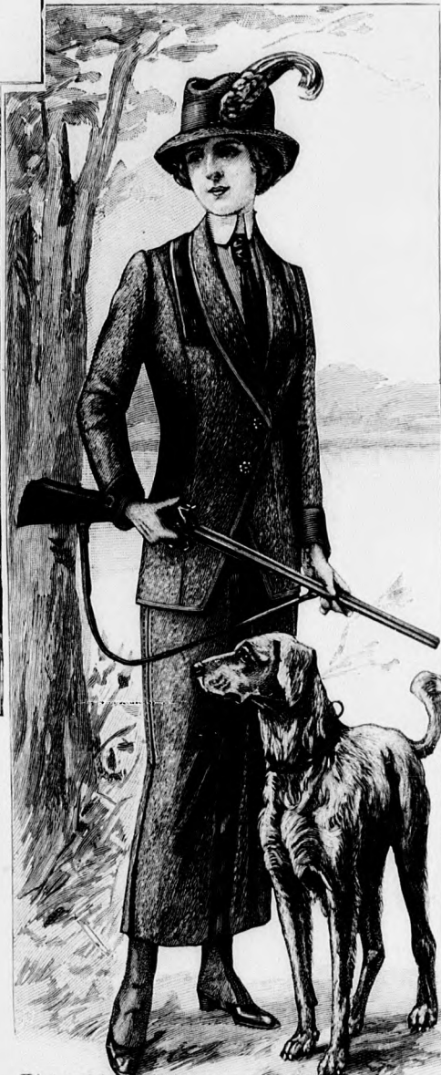
Kész szabás szám 8725. I. és II. nagyságban kapható. 94. sz. Sportruha bőrdíszszel. Ehhez 57. sz. Szab.: mintáiv 23. XXVIII. sz., 163-172. fig.

Az aljat a kis rajz 163-165. fig. szerint szabjuk. Az előli lapot vonaljelzés és kereszt és pont szerint mindkét felén végig letűzött ráncba rakjuk és a lapot a ráncok között bőresikkal díszítjük. Az előli és hátsó lap között lefelé két szemközt fektetett ráncot rakunk. A jobb hátsó lapot fönt túlérő széllel a középső vonal szerint a balra tűzzük; lent a hajtás vonala mentén mély ráncba hajtjuk ki, amelynek a hajtását erősen levasaljuk. Az alj felső szélét 4 cm. széles lénzőre tűzzük. A kabátnak első és második, a 166. és 167. fig. szerint szabott részei a kis rajz méretei szerint kiegészítjük, a hosszát derektól mérve. A 169. fig. szerinti hátrészt az alsó szélén egy-két ráncba rakjuk. A 170. fig. szerinti lebben felvarrását a 171. fig. szerinti bőrrrel kivarrt öv takarja, amelyet az oldalsó hát- és lebbenrész varrása közé foglalunk. A kabátot elől fönt, teljes szélességében, lent az első előlirész szélességében lágy vászonnal béleljük, azután kidolgozzuk a bevarrást és a 172. fig. szerint csupán vászomból szabott, szövettel bélelt lehajtott gallért varrjuk fel. A gallért és előlirészt válgallérszerűen kihajtjuk és a