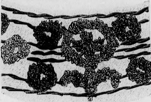
21. sz. A 80. szám himzésrészelete természetes nagyságban.

Anyag: 3 1/2 m. hosszú, 130 cm. széles frizé; 4 drb gomb. A kabátot az 1-5. fig. szerint homokszínű tehercsikos frizéből szabjuk. Az 1. és 2. fig. szerint szabott részeket szabás előtt a kis rajz méretei szerint kiegészítjük a hosszát a deréktól mérve. A hátsó varrás alsó hasitéka számára a bal hátsó részből a