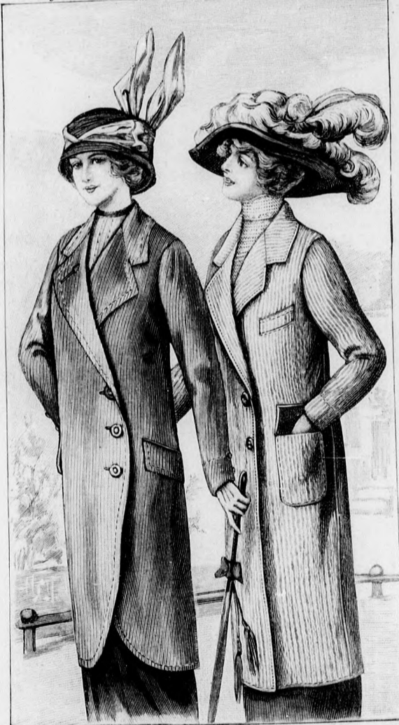
Kész szabás szám 8689. I. és II. nagyságban kapható. 30. sz. szikabát háromnegyed hosszúságban lekerekített előlőrészszel. Szab., magy.: mintáiv 23. XXI. sz., 115-117. fig.