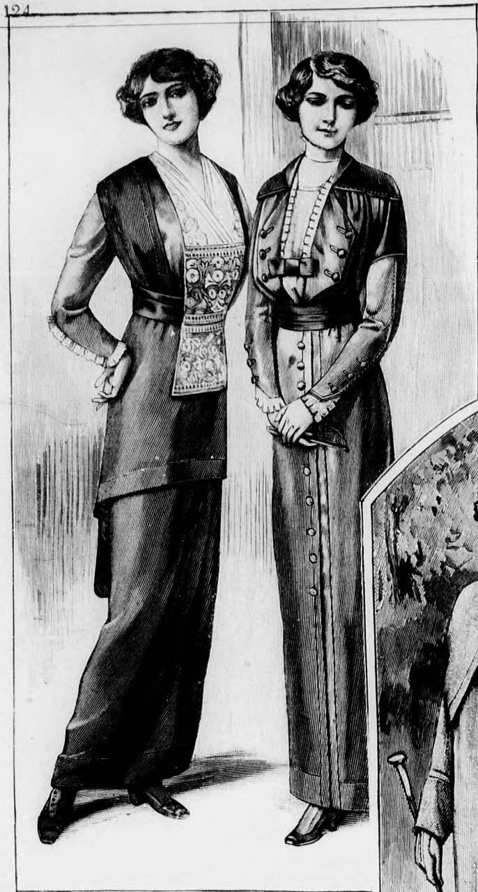
Kész szabás szám 8091. II. nagyságban kapható. 32. sz. Elegáns ruha tarkán himzett betétréssel, a 41. számú kabát egészíti ki.