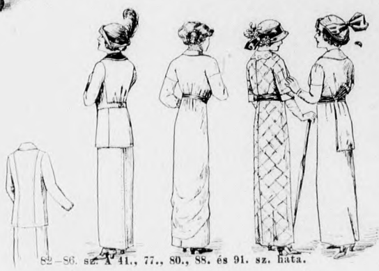
82-88. sz. A 41., 77., 80., 88. és 91. sz. háta.

Anyag: 4 m. hosszú, 110 cm. széles krepp; 1/2 m.