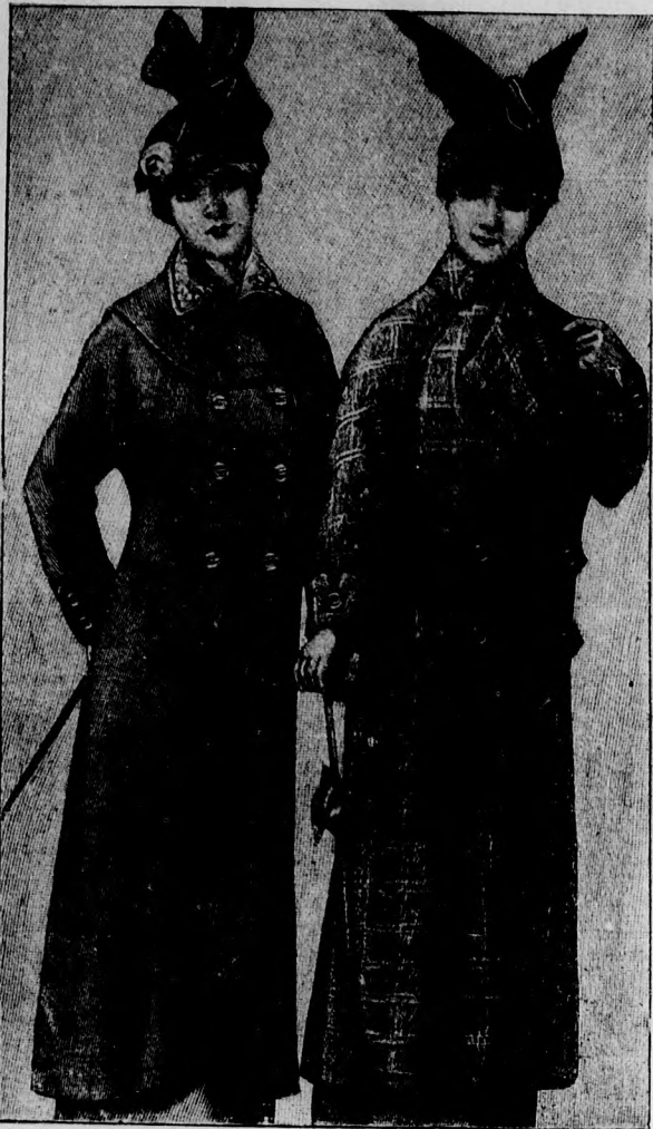
8. sz. Háromnegyedhosszú kabát, 4. sz. Háromnegyedhosszú kabát hosszszabott ujjakkal. egyenes derékkal.

Például babérvöld, Hötendorf-kék és fácánbarna. Ezek a színek talán népszerűek lesznek egykoron, egyelőre azonban a fehér-fekete színkultusz lesz az uralkodó, mint azt az előjelek sejtetnek engedik. Pamutbársony, selyembársony, siffonbársony, moaré, a bársonydivatnak ezek képezik az alapjait és pedig egy hosszú kabát formájában, amely selyemmel, csipkével és gazeval van díszítve. A kalap is fekete bársony lesz jobbra. Bársonymez vagy szörme, amelyre kevés fehér toll kerül és színes, élénk szalag.