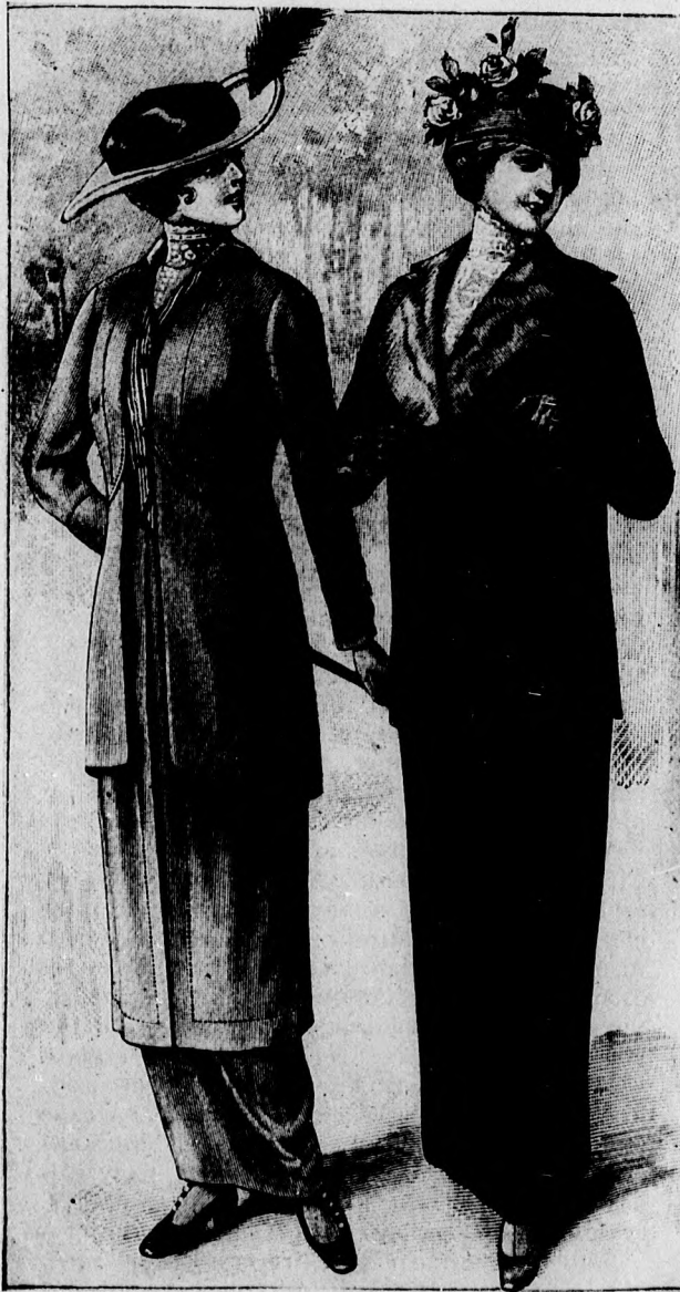
1. sz. Kabátkosztüm hosszíműlő formában. Erősebb hölgyek számára.

de népszerűsége elterjedt Berlinbe is, sőt már a budapesti kirakatokban is látjuk a katonablúzok sokféle változatú kedves és fess mintáit.