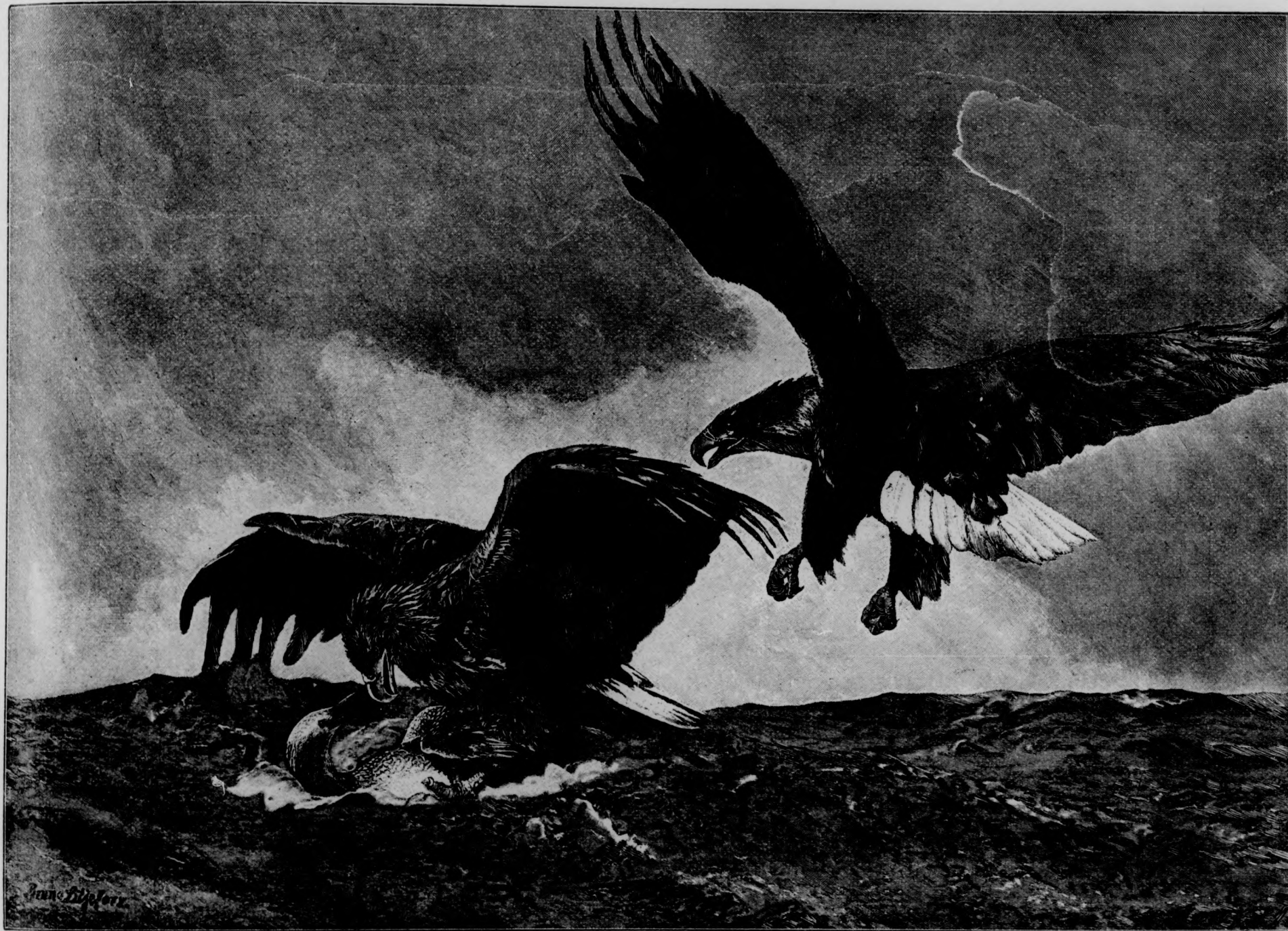
Harc a tengeren.

— Légy üdvözölve, testvérem — mondá a nép fia és illedelmesen felemelkedett ülőhelyéből, amint az idegent megpillantotta — ülj ide mellém, mert ime, megfelezem veled szegényes vacsorámat!