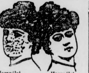
Használat előtt. Használat után.