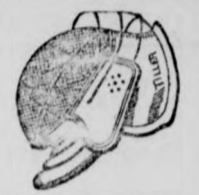
Vivó- és párbaj-szerkeket: kardok 4-6-8 kor., álcák 5-8-12 kor., keztyűk 2-3-4 kor.,