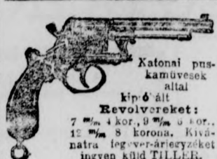
Katonai puska-művesek által készített Revolvereket: 7 mm 4 kor., 9 mm 6 kor., 12 mm 8 korona. Kivá-natra legver-arjegyzéket ingyen küld TILLER.

császári és királyi udvari szállítók. Magyarország első egyenruha készítő intézete BUDAPESTEN, Váci-utca 35. szám alatt.