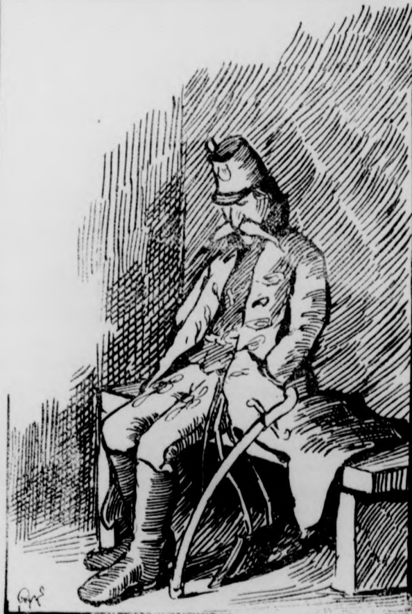
„Két fülére huzta a köpönyege gallérját... azután... elszenderedett.”

Hideg deczemberi éjszaka volt. A vármegyeház előtt, fönt a vár nagy, széles utcáján, a fény föl előretörő zivatar végig sivitott, hatalmasan megrázva az évszázadok előtt épült emeletes házak, főpapi paloták ablakait, erős tölgyfa-kapuit, úgy, hogy egyegy nagyobb rohamnál csörömpölve zuzódtak össze az utcai lámpások üvegtáblái. A megyeház melletti nagy sárgaépület alsó, vasrácsos ablakai mögöl, hol az elmebetegek azilluma volt, kísérteties halotti énekkordjajai vegyültek bele az orkán félemeletes zúgásába. Lent a vármegyeház mélyén, a földbenyuló börtön kazamatái előtt a fegyveres örök egyhangu kopogása hallatszott, fönt az utcai főépület pénztár-szobája előtt pedig Dömötör János megyehuszárr állt őrt, mérte a két lámpástól félhomályban maradt ambitust lépteivel, ameddig meg nem unta ezt a mulatságot és le nem ült a sarokba.