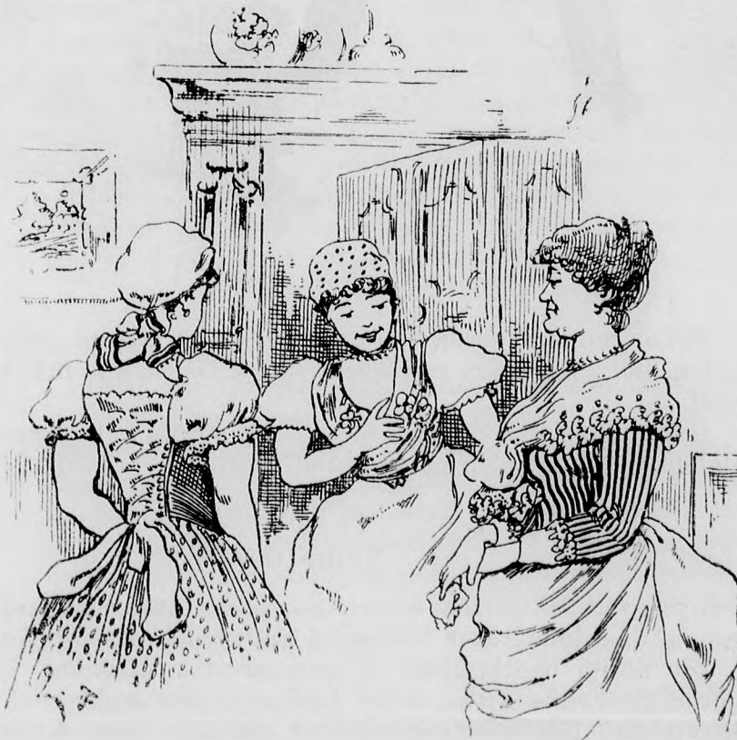
Két szolgálója volt a nagyságos asszonynak. Kérdi az egyiktől: