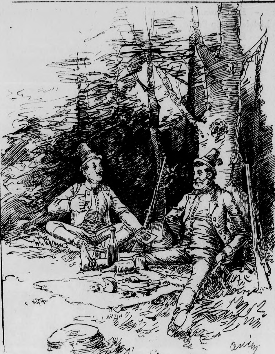
I. koczaradász. De már csak nem olyan rossz ez a kép!?

II. koczaradász. Épen úgy vagy eltalálva, mint az a nyúl, a melyre imént rá lőttél.