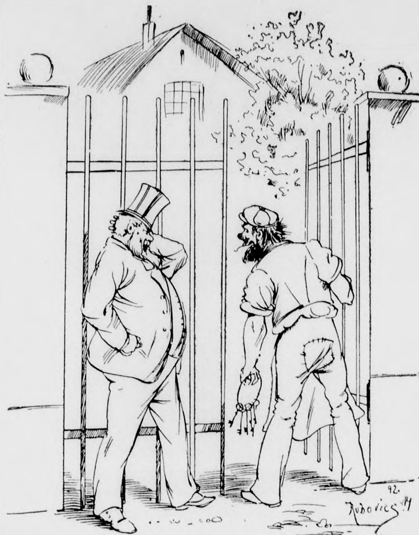
«Mást tegyen bolonddá! hisz be sincsen zárva! — Lakatos rá mordul, — az én időm drága!»