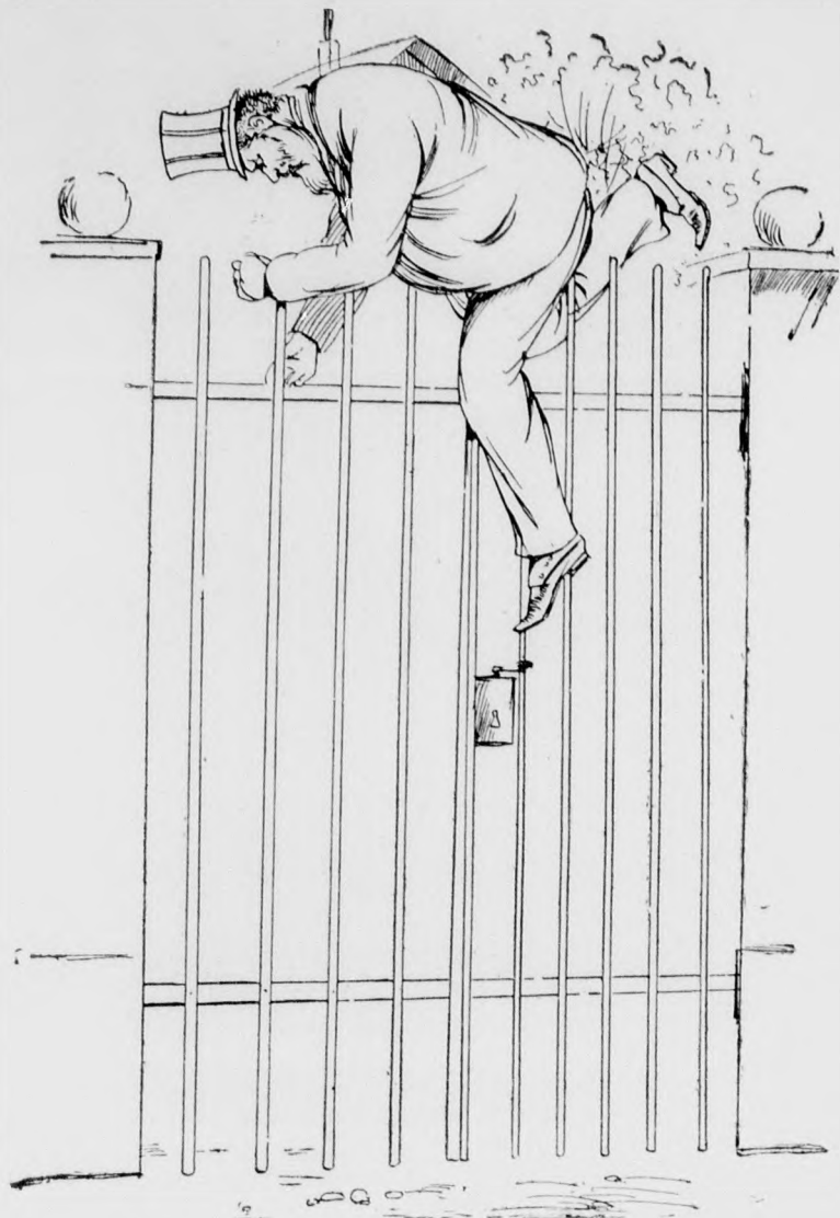
Reggel Véső újra csak felkapaszkodott, Ajtónyitó próba eszébe se jutott.