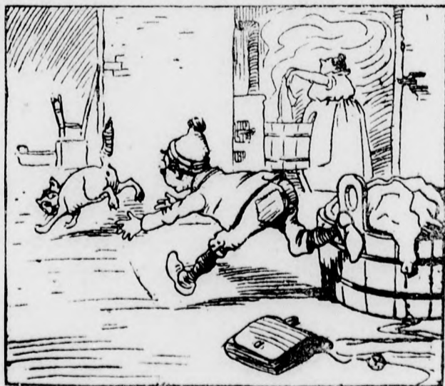
Gyorsan czicza után ered, S elfogja mint egy egeret.