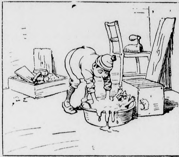
Keményítő s tálba teszi S benne jól meghengergeti.