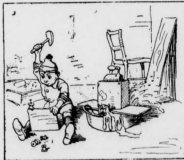
Fúr, farag és kalapálgat, Miglen nyélbe üt egy talpat.