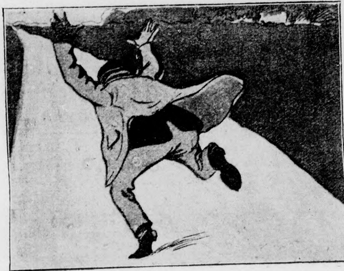
— Segitség Segitség!