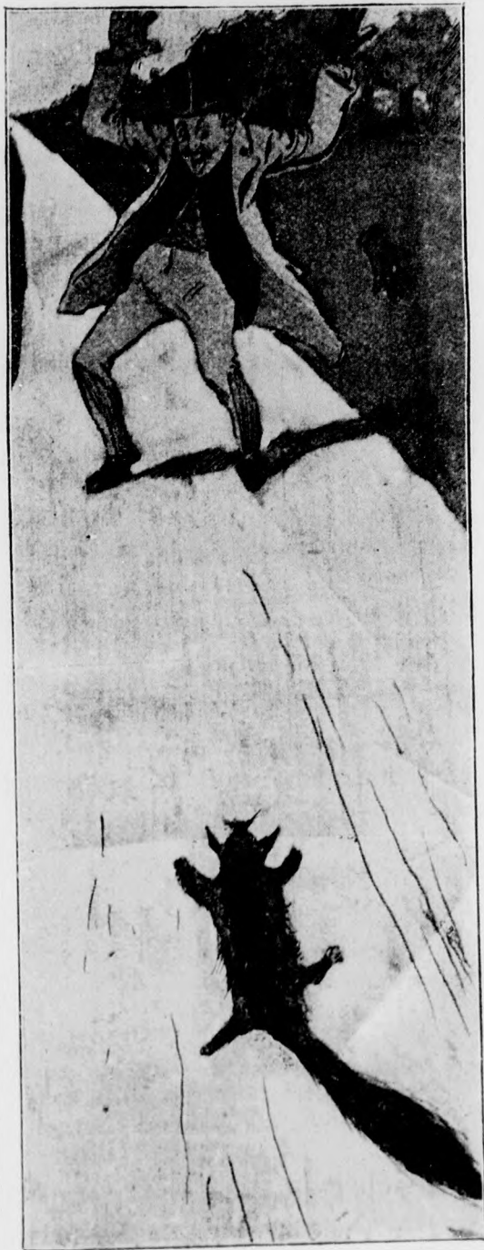
— Szent Isten! Egy róka!