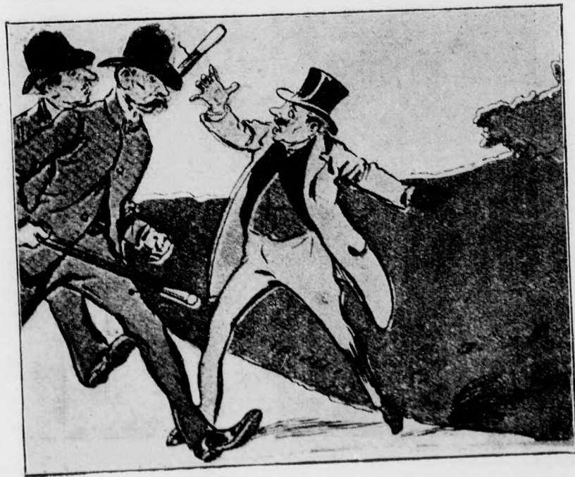
— Emberek! Egy vérengző vadállat állja el az utat!