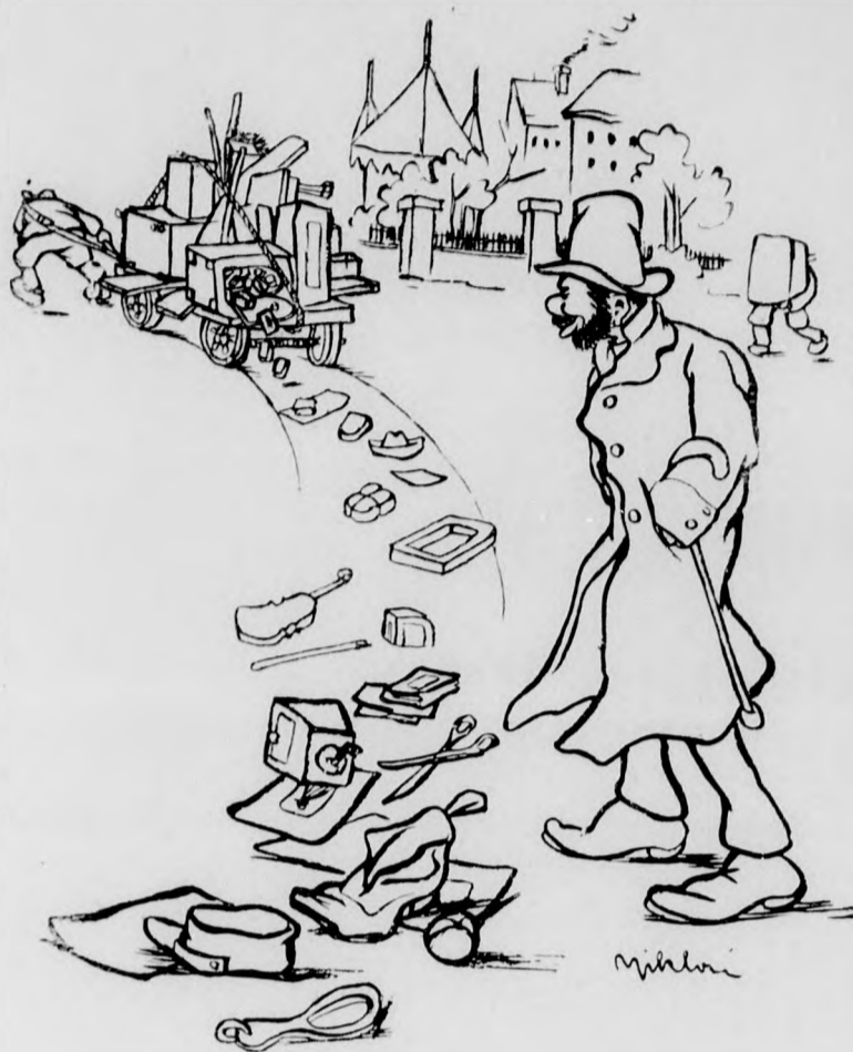
Koffer tartalma kipotyog, Oh mi kedves, drága nyomok!