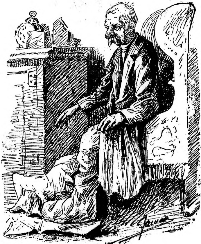
La 50 ani.