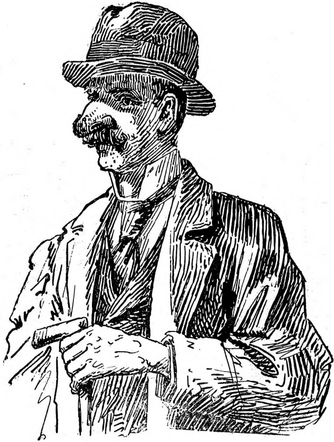
La 30 ani.