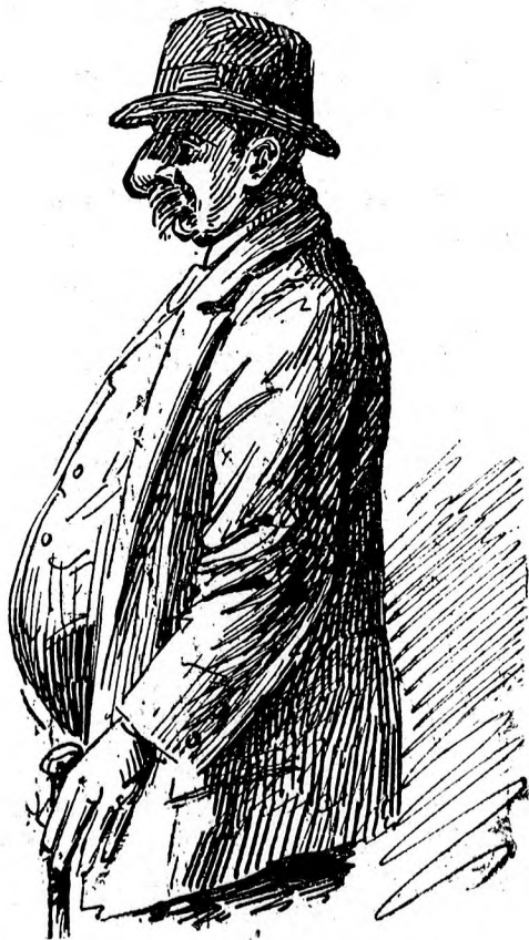
La 40 ani.