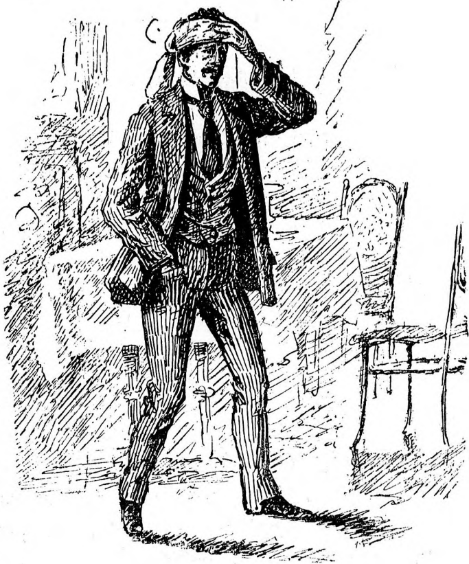
La 20 ani.